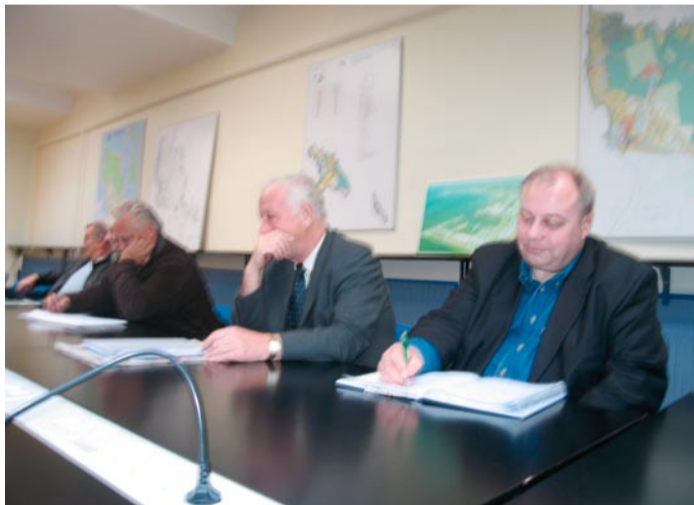
Huvilised arengukava avalikul arutelul küsimusi esitamas.