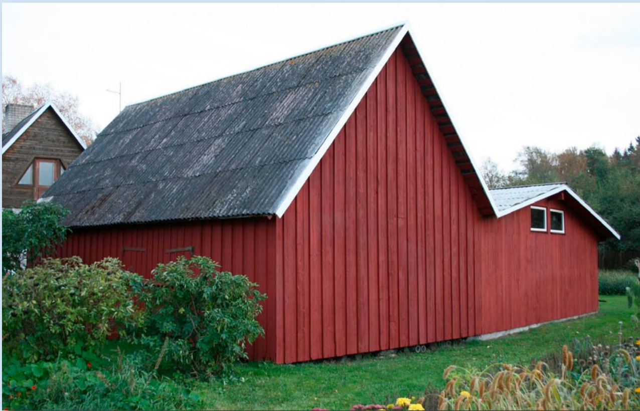
Nüüd: Vinnuniidi talu küün sügisel, pärast värvimist.

Tänase lehenäitusega vaatame hoopiski, kuidas taastada seda, mis oli enne, ehk õpime väheke restaureerimist.