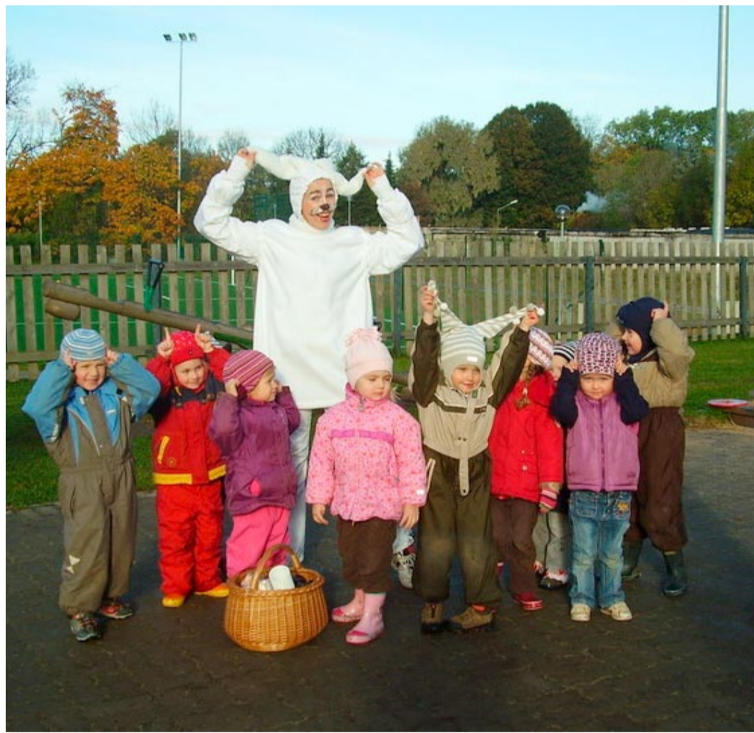
Randvere lasteaias lapsed koos Lõbusa Jänesega.

lehel, kuidas muutub südame rütm, kui seisame, kõnnime, jookseme. Proovisime kokku panna inimulaaži ja uurisime rusika suurust, sest täpselt nii suur, kui on sinu rusikas, on ka sinu süda. Isad-emad said koju lugemismaterjali energiajookides sisalduvate vererõhku tõstvate toimeainete ning südant piitsutavate riskifaktorite kohta.