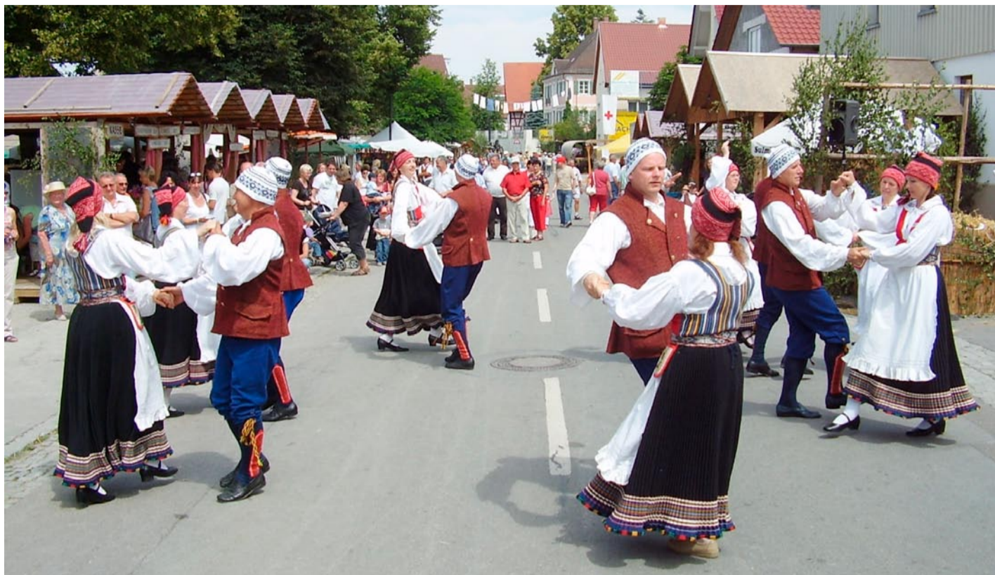
Tantsu löödi otse külatänaval.

Kolmanda päeva pärastlõunaks jõudis Sulmingeni, mis asub Lõuna-Saksamaal mõnikümme kilomeetrit Ulmi linnast lõunas. Tantsijad matustasid perekonnad Sulmingenis ja selle ümbruskonnas. Festival kestis terve nädalavahetuse. Vestlustest kohalike inimestega selgus, et festivali toimumiseks andis ühel või teisel moel oma panuse peaaegu kogu Sulmingeni elanikkond, keda kokku on umbes seitsesada inimest. Sulmingeni ajaloost nii palju, et seda on esi-