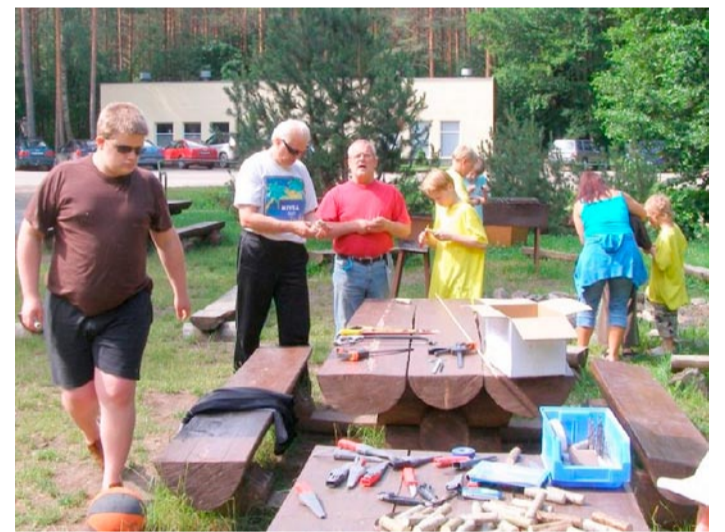
Laagris käis vilgas tegutsemine.

suhtumise eest meie erilistes lastes! Viibides lastega suvel Ukrainas, saime nii mõnigikord tunda meil juba ununema hakavat nõukogudeaegset taunivat suhtumist erivajadusega inimestesse. Täname veel kord kõiki sõbralikke ja toetavaid Viimsi valla elanikke! Aitäh ka teile, Lions Club Viimsi.