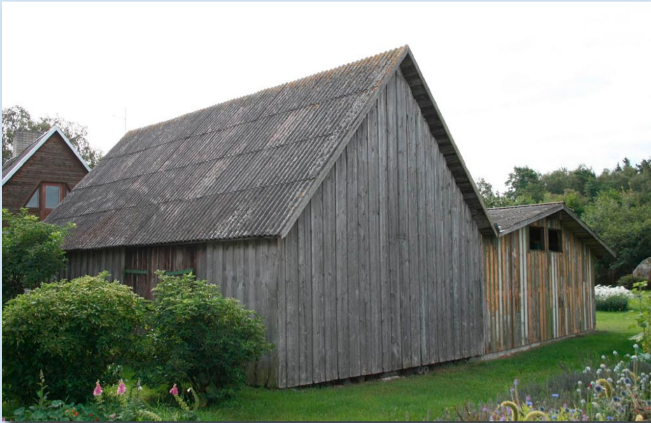
Enne: Vinnuniidi talu küün suvel, enne värvimist.