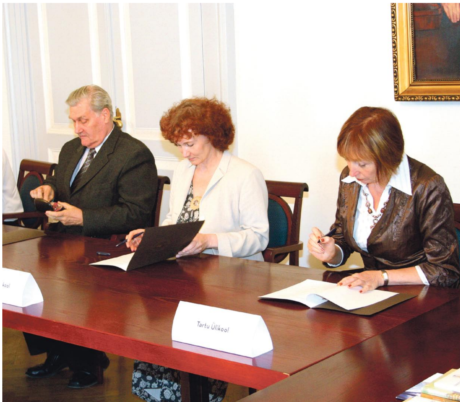
Ajalooline hetk – koostöö nurgakivi.