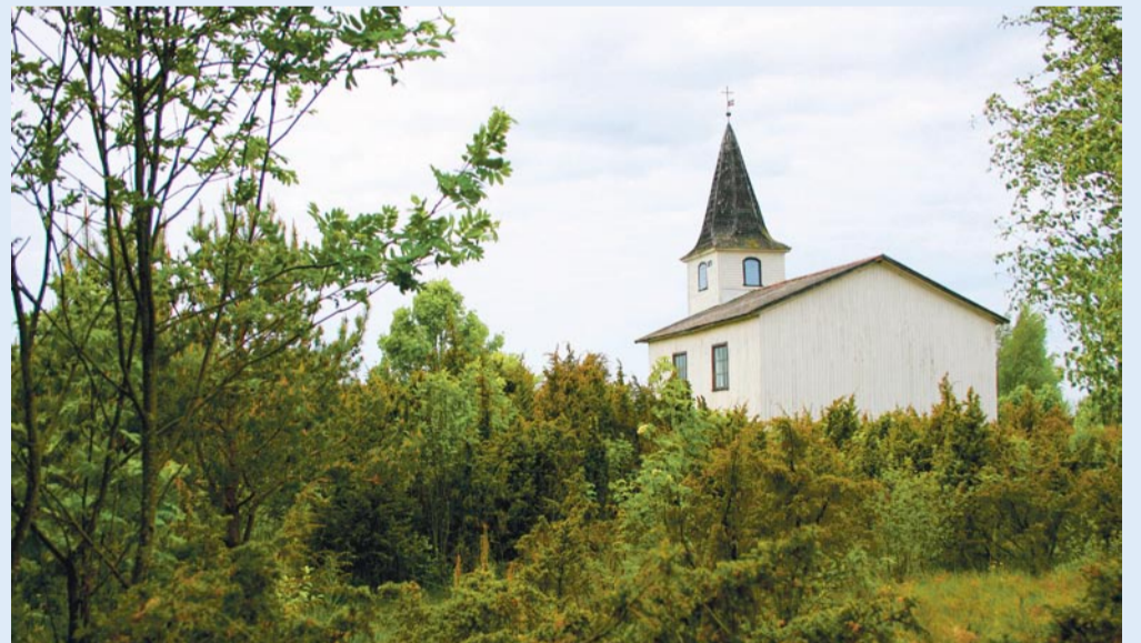
Nüüd: Prangli kabel 2008. aastal, A. Miku foto.

Prangli kabel seisab oma praegusel kohal 1847. aastast. Tuulelipul olev „1860” tähistab hoone remondiaega. 19. sajandi esimesel poolel oli saare kirdeosas seisnud vana kabel lagunenud ja jumalateenistusi peeti talutoas. Jõelähtme pastor Schüdlöffel võttis südameasjaks Prangli rahvale pühakoda ehitada ja hakkas selleks raha koguma. Raha kogunes aeglaselt, kuid kirik kerkis kiiresti: