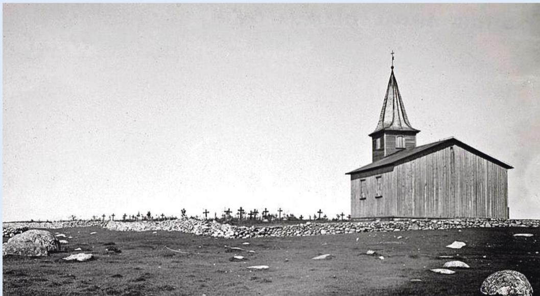
Enne: Prangli kabel 1922. aastal, E. Wittoff (Eesti rahva muuseumi fotokogu).