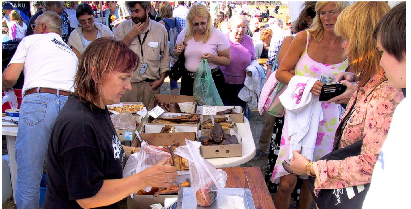
Kalakauplemine on põnev nii müüjale kui ostjale.