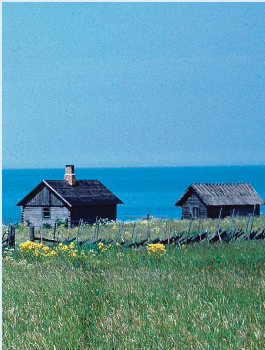
Enne: vaade Krügeri kalurielamule ja võrgukuuridele 1980. aastate keskel.

Juunikuu on jaanikuu. Iidsete traditsioonide kohaselt süttivad iga aasta 23. juunil peredes jaanilõkked. Nii ka Viimsis, kus vallarahvas on harjunud kokku saama Pringi külas asuva Kingu rannatalu õuel. Seekordsel lehenäitusel peatumegi hetkeks Kingu talu juures ja vaatame veidi ringi.