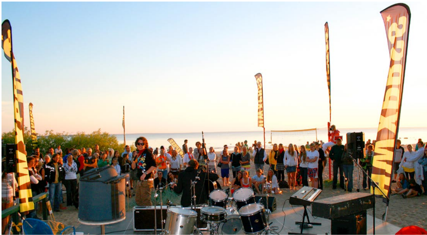
Õhtune kontsert oli igati vahva.