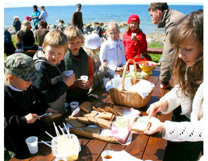
Värske leib Silberfeldti kalurielamu leivaahjust, mis „maitseb peaaegu niisama hästi kui Tallinna peenleib”.