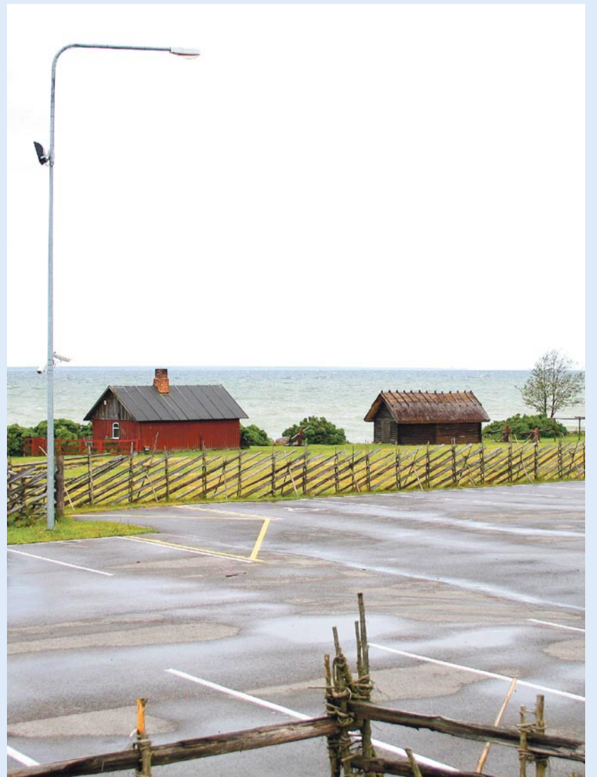
Nüüd: vaade Krügeri kalurielamule ja võrgukuuridele 2008. aastal.

Üldistus tuues saab vabaõhumuuseumi 28 tegevusaastat jaotada kahe peremehe ajastuks: kolhoosi- ja vallaeg. Muuseumitalu peab juba teine põlvkond ja selle lühikese aja jooksul on peremees ehitanud uue roigasaia, pannud hoonetele roo- ja laastukatused ning vahetanud palke. Ka maastikupildis võib märgata suuri erinevusi: muuseumiesistele heinamaadele on ehitatud moodne autoparkla ning hoovis kasvab heina asemel muru – vikat on asendunud niiduki ja trimmeriga