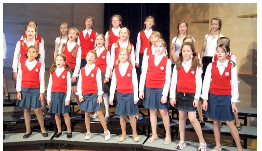
Esinemine on kätte jõudnud.

Helsingis astusime laeva, mis oli liinil alles esimest päeva. Kuna olime reisist üpriski väsinud, oli sõit meile nagu kingitus. Laev oli tõesti uhke! Kui kell oli juba südaööd lõõnud, jõudis reisiseltskond Tallinnasse. Õige