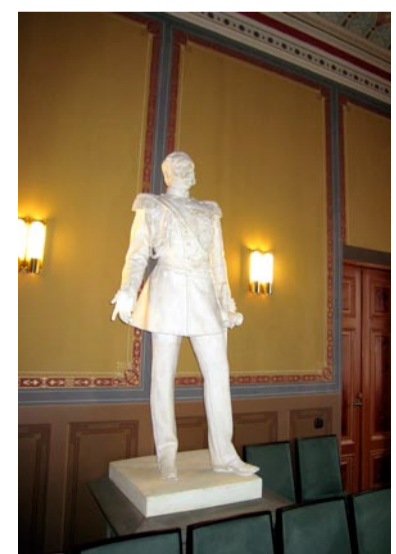
Porvoo linnavolikogu istungisaalis ei toimu veel tänapäevalgi midagi tsaar Aleksander I teadmata.

Selline hoolekanne läheb sõltuvalt abisaaja tervislikust olukorrast ja paljudest muudest asjaoludest Soome vallale maksma 1500 kuni 3000 Eesti krooni päevas (see teeb siis umbes 45 000–90 000 krooni kuus abisaaja kohta). Siit ka mõttepauk vallajuhtidele, kuidas edasi. Lahendust nähakse koduhoiu osatähtsuse olulisel suurendamises. Koduhoiu tähendab seda, et vanurit hoitakse, hooldatakse ja abistatakse tema enda kodus nii pikalt kui võimalik ja alles siis viiakse abisaaja kallist raha maksvasse sotsiaalkorterisse, vanadepodusse või hoopis hooldushaiglasse. Inimese kodus abistamine (koristamine, toidu valmistamine või toomine, ravimite andmine kuni riietamiseni välja) vastavate sotsiaaltöötajate poolt on vallale oluliselt odavam ja soome-ugri verd individuaalse eluhoiakuga inimestele ka hingeliselt vastuvõetavam. Seega nähakse Soomes edaspidi ette koduhoiu osalust kasvu ja vastavalt siis hoolekandeseadustesse inimeste hooldamise vajaduse vähenemist. Nime-tati ka Taani kogemust, kus vanadepodud oleval lausa seadusega