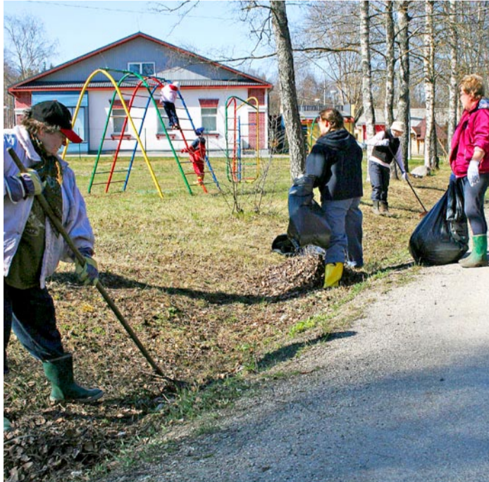
Mänguväljaku ja teeperve koristus

Talgud lõppesid sadamas. Külavanem oli katnud laua: söödi suppi ja suitsukala, nii nagu rannakülale kohane. Ilus ilm toetas külarahva ettevõtmisi. Kõik, kes kaasa löid, said