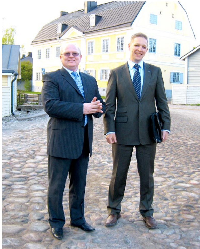
Porvoo linnapea ja Viimsi vallavanem. Taamal, kollases majas elas omal ajal linnapea vana-vana-vanaisa. Nüüd on see hoone Toomkiriku kasutuses.

Soome riigiõiguslikus ajaloos on Porvoos tähtis koht. Mäletatavasti aastatel 1808–1809 peetud Vene-Rootsi sõjas okupeerisid Vene väed Soome ning Hamina rahuga (17.09.1809) loovutas Rootsi Soome koos Ahvenamaaga Venemaa. Meenutagem, et Eesti oli selleks ajaks olnud tsaaririigi koosseisus juba sada aastat. Sõja ajal, 1809. aastal kogunes Porvoo toomkirikus Maapäev, kus osales ka Vene tsaar Aleksander I (oli Venemaa keiser 1801–1825). Tsaar kinnitas Soomes luteri usu, seni kehtinud Rootsi õigus- ja haldussüsteemi jätkumise ning ametliku keelena rootsi keele. Ühtlasi kuulutas tsaar Soome autonoomseks suurvürstiriigiks pealinnaga Turu. Seda sündmust tähistatakse Porvoos suurejooneliselt järgmisel aastal. Maapäeva 200. aastapäevaks avab taas ukseid ka 2006. aasta kevadel tulekahjus tublisti kannatada saanud Porvoo toomkirik. See autonoomiakogemus on aidanud soomlastel edaspidi rajada omariikluse vundamenti. Soovitan viimsilastel Porvoos igal juhul külastada ja kui varem ei õnnestu, siis kindlasti 2009. aasta juubeliürituste ajal.