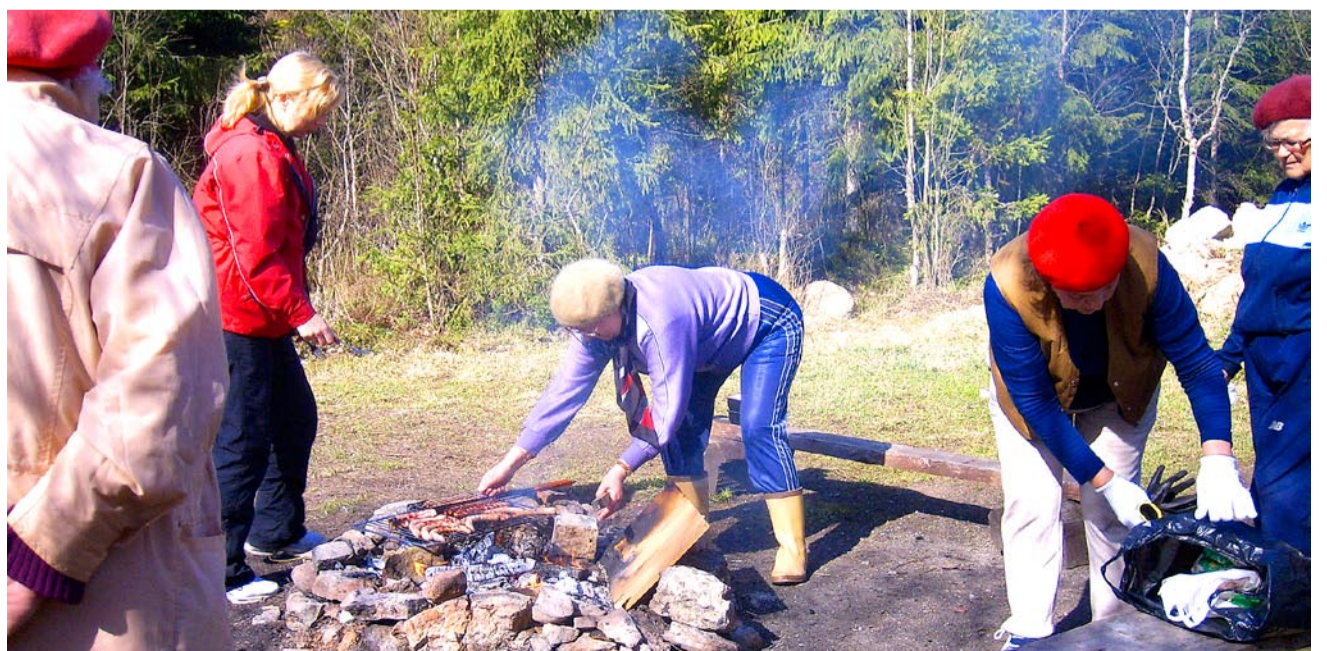
Talgutel oli abiks ka väike lõke.