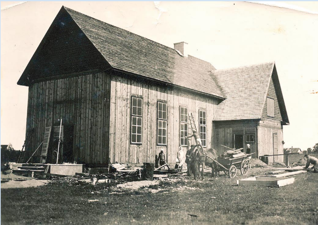
Enne: Vabakoguduse palvemaja 1937. aasta suvel, käimas on koristustööd.