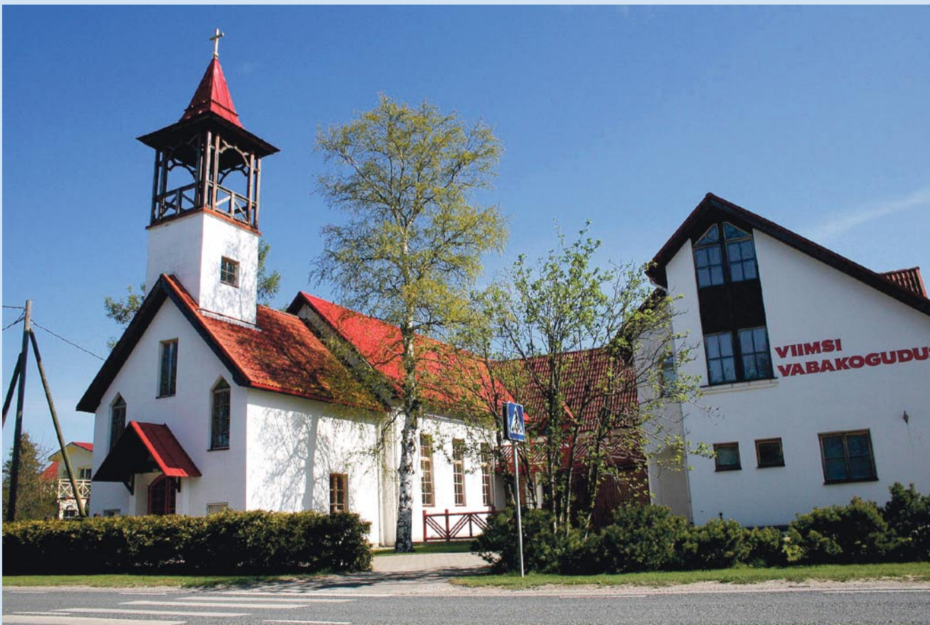
Nüüd: Vabakoguduse palvemaja 2008. aasta kevadel.