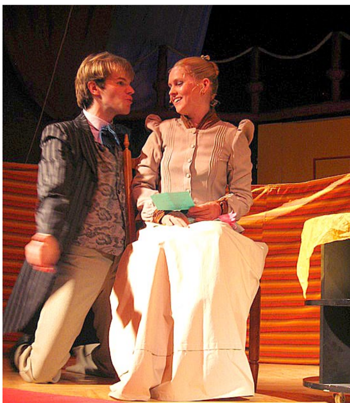
Üks klassikaline stseen

elu raputavasse sündmustikku huumoriga pigitud teksti saatel, siis A. Kallase „Patseba Saaremaal“ mõjus kui ängistav paljastus meie rahva tumedamalt ajaloo poolt, tekitades tõetruudusega tõelisi külma värinaid. Särtsakas ja hoogne „Barnum“ võlus oma värvikerava nooruslikkusega, erinedes teistest juba oma žanri tõttu (muusikal).