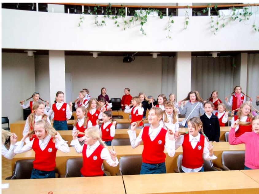
Vahepeal oli vaja ka harjutada.