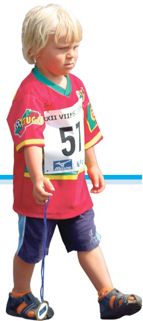
Fotoreportaaz Viimsi tervisepäevalt.