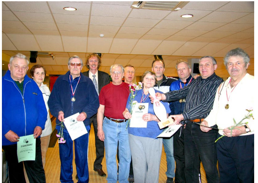
Röömsad pensionärid on tulnud bowlingut mängimast.

Midagi ei teki tühjale kohale ega arene iseenesest. Arenguks on vaja viljakat pinnast ja tegusaid eestvedajaid, kellel on soe süda ja loov tahe aidata ilma kasu saamata. VPÜ juhatus tänab oma volikogu ja juhatuse liikmeid. Tänaab kõiki toetajaid ja abistajaid: Viimsi vallavalvolikogu, Viimsi vallavalitsust,