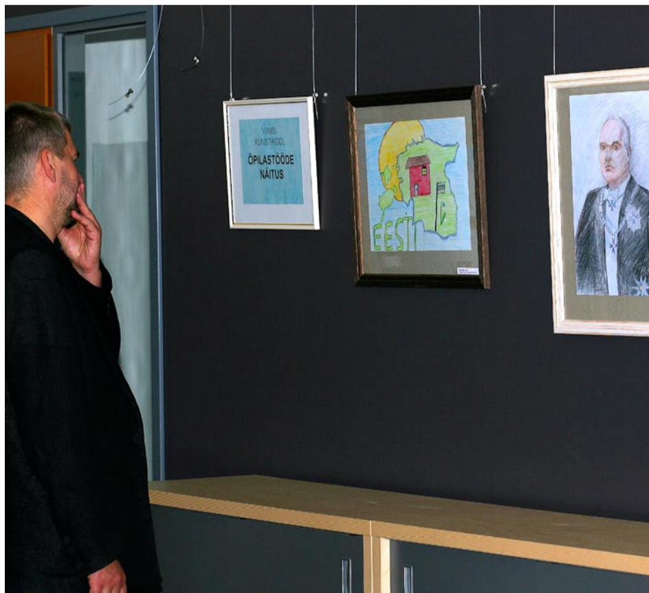
Vaheajal sai vaadata Viimsi Kunstikooli õpilastööde näitust.