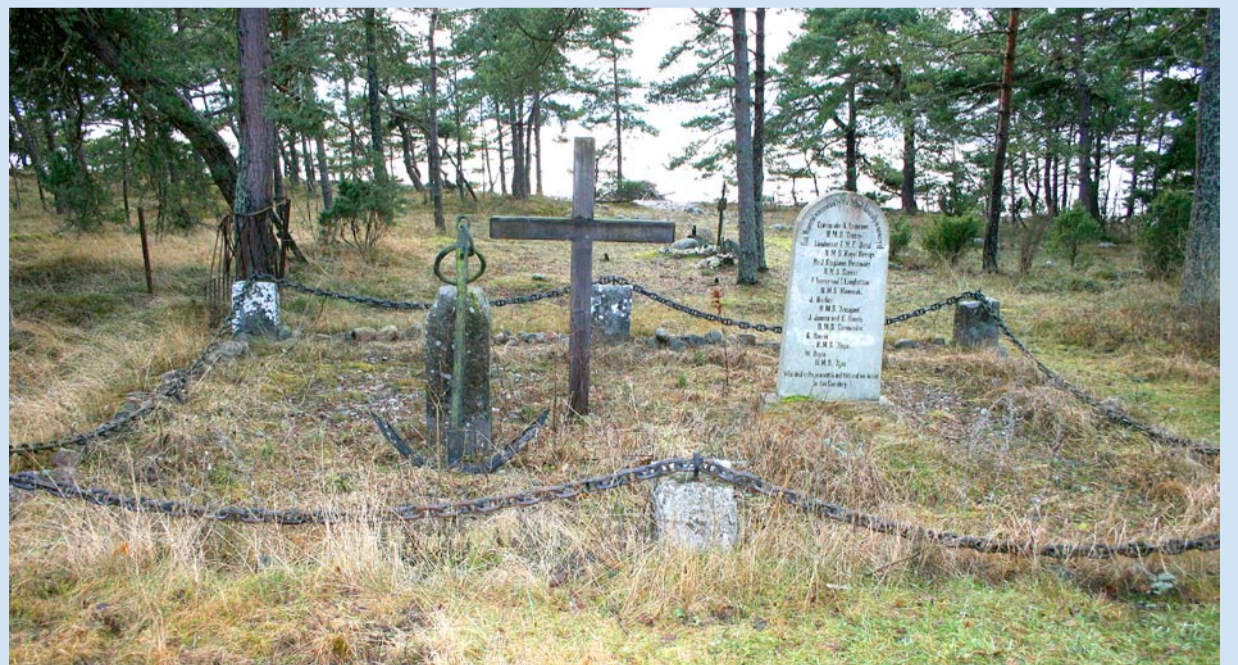
Nüüd: Inglise meremeeste mälestusmärk Naissaare kalmistul 2008. aastal, Alar Miku foto.

2000. aasta suvel tehti Inglise saatkonna eestvedamisel kalmistul koristustöid: eelkõige puhastati inglase hauaplatsi, pandi uus mälestuskivi, tõsteti püsti mahakukkunud ristid ning raiuti võsa.