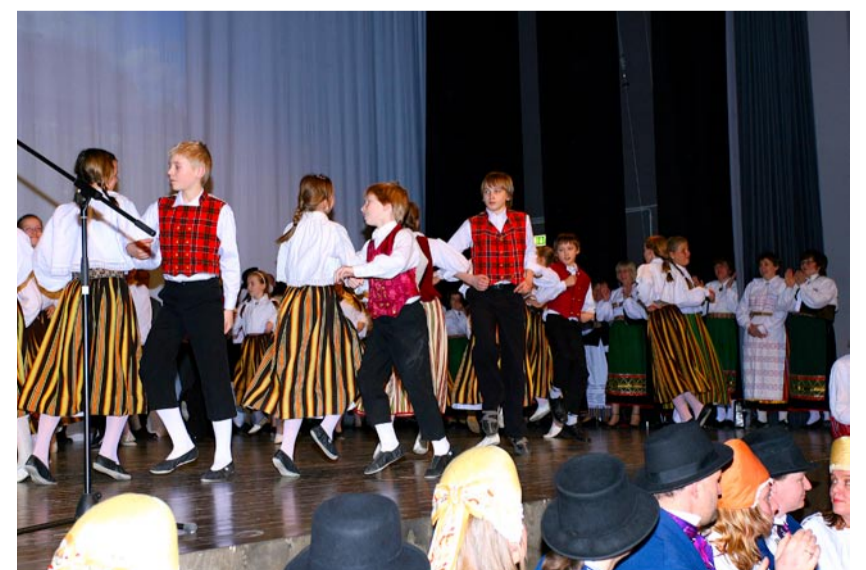
Püüsi Põhikooli rahvatantsurühm.