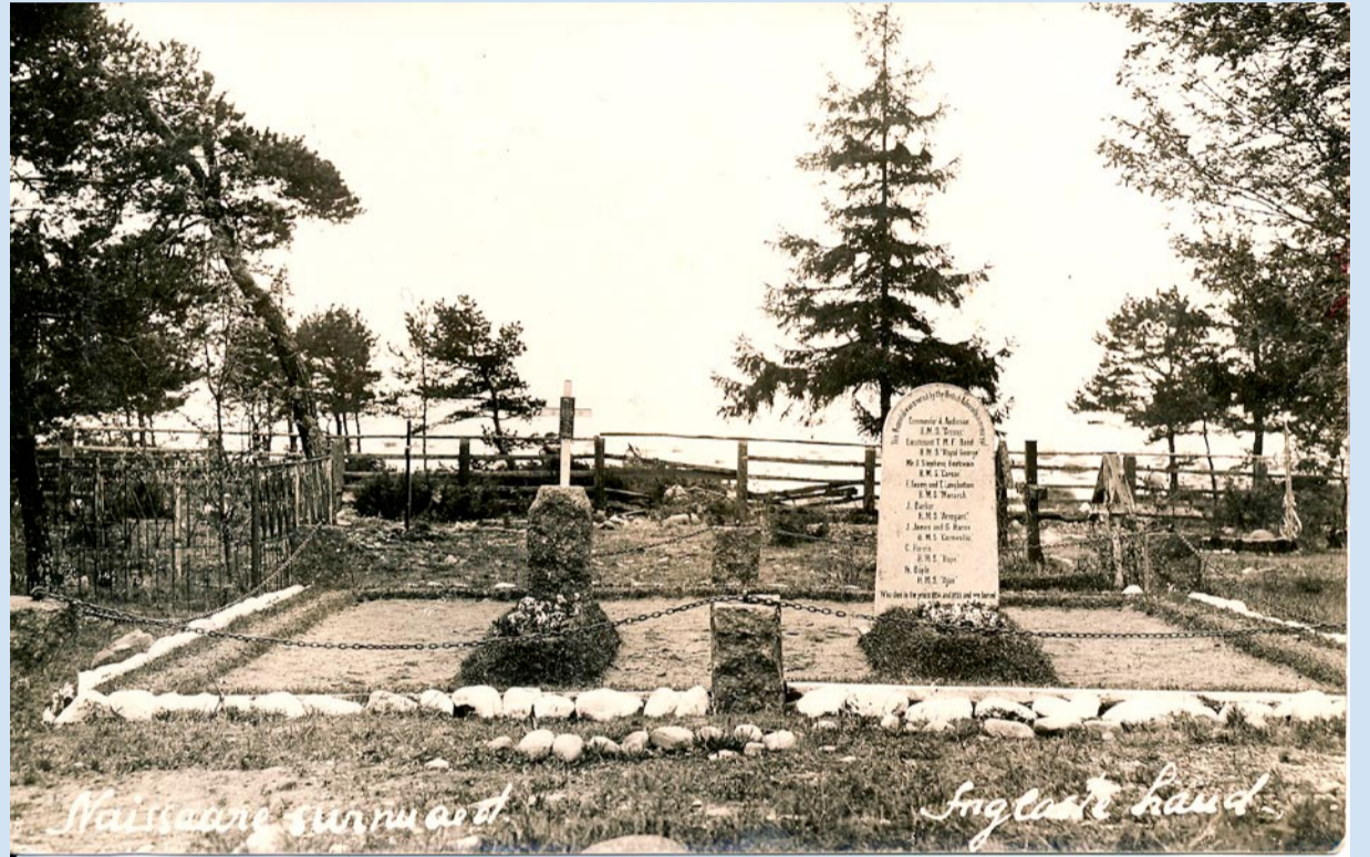
Enne: Inglise meremeeste mälestusmärk Naissaare kalmistul 1920ndate lõpus.

Selle mälestusmärgi püstitas Inglise Kuninglik Sõjalaevastik 1927. a Krimmi sõja ajal Naissaarel surnud ja Lõunaküla kalmistule maetud mereväelaste hauatähiseks.