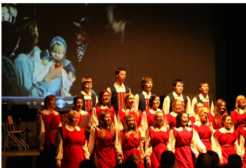
Viimsi Kooli noortekoor.