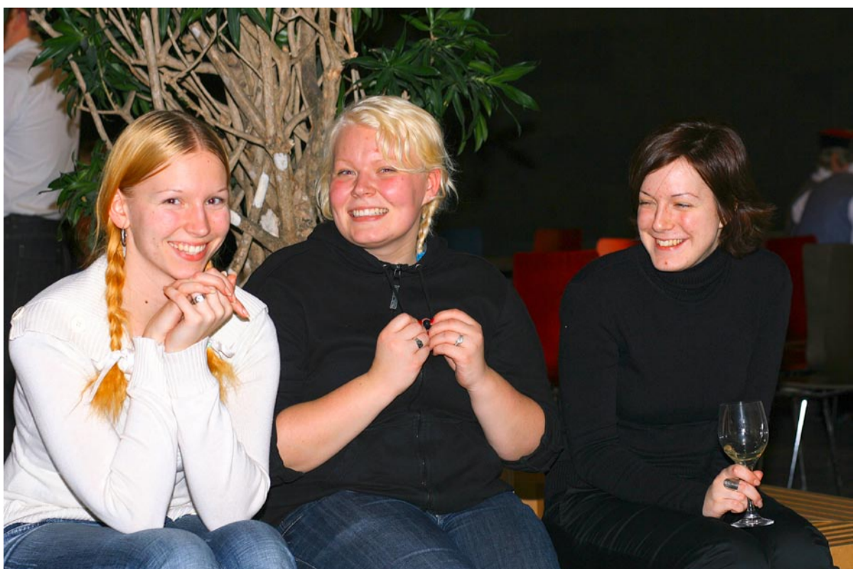
Viimsi Kooli noortekoori lauljad.