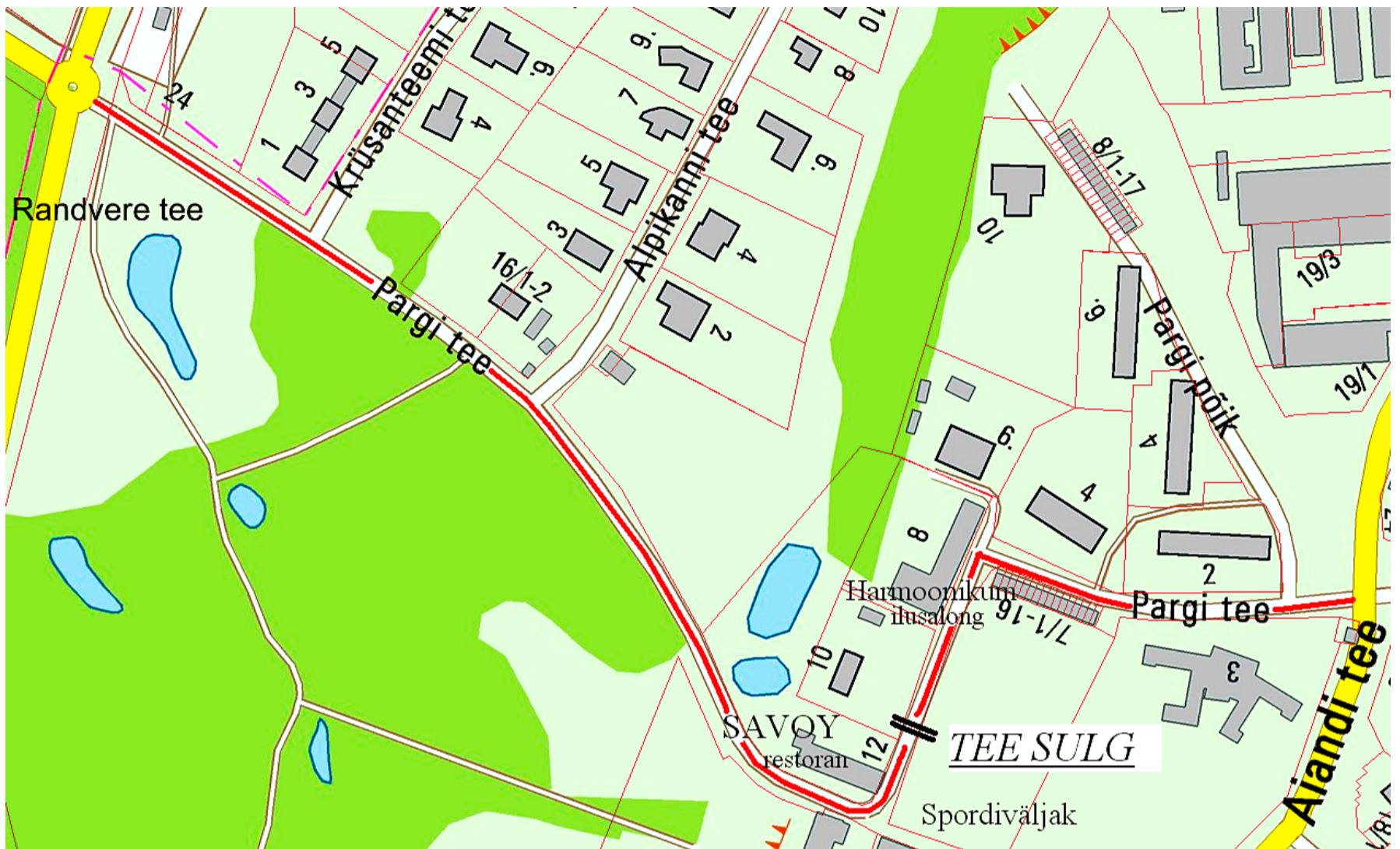
Pargi tee sulgemise skeem.