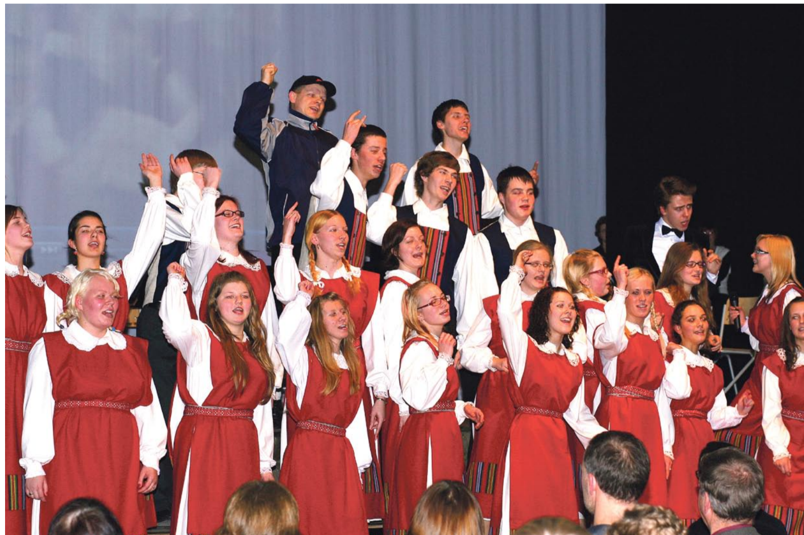
Viimsi Kooli noortekoor.