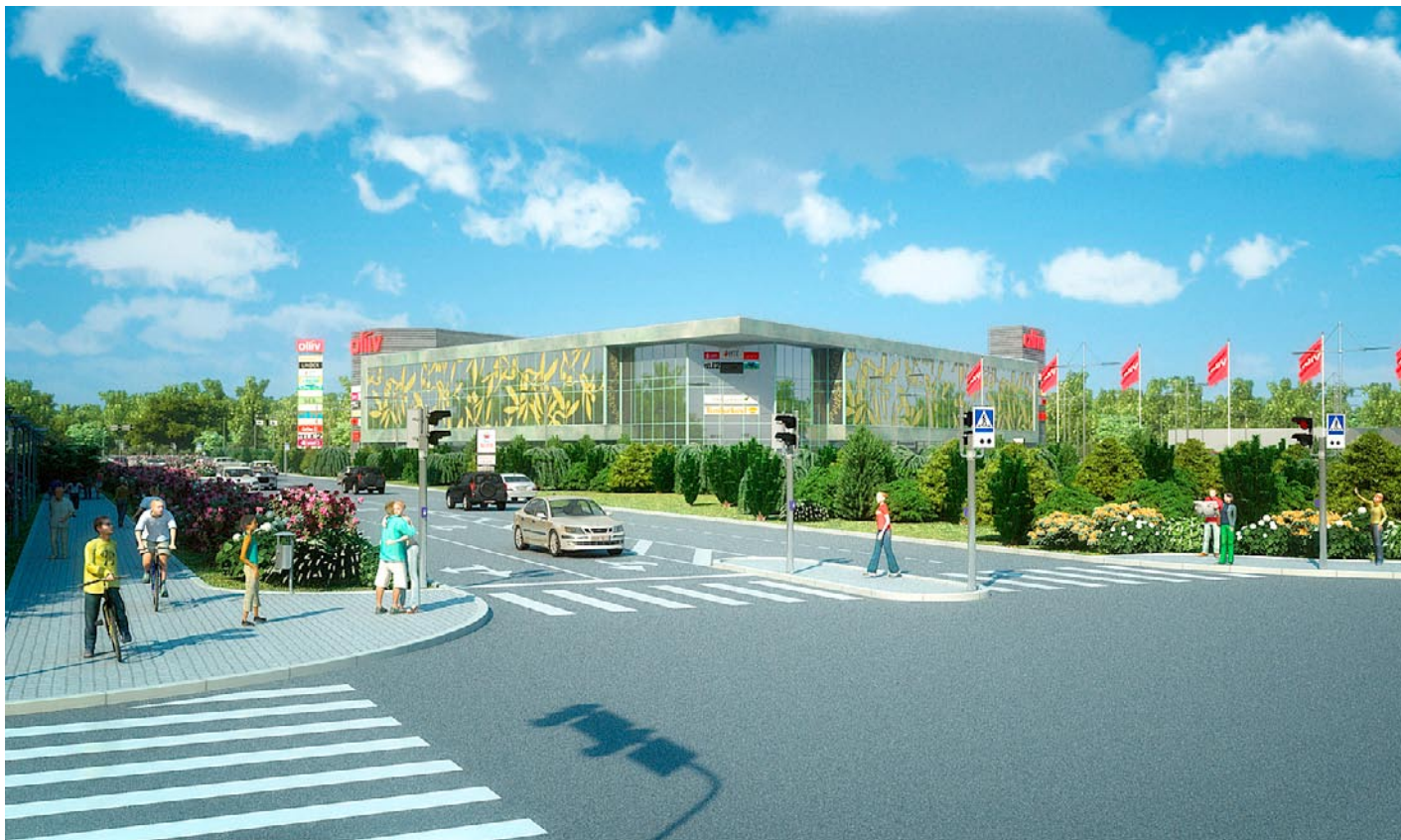
Oliivi välisfassaadi klaaspinnad on oma suuruselt üle Baltimaade uudne lahendus.

Detsembris koostatud Faktum & Ariko uuringust selgub, et viimsilased tunnevad puudust just tihkest keskusest, kus on koos nii toidu- ja tööstuskaubad kui ka teenusepakkujad. On ju Viimsi Eesti kõrgeima keskmise sissetuleku ja sündimusega vald, kus suure osa moodustavad noored ja aktiivsed inimesed.