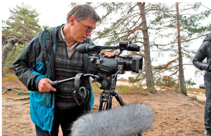
Muusikali filmimas.

Loodame, et stuudio areneb ja kasvab. Loodame, et juba väljakujunenud huviliste laste ring laieneb ning filmitegemine