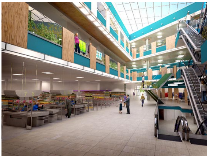
Oliivi sisekujunduse võtmesõnad on avarus, valgusküllasus ja moodne arhitektuur.