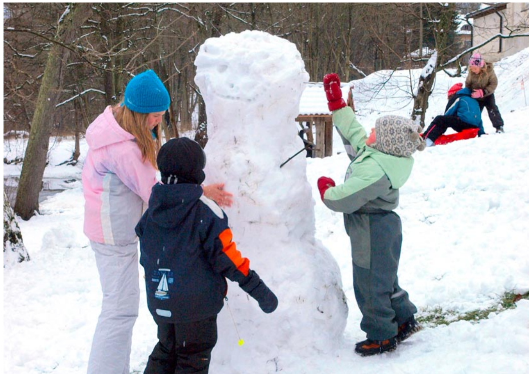
Mõnusad talveilmad pakuvad loovat tegevust.

Viimsi Peakeskuse tiigil iga päev kell 12 - 22