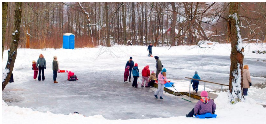
Viimsi peakeskuse tiigil on liuväli.