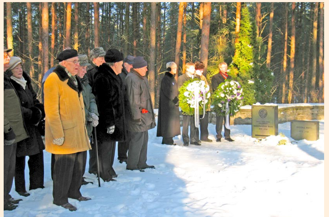
Pirita ja Viimsi vabandusvõitlejad ning Viimsi valla ja Pirita linnaosa juhid president Konstantin Pätsi haul.