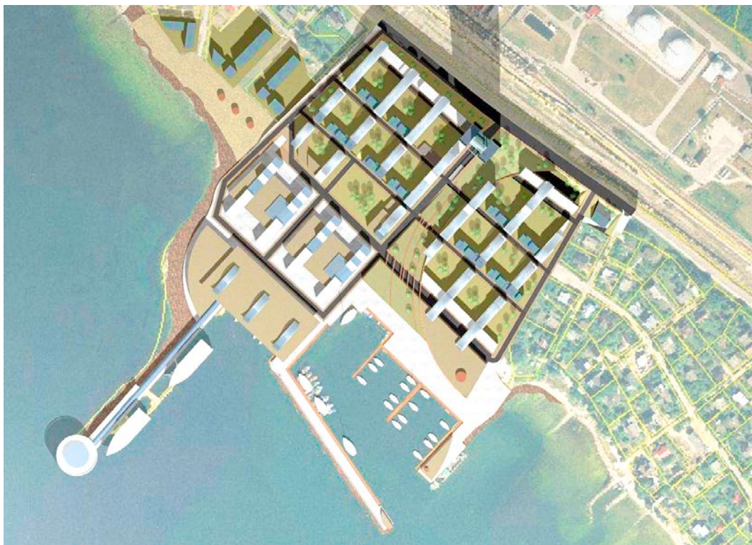
Miiduranna kavandatav planeering.

Just nüüd, kui naftasaaduste transiit Venemaalt on lühikeseks ajaks kadumas, on õige hetk Miiduranna sadamale ja selle ümbrusele anda uus maakasutuse idee ja välistada ohtlikud veosed asumite kaudu. Neid