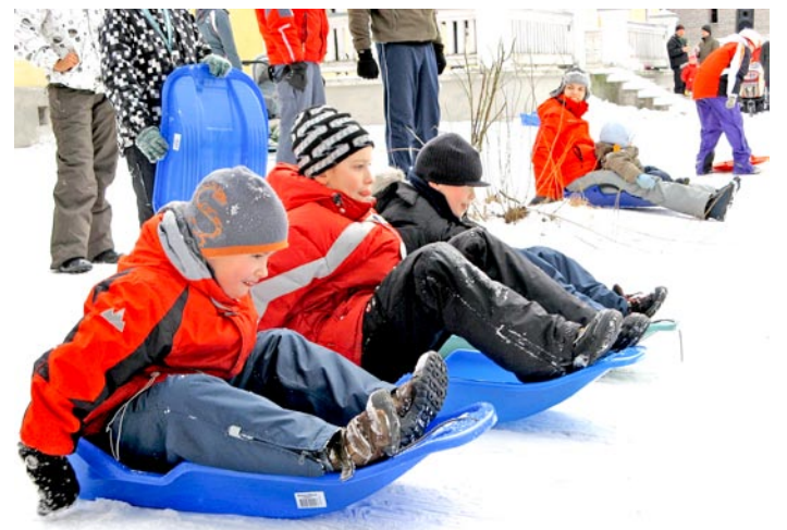
Kõik on stardivalmis.