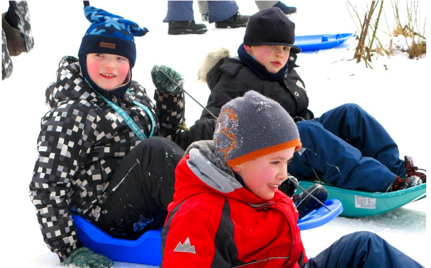
Vastlapäev andis punased põsed.