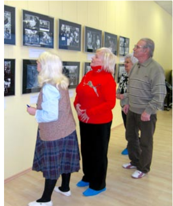
Fotonäitust saab vaadata märtsi lõpuni.

Euroopa Parlamendi saadiku Tunne Kelami fotonäitus 1980. aastatest annab põgusa, kuid sündmuste tähtsuse ja tähenduslikkuse ning ajalise järjes- tuse poolest ülevaatliku mee- nutuse lähiajaloo.