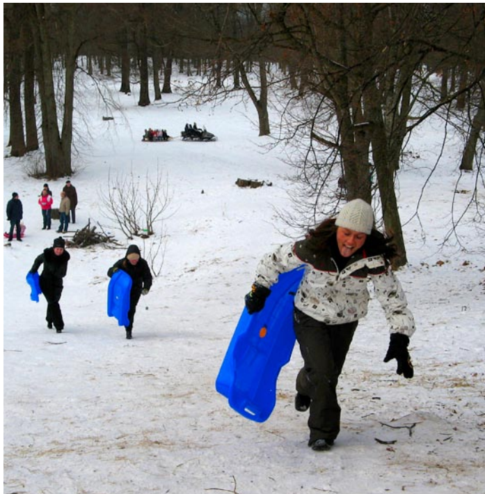
Elevust lisas võimalus võistelda.

23. veebruaril peeti Viimsi mõisamäel valla vastlapäeva. Lasti liugu, tehti võistukelgutamist pikemate linade peale, sõideti ATVga. Võitjatele oli autasuks vastlakuklid ja kuum tee. Vastlapäeva korraldasid vallavalitsus ja MTÜ Viimsi huvikeskus.