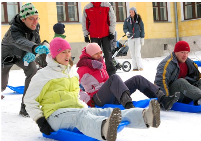
Kas tuleb pikk liug?