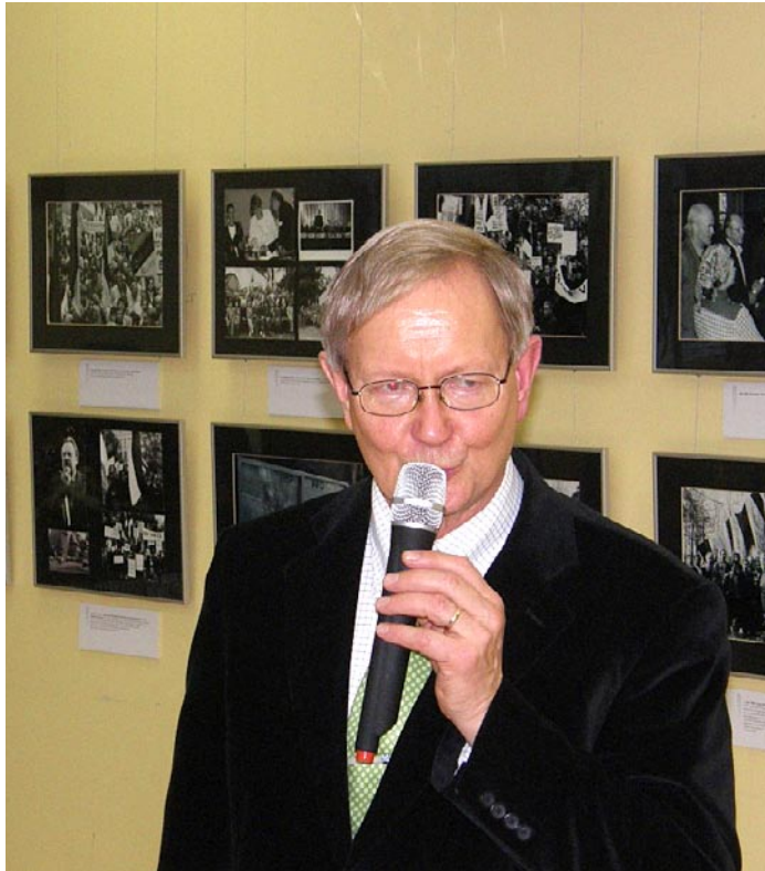
Tunne Kelam kõnelemas näituse avamisel.