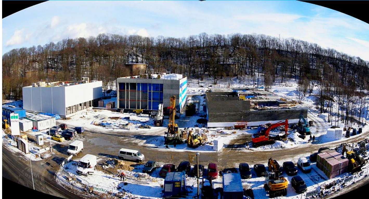
Noorte emade rõõmuks kerkib lasteaed-alkkool hoogsasti.