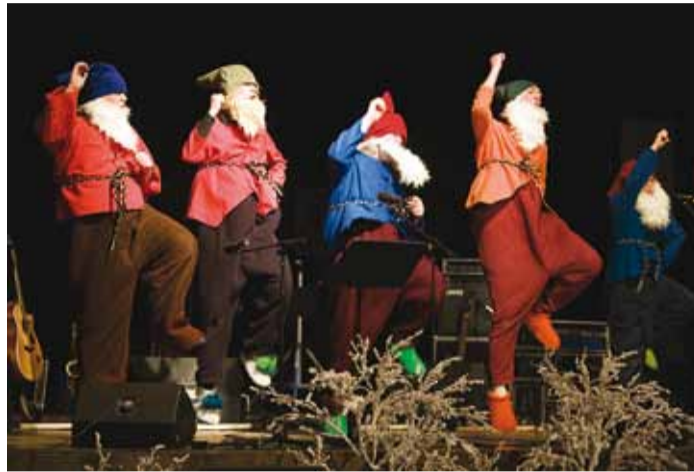
Esinevad põialpoisid Viimsi Kooliteatri uuest muusikalist.