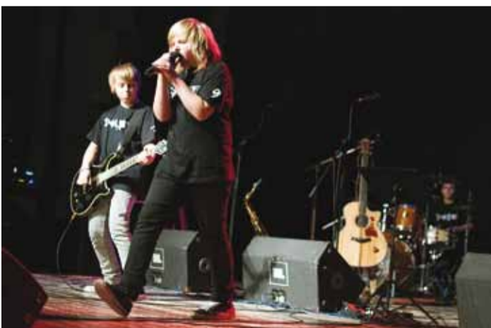
Laval on Viimsi Kooli ansambel Shape.