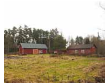
Vana lagunenud laut on ümber ehitatud.