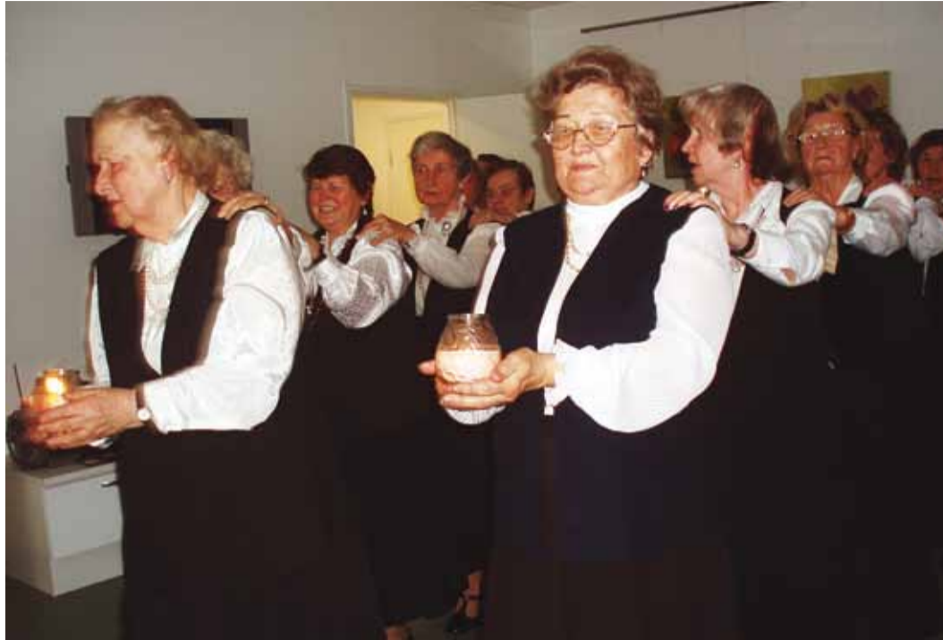
Esinevad seeniortantsijad Rõõmus ring.