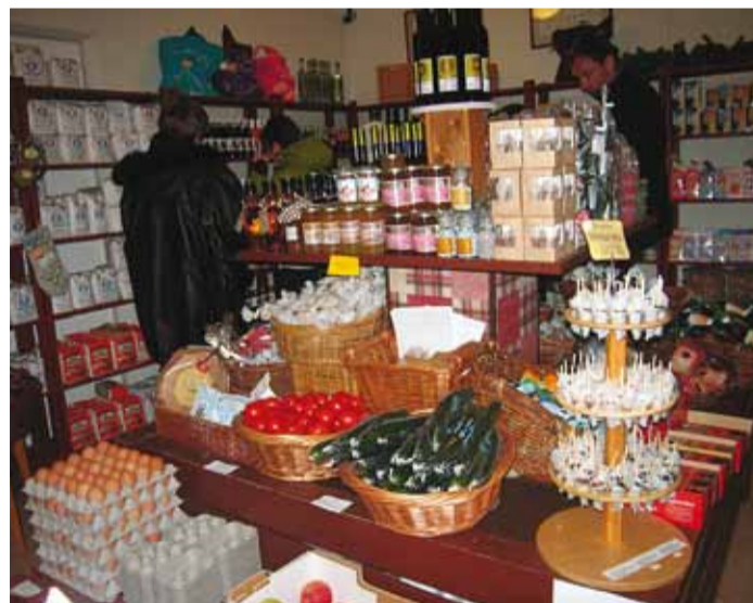
Leader-programmist toetust saanud projektiga avatud külapoes on müügil palju kaupa ümbruskonnast.