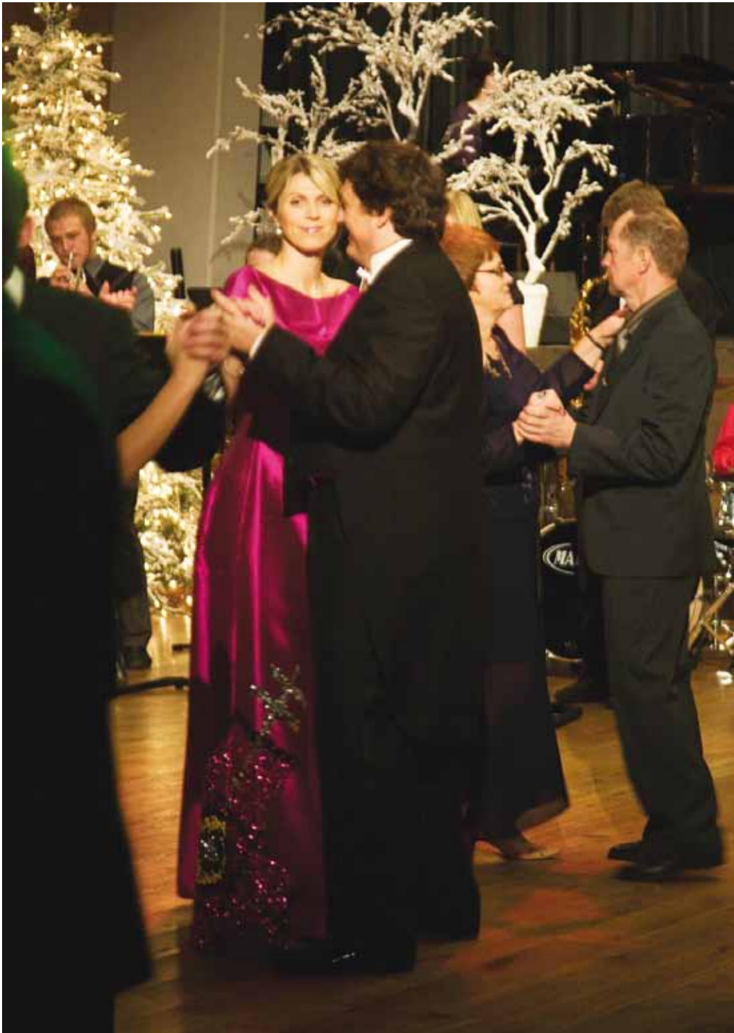
Kaunis saal ja hea muusika andsid õige ballimeeleolu.