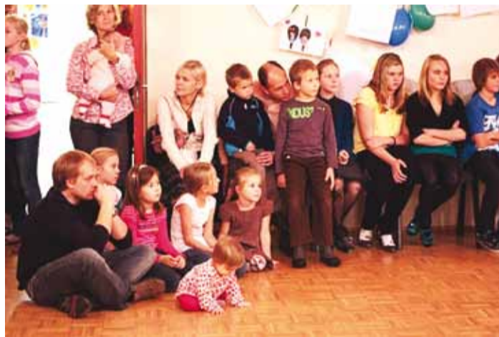
Väikesed ja suured muusikalist vahepala kuulamas.