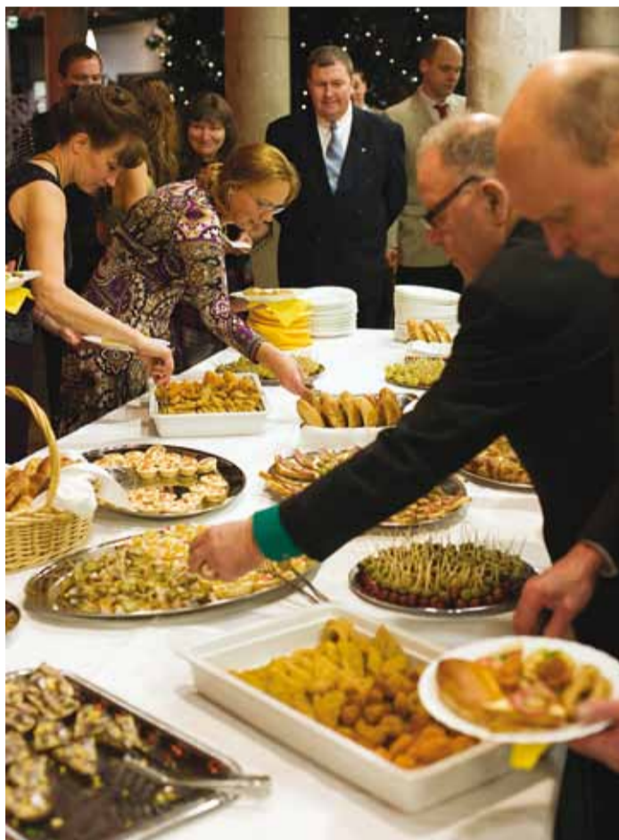
Sponsorite abiga ja emade kätega tehtud suupisted.