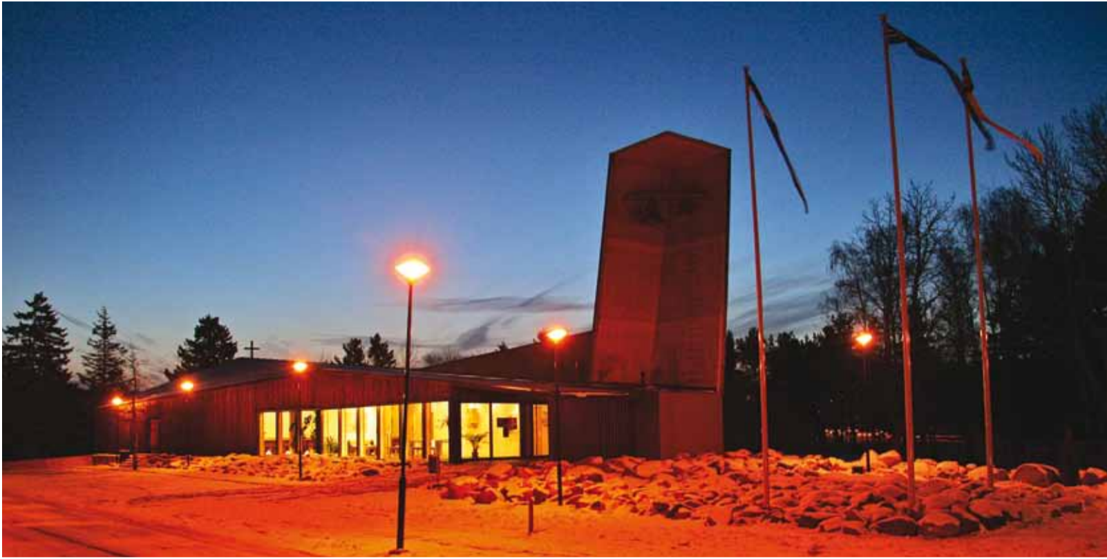
Aastasadu on kirik jaganud valgust päevast päeva.

On kõige pimedam aeg aastas meil siin Eestimaal – eks see paneb meid ikka ja jälle igatsema valguse ja soojust järgi. Nii ongi juba ajast aega meie esivanemad tähistanud talvist pööripäeva kui aega, mil valgus saab võitu pimeduse üle. On ju sellest ajast päev taas samumekese pikem.