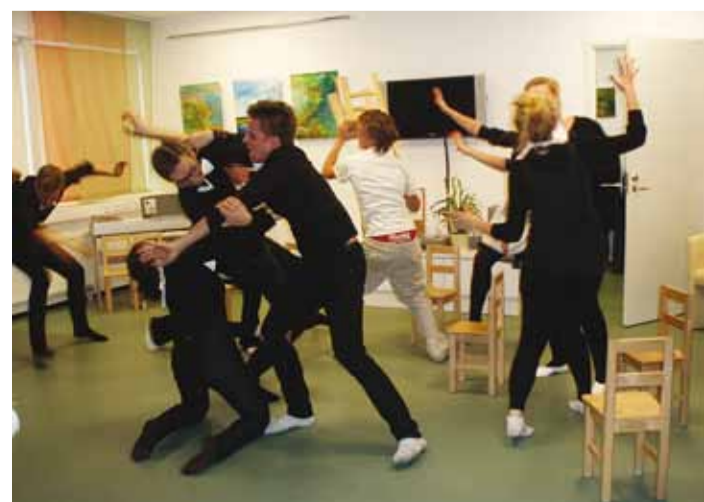
Toomklubi Teatrikooli "Pingviinide elu".