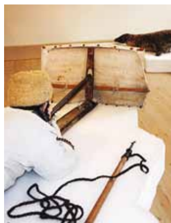
Väljapanekud "Võrgu ilu" ja "Hülgeküttide jälgedes".

Viimsi vanas koolimajas paiknevale mäluasutusele on lähiminevik olnud eneseleidmise ajaks. See, et paari aasta tagusest Viimsi Koduloomuuseumist on nüüdseks saanud Rannarahva Muuseum, tähendab sisulist uuenemist, paikkonnamuuseumi muutumist teemamuuseumiks, mille tegevusala hõlmab kogu Eesti rannaala. Muuseumiaasta lõpetuseks on Rannarahva Muuseum välja