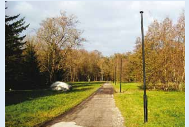
Pättide hävitustöö Viimsi mõisa pargis.

Õöl vastu 31. oktoobrit lõhuti Viimsi mõisa pargis 16 kõnnitee ääres asetsevat välisvalgustit ja väänati kõveraks kaks valgustuse masti.