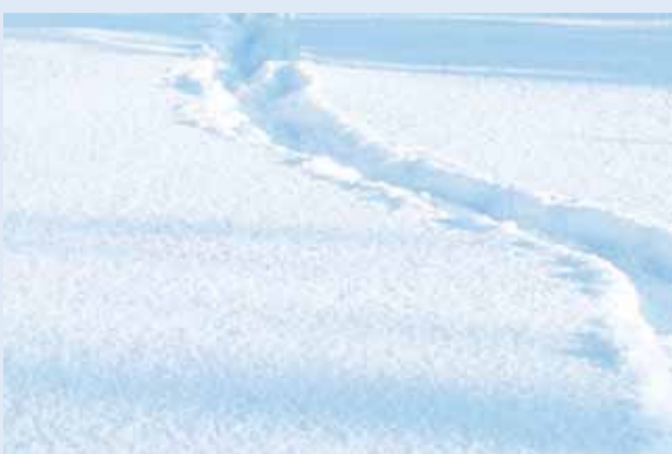
Seekordne matk toimus külma ja lund trotsides.