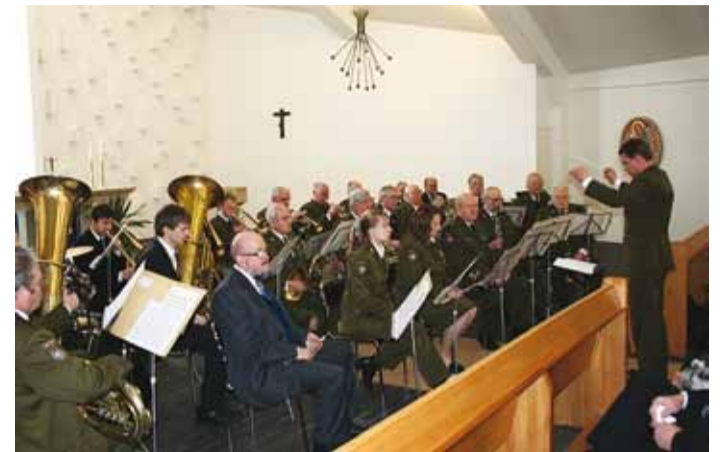
Kirikus andis pidupäevakontserdi Kaitseliidu Tallinna Maleva orkester.