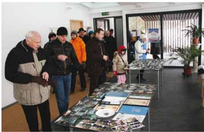
Püha Jaakobi kirikus sai vaadata Kaitseliidu tutvustavat näitust.