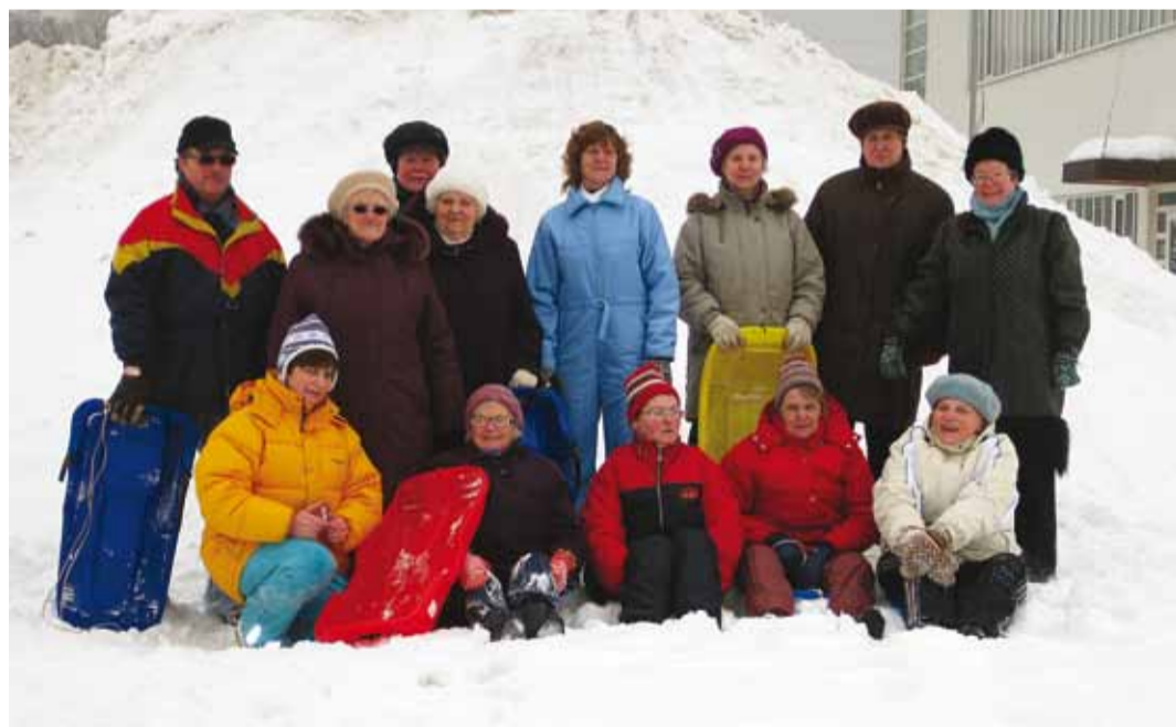
Vastlapäevalised ja lumemägi.