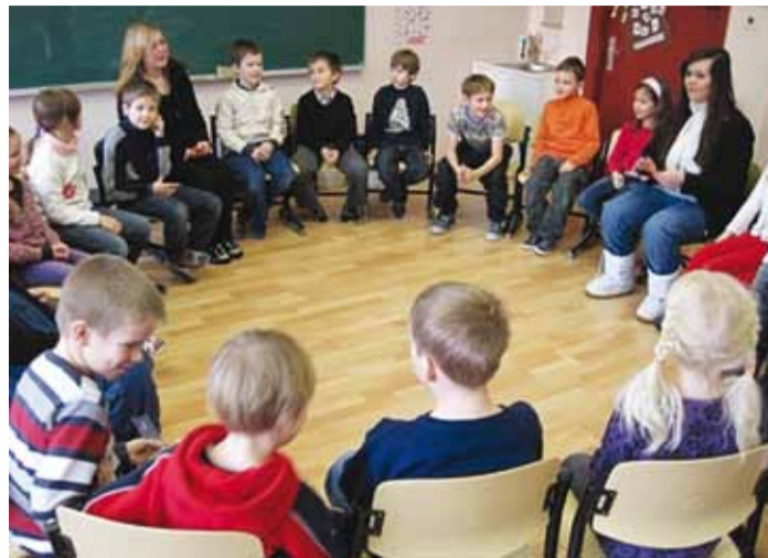
Koos saksa praktikantidega.