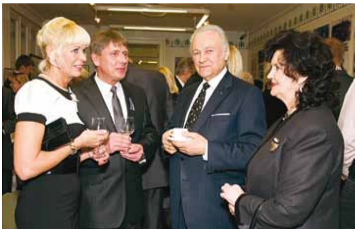
Külastuste seas olid ka presidendipaar Arnold ja Ingrid Rütel. Pildil koos vallavanema ja tema abikaasaga.