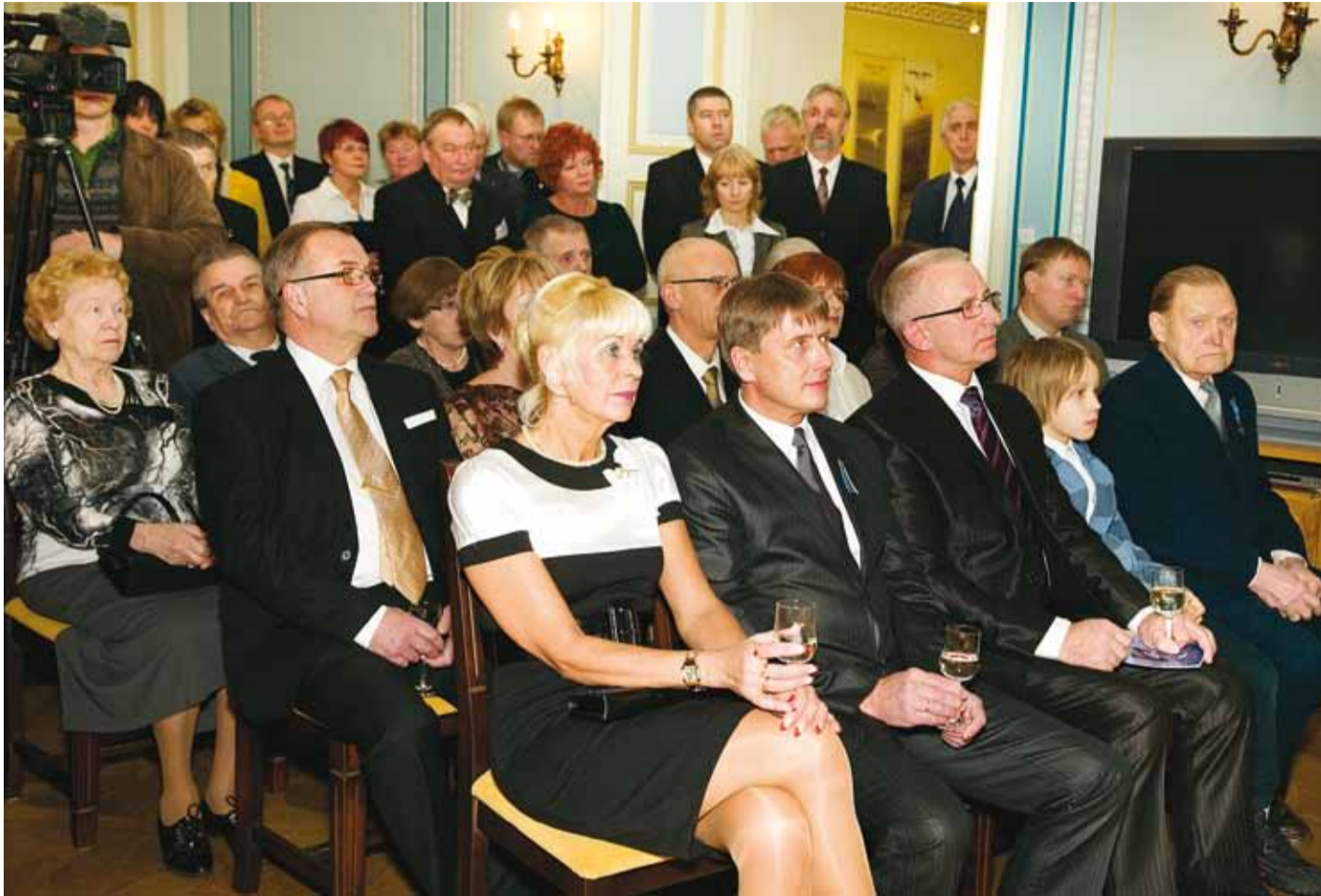
Huviga kuulati kõnesid ja hiljem vaadati filmi "Noored kotkad".