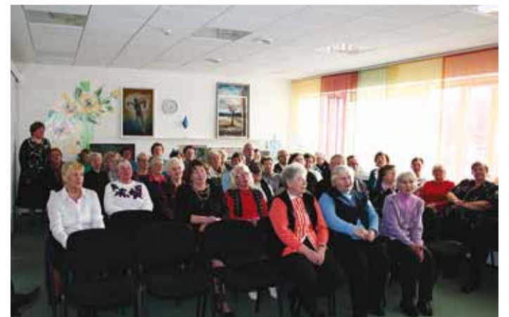
Pidupäev oli päevakeskuses rahvarohke.