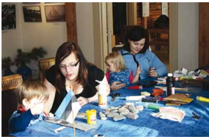
Rannarahva Muuseumis olid lastele avatud põnevad õpitoad.