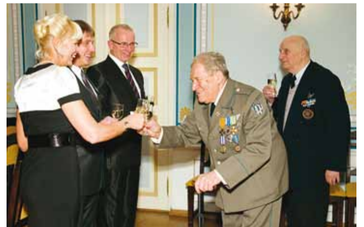
Alati on pidulikele vastuvõttudele kutsutud ka valla veterane. Piltte saab vaadata ja tellida: www.fotograafid.ee