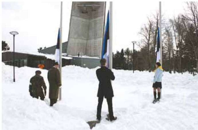
Lipud heiskasid kaitseliitlane, kirikuõpetaja ja kodutütar.