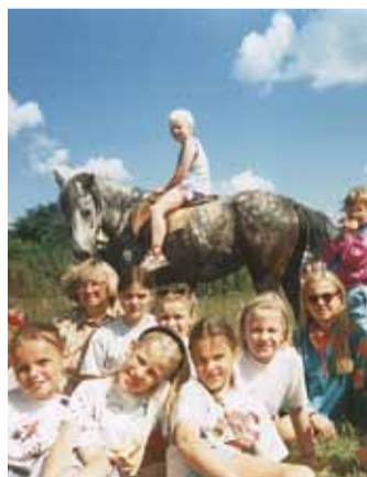
Mullu suvel keelelaagris.