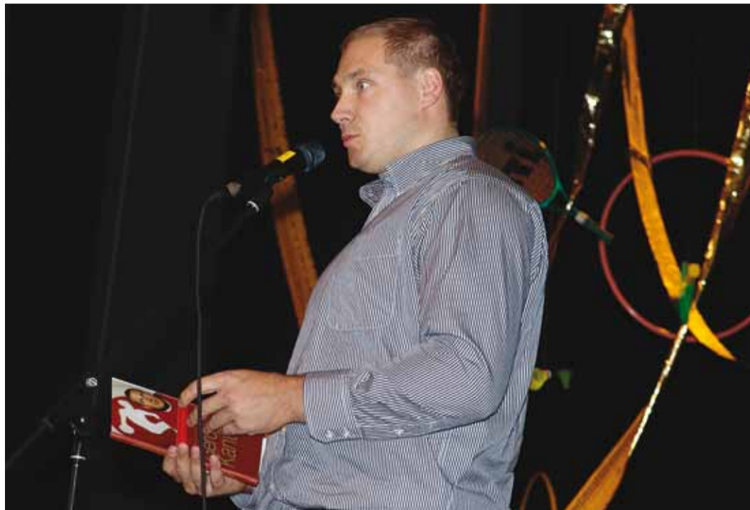
Eelmisel aastal käis parimatest parimatel sportlastel kätt surumas Gerd Kanter.

Viimsi Kool tänab kõiki lapsevanemaid, õpetajaid