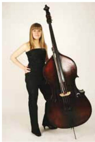
Regina oma armastatud pilliga.

Kontrabassi õppimine on mulle kindlasti andnud teadmisi, erialast tööd, võimaluse hobi ja töö ühendada, aega kultuur-