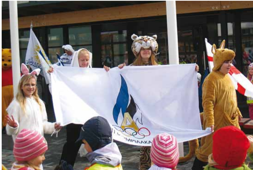
Lasteaia olümpiamänge toetas Eesti Olümpiaakadeemia.

Selleks, et mängud ikka uhkemad paistaksid, kutsuti osalema ka kuue Viimsi lasteaia lapsed. Nemad pidid esinema erinevate riikidena, sest olümpiamängud on ju rahvusvaheline üritus.