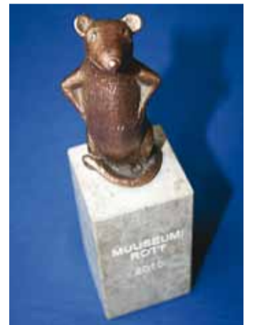
Auhind – Muuseumirott.