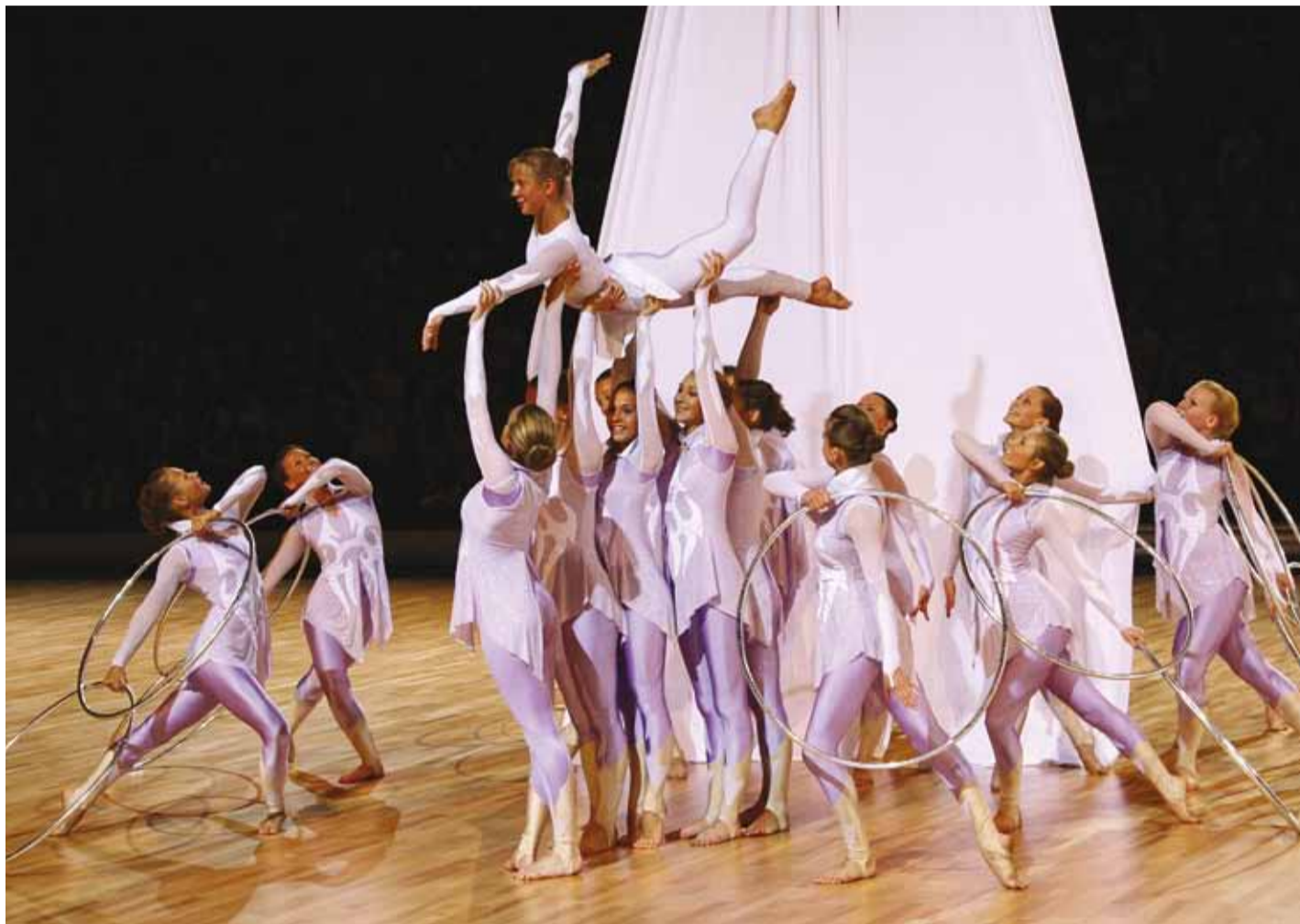
Pirueti eliitühma võidukava “Valguse algus”.