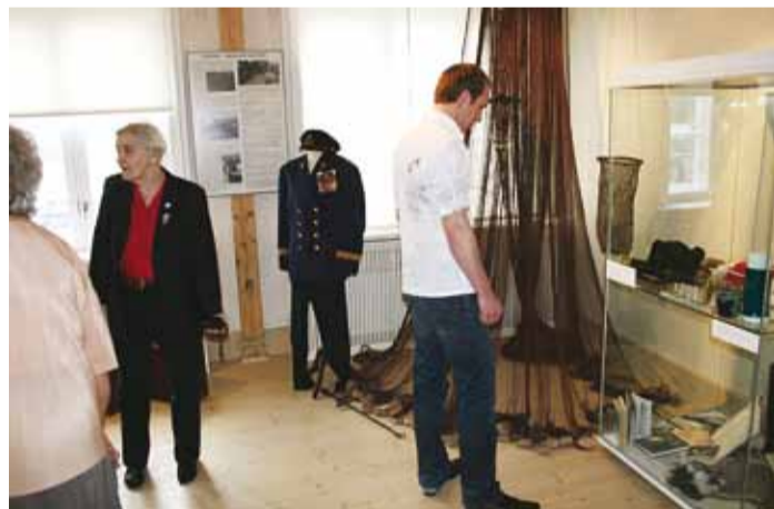
Huvilised on vallutanud näitusesaali.