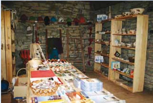
Uus pood Kingu talus.

Viimsi Vabaõhumuuseumis asuvas Kingu talu rehielamus on nüüdsest avatud suur käsitöö ja suveniiripood, kus leidub palju vahvaid kingitusi ja meeneid nii lastele kui ka täiskasvanutele.