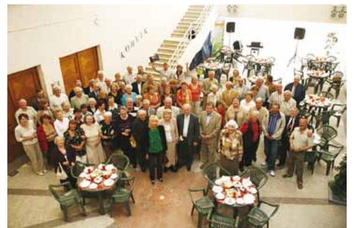
Endise lillekasvatuse sovhoosi pere tuli üle pika aja kokku oma kunagisse majja. Foto Arvi Kriis