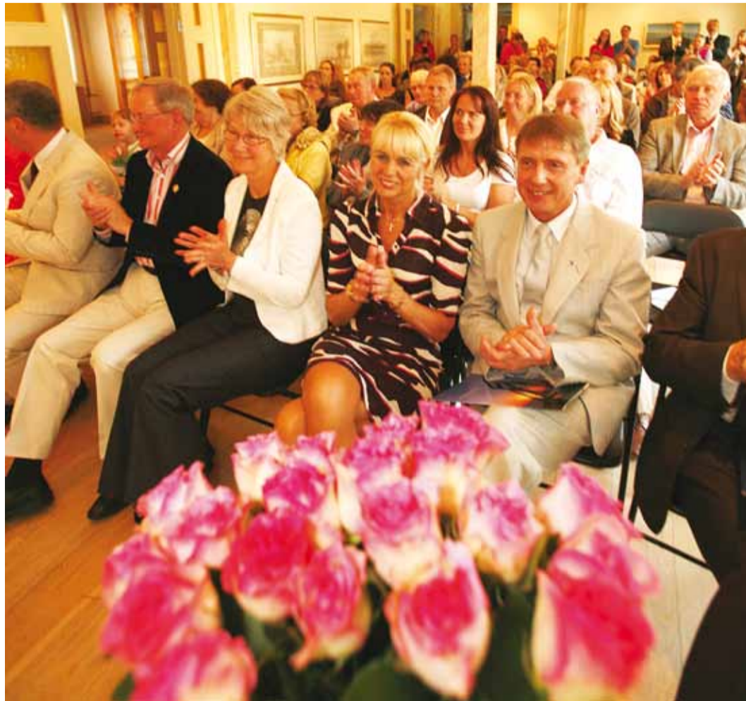
Valla 91. aastapäev Rannarahva Muuseumis.