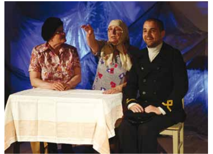
Valla aastapäeva tähistamisele järgnes muuseumiöö, kus Haapsalu harrastusteater mängis Jüri Tuuliku etendust "Meretagune asi".