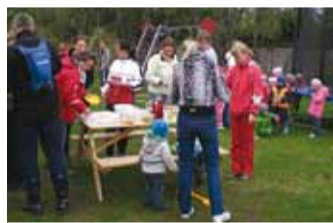
Perepäev lõppes piknikuga.

paljudele vanematele üle lasteaia tänukirja.