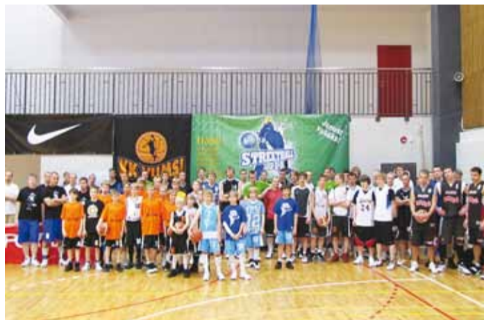
Turniirist osavõtjad ühispildil.

Poolfinaalides kohtusid KK Viimsi ja ajakiri Basketball ning Nike ja Anneli. Mõlemas mängus läks parema