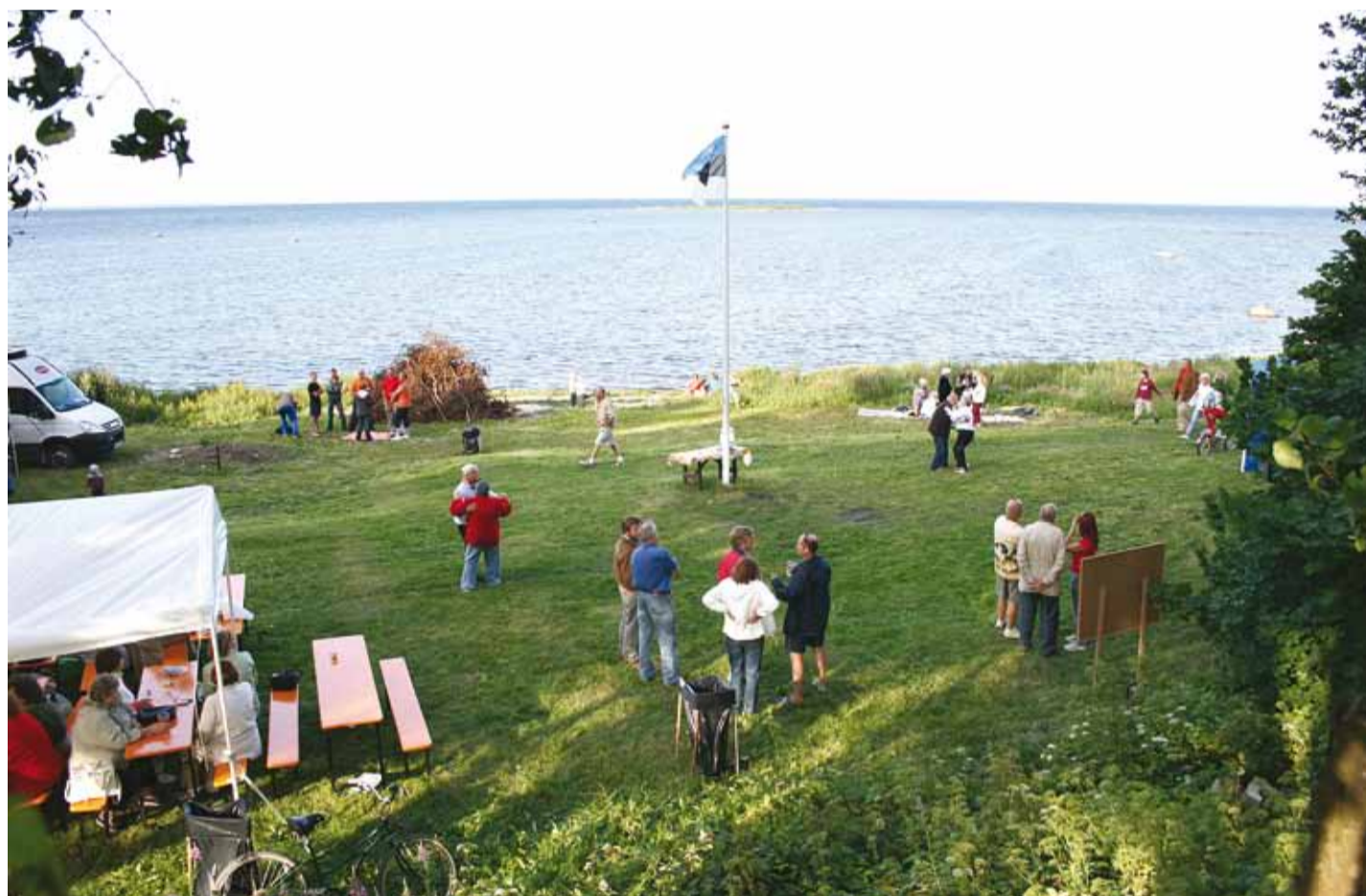
Merepäeva tähistamine Tammneeme külas 2008. aastal.

Suuremad ümberkorraldused tõi iseseisvuse taastamine koos maa- ja omandireformiga. Ühtäkki said senistest maa- kasutajatest omanikud. Tammneemes polnud kunagi olnud suuremaid talukohti, ehkki