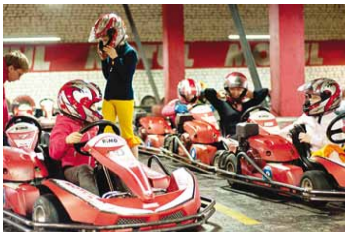
Lapsed kardiroolis kätt proovimas.

Omavalitsusena on meil selge kohustus kaasa aidata laste õnneliku lapsepõlve kujunemisse. Olgu nendeks tegevusteks laste vaba aja sisustamine ja huvitegevuse korraldamine,