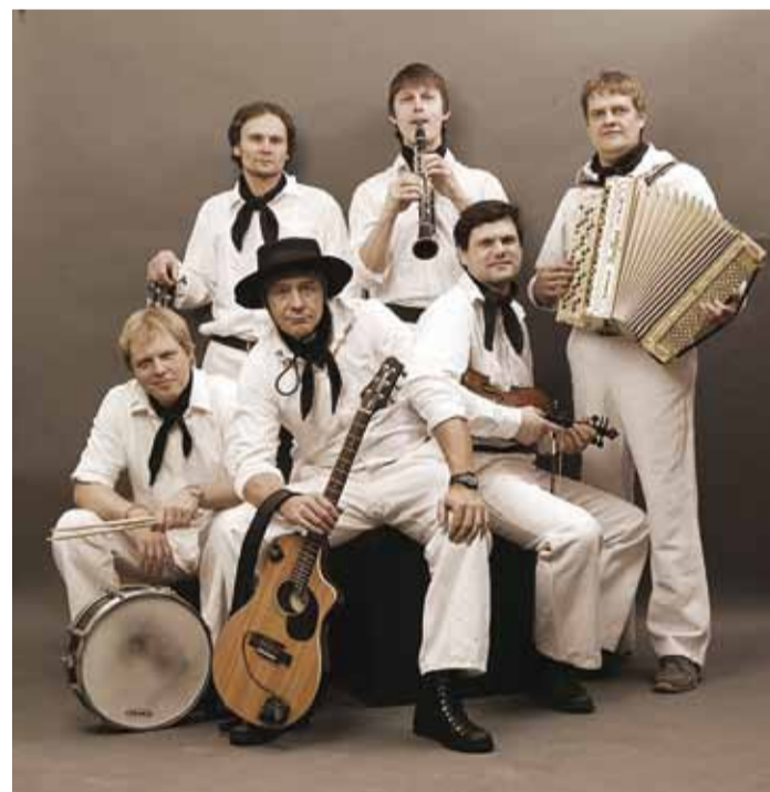
Väikeste Lõõtspillide Ühing.

22. juunil tähistab oma 22. sünnipäeva Väikeste Lõõtspillide Ühing – Rannarahva Muuseumi hoovil toimuv TASUTA sünnipäevakontsert algab kell 20.