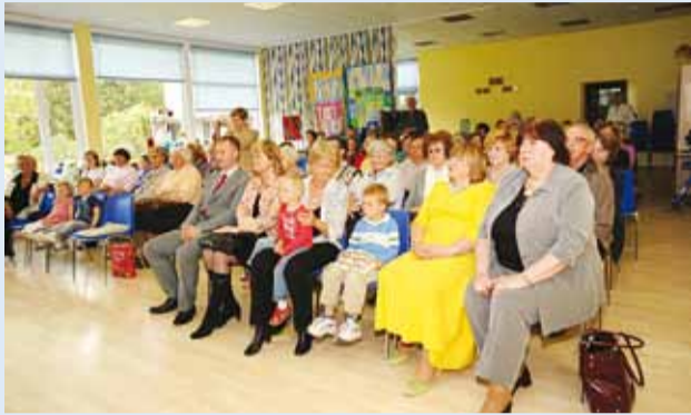
Hooaja lõpetamine.

27. mail lõpetati Viimsi Päevakeskuses pidulikult tänavune hooaeg.