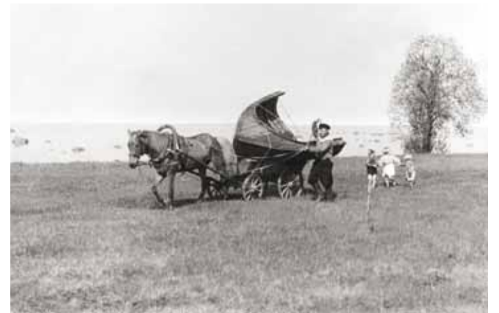
▲ Pooliku paadi vedu arvatavasti 1952. aastal.