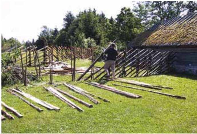
Huvilised saavad roigasaia tegemist ise proovida.

4. juunil kell 10–14 toimub roigasaia tegemine Rohune-