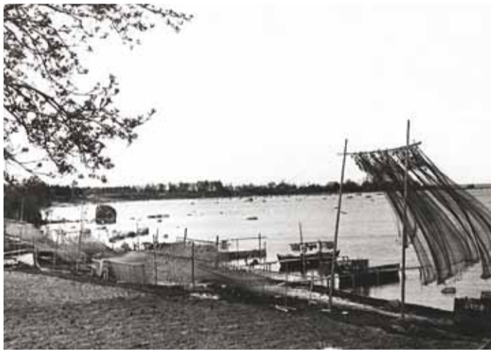
Tammneeme küla 1950-ndatel.