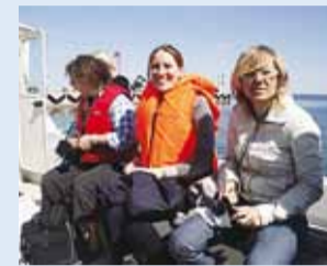
Saksa külalised laevas.

22. mail külastas Prangli saart kaheksa ajakirjanikku Saksamaalt.