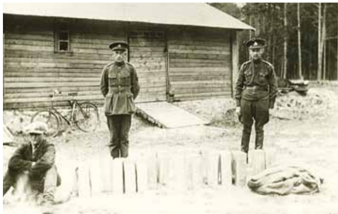
Tabatud salapiiritusevedaja koos kanistritega.

Näitusel "Spirdivedajad ja smugeldajad" ei jää uued teadmised pelgalt faktipõhiseks, vaid eksponeerimisele tuleb näiteks elusuures salapiiritusetorpeedo koopia. Samuti näeme esmakordselt ühele näitusele kokku kogutuna eri-