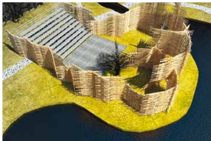
"Noor-Eesti" mängukoha makett.

Eesti Vabariigi sünnini jääb loo toimumise ajal pool aastat. Iseseisvus on õhus, aga see on julguse ja otsustamise küsimus, kas teha või mitte, kas võtta see risk või mitte, kas minna lõpuni või mitte. Suvisesse järveäärsesse tallu