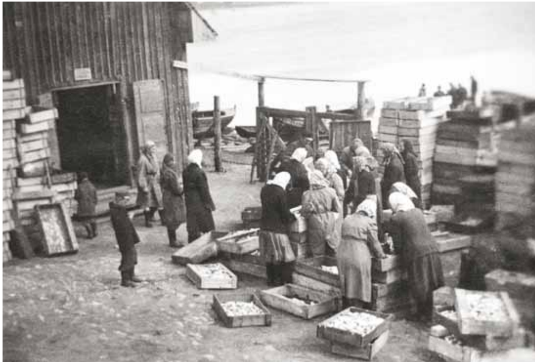
Kalurikolhoosi ajal jätkus rannas ka naistele tööd.

Esimesed kirjaliku teated praeguse Tammneeme küla lähikonnas olnud inimasustusest