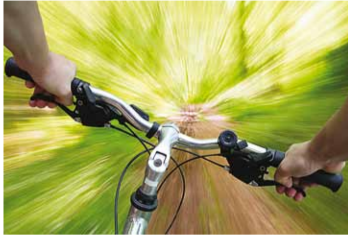
Rattaretk propageerib rohelist mõtteviisi.

Viimsi vald tähistab aastal 2011 ka ajalooliselt soolide juubelinumbri tähtpäeva – sel aastal täitub 770 aastat Viimsi esmamainimisest. Taani hindamisraamatus (Liber Censu Danicae) on aastal 1241