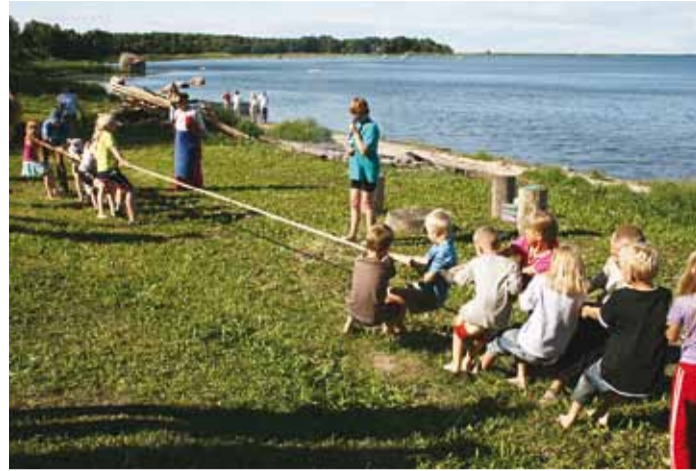
▲ Merepäev 2008, laste kõievedu.

Külakeskust hoone mõttes pole Tammneemes siiani ja sarnasel kujul nagu naabrite juures Randveres poleks me ka suutelised seda ülal pidama. Uus lootus on kavandatava mänguväljaku abihoonel, mida saaks kasutada ka külarahva kooskäimise kohana. Paraku