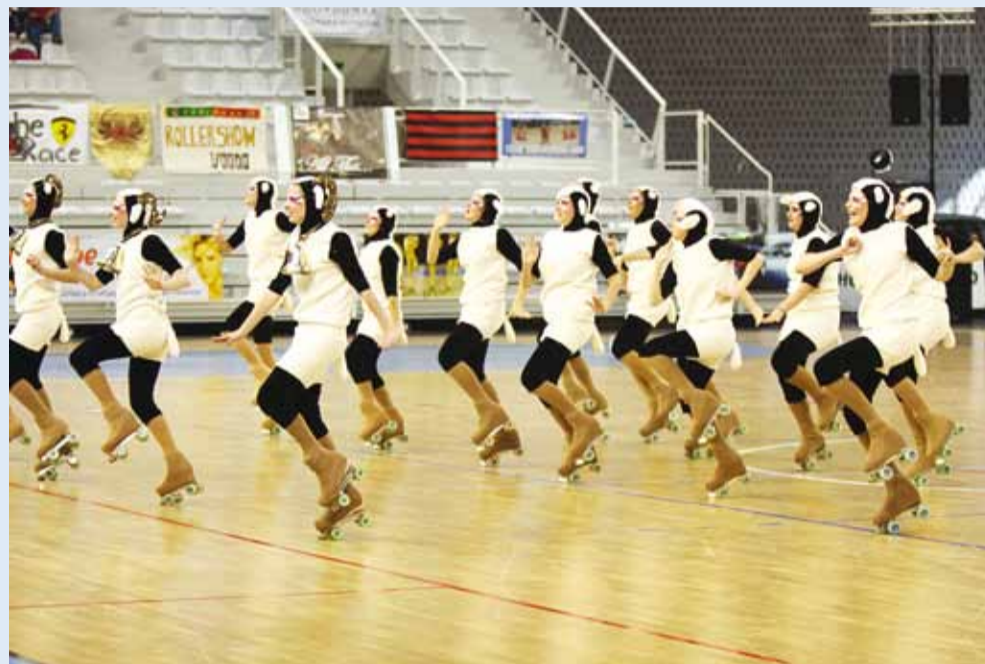
Juunioride kava "Struggle of Power".

6.-7. mail toimusid Portugalis Gondomaris rulliluisutamise Euroopa meistrivõistlused kujunduisutamises ja rühmakavades.