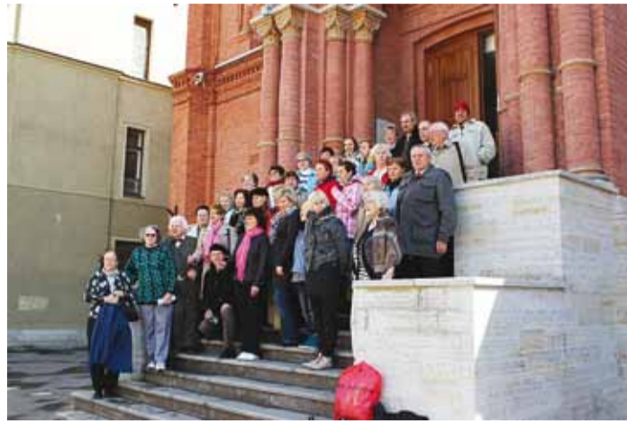
Viimsi segakoor Peterburi Jaani kiriku ees.

Sõit algas 6. mai varahommikul, sest plaanis oli enne Peterburgi jõudmist külastada