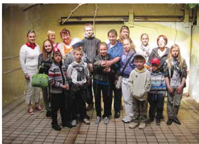
Püüsi Kooli õpilased oma uue sõbra – harjasvöölasega.

Maikuu teisel nädalal käis seltskond püüsi-kaid loomaaias külas. Kuna Tallinna Loomaaias elutseb harjasvöölasi