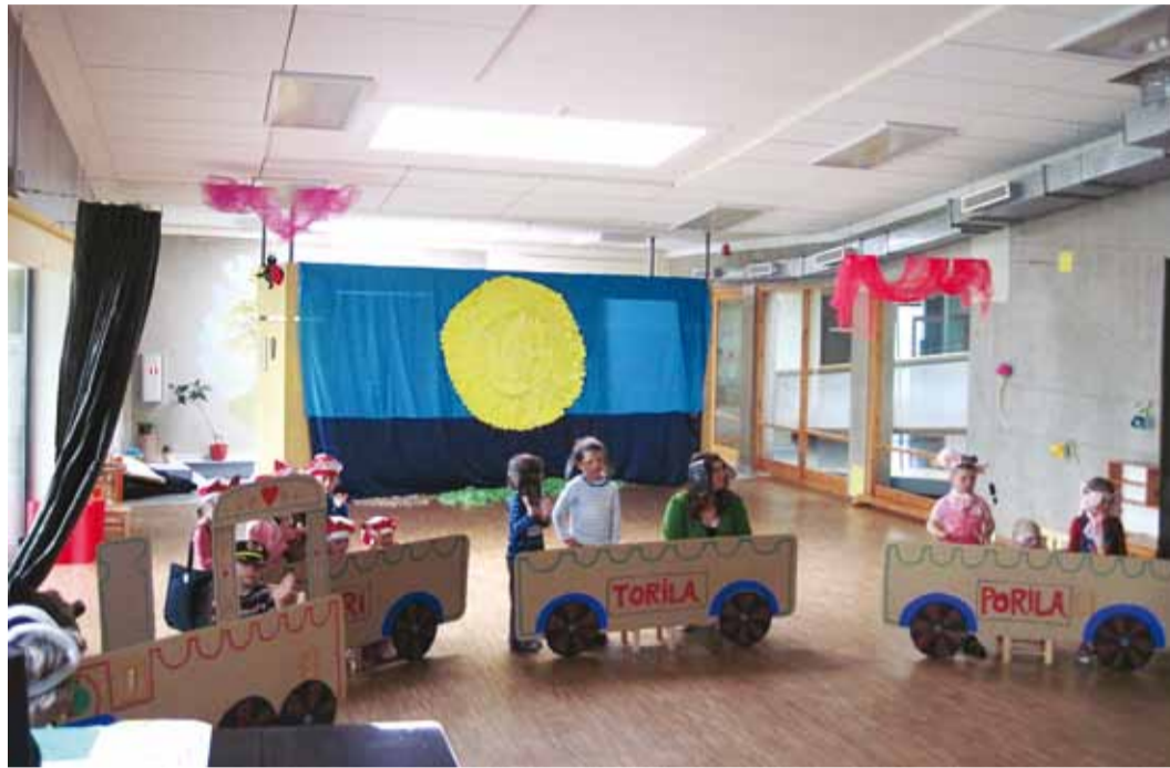
Õppeaasta oli toimekas, lapsed said tublisti targemaks.

Kontrollpunktides lahendatud ülesannete vastused kontrollitud, oli rõõmu, et palju oli õigeid vastuseid. Seega, kõik olid tublid ja said auhinna aasta teemaga magnetmärgi. Jätkuemandale meeldis väga ka lasteaia mänguhoov, kuhu oli juurde tekkinud kuus toredat pajuonni ja laste uusi sportlikku tegevust toetavaid mänguvahendeid, nagu jalgpallivärvad, korvpallirõngas, uued kiiged ja batuut. Tubli töö eest lasteaia arengule kaasaaitamisel andis Jätkuemand