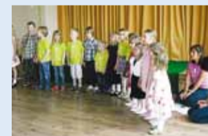
Esineb Astri lasteaed.

Emadepäeva eel kutsusid Väikes Päkese päevahoiu õpetajad Astri lasteaia lapsi esinema.