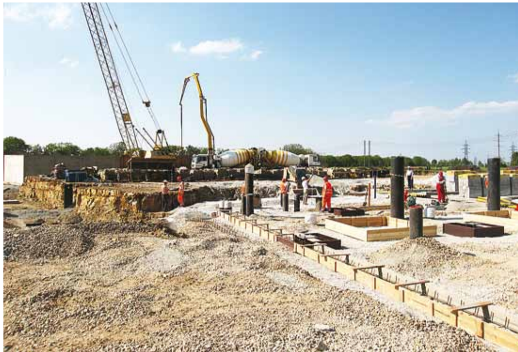
Teisipäeval kella nelja ajal tegutses ehitusel paarkümmend inimest ja hulk tehnikat.

AS Viimsi Vesi sõlmis riigihanke tulemusena ASga Esmar Ehitus 3. märtsil 2011 töövõtulepingu Viimsi veetöötusjaama rajamiseks, mis peab tagama kogu Viimsi mandriosa kvaliteetse joogiveega varustamise. Kõikidele elanikele joogivee tagamise eelduseks on veetorustike