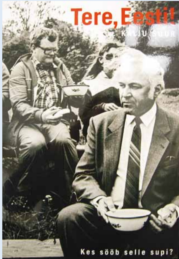
“Kes sööb seal suppi?”

Kalju Suure 109. fotonäitus sattus põlu alla ühe foto pärast.