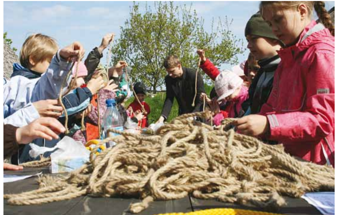
Muuseumis õpetati ka mullu suvel meremehesõlmi tegema.

Pärast programmi läbimist on võimalik muuseumi terri-