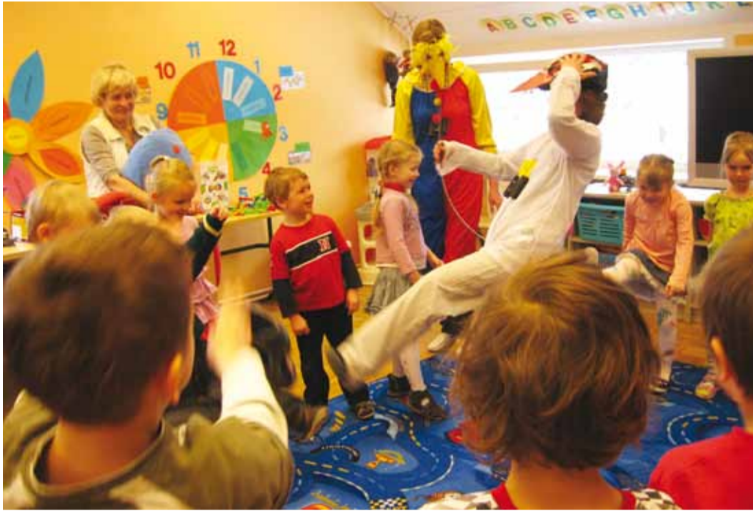
Naerukajakas tegi lastele palju nalja.

Reedel, 1. aprillil jälle aknal istudes muutus naerulind aga kuidagi ärevaks, justkui tunneks midagi erilist. Ruttu otsis ta püksitaskust oma binokli välja ja hakkas rõõmsalt häälitsema. See hääl oli meile tuttav – see oli meie lasteaia