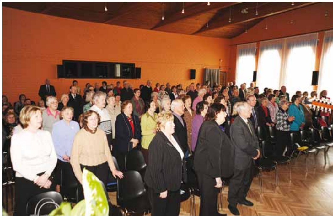
Koos lauldi püsti seistes südamesse minevaid laule.

Erilist tähelepanu oleme pööranud uutele töövormidele, mis täidavad elukestva õppe eesmärke: teabepäevad, eakatepäev, lahtiste uste päev, mis samas toetavad ka eakate