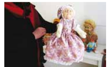
Punamütsike muutus Vanaemaks.

uhke ja suur nukk, mida toodi vaid korraks vaadata.