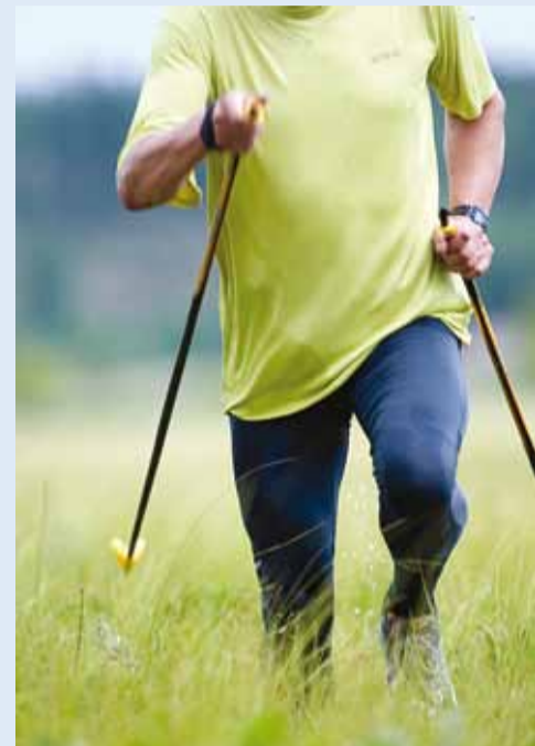
Sammud südame heaks.

"Harjumaa tervisekõnd", mis leiab aset 17.04.2011 kell 11.00 Rae vallas Jüri alevikus. Käimispäev viiakse läbi Euroopa Liidu toetusrahadega Euroopa Sotsiaalfondi programmi "Tervislikke valikuid toetavad meetmed 2010-2011" raames.