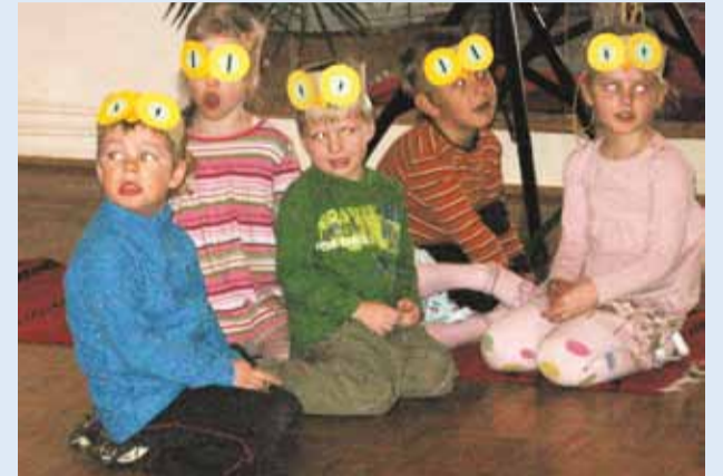
Öökulliperlele saabub õhtu.

Märts, kas ainult kevadkuu? Ei, vastaksid kindlasti Püünsi lasteaia lapsed, meil on märts ka teatrikuu.