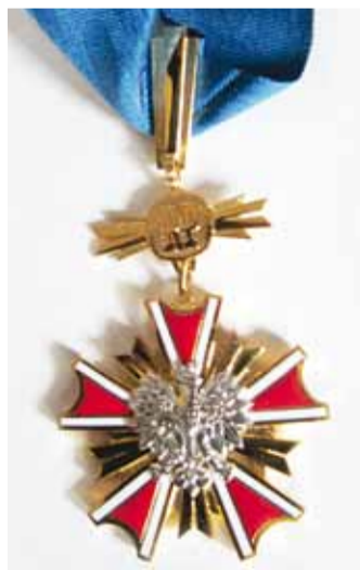
Poola Vabariigi Teeneteordeni Komandöriirist.