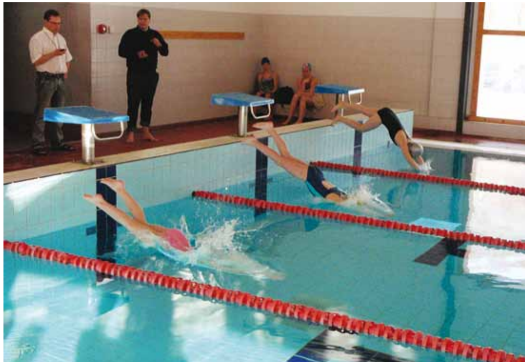
Start on antud. Võistlus alanud.

M55 (1947–1956) – 6 km – I Meelis Meringo 17.25, II