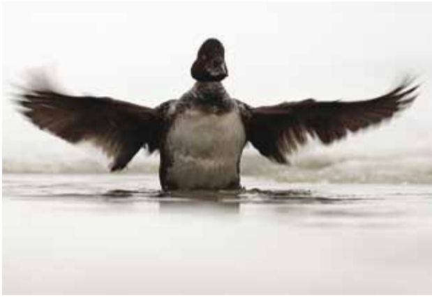
Noor isane sõtkas.

Näe, pardid! Nii mõtlesin, kui nägin merel hulpmas salka linde.