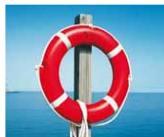
Kuidas päästa sõpra?

tooriumil kiikuda, piknikku pidada ja ringi vaadata. Oma piknikukorv peab sel juhul kaasas olema!