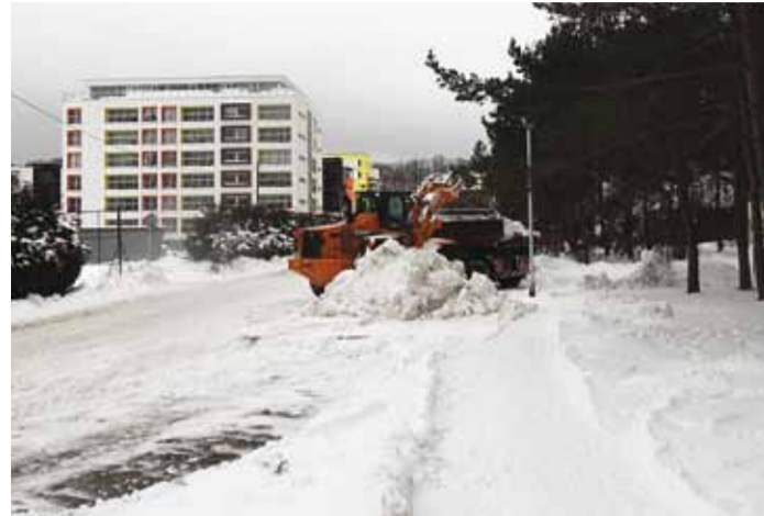
Lumetormi järel vajati tehnikat juurde.