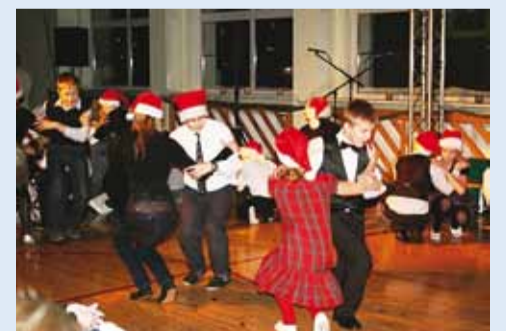
Püünsi õpilased tantsuhoos.

Jõuluvanaga jõuluhommikud möödusid samuti tantsu ja lauluga. Jõuluvana jagas