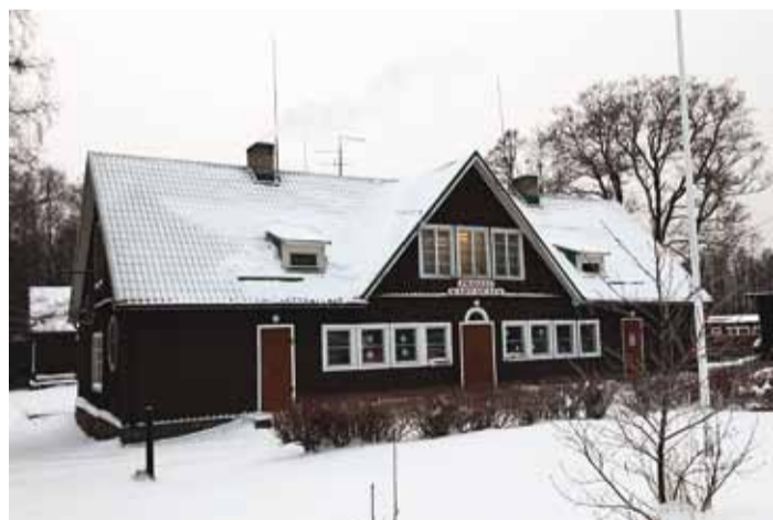
Prangli rahvamaja – nagu sõjajärgses Eestis.

“Kui seinad võeti lahti, oli näha, et saepuru oli alla vajunud,” rääkis Omest Ehituse juhataja Tõnu Kasemets. Kivivill ja tuuletõke pandi seinade soojustamiseks ning nüüd on saalis soe – bullerjaan kütab ja seinad peavad sooja. Fuajee ja köögi põrandad said uue näo