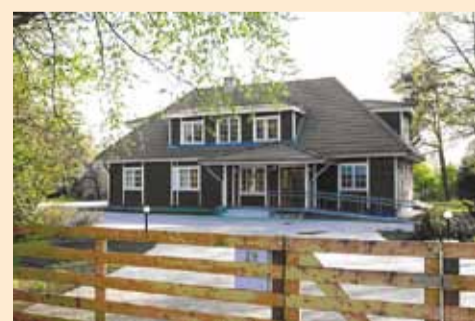
Fotonäitusega saab tutvuda RMK Viimsi Looduskeskuses Haabneemes Rohuneeme tee 29.

kõik Viimsi ja ka Tallinna inimesed, kes naudivad loodust ja selle jäädvustamist fotopaberil.