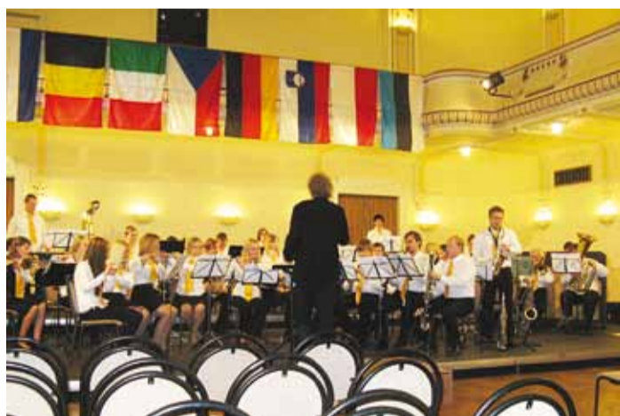
Võidukas orkester esinemas.

Harjumaa noored esitasid vaheldusrikka konkursikava keskendunult, veenvalt ja vabalt ning nauditavalt musitseerides. Kavas oli esindatud ka eesti muusika: minu seatud rahvaliku koraali viis "Mu süda, ärka üles" ning "Puhu tuul" puhkpilliorkestrile jazzcombo-