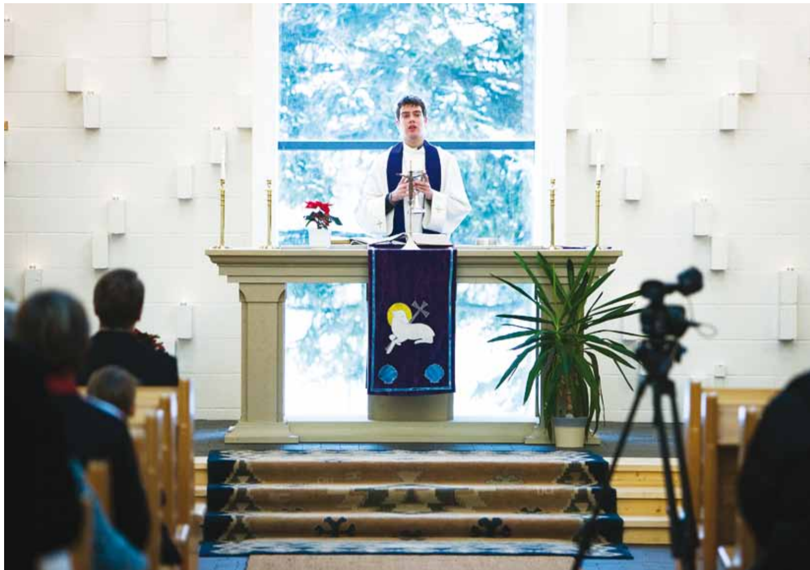
Valla 20. taassünnipäeva tähistamine algas piduliku jumalateenistusega Püha Jaakobi kirikus.