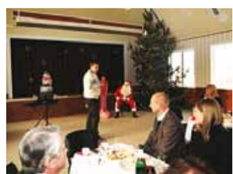
Värskelt remonditud saalis.

“Kui me möödunud aastal siin saalis jõulude ajal is-