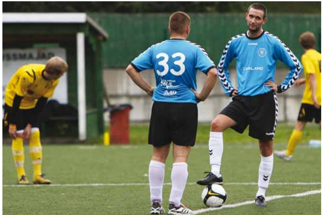
Igiliikur tahab uueks hooajaks häid mängumehi juurde.

Klubi on just jätnud seljataha seni kõige edukama hooaja, kui IV liigas jäi õige pisut puudu pääsust III liiga üleminekumängule ja rahulduti lõpuks 4. kohaga 12 võistkonna konkurentsis. Otsustavas 20. voo kohtumises, mis sisuliselt otsustas 3.–4. koha saadumise, pidi Igiliikur alla vanduma vanale rivaalile FC Eston Villale 1:2, kusjuures vastaste võiduvärav löödi 85. mänguminutil. Huvitaval kombel ei suutnud siiski FC Eston Villa üleminekumängudes FC Balteco vastu III liiga piletit lunastada ja nii tuleb kahel võrdsel vastasel kohtuda vähemalt kaks korda ka uuel hooajal.