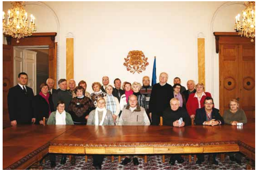
Seeniorid Toompea lossi Valges saalis.

Viimsi Pensionäride Ühenduse seekordne teabepäev korraldati 10. detsembril Aime Salmistu juhtimisel Toompeal. Transpordi probleemi aitas lahendada VPÜ esinaine Viu Nurmela.