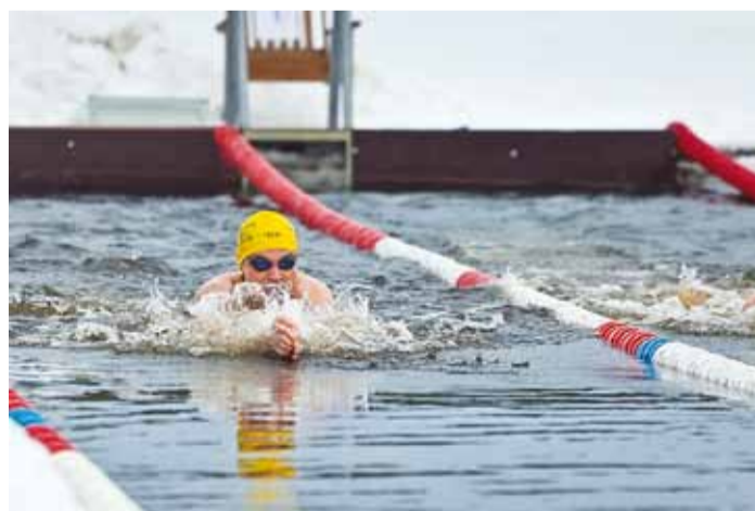
Talvine ujumisfestival avas Eesti ujumisaasta.

Festivali juhatasid sisse Eesti süstaslaalomi harrastajad, kes pealtvaatajaid lõbus-tades jääaugus mitmeid eskimopöördeid viskasid, kuid avatseremoonia tipp hetk oli kindlasti Soome talisuplejate esitatud showkava jääkujun-