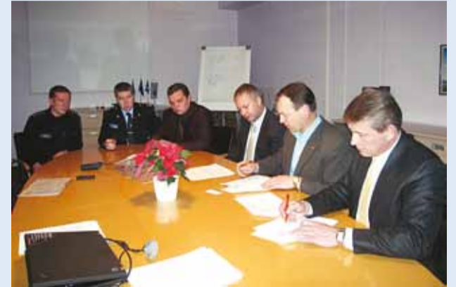
Lepingu allkirjastamine vallavalitsuses

Teisipäeval sõlmiti vallamajas leping, millega loodi vallas 14. naabrivalve sektor.