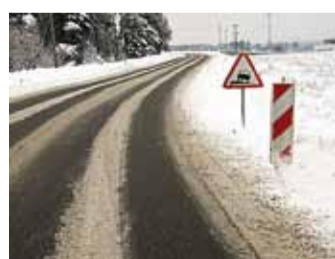
Kurvide nn sirgeks lõikamine tekitab liiklusohutlikke olukordi.

Seoses käesoleva talve järjekordselt raskete lumeloludega on tunduvalt muutunud liiklusolud.