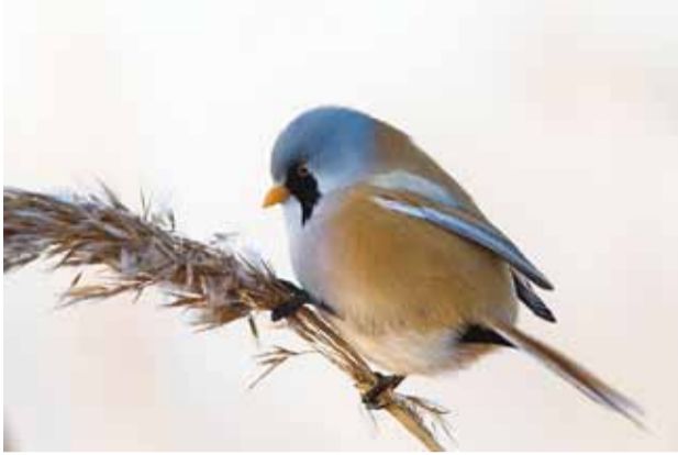
Roohabekas pillirool.

See kena lind on roohabekas. Viimsis kohtusin temaga esmakordselt 2010. aasta külmal talvel. Olin veebilehel www.eoy.ee kättesaadava linnuatlase abil varustanud end teadmise, et midu haruldased roohabekad elavad Tallinnas. Iganädalasel pildijahil jalutades mõtisklesin selle linnu meie vallas elamise võimalikkusest, kui äkitselt kandus kõrvu metallselt plöksuv heli: "plin-plin!" Oli tuulevaikne ja külm ilm. Kuuldav oli nii hea, et mere ääres võis tabada Aegnal lume all murduvate okste praksatusi. Niisiis, roostikust kostus plöksumist ja silm märkas oranži kogu. Mõistsin koheselt sündmuse olulisust. Hiilisin lähemale. Tegu oli roohabeka ilusa isaslinnuga. Usaldus tekkis, kindlasti ka külma sunnil, ning roostikus praktiliselt rinnuni lumes sumades õnnestus saada mõni kaader.