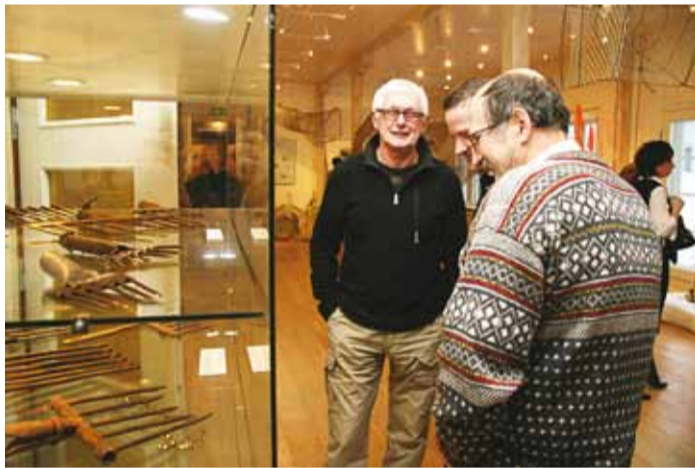
Näituse avamisel. Vitriinis on valik keelatud ja konfiskeeritud püügivahendeid.

Väljapanekule lisavad väärtust põhjalikud infostenid, mis on eesti- ja venekeel-