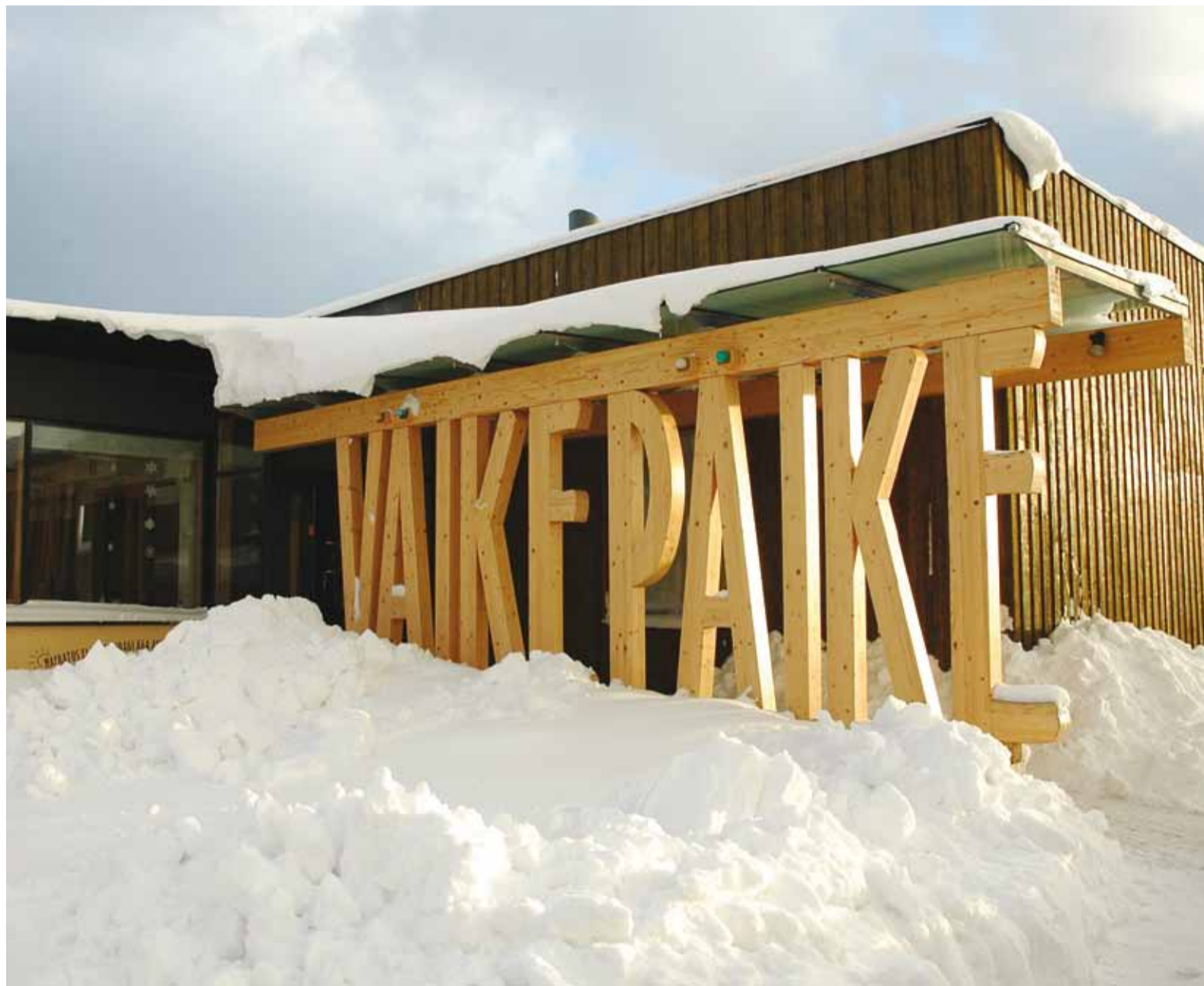
Väike Päike jääb eralasteaiaks, kuid vald maksab lasteaiale iga lapse eest suuremat pearaha – see oli praegu vallale parim ja soodsaim lahendus.