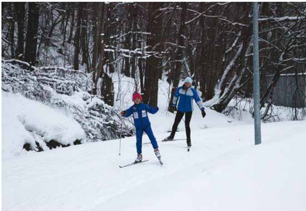
Treeningul tervisespordirajal.