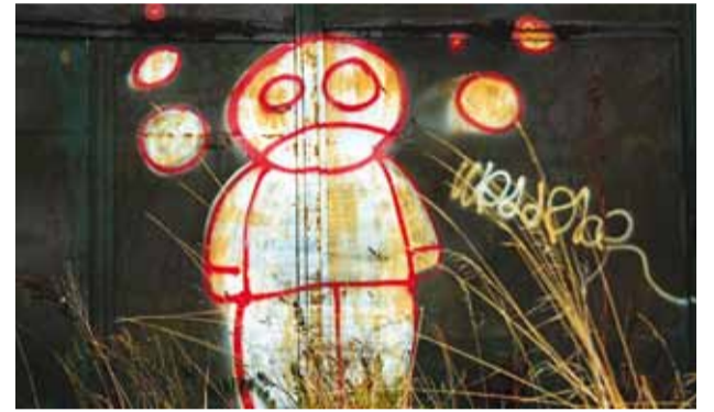
Maailm pole nii lihtne, kui mõnikord näib.

Kui vaadata sõna patti tähendust Eesti õigekeelsussõnaraamatust, siis saame sealt sellele mõistele kaks erinevat seletust. Esimene ütleb, et patt on sõna, mõtte või teoga jumaluse, religioosete ettekirjutiste, usulis-kõlbeliste põhimõtete vastu eksimine. Ja teine ütleb meile, et patt on taunitav tegu, eksimus, süü.