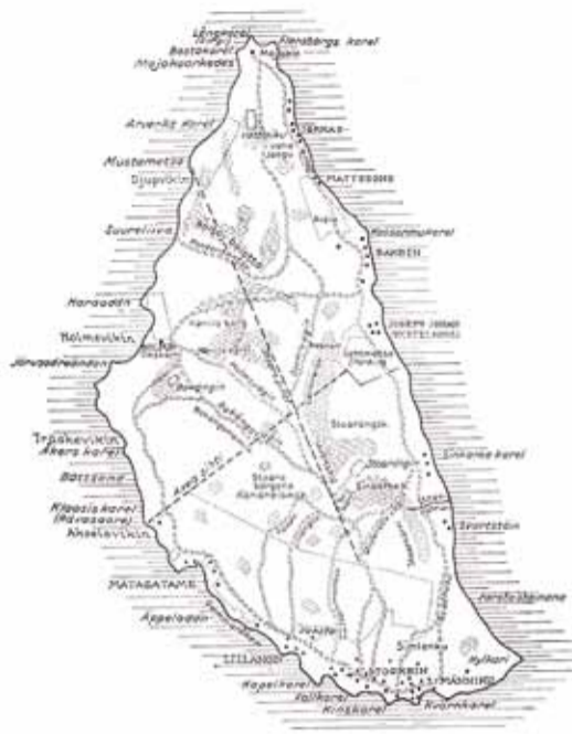
Venemaa kindralstaabi poolt väljaantud Naissaare kaart, mis trükiti umbes 1917. aastal.

Harju maakonnas on Naissaar kahtlemata kõige rootsipärasem koht üldse. Siin elanud kalurid ja lootsid kõnelesid vabalt rootsi