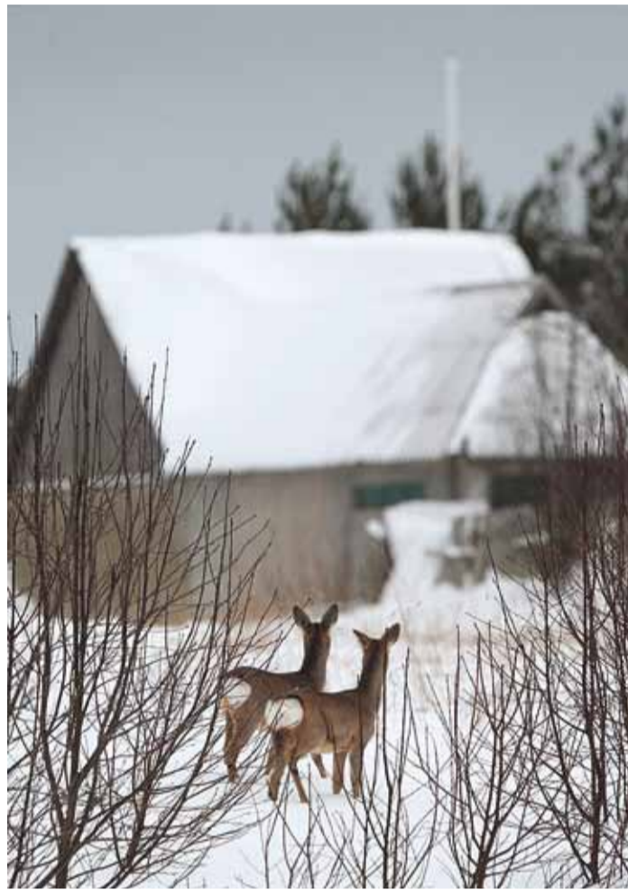
Kitsed kodu vaatamas.

Mitu põhjust. Esiteks, Rohuneeme tipp riivamisi jääb paljude lindude kevadisele sügisesele suurele rändetele. Näiteks üks tuntuim peatuspaik sellel teel on Matsalu. See-ega eriti rände ajal võib kohata väga palju ning erinevaid linde.