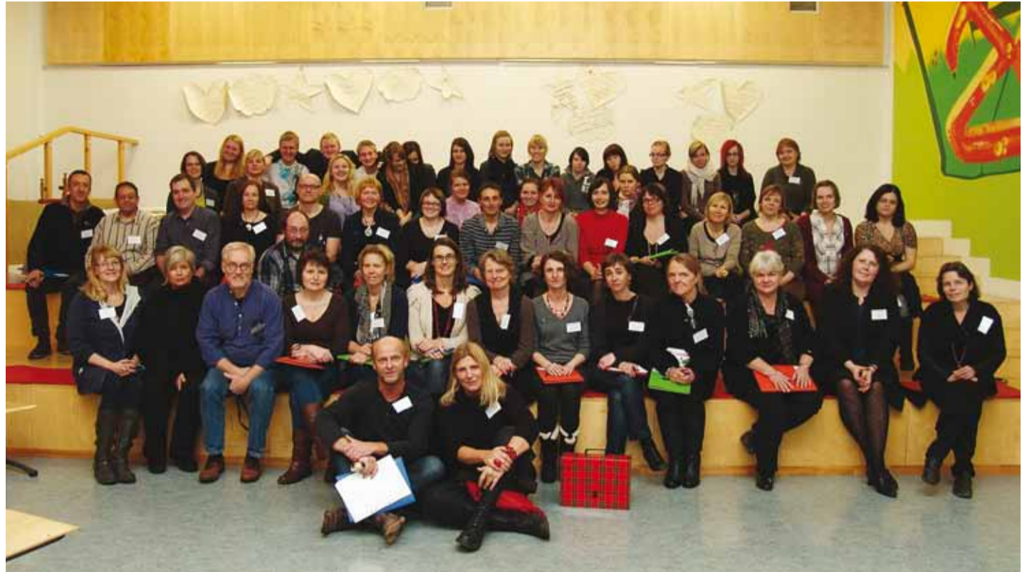
Projektis osalejad, nelja riigi õpilased ja õpetajad.

Sel nädalal võõrustas Viimsi Kool külalisi Soomest, Rootsi ja Prantsusmaalt – kokku 33 õpetajat ja õpilast. Tegemist on Comeniuse koolidevahelise projektiga "Salt and Sugar", mille eesmärk on vahetada kogemusi informatsiooni- ja kommunikatsioonitehnoloogiate (IKT) igapäevases koolitöös kasutamise kohta.