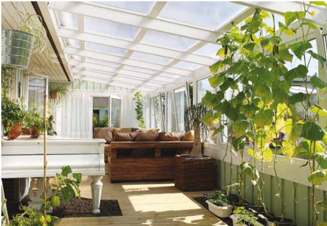
Perekond Taltsi triiphoone pälvis 2009. aastal Parima Öueruumi preemia.

Koostöös Lutheri stuudio-ga antakse teist korda välja ideeauhind parimale tarbeese-