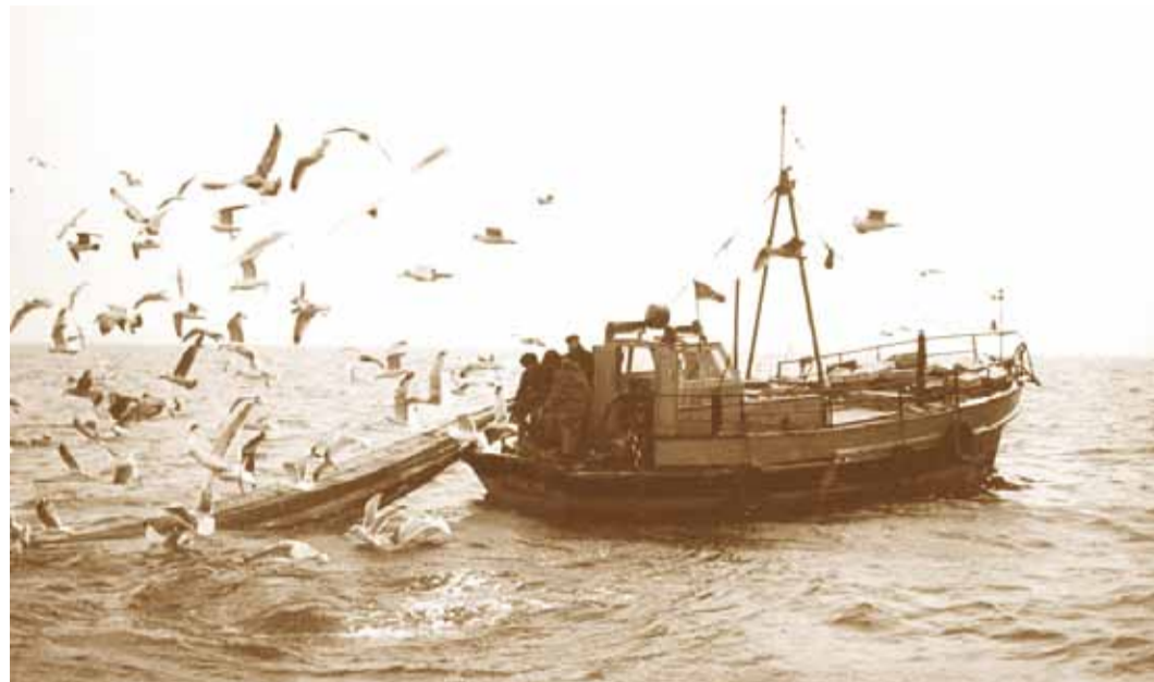
Kilupüük väiketraaliga 1985. aastal. Fotod perekond Ranna kogust

Oma paatide seerias oleme rääkinud mitmetest erinevatest paatidest – ruhedest, haabjatest, erinevatest kala- ja piiritusepaatidest, reisipaate esitukist, naljaka nimega künadest, nahast paadist ja erinevatest plangutus-est. Nüüd teeme juttu paatidest kõige suuremast, mida tahaks õigupoolest välimuse järgi juba laevaks nimetada.