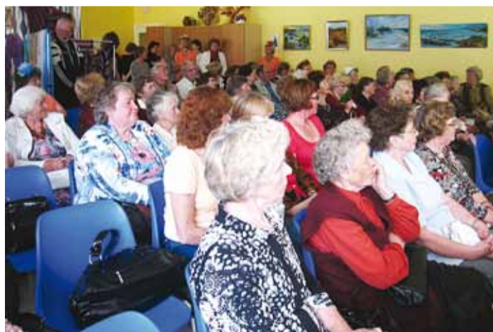
Saal oli viimase pingireani täis.

Teine tõsisestagev statistikanäitaja on Kelami meelest meie negatiivne esikoht reli-