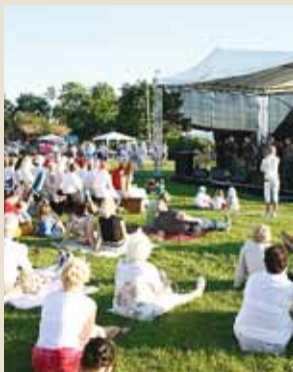
Mõnus õhtu vabas õhus.

Juba kolmandat aastat järjest leiab Viimsis aset Valgete Ööde Festival, kus põimuvad kaunid taluõue kontserdid, head Eesti filmid ja iidne rannarahva kultuur. Kontsertprogrammidega esinevad armastatud artistid Ott Lepland, Lenna, Zetod ja Johansonid. Suurel vabaõhukeeraanil näidatakse Eesti hittfilme "Üksik saar" ja "Uus maailm".