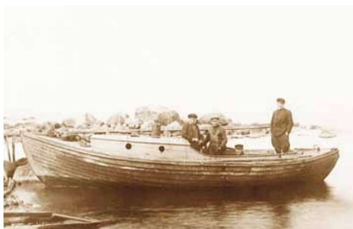
Neeme mehed oma paadiga Aksil kala kokku ostmas, u 1930.

mida Hjalmar arvas: nende kole suurte siibedega, rootsi keeles propelleriga, tegi paat meres head kova vaarti või sõitu. Siibedele ei olegi eesti keeles minu arvates õiget nime leitud, kuigi soome siived on ju eesti tiivad.”