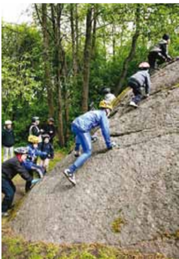
Muuga kabelikivi otsa andis ronida.

Igas läbitud külas ja ajaloolises paigas said retkelised külanemana või meie giidi suu läbi kuulda mõndagi huvitavat, mis selle paigaga ja lähikonnaga seotud. Peatused ja puhkepausid olid Pärnamäel Viimsi esmamainimise mälestuskivi juures, Metsakasti külas Riiasõõdi tamme juures ning siis – nii mõnelegi veel käimata paigas – Muuga kabelikivi juures. Tagasiteel oli kosutav peatus Randvere keskkuses – aitäh Randvere lasteaiade kokatäidele maitsva supi eest!