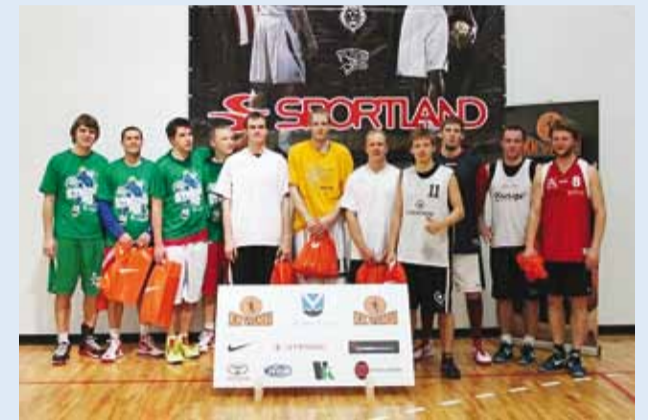
Viimsi 3:3 Korvpalliturniiri esikolmik.