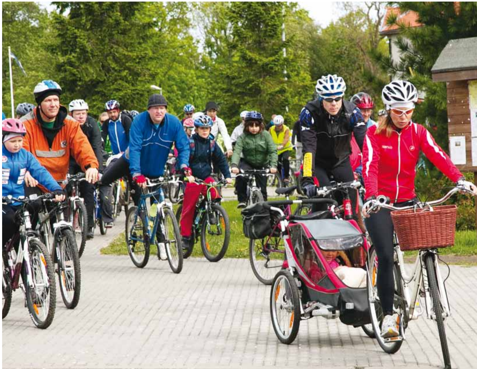
Möödunud pühapäeval toimunud Viimsi Rattaretk – CO 2 Vaba Viimsi kinnitas, et rattahuvilisi vallas jagub.