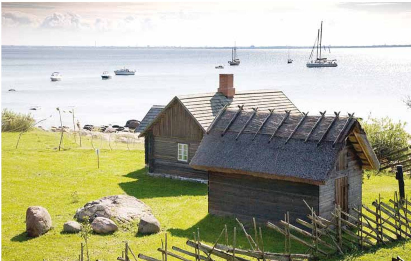
Muuseumi maaliline mererand ja ajalooline miljöö pakuvad külastajatele meeldejävvaid hetki.

Hoiate käes järjekordset Võrgutajat, mis juba päris mitmendat korda on end kodukandi ajalehe vahele mahutanud, et tuua valla-rahvani Rannarahva Muuseumi ja Viimsi Vabaõhumuuseumi uudiseid.