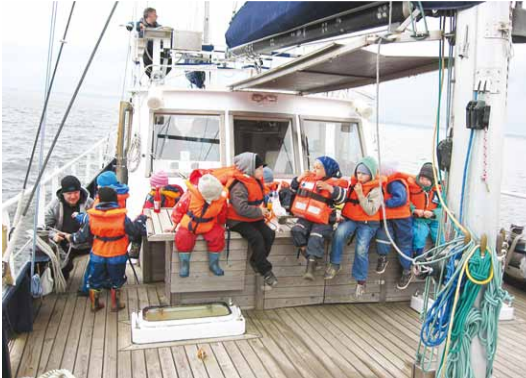
Püüsi Kooli lasteaia lapsed Tallinna lähel.

Mereteekonnal Lennusadamasse nägime kai ääres seismas aurik-jäälõhkujat Suur Tõll, mida veebruaris külasta-