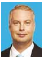
Jan Trei abivallavanem

Vastavalt Eesti Vabariigi haridusseadusele (§ 4) on kohalikul omavalitsusel kohustus tagada koolikohustuslikele õpilastele võimalused koolikohustuse täitmiseks ja pidevõppeks õigusaktides ettenähtud tingimustel ja korras ning võimalus omandada avalikes haridusasutustes eestikeelne haridus kõigil haridustasemetel. Põhikooli- ja gümnaasiumiseadus (§ 10 lg 1) sätestab kohaliku omavalitsuse kohustuse tagada koolikohustuslikele isikule, kelle elukoht asub selle valla või linna haldusterritooriumil, võimaluse omandada põhiharidus.