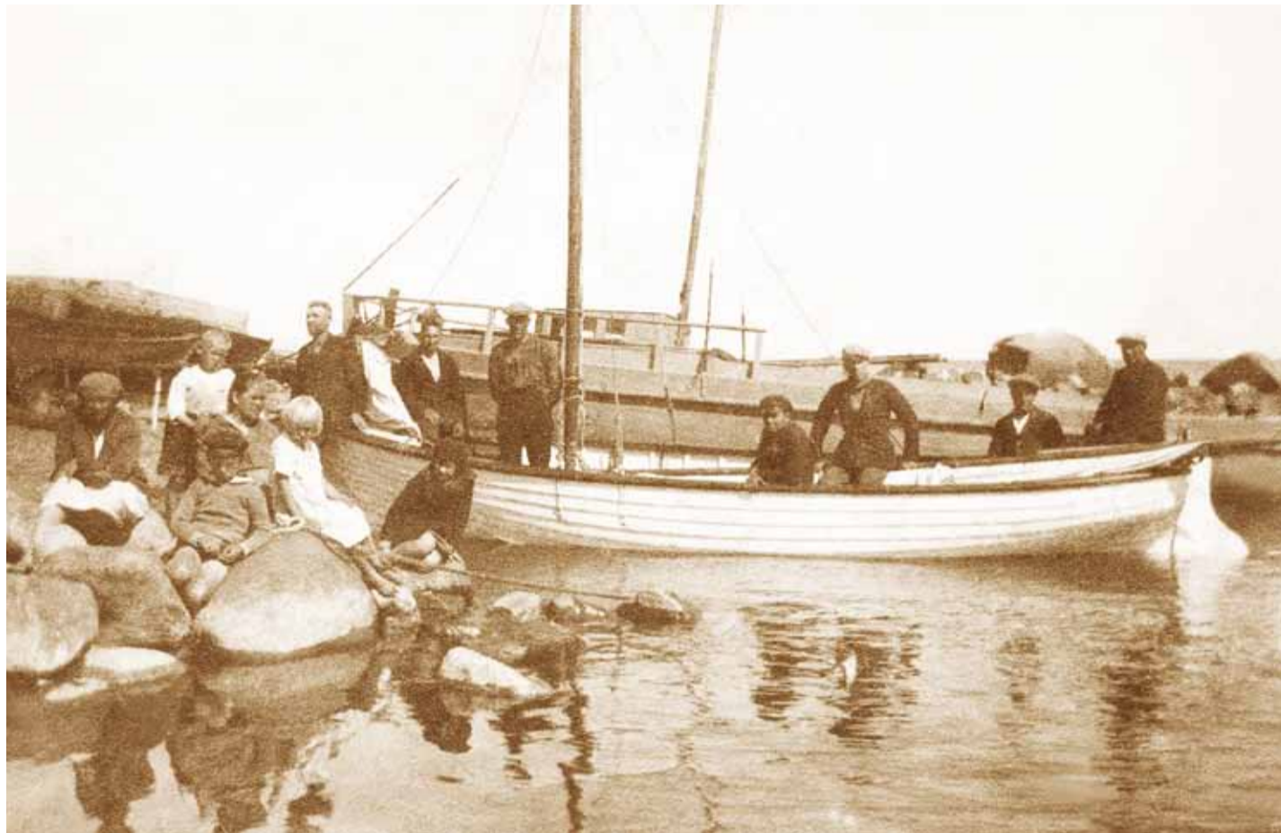
Siin ta on, unistuste rand 1930. aastal: meremootjad on paadiga Aksi-Madise sadamas, kividel istub pererahvas.