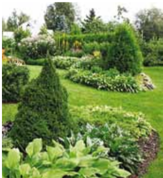
Perekond Rizski koduaed oli 2010. aastal finalist.