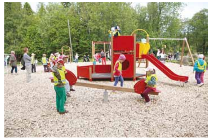
Mänguväljak sai esimese hoo sisse lastekaitsepäeval.

Mänguväljak sai esimese hoo sisse lastekaitsepäeval, mil Püüsi Kooli ning küla lapsed tulid lõbusalt aega veetma. Kokku oli mänguväljaku umbes 130 last, toimusid pallimängud ning õhinaga katsetati ka uut väljakut. Tore on