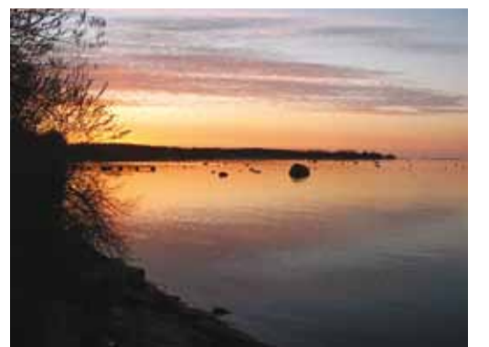
Loojang Tammneemes.

Hea vallarahvas! Kaunis kevadloodus ahvatleb seda fotokaameraga jäädvustama.