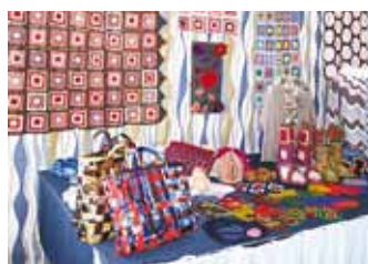
Valik kaunist käsitööd.