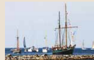
Teel Piritas jahisadamasse.

Möödunud aastal said meresündmused ühe omapärase ettevõtmise võrra rikkamaks – Rannarahva Muuseumi eestvedamisel toimus Tallinna lähel suurejooneline paatide paraad, mis viis alused Tallinna moodsast tsentrumist vanasse kalurikülla Viimsis.