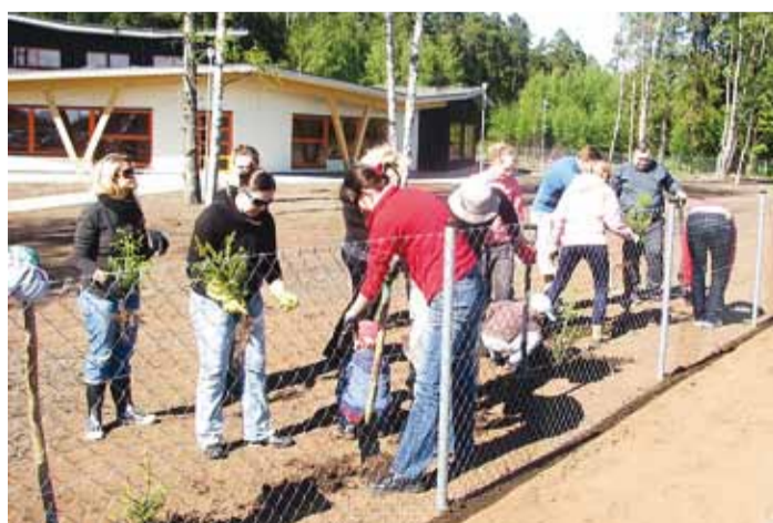
Heki istutamine oli üks uue lasteaia haljastustöödest.

29. mail istutasid lapsevanemad koos võsudega ja vabatahtlikud talgu korras Viimsi Lasteaedadele kuuluva uhiuue Lille teel asuva Laanelinnu maja aia äärde kuuseheki.