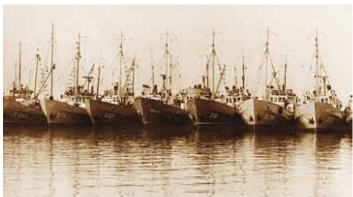
Kirovi kalurikolhoosi traallaevastik Miiduranna sadamas 1973. a.

Rannarahva Muuseumi fotopangas on randlaste elu kajastavaid fotosid ning ranna-