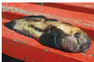
Mudil, mis maitseb õige häa.

Kalurite seas on kala nimemuga mudil olnud nuhtluseks juba pikka aega. Leivaraaha ta ei anna ning enamik sellest kalast läheb põllurammuks. Ometigi on mudilal imehea ja pehme valge liha, millest üsna hõrgu kalaroo saab valmistada.