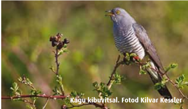
Kägu kibuvitsal.

Käo laulu on kuulnud enamus, kuid kui paljud on kukulindu näinud? Kas teame, millised linnukesed kasvatavad käopoegi? Kirjutan põgusalt oma kohtumisest käo isaslinnuga, kägude ja ühena tema poegi kasvatava tiigi-roolinnu elust.