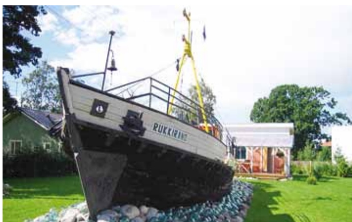
Väiketraalpaat Rukkirand klaasist ujukite merel seilamas.

Nõukogude ajal hakati väiketraalpaate ehitama esialgu Tallinna Laevaremonditehases ning nende valmistamise kõrgaeg langes 1960. aastatesse. Hiljem ehitati neid ka Kolhoosidevahelises Laevatehases. Veel tänapäevalgi kasutatakse püügil sageli väiketraalpaate ja neid ehitatakse juurde. Samas tänu kalakvootidele ja püüginormidele on kalurite arv võrreldes varasemaga hakanud vähenema ning seetõttu langes