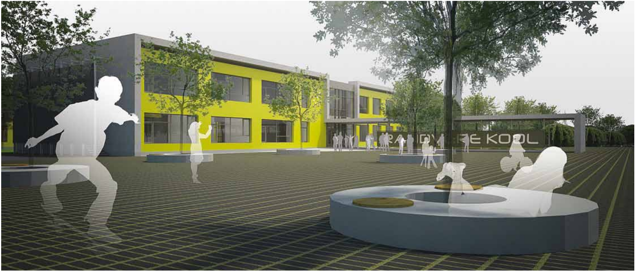
Valdavalt ühepereelamute piirkonda kerkib igati sobilik ja lapsesõbralik koolimaja.