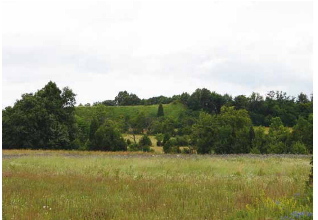
Tõenäoliselt 11.–13. sajandil rajatud Karuse ehk Vatla maalinn.

Esimene väljasõit leiab aset 16. juunil koostöös Oku-