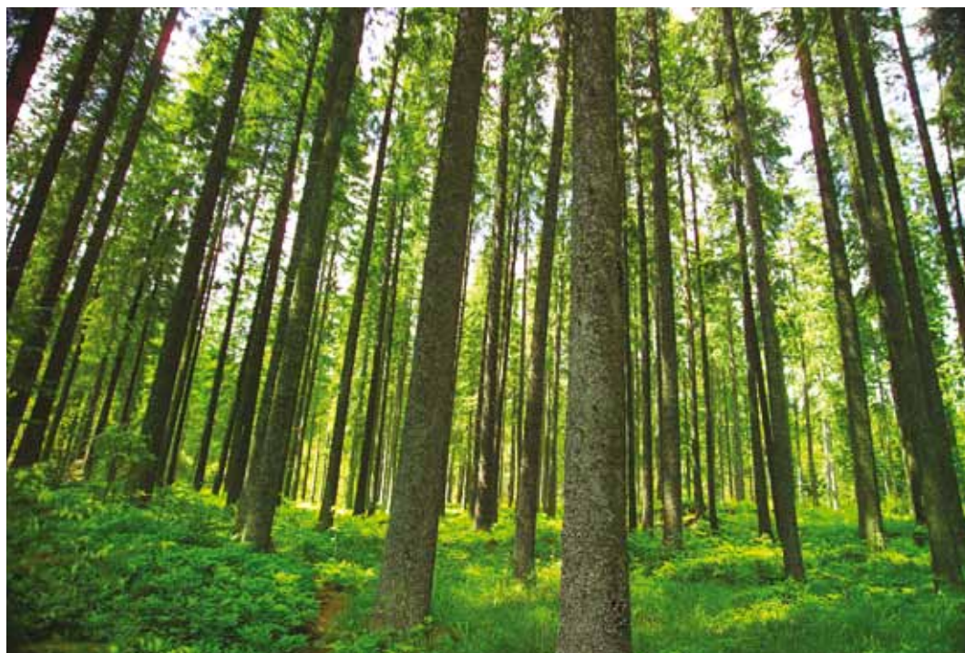
Tööde teostamiseks on aega kaks aastat alates toetuse otsuse tegemisest.

Sel aastal saab 1.–16. oktoobrini taotleda Euroopa Liidu rahadest finantseeritavaid toetusi erametsa majandusliku väärtuse tõstmiseks. Selleks on välja töötatud Eesti maaelu arengukava 2007–2013 metsandusmeetmed 1.5 – metsade majandusliku väärtuse parandamine ja metsandussaadustele lisandväärtuse andmine. Selle meetme alusel annab SA Erametsakeskus erametsaomanikele välja kolme erinevat toetust. Nende eelarve on sel-