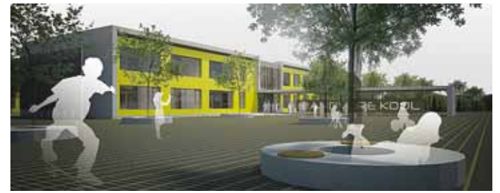
Randvere uue koolihoone eskiis.

Möödunud nädalal said Viimsi Vallavalitsuse tegemised üleriigilise ajakirjanduse kõrgendatud tähelepanu osaliseks (artiklid Äripäevas ja Eesti Päevalehes). Erilist äramainimist leidis käimasolev Randvere Põhikooli riigihanke.