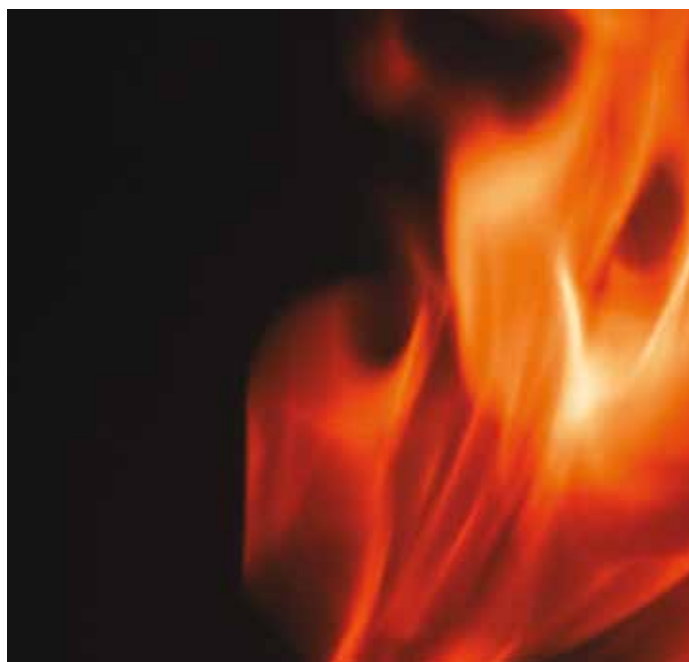
Keegi ei taha oma katusel punast kukke näha

Umbkoldega ahjul puudub kolde all tuharuum, mille kaudu kolle õhku saab. Õhk tuleb koldeesse läbi sisemise koldeukse (tõmbeukse). Enne kütmist tuleb kolle vanast tuhasta puhastada. Kui puud on süttinud, pannakse tõmbeuks kinni, välisukse jääb lahti. Kui kütus 10–20 minuti pärast intensiivselt põleb, võib välisukse koomale lükata. Välisukse võib sulgeda alles siis, kui leeki pole näha ja ahju on jäänud vaid hõõguvad söed. Siibri võib sulgeda paarkümmend minutit pärast ahju välisukse sulgemist. Soovitav on jätta väike pilu, mitte siiber täielikult sulgeda. Restkolde puhul suletakse koldeuks täielikult, kui puud on üleni leekides. Kolle saab õhku läbi tuharuumi ja resti.