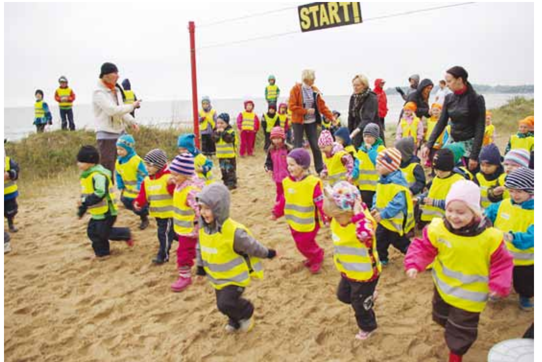
Viimsi IX rannajooksu start.

Jooksma oli tulnud 26 rühmatait lapsi Viimsist Aegviiduni. Lastele meeldivad väga traditsioonid – kes kord juba rannajooksul käinud, tahab järgmisel aastal kindlasti uuesti tulla. Aasta jooksul arenevad lapsed väga palju edasi, kiirust