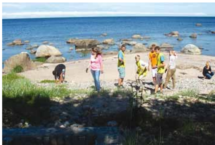
Õpilasmaleva I vahetus Pranglil.

Ühel õhtul käisid külas Eesti Lastekaitse Liidu noortekogu inimesed, kes viisid läbi foorumteatrit. Foorum-ehk sotsiaalteatri käigus said noored ise teatritükis osaleda ning muuta tegelaste käitumist nii, nagu nad õigeks arvasid. Teatris käsitleti noortepäraseid teemasid suitsetamisest, koolikiusamisest ja pösktubakast. Foorumteater oli kaasakiskuv ja kujunes üheks toredaimaks vaba aja ürituseks.