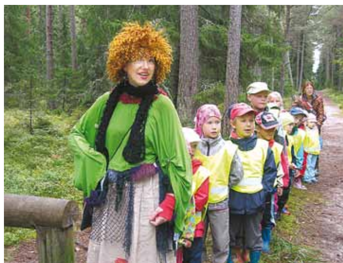
Trolli-Tiinaga koos põneval matkal.

Nii juhtuski, et ühel sumedal septembripäeval saatsid Kombu ja Misse lapsed metsa matkama. See mets polnud aga mingi tavaline mets. Kohe al-