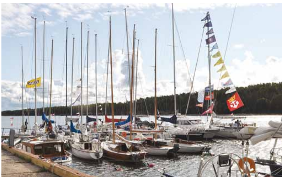
Purjepaadid sügiseses Naissaare sadamas.