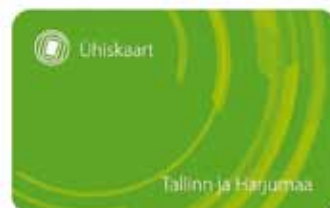
Ühiskaart on plastikust ning sama suur kui pangakaardid.

- Internetist ostes sisesta ühiskaardi number veebilehel www.pilet.ee. Internetipangast