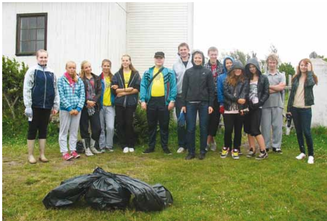
Viimsi õpilasmaleva II vahetus Pranglil.

Pärast väsitavat tööpäeva oli noortel võimalik osaleda vaba aja tegevustes, mida viis läbi MTÜ Viimsi Huvikeskuse Noortekeskus. Toimus tutvumisõhtu, mille käigus said malevarühma liikmed omavahel tuttavaks ja nii mõnigi noor leidis endale häid sõpru. Toimus filmiõhtu, kus noored said lõõgastuda ja vaadata mõnda toredat komöödiafilmi. Peeti maha ka tasavägine linnamäng, mille käigus tuli vallas seigeldes leida üles küsimustes olevad kohad ning enda meeskonda selles kohas ka pildistada. Punkte sai nii õige koha leidmise eest kui ka pildi huumorikuse eest.