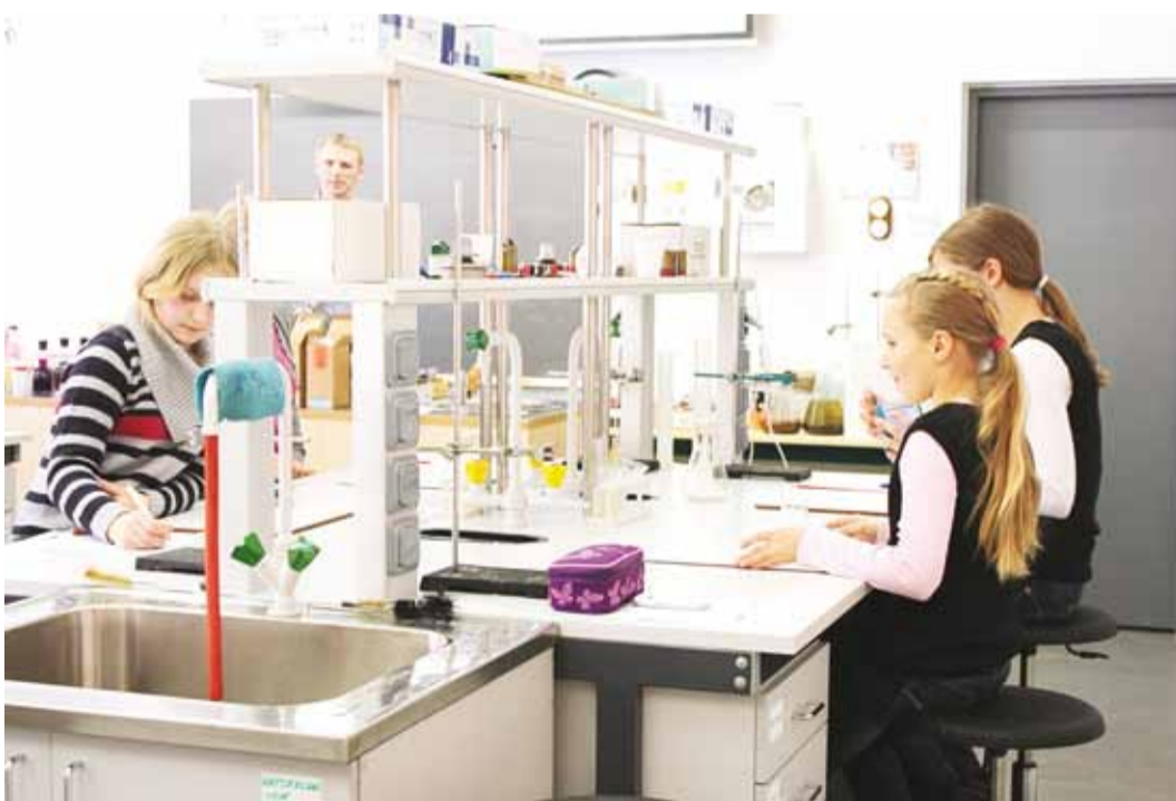
Nutilaboris saavad teadmishuvilised lapsed ise katseid teha.

"Tundi alustan alati väikesest teoreetilise sissejuhatus-