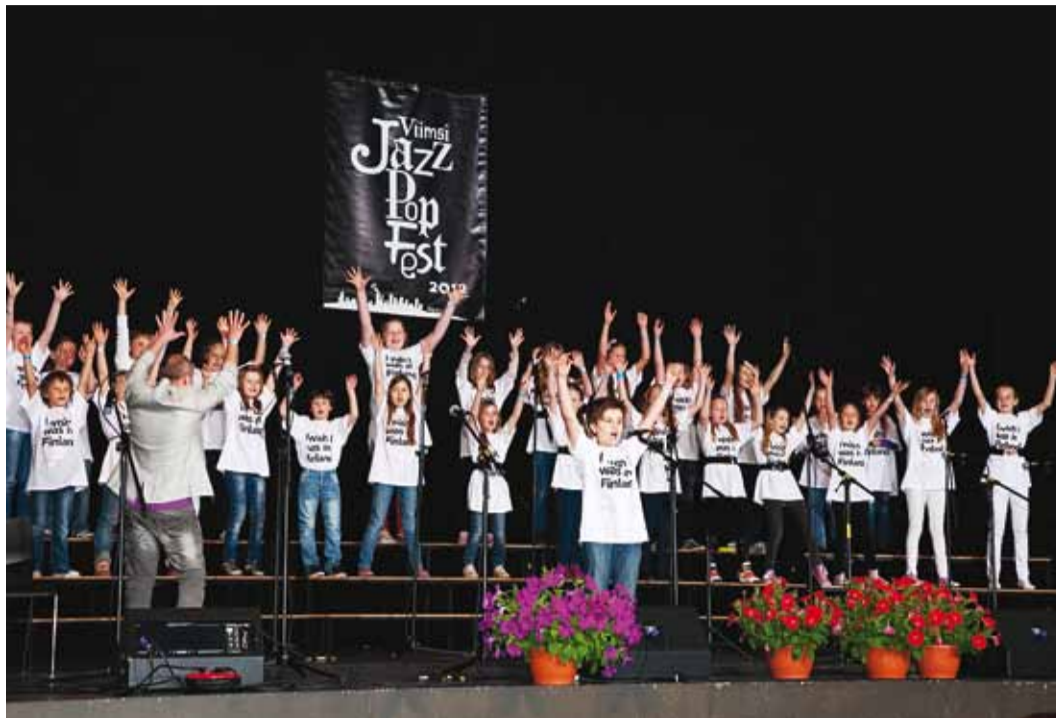
The Musical Robbers Viimsi JazzPopFestil 2012. aastal.