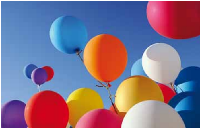
Sünnipäeval olgu lusti ja rõõmu.

Alati kui lapsed saavad vanemaks, ütlevad vanemad inimesed – issand, kuidas see aeg ikka lendab, nüüd oled juba nii suureks kasvanud. Kui vanemad inimesed saavad vanemaks, räägitakse ajast ja aastatest, mis kaovad nii kiiresti. Sama võib öelda ka meie Viimsi valla kohta. Taasiseseisvumisajast on ta kasvanud nii kiiresti, samas Viimsi valla asutamisest möödub juba 94 aastat.