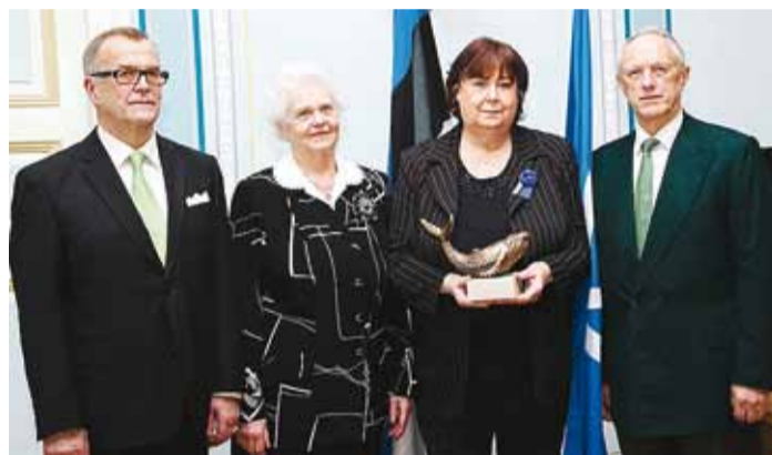
Viimsi Pensionäride Ühenduse juhtkond valla kõrgeima autasu – Viimsi Vaalaga.

"Nakatage oma positiivsust ka teistele eakatele," soovitas Robas. "Teil on teistele väga palju anda."