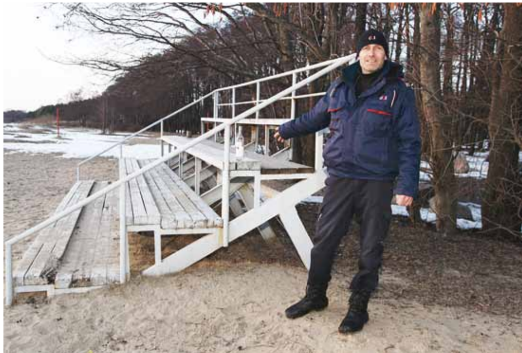
Rannas ärkab elu sooja saabumisega. Siis vahetab oma baseerumiskohta ka turvafirma patrull – rahvarohkemad kohad nõuavad rohkem tähelepanu.

Koostöö turvalisuse tagamiseks Viimsi vallas turvafirma