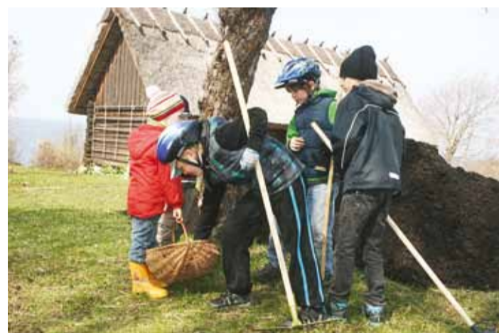
Väikesed talgulised Vabaõhumuuseumis.

Talgulistele pakume tutvustuseks killukese rannatalu lugu, selgitame, mis imeasi on museaal ja miks Kingu rannatalu kuulub muinsuskaitse alla. Sellele järgneb mõnus füüsilise tegevust värskes õhus. Kehakinnituseks maitsev kalasupp.