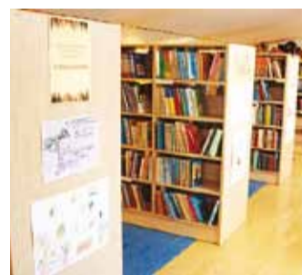
Joonistused ja raamatud koos.