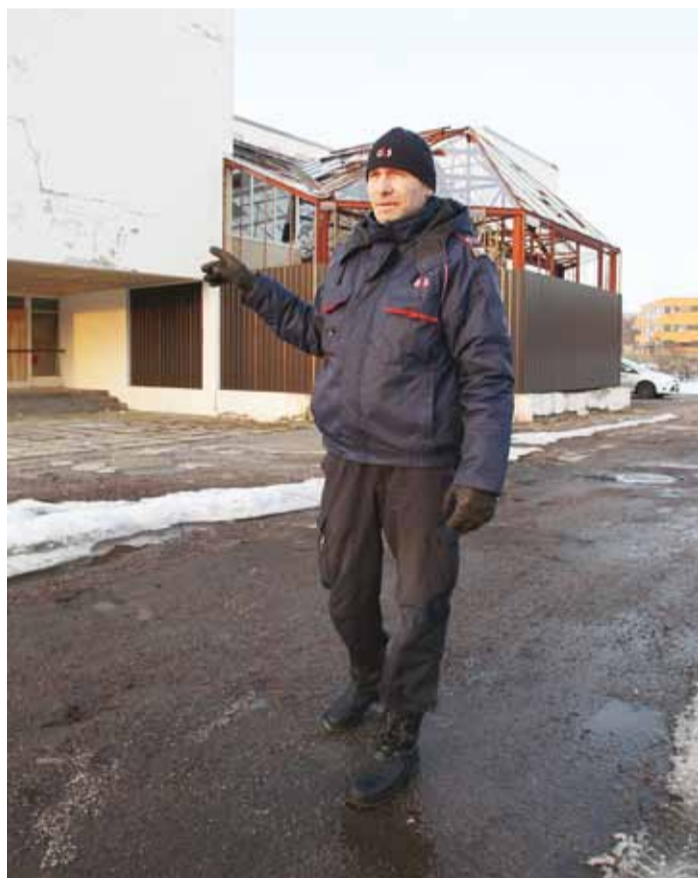
Tühjalt seisev vana kool meelitab teismelisi, paraku ka aknaid lõhkuma.

G4S Eesti ja valla vahel on hästi toimunud juba 11 aastat. Esimene turvateenuse osutamist puudutav leping sõlmiti 2002. aastal. Kokkulepet on asjaolude muutudes uuendatud, kuid olulisemad punktid on jäänud alati samaks.