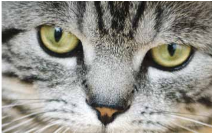
Kass ei või kõndida oma-pead.

Kuidas peaks käituma inimene, kes näeb, et lemmikloom (kass või koer) on omanikuta avalikus ruumis, näiteks tänaval? Mida ta peaks tegema juhul, kui selle lemmikloomade omanik on teada (elukoht, telefoni number, meiliaadress), ja mida siis, kui omanik on teadmata?