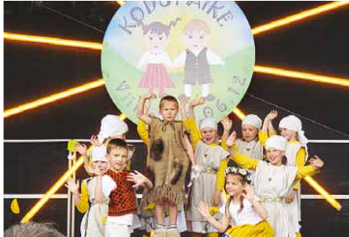
Mullu peeti laste tantsupidu Viimsis.

Nii alustavadki eelkooliealised lapsed oma pidu rongkäiguga, millele järgneb tantsuosa. Eelmisel aastal andis loominguline meeskond rühmadele ette peo teema ja selle järgi tegi iga rühm oma seadega tantsu. Sel aastal jaotati rühmad peo teema "Meie päev" alusel gruppideks ja neile anti ette muusika. Peo teemaga "Meie päev" näitavadki lapsed oma päeva kulgu. Muusikaline kujudaja on Venno Loosaar.