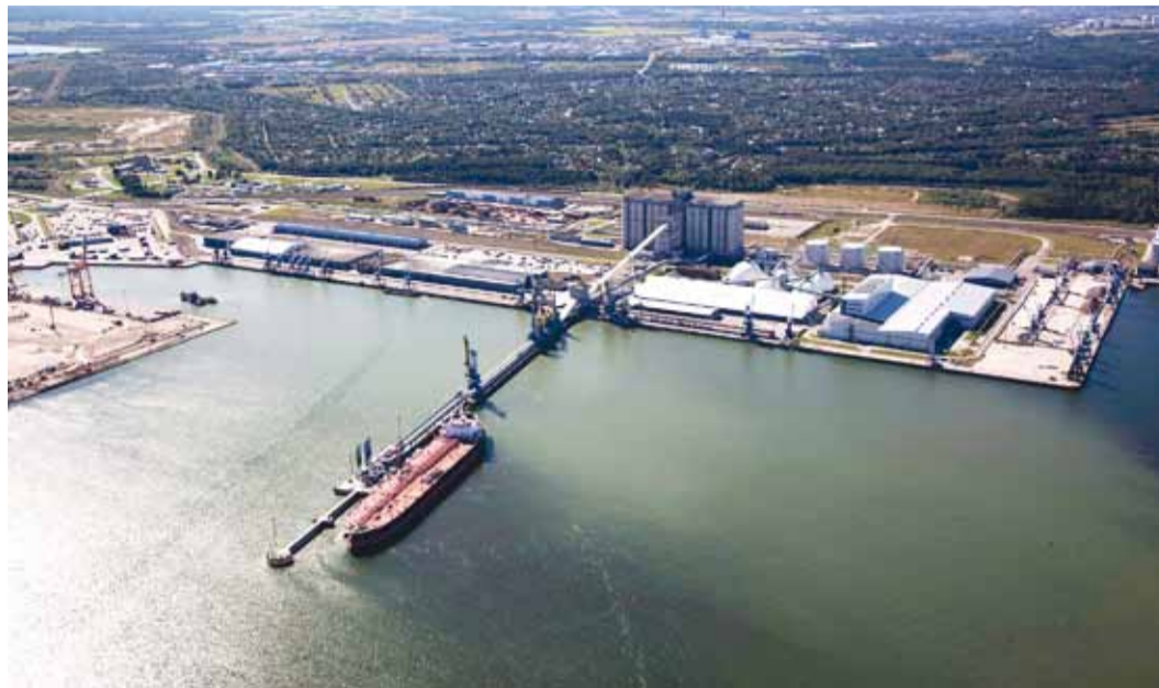
Muuga sadama ehitusloa andsid kohalikud omavalitsused. Praegu oleks tingimused teised.

Tallinna Sadam on täitnud talle esitatud nõuded, mis hõlmavad Randvere supelranna vee kvaliteedi mõõtmist ja müratõket. Muugal on kaks õhuseirajaama ning rajamisel on kolmas. Sõeterminal, mis ebameeldivat lõhna eritas, on kaks aastat olnud sõeta. Uus IT-lahendus võimaldab veebirakendusest näha tuule suundi ja kiirusi. Koostöös Muuga päästekomandoga on hangitud kaasasõidetehnikavahendid suurõnnetuse puhuks. Sadam on sõlminud vastutuskindlustuslepingu 10 miljoni