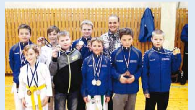
Viimsi võidukad poisid.

7. aprillil toimusid kimura shukokai karate Eesti meistrivõistlused, kus Viimsi poisid võitsid 13 medalit.