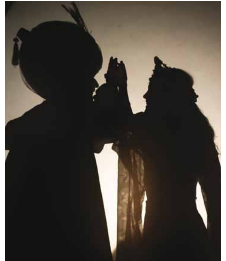
Hetk Varjude teatri etendusest.

Osatäitjad: Anastasja Vögornitskaja, Natalja Efreмова,