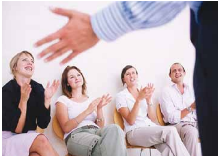
Mentorprogrammi sihtgrupp on MTÜd.

Mis mentorprogramm õigupoolest on? Oleme sellest küll kuulnud, kuid kas ka kogunud? Mentorlus ei toimu ainult programmi korras – ilmselt on meil kõigil mõni eeskuju, kellega vestlusi naudime ja kes meid igakülgset arendavad. Siiski on olulisel kohal ka mentorprogrammid, mis paigutuvad suuremasse taustüsteemi ning annavad osalistele aimu olulistest tulevikusuundadest.