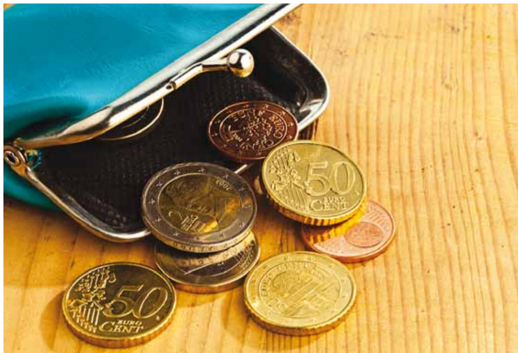
Osa toetusi sõltub pere sissetulekust, osa mitte.

2014. aastal on toimetulekupiir üksi elavale inimesele