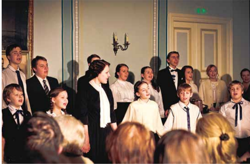
Laval on pea kogu näitetrupp.