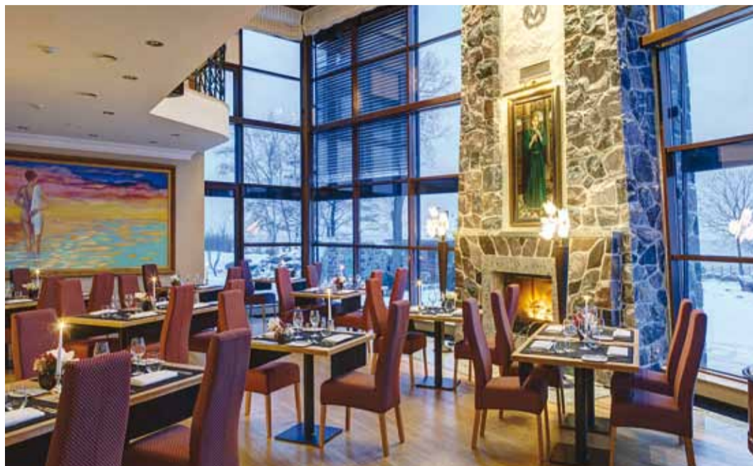
Restorani akendest avaneb igal aastaajal lumvav vaade.

Maja siseruumide kohan-damine restoraniks ei nõudnud suuri ümberkorraldusi. Natu-