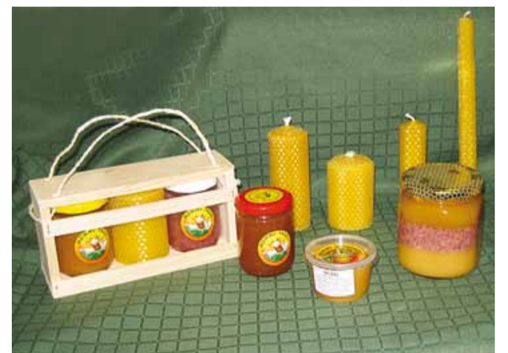
Lisaks meele müüakse mesindussaadusi.

Naistepäeval on palju huvitavat ja kasulikku naistele, kes saavad teadmisi ja oskusi tasuta loengutel. Õpetatakse mee kasutamist koos ravimtaimedega, räägitakse mesilavaha ja meetoote kasulikest omadustest.