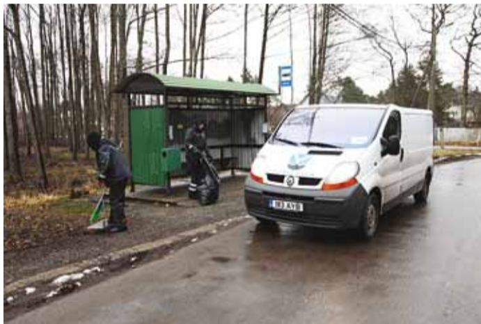
Valla heakorrrabrigaad töö.

Rõõm sünnitab rõõmu ja kurjus kurjust – sama kehtib ka heakorra osas. Eeskujulikult korras, puhtale ja niidetud alale kukuvad krõpsupakid ja õllerpurgid harva. Küll aga mõjuvad nimetatud materjalile lausa magnetina räämas ja hooldamata aiataagused, teeperved ja heinamaad – hooletus sünnitab hooletust. Valla heakorrrabrigaad käib iga päev läbi kõik teeperved, parklad, bussipeated ja muud valla omandis kinnistud ja koristab need. Siit