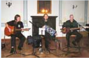
Põldsepp ja Pojad.

Sõjamuuseumis tähistati Eesti Vabariigi sünnipäeva päevakohase kontserdi ja fotonäitusega.