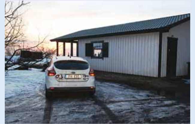
G4S valvab Viimsi valla territooriumil.

Teisipäeva, 25. veebruari õhtul aitas Viimsi patrullis olnud G4Si turvatöötaja koos Viimsi elanikuga ranna lähedal märga liiva kinni jäänud poisi ohutult koju.