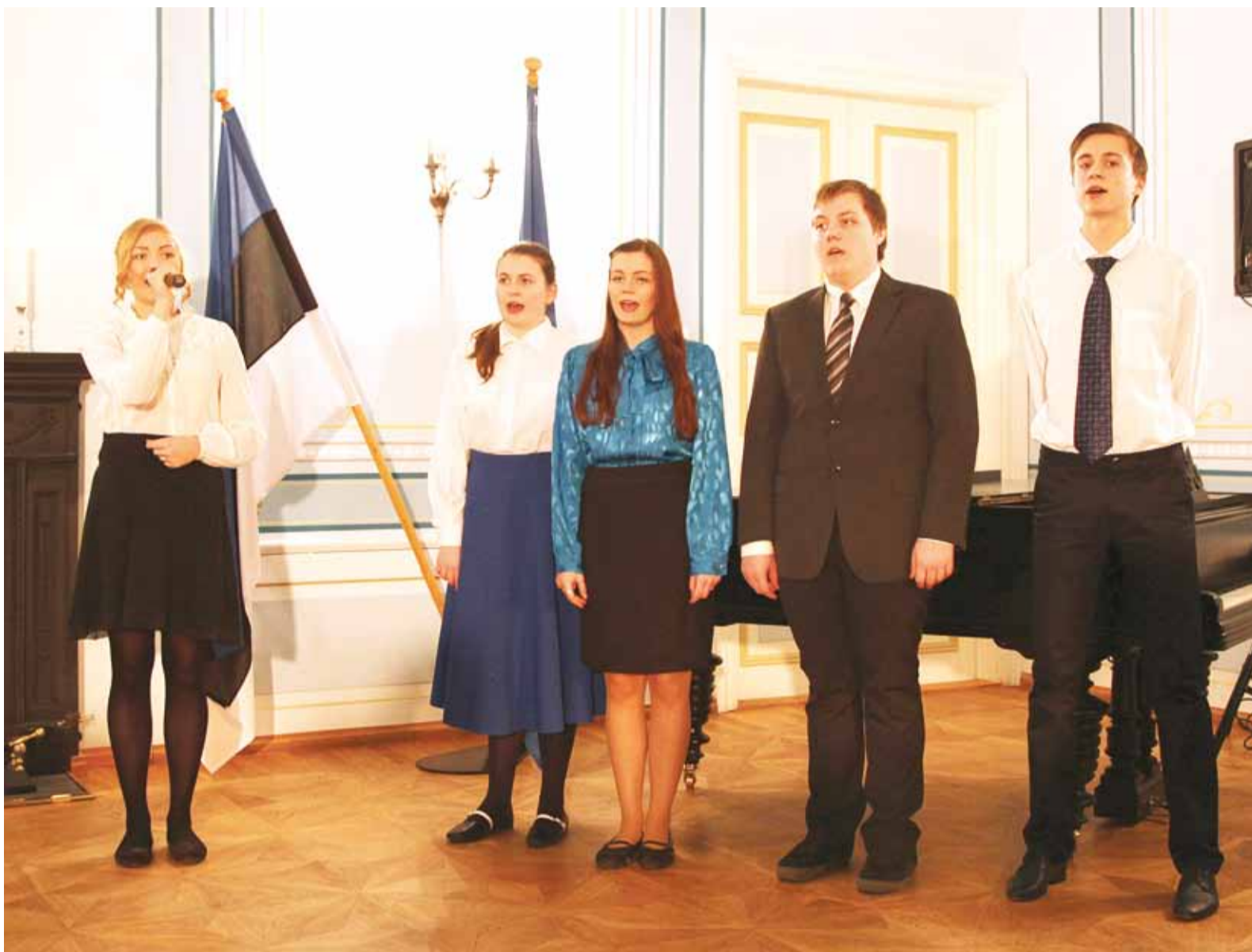
Eesti Vabariigi 96. sünnipäeva tähistamisel esinesid Viimsi Kooliteatri õpilased.