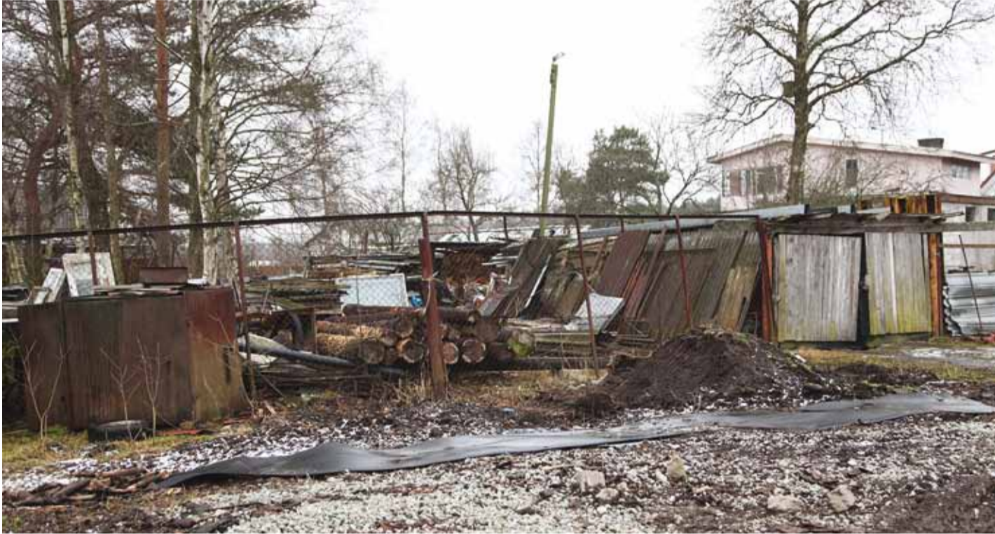
Kus on omaniku silmad?

Üürike talv paistab selleks korraks otsa saanud olevat ja heakord on kommunaalvaldkonnas jälle igapäevaseks teemaks saanud. Ei möödu päevagi, mil keegi valla kommunaalametisse ei pöörduks, et ametnike tähelepanu räämas kraavipervedele, metsa alla poetatud prügihunnikutele või ka naabri lagunevale aiale juhtida.