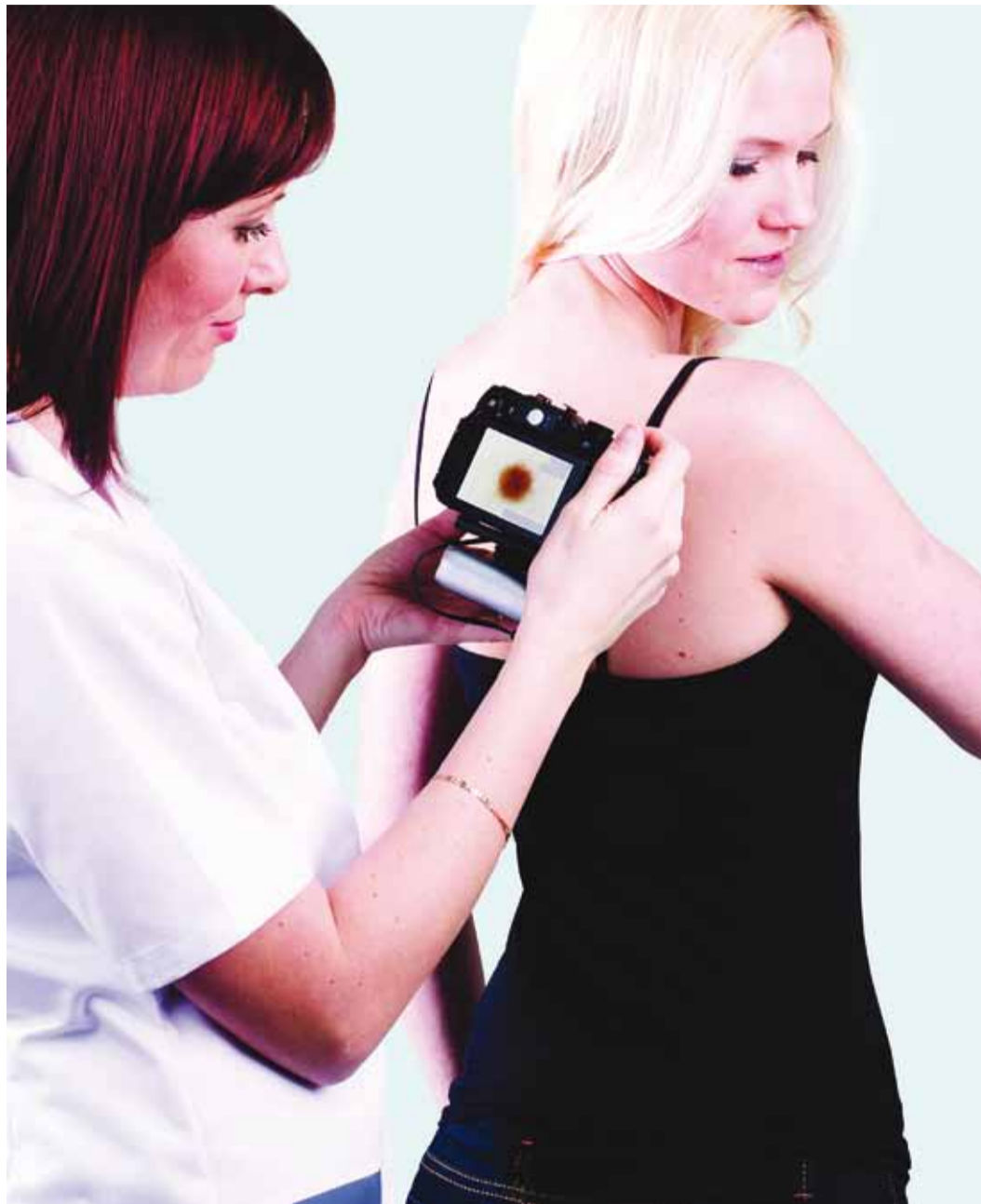
Teledermatoskoopia võimaldab nahakasvajaid kiirelt ja mugavalt diagnoosida.

Uuring viiakse läbi dermatoskoobiga, mille mikroskoop ja valgussüsteem võimaldab näha selliseid naha pinna aluseid tunnuseid, mis tavaliselt ei ole silmale nähtavad. Diagnostiline meetod dermatoskoopia võimaldab näha naha morfoloogilisi struktuure, mille hindamine on eriti oluline nahakasvaja varases, kliiniliselt minimaalsete muutustega arengustaadiumis.