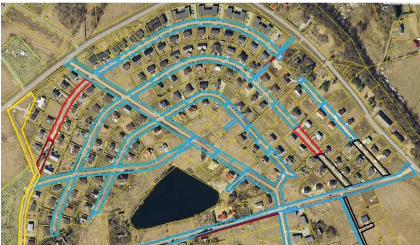
Pärnamäe teede omandisuhted 2014. a märtsis.

Pärnamäe külas kuuluvad firmale Fuxia Holding, kelle valduses olevad teelõigud on märgitud mustaga. Läbirääkimised Fuxia Holdinguga on käimas, vallavalitsus on firmale teinud erinevaid lahendusettepanekuid teede avalikuks kasutamiseks. On alust loota, et ka selle omanikuga saavutatakse rahumeelne kokkulepe ja võime Pärnamäe teede lahingu lõppenuks lugeda.