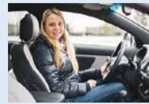
Anett ja tema Kia.

AS Viking Motors esitles 27. veebruaril uuenu- nud Kia Sportage'it Männiku libedasõidurajal. Tennisist Anett Kontaveit sai selle auto Viking Motorsilt ning ühtlasi sooritas oma uue autoga libedasõidu harjutusi.