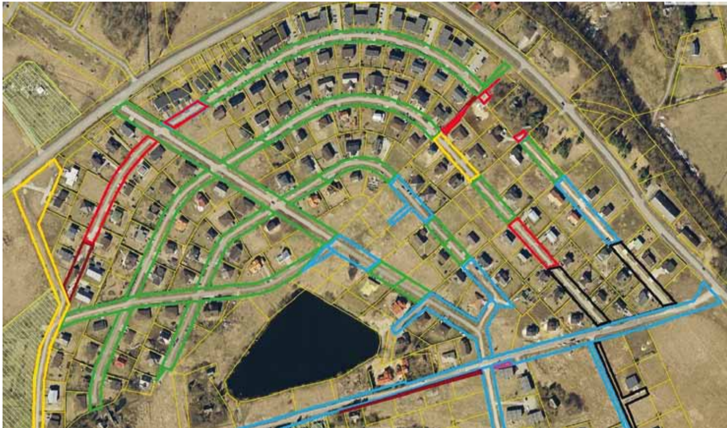
Pärnamäe teede omandisuhted 2013. a. detsembris.

aastalõpul ainsad probleemivabad teelõigud. Punasega märgitud teelõigud kuulusid juba likvideeritud ettevõtetele. Mustaga märgitud teed olid juba läinud Fuxia Holdingu omandisse. Rohelisega märgitud avalikult kasutatavad teed läksid avalikule enampakkumisele. Pärnamäe küla elanikke vooris vallamajja, murelikud palusid abi ja vihasemad nõudsid oma õigusi.