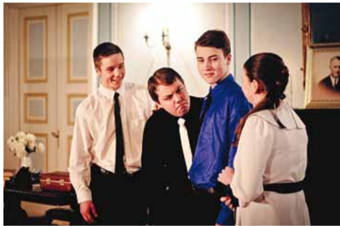
Noored näitlejad mängisid veenvalt.