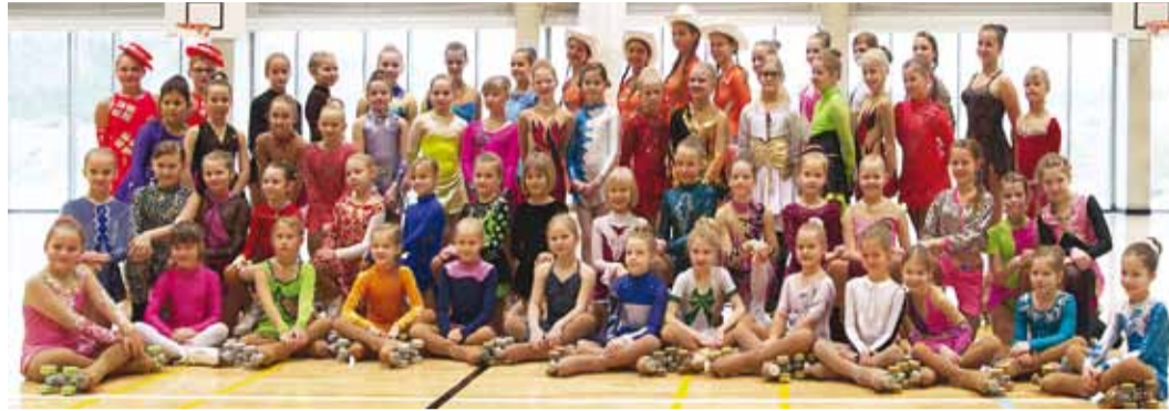
Rulluisuklubi Rullest ilu-rulluisutajad.

2002–2001 edasijõudnud: 1. Caroline Varak. 2003–2004 edasijõudnud: 1. Elis Ronk.