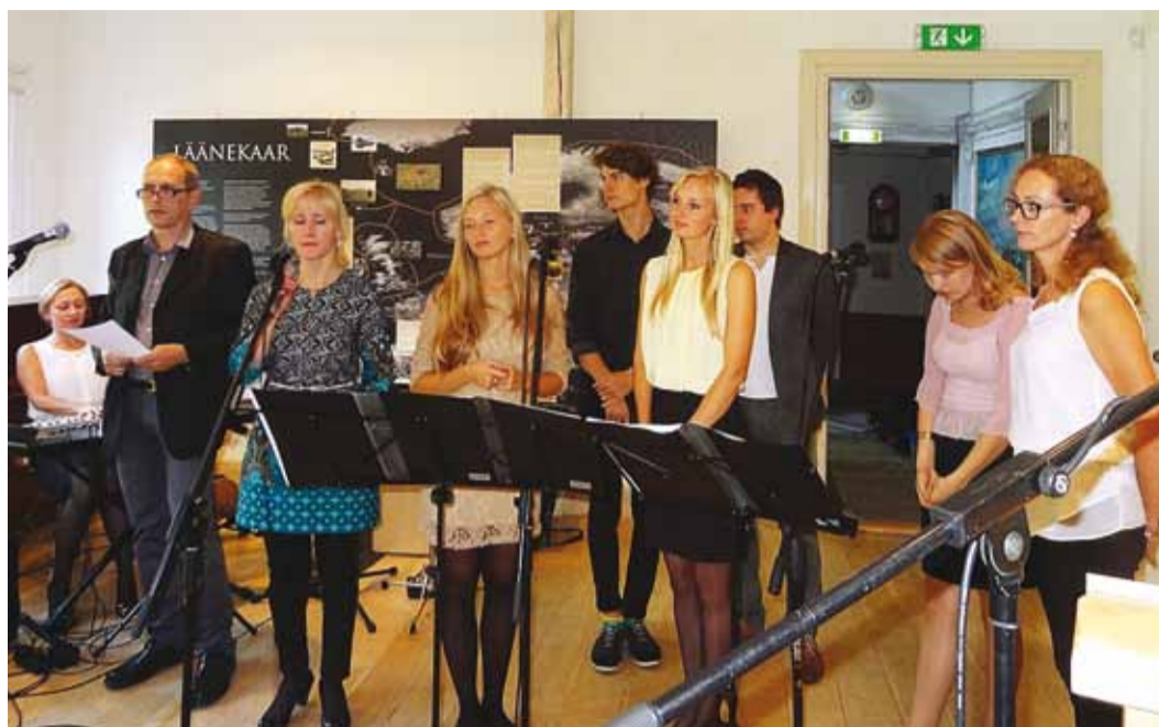
Mõttetiheidaid ettekandeid sidus Oleviste koguduse vilistlaskoori esinemine.