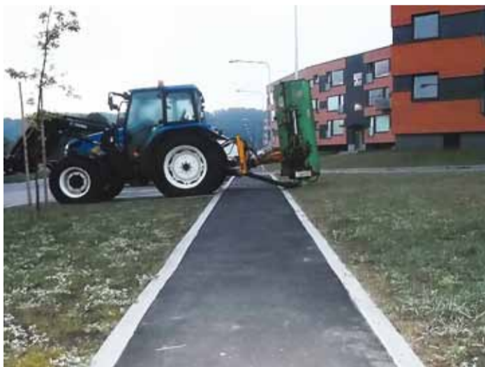
Vales kohas parkimist jääb üha vähemaks.