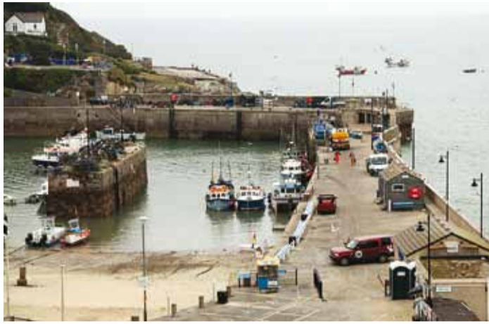
Hommik Newquay kalasadamal.

Teisel päeval liikusime 17 000 elanikuga Brixhami kalurilinnas, mille keskmeks on sadam. Hoonestus paiknes kaarjalt ümber sadama, asudes osaliselt mägedes. Sadamas olid kalaturg, kalapoes, restoran, traallaevastik, jahi-, reisi- ja paadisadam. Sadamaala oli elanikele avatud, nii kalakai, huvikai kui ka reisi- kaid olid kõik ühes kohas. Aiaga oli piiratud vaid suurte traalide ala, kus toimus kauba laadimine ja traalerite remont. Kaile olid