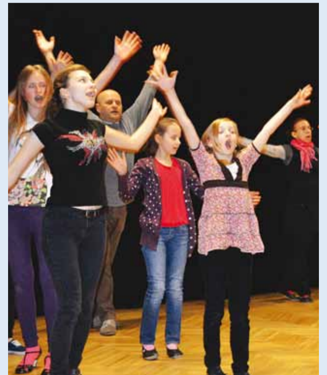
Kõik stuudiolased pääsevad lavale.