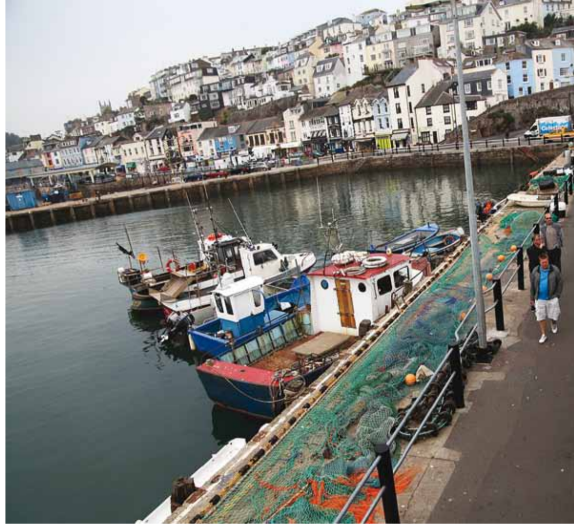
Vaade Brixhami sadama vaateplatvormilt sadamale ja linnale.

Teise päeva lõpuks jõudisime juba pimedas Inglismaa läänerrannikul asuvasse Newquaysse. Hommikul vara linna avasime minnes külastasime ligi 140-aastast Newquay sadamat, kus tegeleti nii kala-, krabi- kui ka vähipüügiga. Sadam asus linna keskmest eemal, kuid ko-