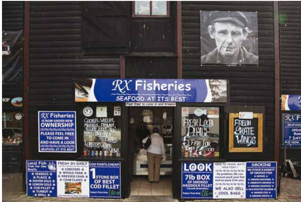
Tüüpiline inglise kalapood täis silte ja reklaame, paremal ülal ühe kohaliku kaluri foto.

Viies päev algas Brightonis kail – tegu on üle saja aasta vanuse Merepalee nime kandva ookeanikaiga, mis rajatud sadade postide otsa. Kail tekitab tootlustus- ja meelelahutusasutusi, kümnetelt vaa-