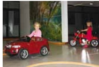
Tüdrukud on liikluses sama osavad kui poisid.

Suuremat kasvu pidulised saavadki sõita elektriliste tõukeratastega, mille kaalupiiranguks 70 kg. Seda võimalust on juba mõnuga kasutanud mitmed