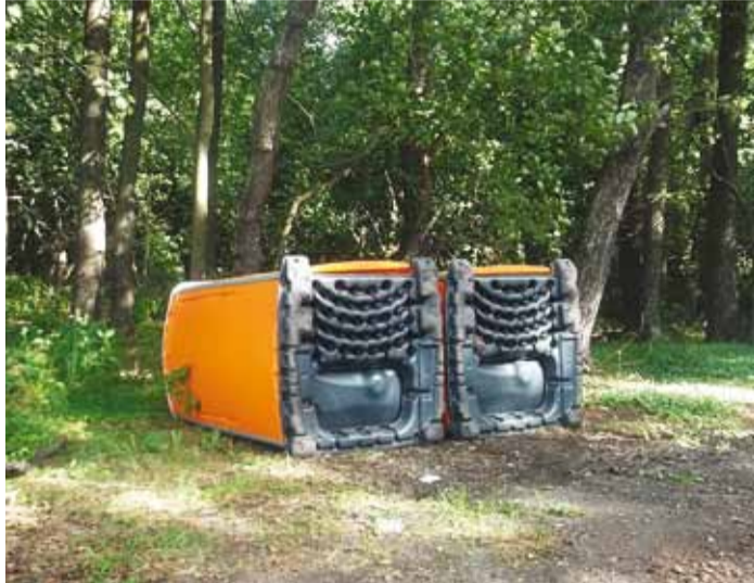
Kurikaelad on välikäimlaid kasutanud mittesihipäraselt.

Kolmel korral tuli patrullil sekkuda ka liiga kärarikaste ja naabreid segavate pidude ohjeldamiseks hilisõhtusel ajal. Tabatud on üks varas tankla lähistel ja ka üks taksotele külma teha soovinud isik, lahendatud üks kaklus rannabaaris ning üks vägivaldsele kiusamisele viitav arusaamatus koolinoorte vahel. See, et taolisi juhtumeid pole palju, näitab, et Viimsis