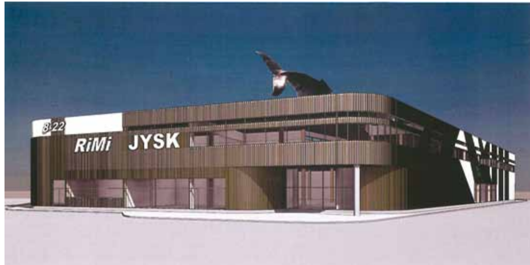
Randvere tee 9 kaubanduskeskus. Täna Viimsi Marketi lammutustöödega on juba alustatud, et avada juunis 2015 samas kohas uus kaubanduskeskus.

Keskuse teisele korrusele on projekteeritud büroopinna, mis soodustavad ettevõtete tulemist Viimsisse. Et vähendada maapealset autode parkimisvoogu, rajatakse kauplusehoone alla parkla, mis peaks mahutama u 200 autot.