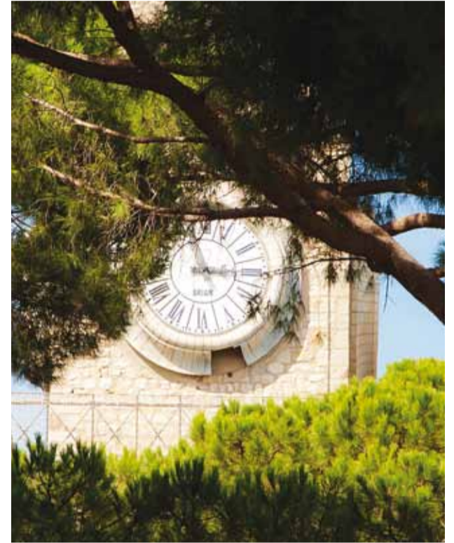
Kell on kõigest ajanäitaja.

Üks tänapäevase elu ja maailma suurimaid paradokse on aja kiire möödumine. Igas päevas jääb meil puudu mitmeid tunde, kõiki toimetusi ei jõua ära teha. Nii kasvab üha pinge ja soov, et päevad oleksid pikemad ja jaksu rohekem.