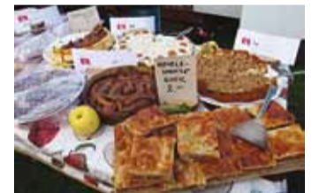
Õunakooke igale maitsele.

Lubja ja Pärnamäe külad pakuvad oma kohvikus pannkooke ja teenisid sedasi raha järgmiseks ühisjaanituleks. Õunapuustikuid ma ei märganud, kuid see-eest müüdi taasviljuva vaarika ‘Polka’ taimi. Noore õunapuud asemel võis koju viia šokolaadi pistetud õuna.