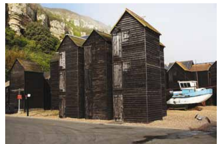
Võrgukuuride "linnaosa" Hastingsi sadamaalal.

Hastingsist sõitsime Rye linna, kus vaatasime jõesadamat ja sealseid käigusildasid. Ööbisime Folkestone'is ja saime hommikul sealses sadamas jalutada. Hotell asus otse kai kõrval ja aknast avanes kaunis vaade hommikusele kalasadamale. Traalerid läksid ükshaaval merele ja tulid sealt.