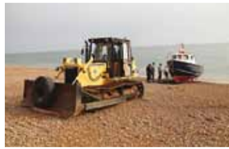
Paadi kaldale vedamine linttraktoriga Hastingsi sadamas.