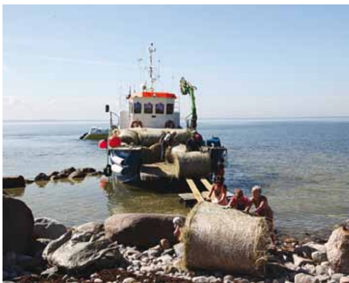
Heinapallide veeretamine Aksi saarele.

Sõitsin ilusal suvehommikul Aksile koos seitsme noormehe, ühe neiu ja 44 heinapalliga. Meie esimene ülesanne oli heinapallide mahutamise väikesele praamile. Noormeeste poolt kostis seda tehse hüü-