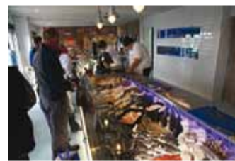
Padstow kalapoes, teisel korral on meretoidu kool.

halikud kalurid olid teinud kõik selleks, et sadam oleks külalistele atraktiivne. Vanas paadikuuris on söögikoht, sadama kaid on kõigile avatud. Kohalik kalanduse tegevusgrupp on kai lõppu rajanud pinkidega varjualuse, kuhu saavad tormi korral varjuda kalurid ja sadamas viibivad külalised. Siltidest kirjutasid kioskist pakuti kõiksugu teenu-