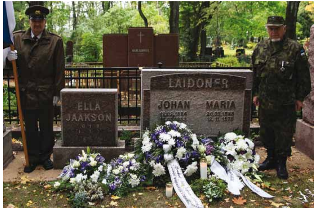
Kaitseliitlased kindral Johan Laidoneri ja Maria Laidoneri perekonna rahulas.