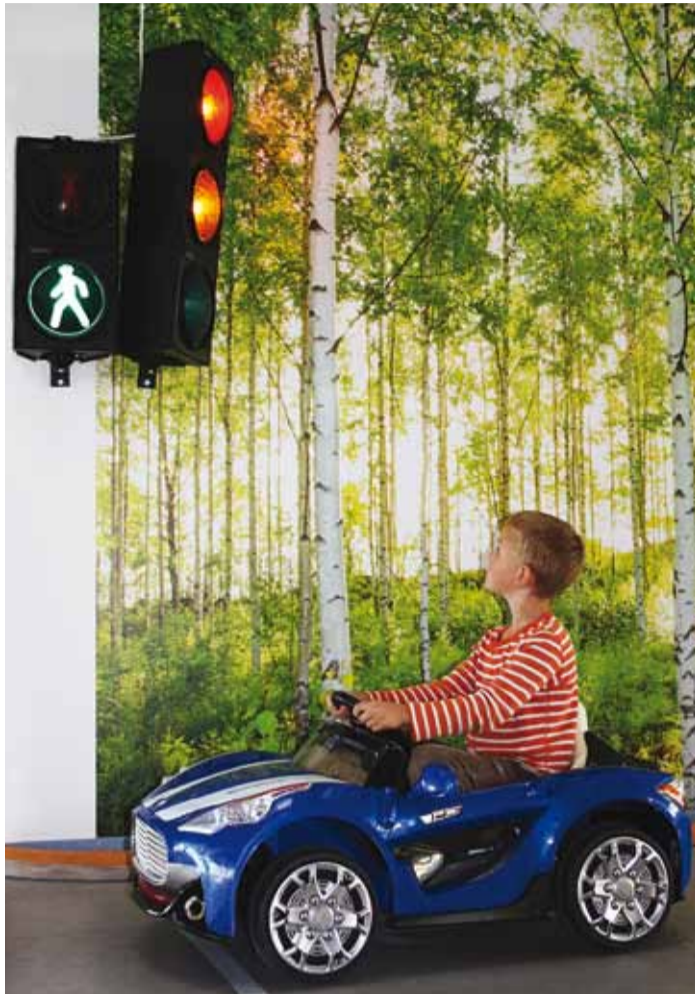
Jalakäijad on läbi lastud, kohe süttib roheline tuli.

Autodega lustimist piirab natuke lapse kaal: autod kannatavad kuni 40 kg raskust. “4–10 aastat tundub olevat magusaim