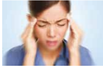
Aastaaja vahetumine teeb vaeva.

Enamasti põhjustab kevadväsimust C- ja D-vitamiini puudus, vähene füüsiline aktiivsus, ületöötamine ning napp uneaeg. Inimene peaks tegelikult elama loodusega tihes