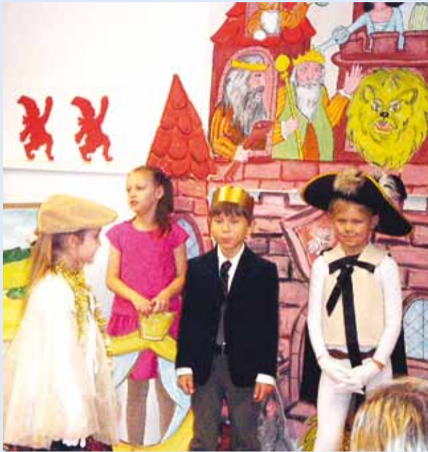
“Saabastega Kassi” muinasjutu tegelased.

4. veebruaril tähistas eralasteaed Pääsupoeg oma 8. sünnipäeva.