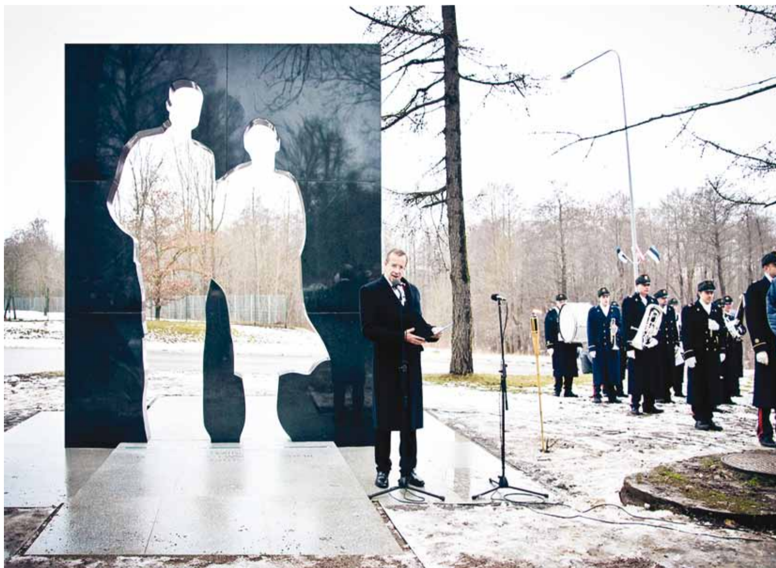
President Toomas Hendrik Ilves kõneleb Laidoneride mälestusmärgi avamisel.