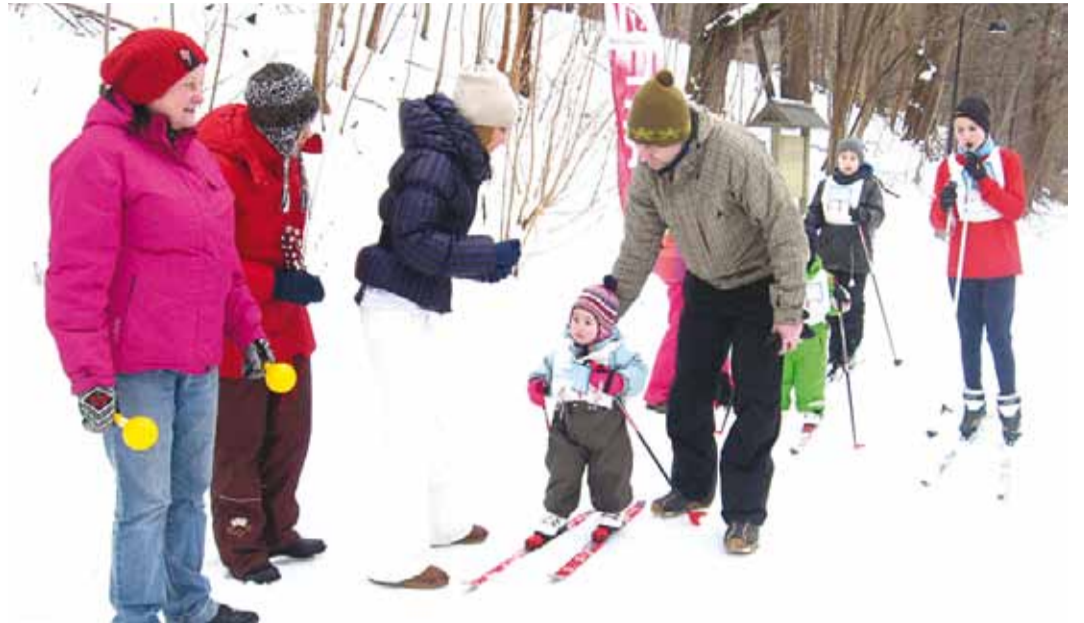
Pildiallkiri. Starti läheb üks noorimaid osavõtjaid.

Kohal oli ka suusakooli buss, kust sai suuremaid suus-