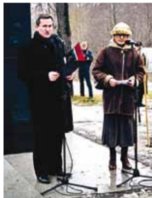
Kõneleb Poola suursaadik.

Johan ja Maria Laidoneri mälestusmärgi avamisel asetisid sambale mälestuslilled ka Poola Vabariigi külalised.