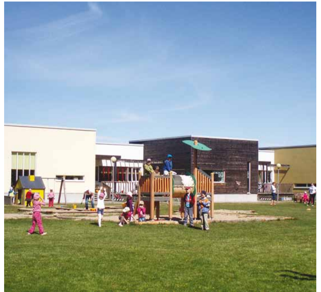
Randvere külakeskuses on koos lasteaed, päeva- ja noortekeskus ning samas on ka perearstid.

Esmaspäeval, 17. veebruaril käis 11 külavanemat vallamajas, et oma probleeme, küsimusi ja mõtteid vallavalitsusega arutada.