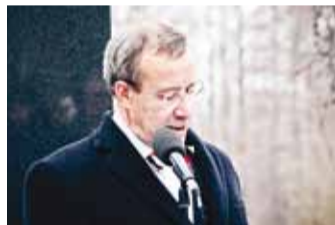
President T. H. Ilves