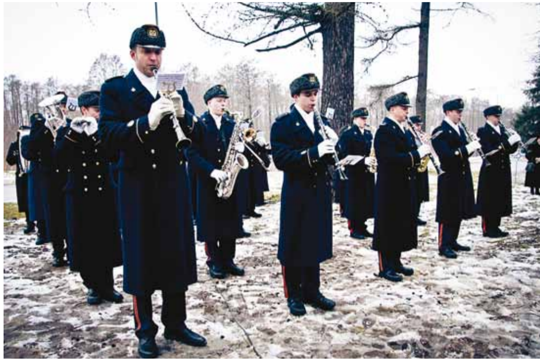
Eesti Kaitseväge orkester. Fotod Kertu Vahemets

Nende seas olid mälestusmärgi "Taaskohtumine", mis kujutab Laidoneride tagasi-