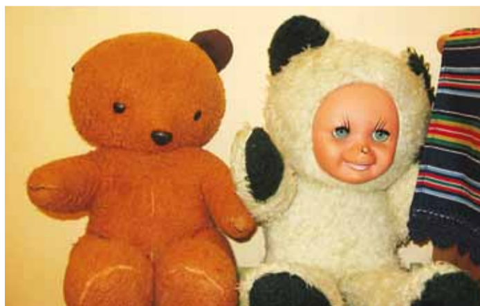
Armsad vanad mänguasjad, neil on oma lood.

Püünsi Kooli lasteaia 2013/2014. õppeaasta teema on “Kombu ja Misse pärimuslood”. Kombu ja Misse on meie lasteaia kaks vahvat ja uudishimulikku kaheksajalgset maskotti, kes aitavad lastel tutvuda keskkonnaga oma lugude kaudu. Näitusel “Vanade mänguasjade lood” avab aga ukse esivanemate mängumaale.