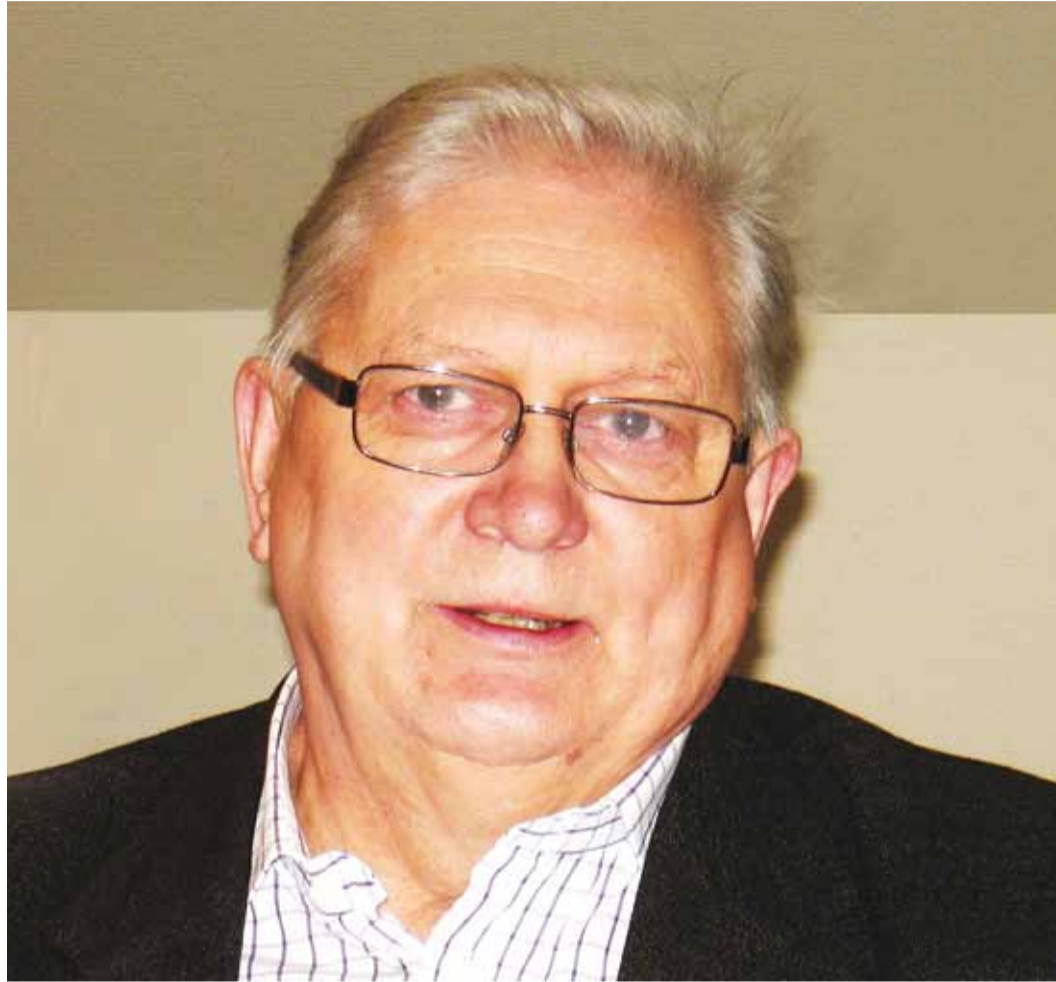
Legendaarne korvpallur Jaak Salumets tegutseb treenerina ja on seotud ka spordipoliitikaga.