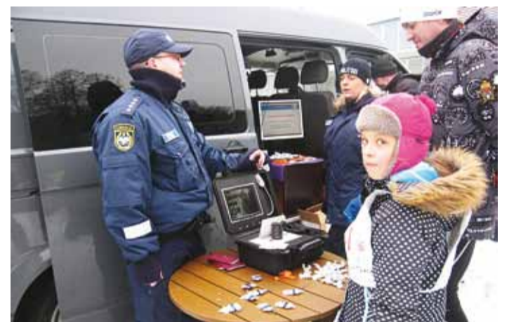
Lennujaama politseinikud näitasid põnevaid töövahendeid.

Juba eelregistreerimisel oli nime kirja pannud umbes 300 last, võistluspäeval registreeruti