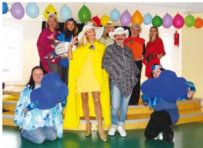
Etenduses “Vikerkaar” mängisid Päikeseratta õpetajad.

Kui lapsed esmaspäeval, 3. veebruaril lasteaeda tulid, oli õhus tunda sünnipäevale omast ärevust ja rõõmu. Lasteaed “Päikeseratas” tähistas 10aastaseks saamist värvide