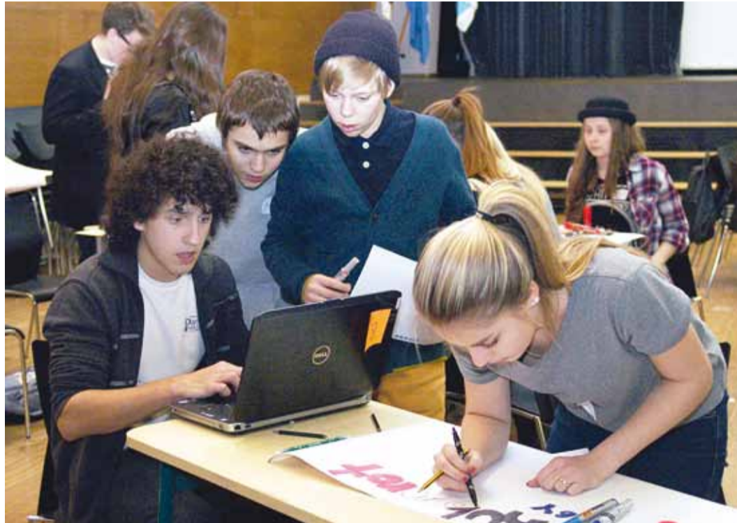
Projektis osalejatel keelebarjääri polnud.

Eesti kohtumisel keskenduti raamatute uuringu tulemustele. Eelnevalt oli iga kool oma III kooliastme õpilaste hulgas läbi viinud küsitluse populaarsematest teostest ning selle põhjal koostanud kümne populaarseima raamatu nimekirja. Kohtumisel jagasid õpilased mõtteid loetud raamatutest, koostasid nende põhjal ühiseid soovitusi nimekirju ning tegid