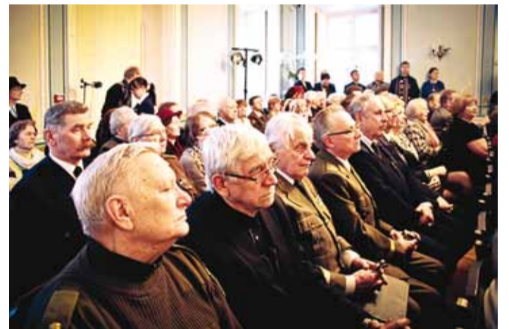
Laidoneri mälestuspäeval on alati palju veterane.