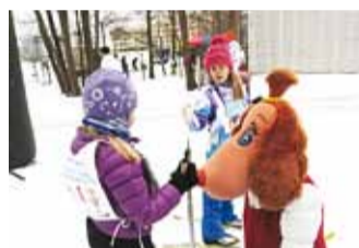
Kohal oli ka Lotte.