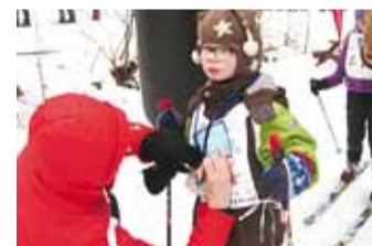
Finišiaeg pandi kirja.