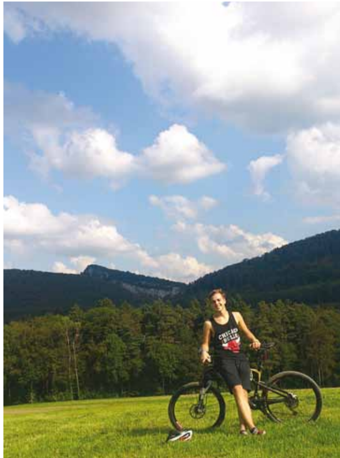
Šveitsi maalilised maastikud.

On möödunud 3 kuud, elan külas nimega Brislach. Siin on 1630 elanikku ning ma olen avastanud või tähele pannud väga palju huvitavaid