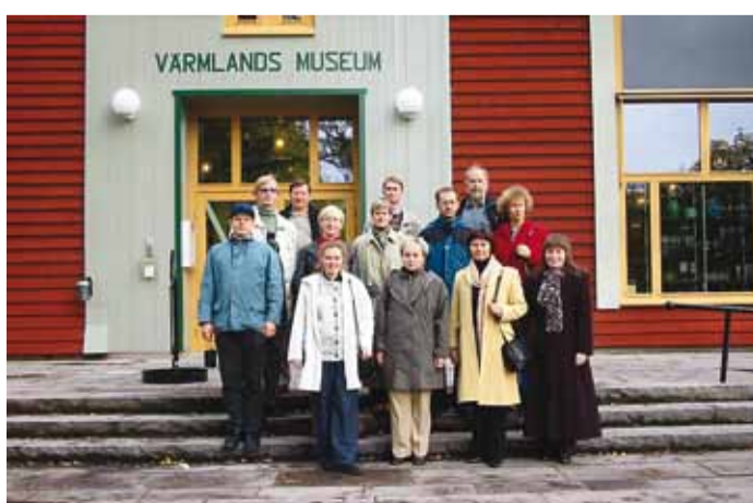
Koor korraldab kontserte ka välismaal, fotol 2013. aastal Rootsis.

Oleme laulnud nii president Toomas Hendrik Ilvese