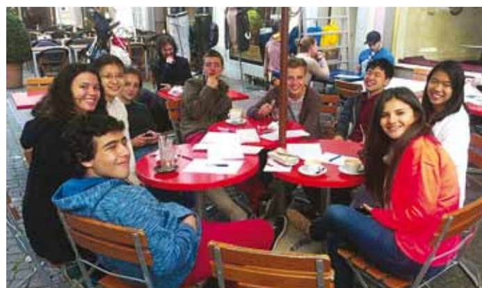
Vahetusõpilase uued sõbrad.

eriti kaasaegsed ja neis õpitavad ained ei ole mulle uued. Mis mulle aga väga meeldib, on see, et paljudes koolides, nagu ka minu koolis, on muusikaklass täis instrumente ja helitehnikat. Muusikaõpetuses on kodusteks ülesanneteks lugude järgimängimine. Tundides õpetatakse pillimängu ning arendatakse rohkem loovust kui tegeletakse mingi õppematerjali tuima tuupimisega.