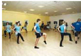
Iga trenn algab soojendusega, et kanged luud ja liikmed käima läheksid.

INGA PETUHHOV: Meil on olnud põnevad aastad! Palju esinemisi Eestis ja välismaal, oleme saanud hulgaliselt uusi sõpru. Täna on meil