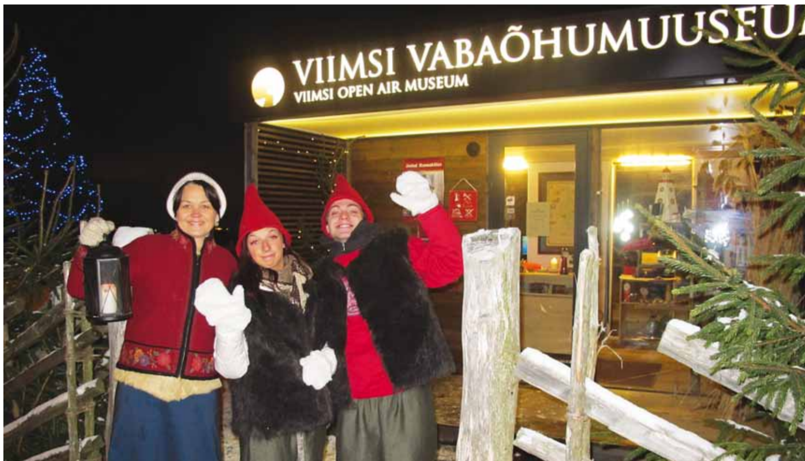
Viimsi jõulukülas oodatakse!