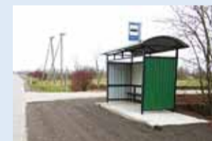
Uuenenud Viieville bussipeatus.

Novembri alguses ehitati ümber Viieville bussipeatus Aiandi tee ääres.