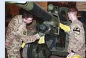
USA sõdurid kahurit puhastamas.

15. novembril tulid Tapal resideeruva Ameerika Ühendriikide 1. ratsaväediviisi 32 sõdurit kapten Kleinsorge juhendamisel Viimisisse korrastama Eesti Sõjamuuseumi – kindral Laidoneri muuseumi rasketehnika ekspositsiooni.