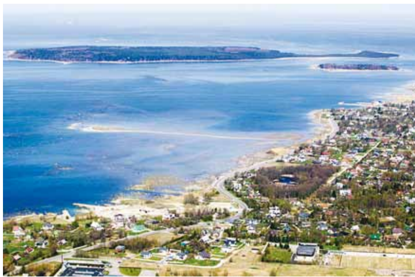
Vaade Püünsi külale linnulennult.

meist on saanud igapäevaseks lahutamatuks osaks elus.