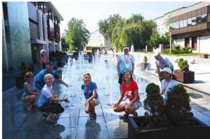
Poolas Kielces Europeadil 2014. aastal esinemisvabal päeval.