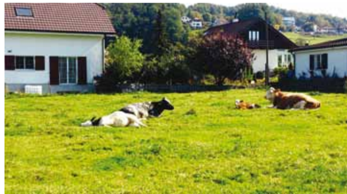
Šveits on tuntud šokolaa-di riik.

Teistsugune on ka nende koolisüsteem. Hindeid antakse 6-palli süsteemis, kus 1 on halvim, ning sellist asja nagu koolilõuna neil ei eksisteeri. Tavaliselt tehakse kodust kaasa võileib, kuid paar korda nädalas on lõuna ajal pikemad pausid ning saab minna ka koju lõunatama. Koolid ise pole