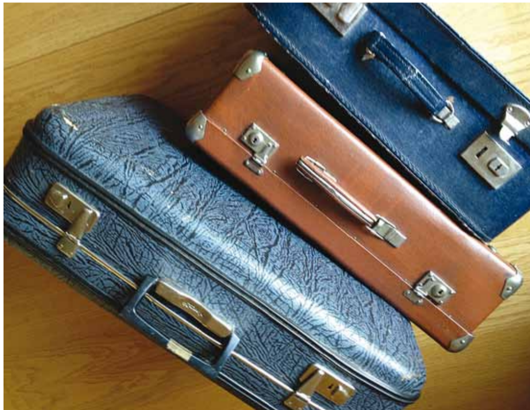
Lapsepõlv iganädalase kohvrite pakkimisega?