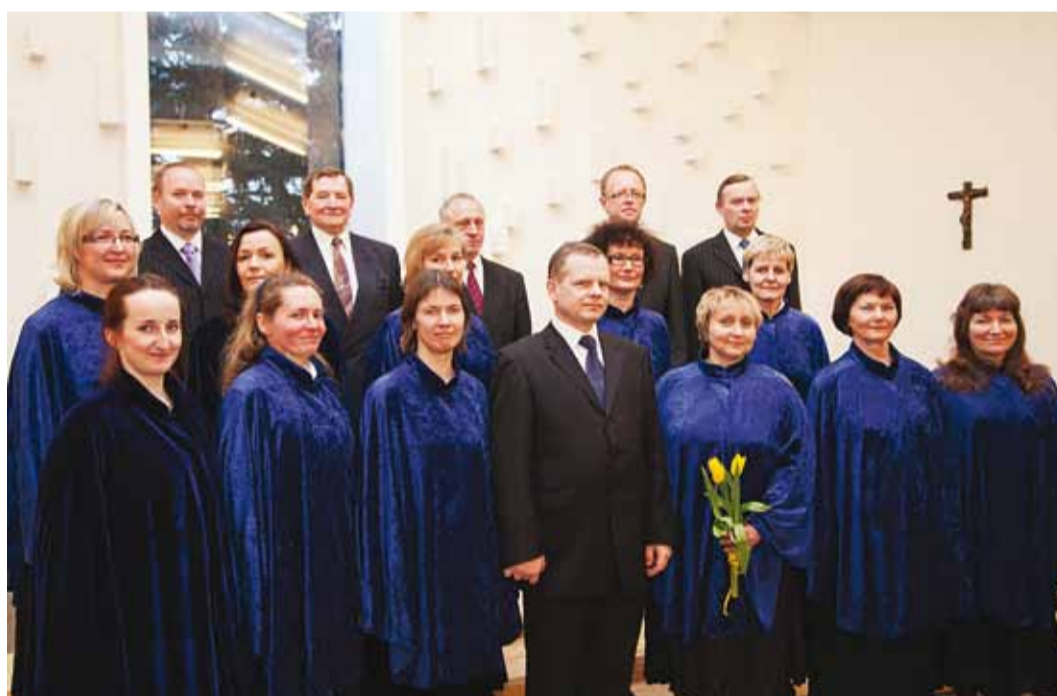
Viimsi Püha Jaakobi koguduse kammerkoor 2013. aastal.