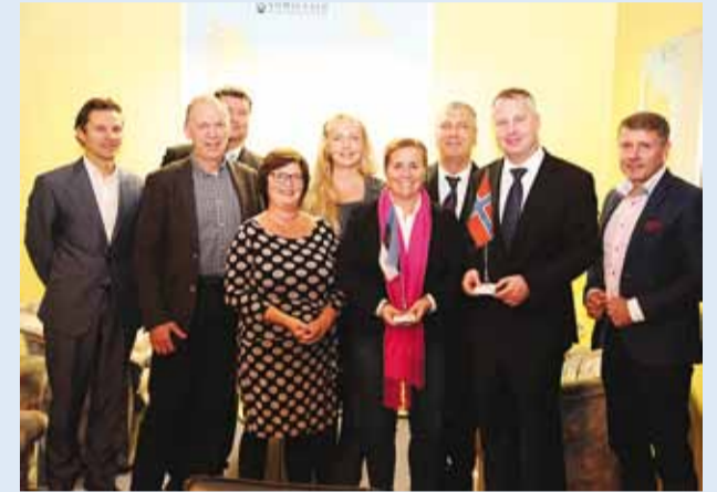
Norra Sky linnavalitsuse delegatsioon kohtumisel Viimsi vallavalitsuses.

Viimsi valla sõprusvallaks on juba pikki aastaid olnud Sky kommun, mis asub Oslost 12 minuti autosõidu kaugusel. Sky ja Oslo lähedust ja erinevusi võib mõnes aspektis võrrelda Viimsi ja Tallinnaga – mõlemad on olulised naaberomavalitsused riigi pealinnale.