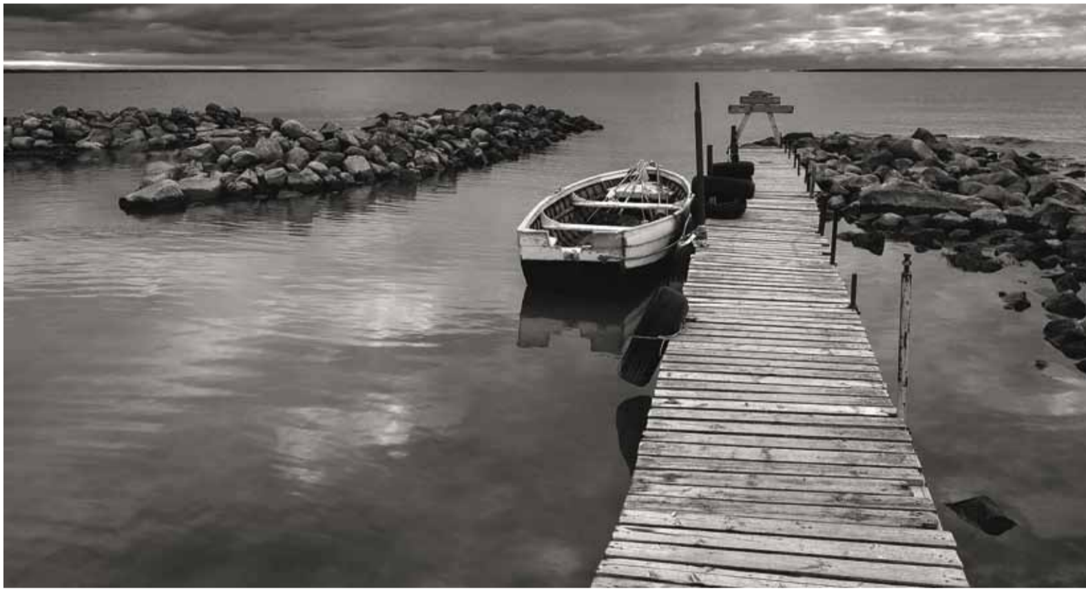
Rummu lauter pakub ilusaid vaateid igal aastaajal – päikeseloojangust hõbevalgelt mässava mereni.