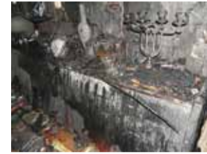
Küünlast alguse saanud tulekahju.

Kätte on jõudmas aasta pimedaim aeg. On täiesti loomulik, et süüdatakse elamise hubasemaks muutmiseks küünlaid. Kindlasti tuleb seda tehes pidada meeles, et iga elav tuli võib olla ohtlik.