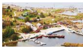
Vaade Pranglile linnulennult.

12. novembril toimus Prangli rahvamaja saalis saare üldkoosolek, millest võttis osa ligi 40 elanikku.