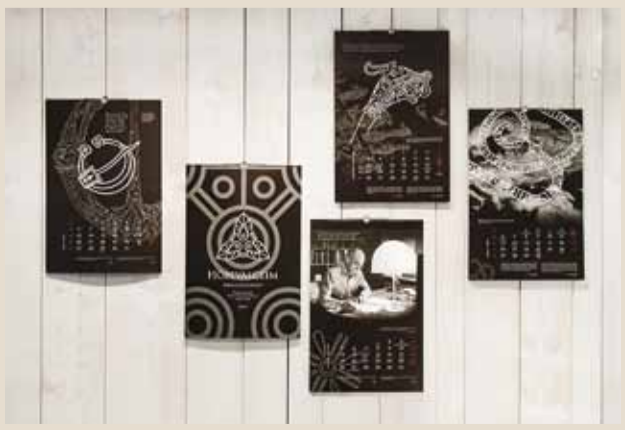
2015. aasta kalender heidab hõbesära kogu aastale!