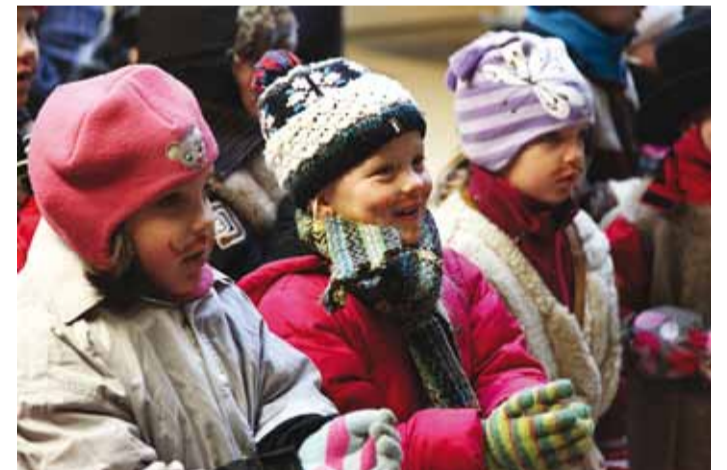
Väikesed Mardid töid vallamaja mõistatusi.

seisab värviline lõbus pöörlev kerake. Kui sa oskad vaadata, tervet ilma näed seal sa." Gloobus!