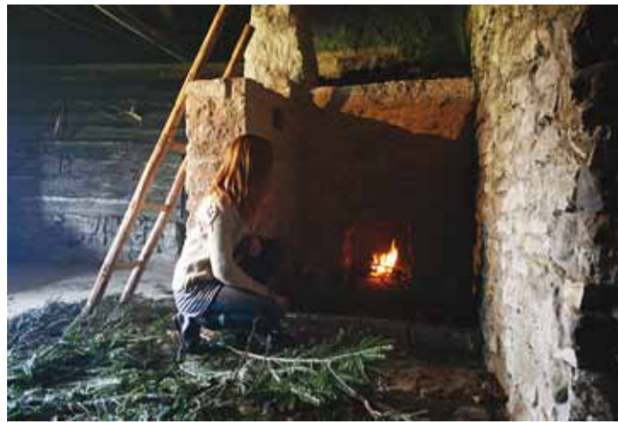
Esimene tuli Kingu elumaja taastatud reheahjus.

Muuseumiperele endale kõige olulisem oli kindlasti Kingu elumaja pliidi ja ahju restaureerimine, sest eelmiseks aastaks muutus vana ahi kasutuskõlbmatuks. Muinsuskaitse all olev maja, milles küttekolle asub, vajab aga pidevalt kütmist, et hoone seisukord ei halveneks. Ettevalmistused algasid juba aasta algul ekspositsiooni eemaldamisega ja suve hakul lõhuti muuseumi peavarahoidja valvsa silma all maha tuleohtlikuks muutunud vana küttekolle. Tööd kestsid