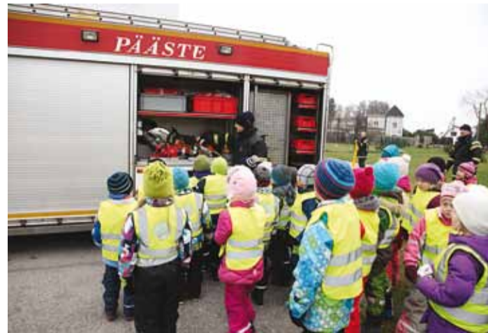
Kõige enam tekitas lastes põnevust päästeauto.

Päästjad õpetasid lapsi jälgima küünalde kasutamist koduses majapidamises – küünal peab alati olema mittesüttival alusel püstiselt. Vältida tasuks küünalde süütamist aknal, sest