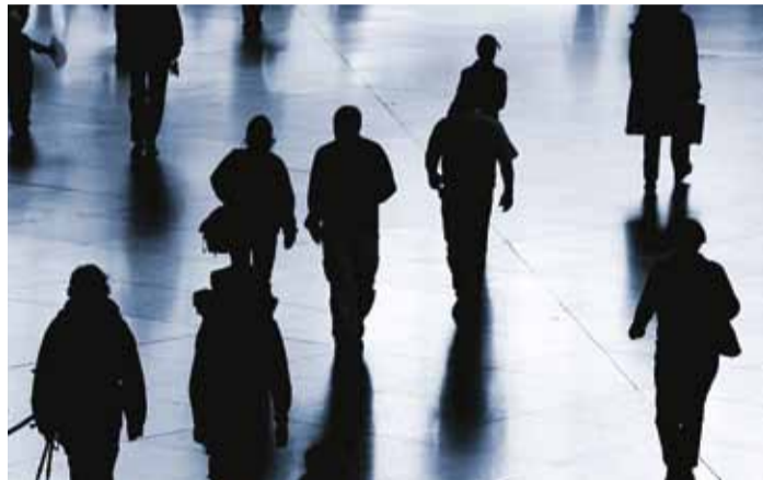
Kriisiolukorras tuleb säilitada rahu.

Novembri algul kogunesid vallamajja koosolekule kõik Viimsi haridusasutuste juhid, samuti huvikeskuse ja Rannarahva muuseumi juhid, kuna neis toimuvad üritused on inimeste hulgas eriti populaarsed ja rahvarohked. Kriisiplaanid on õnneks meie haridusasutustel olemas. Ehkki need vajavad läbivaatamist, täiendamist ja uuendamist. Aastad lähevad kiiresti ja täna liigume sennapoole, et ka huvikeskuse, Rannarahva muuseumi kui ka