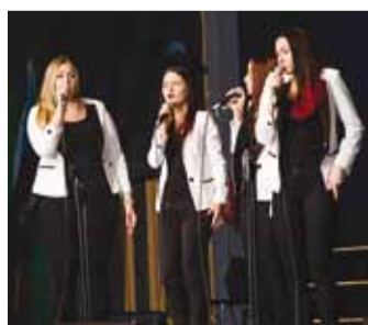
Vokaalansablite I-II kohta jagasid 2Loud ja Mustad Klahvid (pildil).