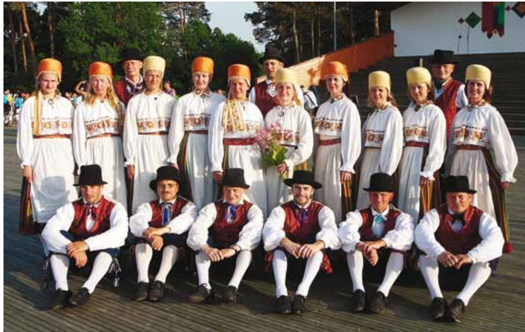
Harjumaa laulu- ja tantsupeol 2013 aastal. Traditsiooniline üritus, kus Harjumaa tantsijad, lauljad ja pillimehed Keila laululaval kohtuvad ja lavastatakse korralik etendus.

Novembris tähistasite kontserdiga juubelit. Kuidas võtaksite möödunud aastad kokku?