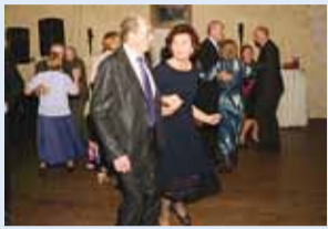
Peolised tantsuhoos.

Tihti kurdame, et mehi kodunt välja saada on raske kui mitte võimatu, ent eakate sügisball Viimsi Peokeskuses näitas lausa vastupidist – tantsupõrand ei tahtnud kõiki avavalsi tantsijaid ära mahutada.