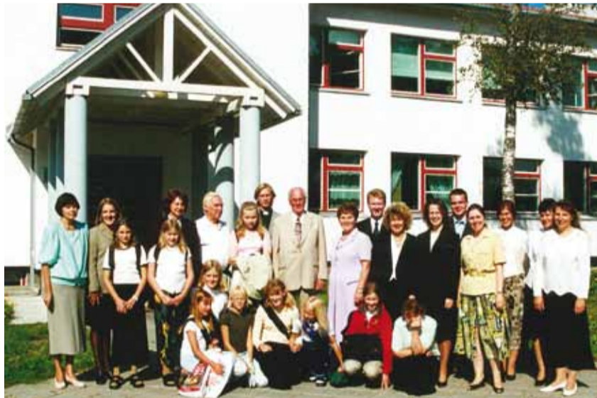
Küla üks uhkusi on väike 9-klassiline kool, mida 1997. aastal külastas ka Lennart Meri.