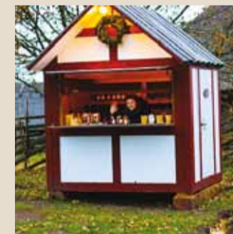
Jõulukaup ootab.

Olete ilmselt juba märganud, et Viimsi taluturule on tekkinud väikeseid võrgu- kuure meenutavad majakesed. Need on märgid sellest, et valmistume talviseks hooajaks.