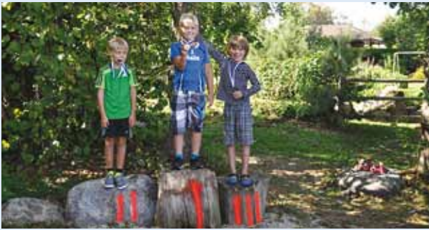
Kolme ala parimad said kaela medalid.

Pühapäeval, 17. augustil peeti Leppneemes Kiigemäe rannas sportlikku perepäeva.