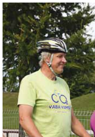
Juba staažikas rattaretkeline.