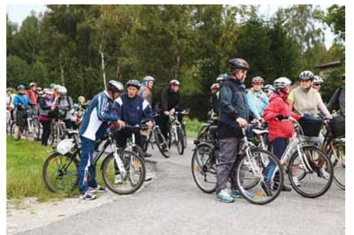
Väike paus. Sõitjate hulgas on ka vallajuhid.

küla sõitsime järsust Hõbemäest alla ja peatusime kunagise kaevanduse juures. 1920ndate esimesel poolel alustati siin maa-alustes käikudes fosforiidi kaevandama. 1938 hävisid kaevanduse rajatise tulekahjus ning neid ei taastatud. Selle asemel alustati fosforiidi karjäärist kaevandamist Maardus.