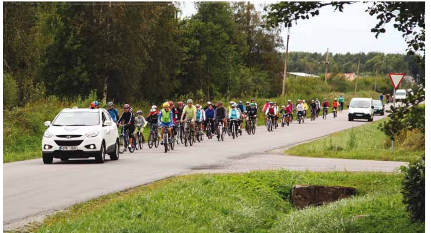
Rattaretkelased teel naabrite juurde Jõelähtme valda.