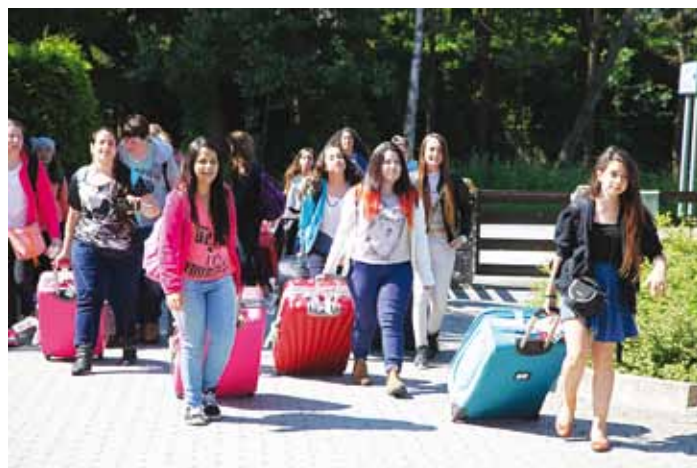
Iisraeli noored on just jõudnud Viimsisse.

Tänavu juuli alguses oli aga meil rõõm ja au Iisraeli sõpru Viimsis võõrustada. Kutsusime külalised siia laulu- ja tantsupeo ajaks. 4. juulil jõudsid