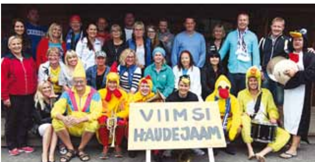
Viimsi esindus suvespordipäeval.