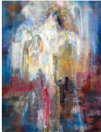
Pildil Kristiina Kaasiku maal "Valguses" 2011. aastast.

7.–14. septembrini näeb Randvere kirikus Viimsis elava ja töötava kunstniku Kristiina Kaasiku maale. Näituse avamine on 7. septembril kell 16, mil saab maitsta ka lõkkekohvi.