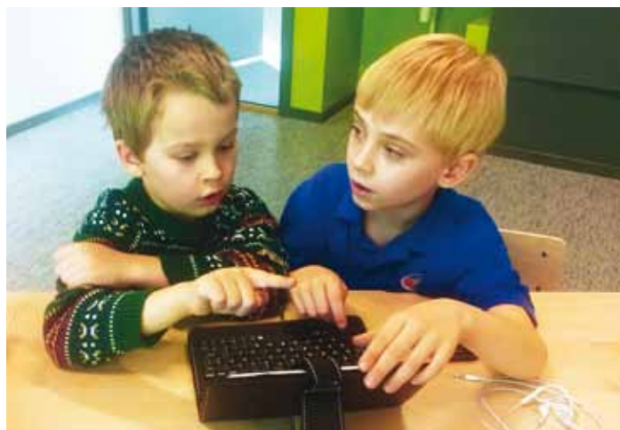
Nutivahendeid kasutame tunnis kuni 15 minutit.

Oma õppekava tähtsaks osaks peame CLIL-metoodikat ( Content Language Integrated