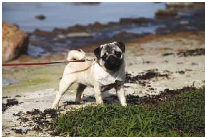
Lemmikloomad ei saa endale paraku eeskujulikult käituvat omanikku valida.

Kohalike maksude seaduse § 13 lubab kohalikul omavalitsusel kehtestada loomapidamis- ehk lemmikloomamaksu. Vastavalt seadusele kehtestab maksustavate loomade loetelu vallavolikogu. Kas Viimsi vajab sellist maksu?