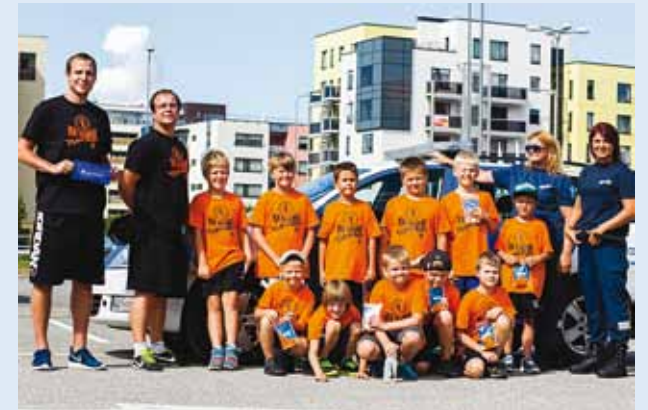
Ühispildil on korvpallipoised ja politseinikud.

15. augustil lõppes Viimsi Vabaõhumuuseumis piknikuga Korvpalliklubi Viimsi poiste sportlik linnalaager Time-Out.