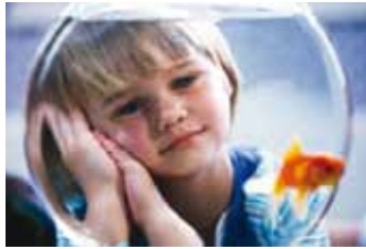
Laps vajab lähedasi emotsionaalseid suhteid.

Emma on armas ja rõõmsameelne kuueaastane plikatirts. Ta muretses aga väga oma ema ja isa pärast, kes pole tükk aega kodus olnud.