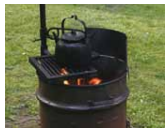
Nii seda kohvi tehakse.

EELK Misjonikeskusel valmis kevadisel käsitööpäeval taaskasutusrauast kokku keevitatud lõkkekohvimasin.