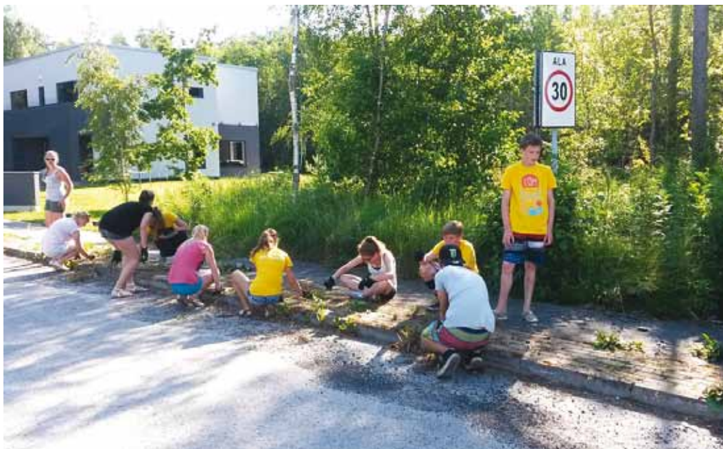
Malevlased puhastavad Ampri põigus kõnniteed.

Tänu ENTK toetusele saime korraldada ka noorte vaba aja veetmist. Tutvumiskoht, ühised mängud, teatriprojekt, üritus vabaõhumuuseumis jpm võimaldasid noortel uusi sõpru leida ja sotsialiseeruda. Mõlemad rühmad tegid maleva ajal pilte ja videod, mida saate vaadata valla kodulehel ( www.viimsivald.ee/noorsootoo ).