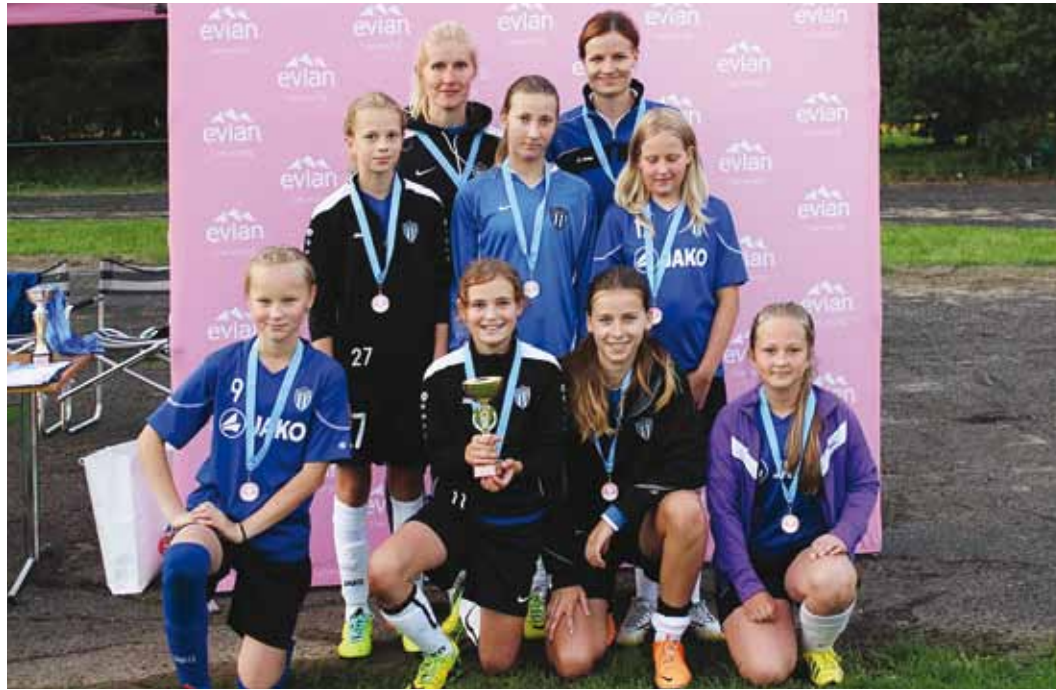
Võistkond ja treenerid II koha karikaga.

Viimases mängus oli vastas seni samuti mõlemad mängud võitnud Lõuna-Läänemaa JK.