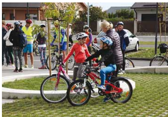
Randvere kooli ette kogunes ka väikseid vapraid sõitjaid.

Edasi sõitsime mööda Jõelähtme valda. Pärast Ülgase