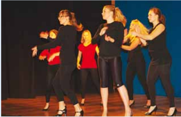
Hetk tantsukavast.

Tule avasta enda jaoks Heels ja Contemporary jazz!