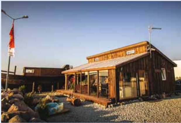
Kaptenimaja ootab kalakoolitusele.

Rohuneeme sadamas käib kevadest talve tulekuni vilgas elu. Kes sõidavad Aegna saarele loodusekursioonile, kes Naissaarele või Pranglile, kes niisama Tallinna lahe safarile. Või nauditakse Kaptenimajas oma tähtpäeva pidades hoopis mõnusat vaadet.