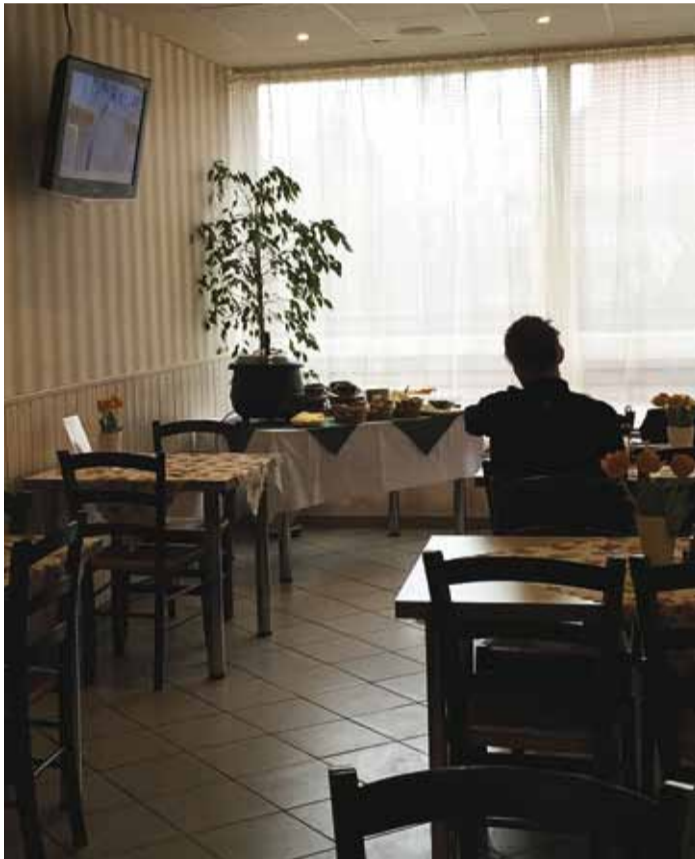
Päevasuppi saab nüüd endale ise tõsta. Teiseks tänavuseks uuenduseks on värsked lilled vaasis.