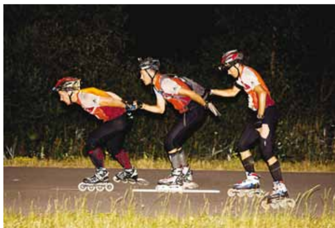
A-rajaga meeskond rulluisukudel.