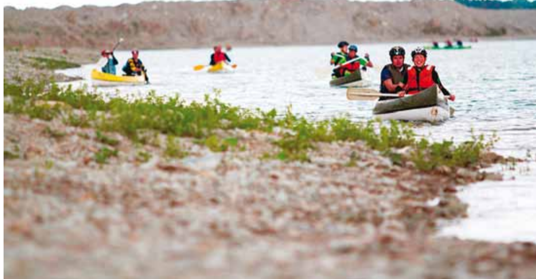
Aidu karjääri etapp.

Lihtsa C-rajaga läbimiseks on võitjatel keskmiselt kulunud 1,5 tundi. Rajal saab enamasti u 4 km joosta, u 10 km sõita rattaga ja u 1 km kanuuga. On ka üks lisäülesanne. "C-rada on neile, kes peavad meie võistlust liialt raskeks katsumuseks või kelle treenitus ei luba neid raskematele radadele. C-rajal saab hakkama igaüks ja ka ilma varasema