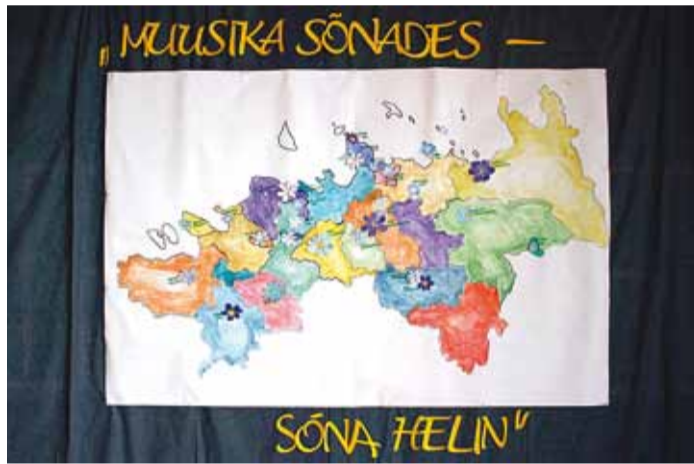
Harjumaa kaarilt on näha, kust olid pärit osalejad.