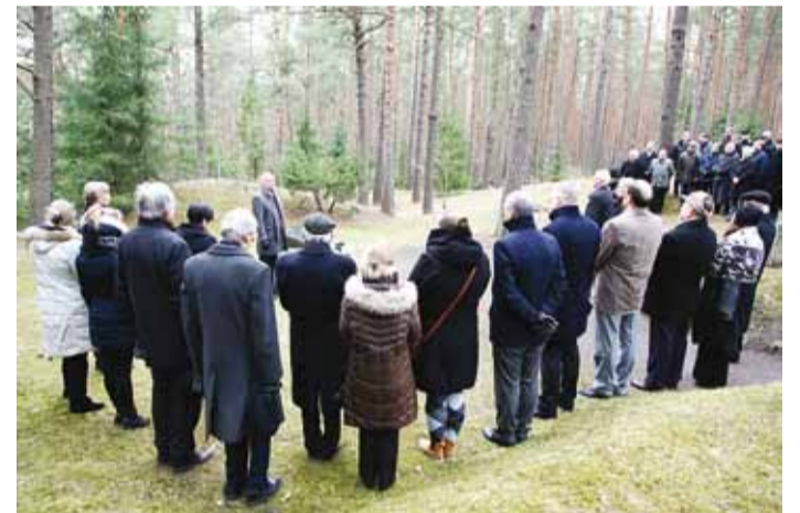
Lennart Meri sünniaastapäeval Metsakalmistul käimisest on sõpradele, perekonnale ja vallavalitsusele kujunenud traditsioon.