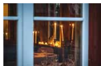
Pidulik õhtusöök ootas külalisi küünalde säras.

21. märtsil toimus Rannarahva muuseumis RootSu pidulik pop-up õhtusöök Kalagaala 2015.