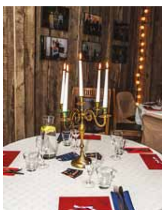
Küünlad lisavad pidulikkust.