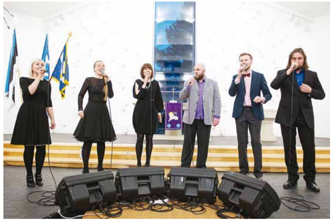
Mälestuskontserdil esines ansambel Estonian Voices.