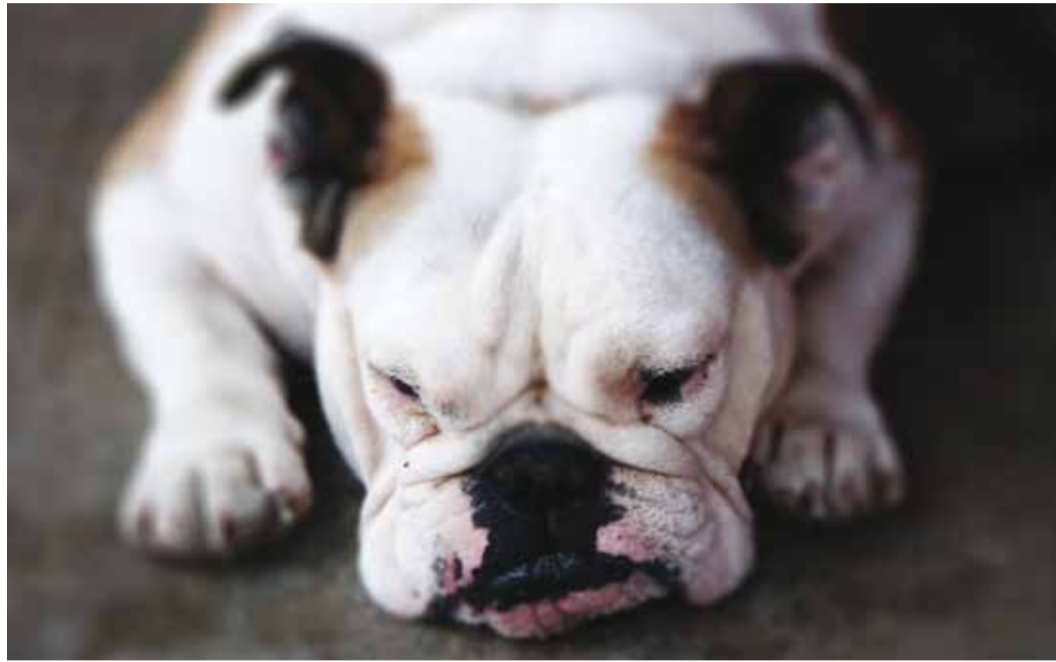
Kevad on lõikamata lemmikule väga stressirohke aeg.

Paljud loomaarstid ja ka teaduslikud uuringud kinnitavad, et steriliseerimine on emase lemmiklooma tervisele ja enesetundele hea, vähendades tunduvalt emakapõletike, piimanäärme-, emaka- ja munasarjavähi risk. Samuti hoiab see