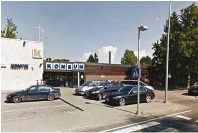
Haabneeme kohvik.

“Kohviku mõõdukus pole muutunud, saal on täpselt nii suur nagu algul oli. Siia mahub 40 pidulist. Teenindusleti ava ja suur otsaaken on ka vanal ko-