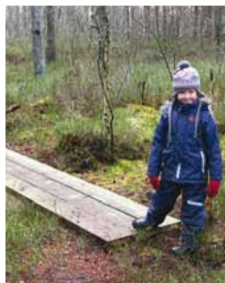
Soosepa rabas.

Tänaseks oleme oma unistusega nii kaugel, et Soosepa rabas on jalutamiseks u 1,7 km pikkune rada, mis suures osas on lihtsalt looduslik loomade poolt sisse tallatud rada ja märjematesse kohtadesse on rajatud puidust sillakesed. Paaris kohas leiata ka istumiseks pingid, kus on hea hetkeks aeg maha võtta ja lasta end loodusel laadida. Rabarajale pääseb lasteaed-pereklubi Väike Päike kõrvalt Soosepa tee poolsest küljest.