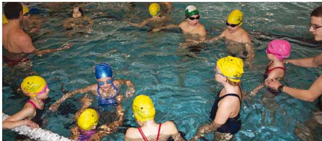
Näidistunnis olid juhendajad koos lastega basseinis.