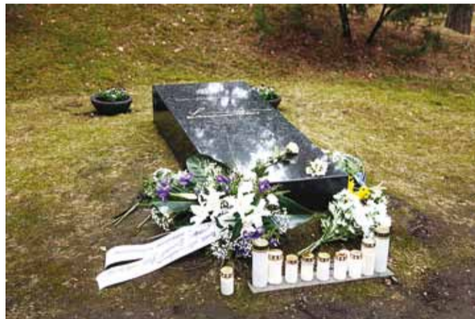
29. märtsil mälestati president Lennart Meri tema haul Metsakalmistul.