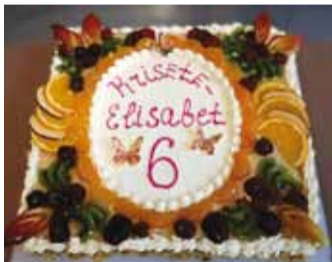
Torte tehakse nii sünnipäevadeks kui asutuste pidudeks. Suurimad tordid on kaalunud 25 kg.