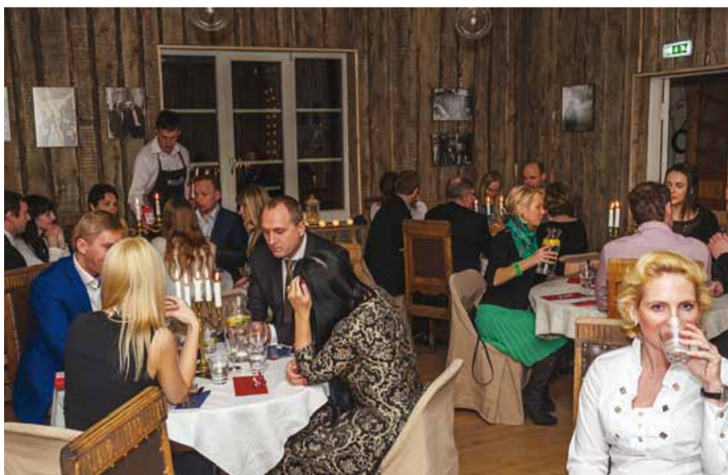
Juba 11. aprillil ootavad siin maitsmist pop-up kohviku hõrgutised.