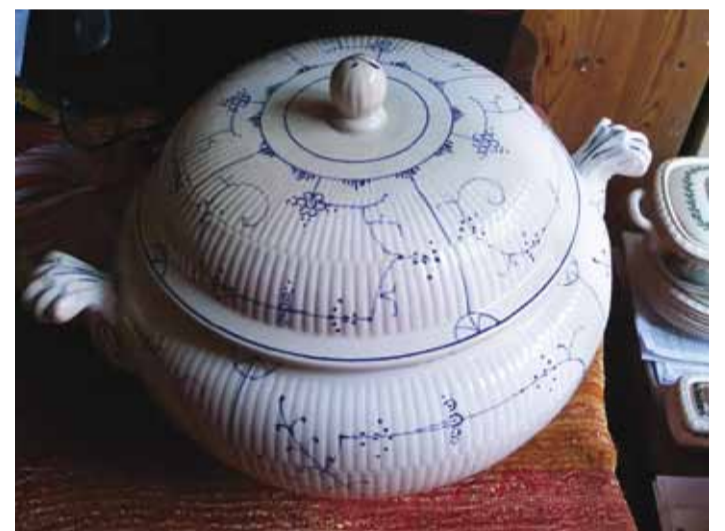
Fotodel on valik nõusid erakollektsionäär Epp Eelmaa kogust. Ka tema tuleb oma asjadega laadale.

värvid, mida kasutavad kunstnikud. Pakutakse ka valget portselani ning Eesti kunstnike maalitud portselani ja keraamikat.