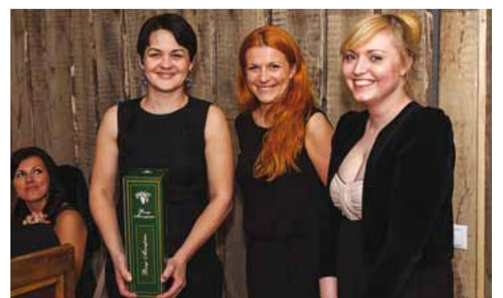
Korraldajad rõõmustavad kalagala kordamineku üle.