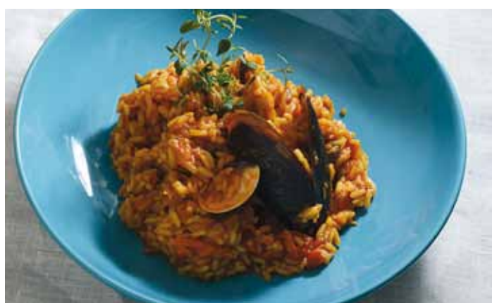
RootSu peakoka imeline paella.