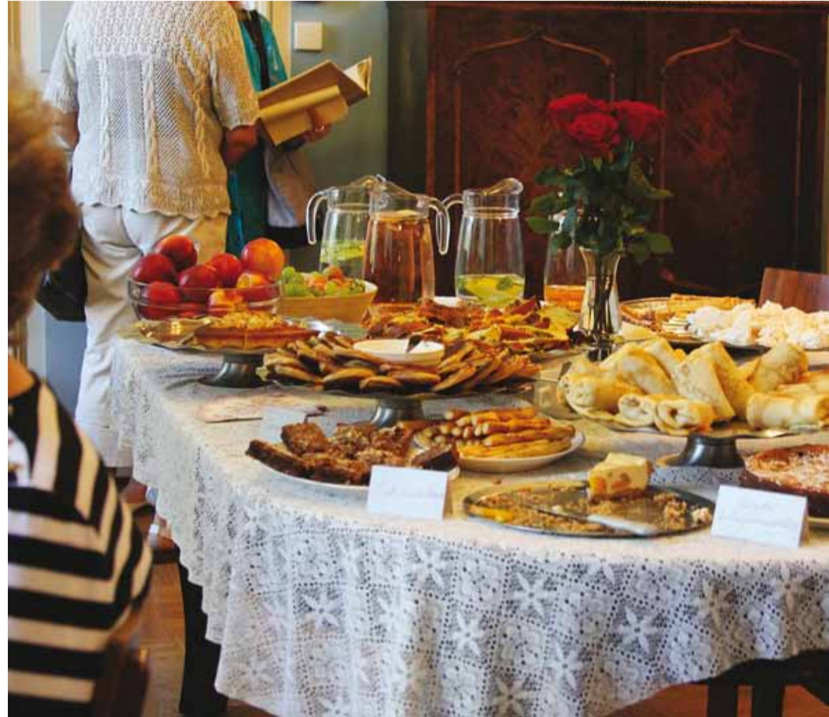
Külluslik valik.