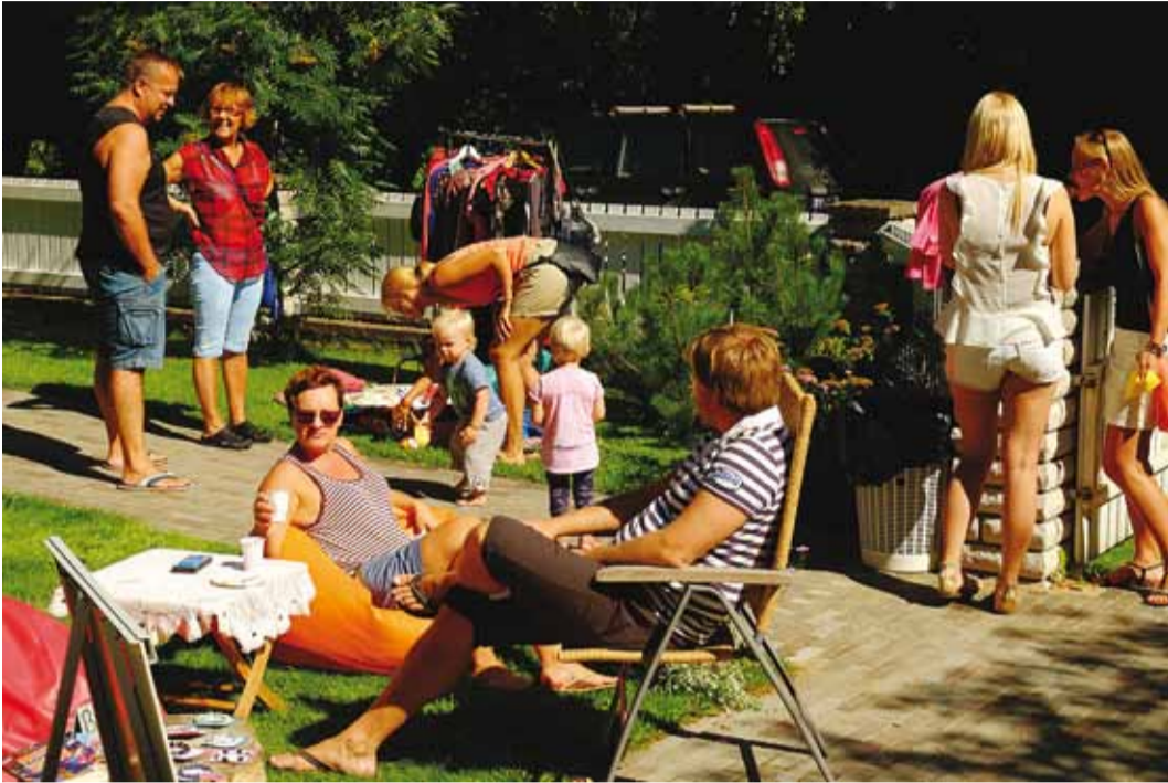
Mõnus aiakohviku melu.