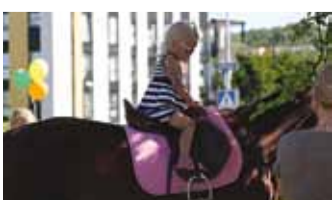
Kohvikust sai isegi hobuse selga.