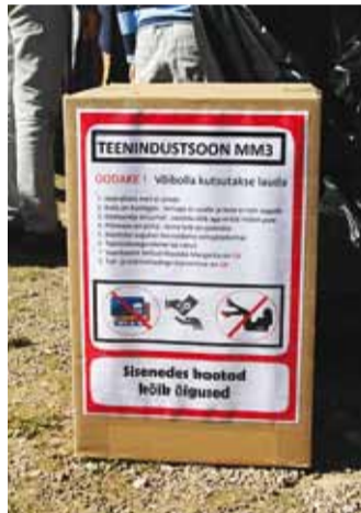
Kõik tehakse selgeks.