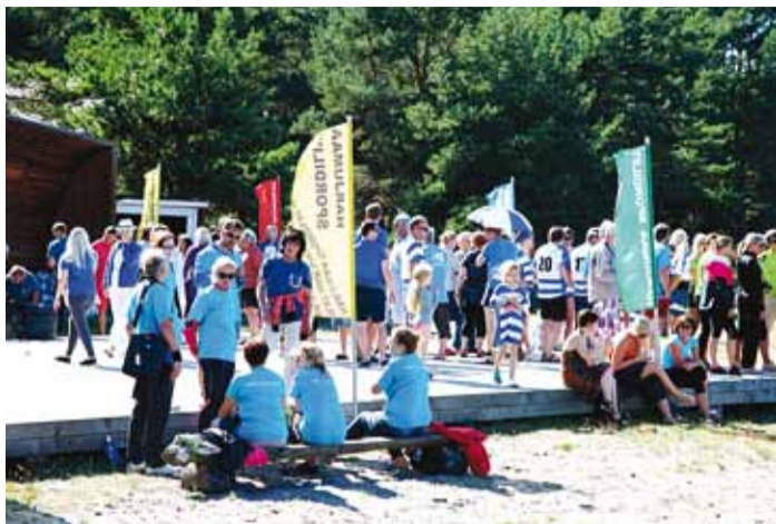
Harjumaa omavalitsused tulid Pranglile kokku sportima.