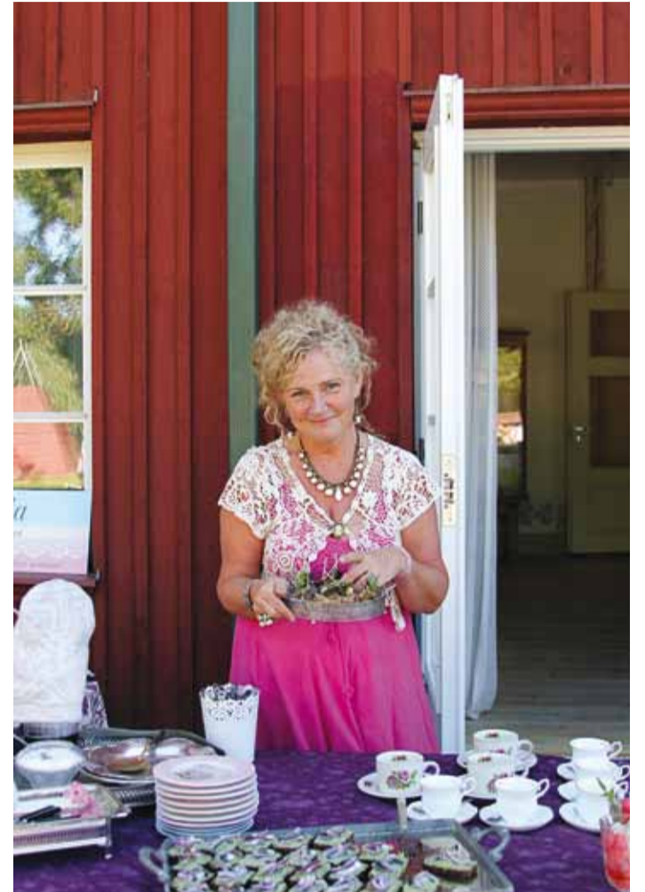
Läbinisti romantilises stiilis.