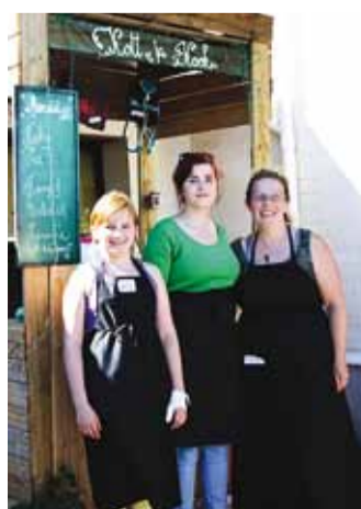
Kott ja kook.