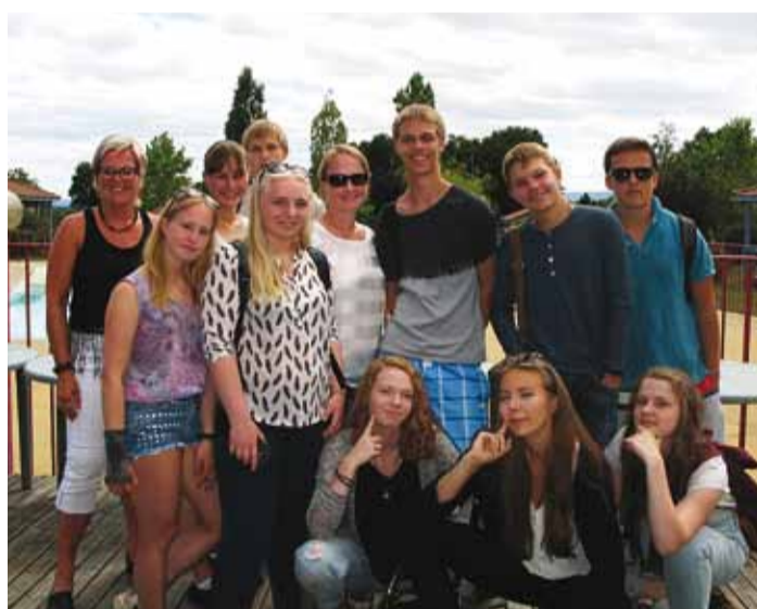
Rõõmsalt Prantsusmaal.

Tallinnast lendasime Frankfurti ja siis Lyoni, sealt sõitsime veel kaks tundi Les Baraques des Rotis' külla. Seal viibitud aja sisse mahtusid tutvumis- ja