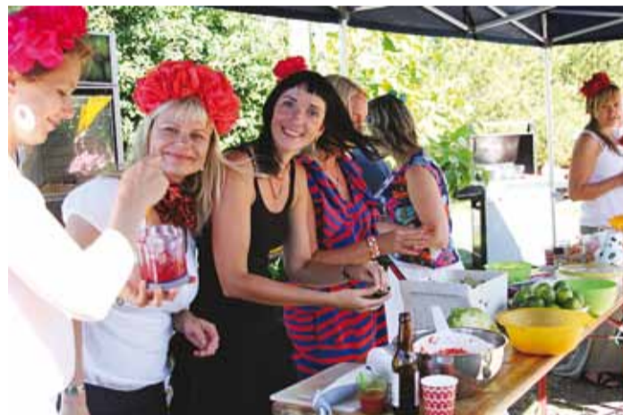
Koos on lõbusam.