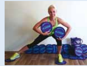
Tulge trenni!

Olen uus Viimsi valla elanik ja pakun viimsilastele oma treeninguid. Praegu viin rühmatreeninguid läbi Arukülas, Raasikul, Anijas ja Kuusalus. Minu moto on: tervislik eluviis on kvaliteetse elu alus!