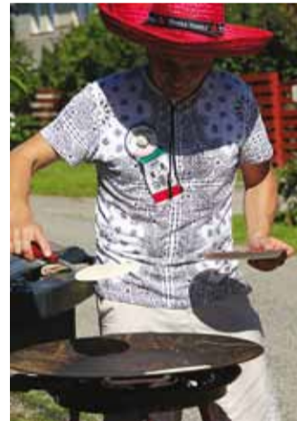
Mehed ongi vist paremad kokad.