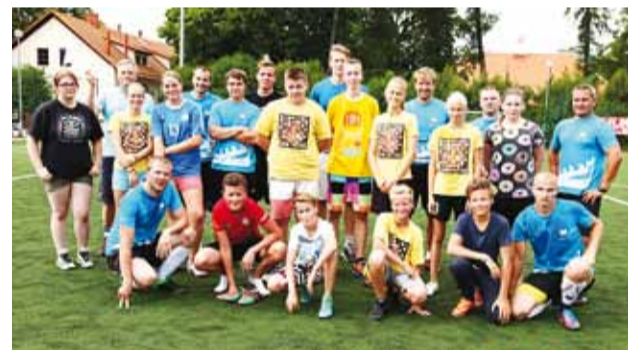
Noorte ja vallavalitsuse meeskond ehk meeskond Viimsi.

12. augustil toimunud noortepäeva raames peeti maha traditsiooniks kujunenud jalgpallivõistlus Viimsi valla noored vs Viimsi vallavalitsus.