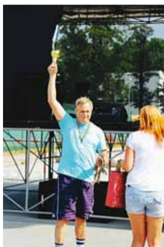
Võitis vallavalitsuse meeskond.