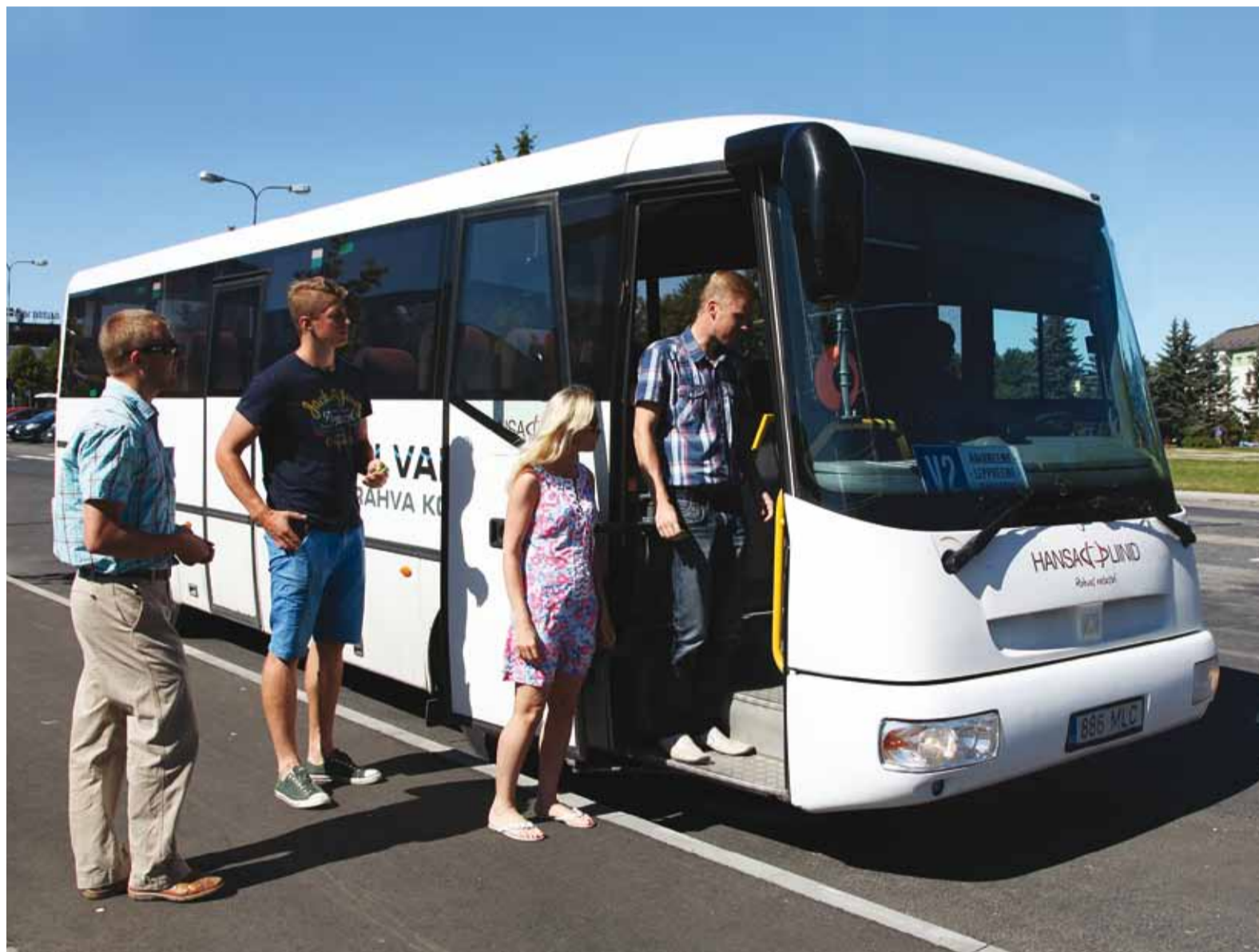
Tasuta bussi peale.