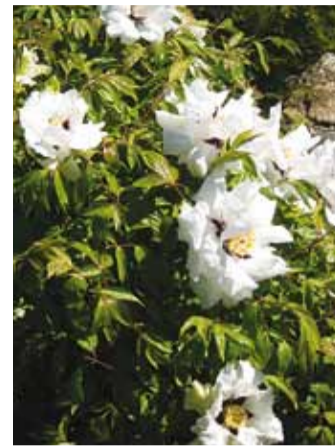
Põõsaspõõng lähivaates. Valgeid õisi ehib tume laik.

Rohtlaliilid tahavad päike- selist, kuivapoolset ja väga hea dreneeriva kasvukohta. Meil kardavad nad kõige rohkem niiskust, neid oleks hea kas- vatada kõrgpeenras vm, kuhu niiskus ei saa koguneda. Pärast õitsemist taime maapealne osa kuivab. Ka külmal ajal tuleb taimede meritähte meenutavaid lihakaad juuri hoida võimalikult kuivana, nende kohale võiks seda kaitsva plaadi vms. Pare- mini lähevad kasvama suve lõ- pul jagatud taimed. Neid istu-