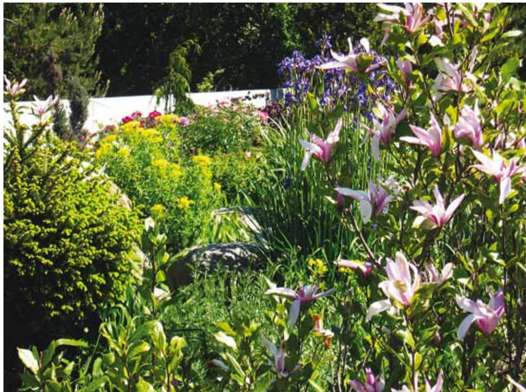
Paremal magnoolia 'Susan'. Fotod Meeli Müüripeal ja Karin Saar

Karin Saare aed paikneb lii- vasel pinnal, istutusala on hea mullaga tublisti täiendatud. Põõ- saspõõngid kolis ta siia eelmi- se kodu aiast viis suve tagasi. “Kelvingis oleme elanud juba 16 aastat, enne olime paaris- majas. Kui valida antaks, kas