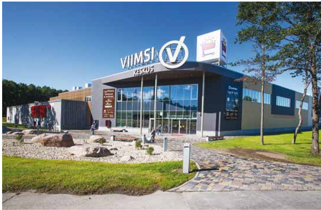
Piirkonna suurim kaubanduskeskus on avatud!

Viimsi Keskuse suurimateks üürikeks on Selver ning spordiklubi MyFitness, ka asuvad seal erinevad söögi- ja meelelahutuskohad, kauplused ja teenuspakkujad. Lisaks leiab mitmeid toitlustuskohti (Hes-