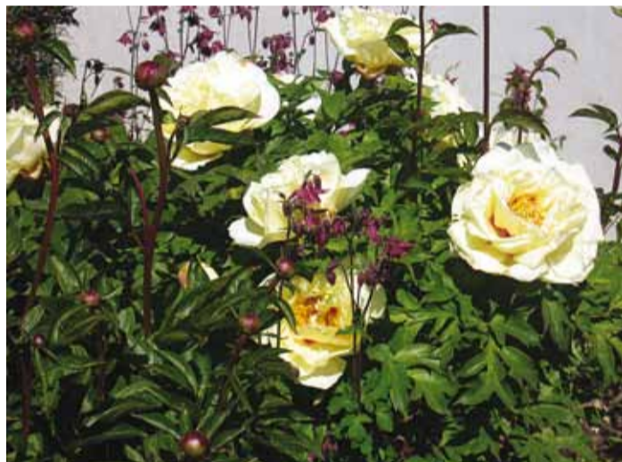
Harvanähtav kooslus: kollaste õitega põõsaspõõng ja kurekellad.