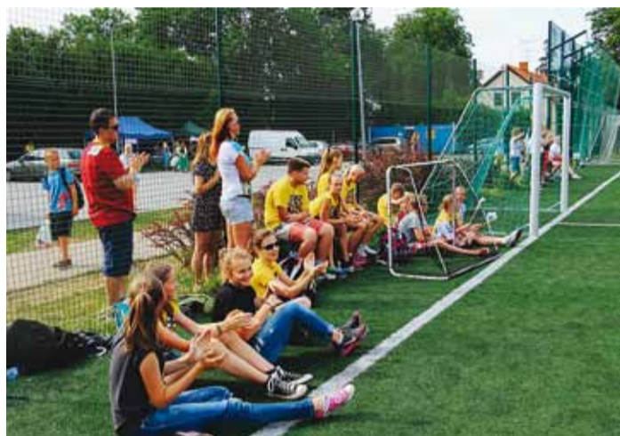
Jalgpallivõistluse üliaktiivne publik.