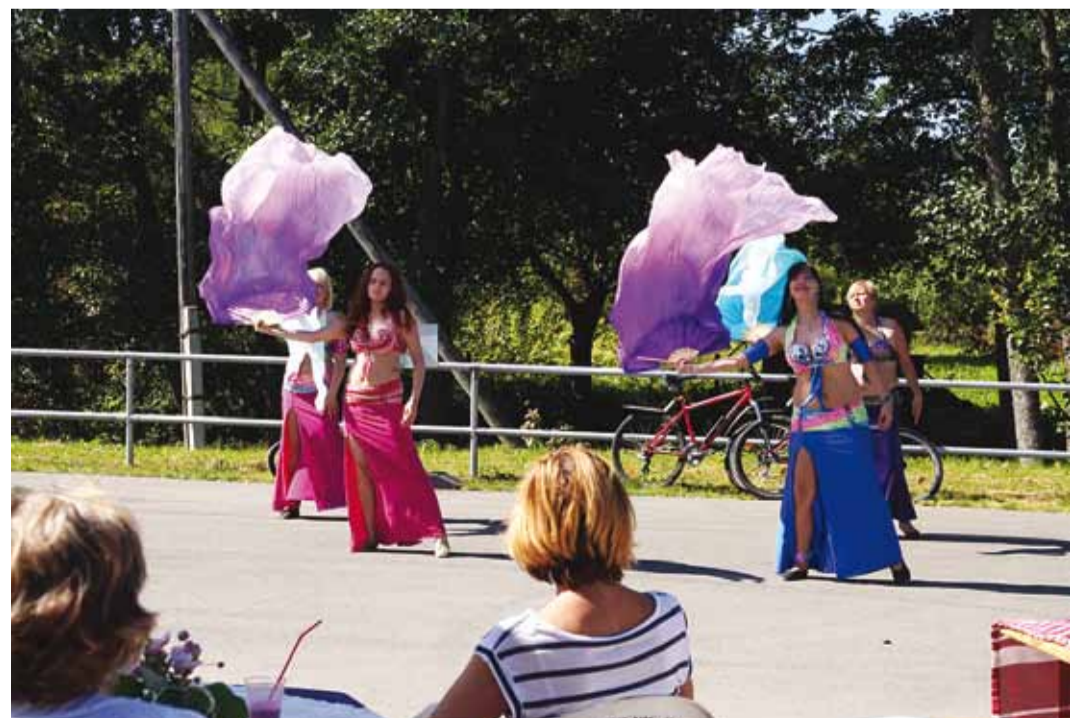
Muuga külakohviku juures tervitati külastajaid kõhutantsuga.