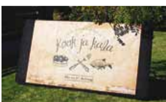
Kook ja kala kutsub.