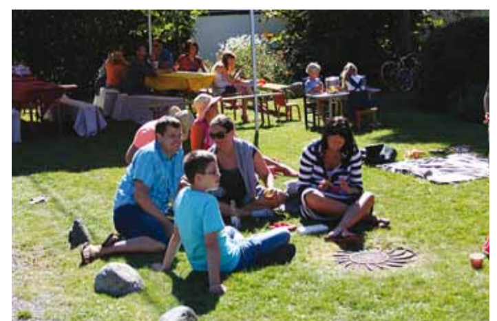
Õuemurul on mõnus.