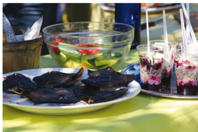
Augustikuus peab rannaküla kohvikust lesta saama.