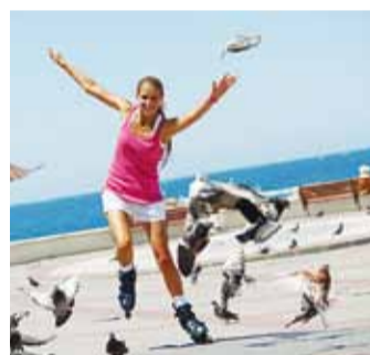
Oodatud on ka algajad harrastajad.

Kuna sõit toimub Viimsis liikluseks suletud Randvere teel, siis on kõigile piisavalt ruumi