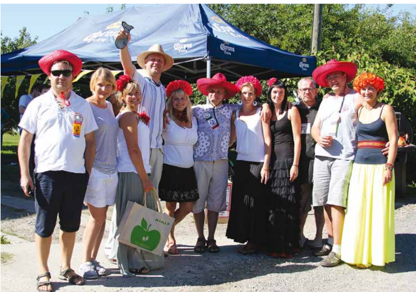
Kohvikutepäeval sai uusi tutvusi.