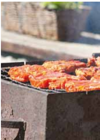
Sai ka toekamat kõhutäidet.