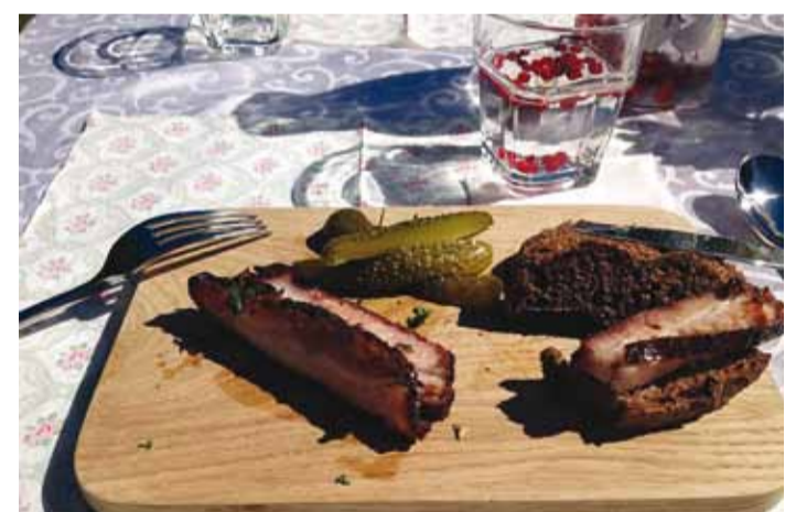
Veto kohviku hõrgutised.