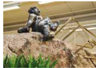
Kaubanduskeskuse toidupoes on ainulaadne 22-meetrise ümbermõõduga rändrahn, millel istub Tauno Kangro pronkskulptuur "Poehaldjas juss".