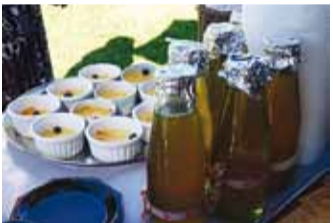
Osa Tamme kohviku menüüst.