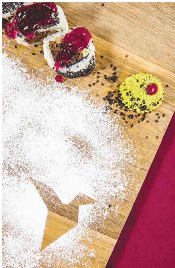
Sushi Plaza pakub rikkalikke maitseelamusi ühendades uusimad maitsetrendid Jaapani köögi traditsioonidega.

End pigem restoks mitte restoraniks nimetav Sushi Plaza on nagu Madonna, kes käib ajaga kaasas ja muudab end vastavalt trendile. Resto menüüst leiab nii traditsioonilisi kui ka tõeliselt huvitavaid ja omapäraseid sushirulle soolastest magusateni, aga ka vegantoidu sõpradele loodud spetsiaalse menüü. Kindlasti tasub ära proovida hitttooteks saanud Futomakid, Uramakid ja maailmatasemel Tempurad, aga ka pagaritalendiga teenindaja värsked koogid (näiteks suus sulav šokolaadikook või Jaapani toorjuustukook matcha ja kreemise musta seesamiseemnekihi-