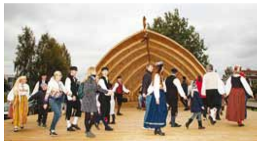
Tänavu 16. septembril avati Kelvingi külas oma laululava.