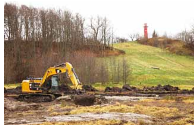
Suusamäe hooaja avamise ettevalmistustöödega planeeritakse valmis jõuda 15. detsembriks.

21. novembril algasid Lubja suusamäel ettevalmistustööd, et lume saabudes saaks nõlva vallaelanikele avada.