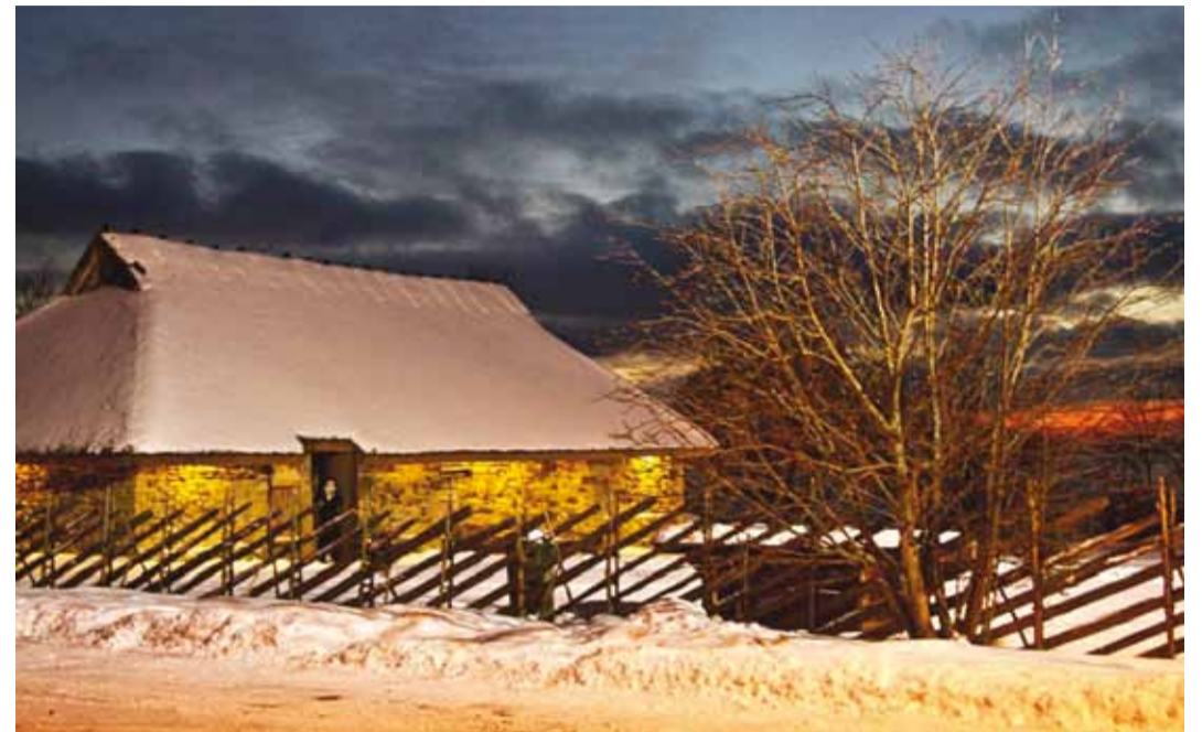
Jõulud on tänu talvisele pööripäevale üks eriline aeg aastas, kus paljud tumedad jõud eriti tugevad.

Kuid kas rannakülades olid ka mingid erilised jõulukombed? Teadaolevalt tähistati jõule ikkagi üpris sarnaselt ülejäänud Eestiga, kuigi mõned vanemad kombed võivad olla ka lihtsalt ajas kaduma läinud. Vanemal ajal olid jõulud aga üpris sisutihedad pühad. Lisaks kirikuskäimisele toimus palju tegevusi ka kodus – mängiti erinevaid mängu, noorloomad toodi külma kaitseks rehealusesse, valmistati spetsiaalset jõuleiba, mis anti loomadele söögiks. Too jõululeib sai tavaliselt ka mõne looma kuju, kõige sagedamini jõuluorika oma. Seda leiba ei tohtinud inimesed ise süüa, vaid kogu päts pidi minema loomadele.