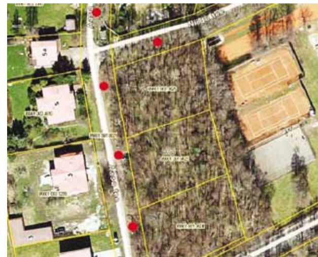
Punaste täppide asukohtadele on esialgselt planeeritud uute valgustuspostide paigaldamine.

Püüsi külas asuva Aasa tee valgustus (lõigul Kooli tee kuni Niidu tee ristmik) on amortiseerunud ning alanud on rekonstrueerimistööd.