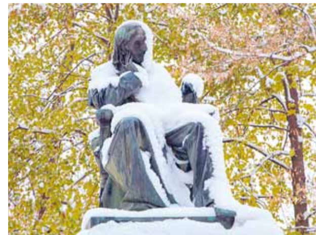
Karl Ernst von Baeri monument Tartus.

Miks on küll nii, et me inimestena oskame sageli head hinnata alles siis, kui mingil põhjusel on see meist eemale läinud, või miks küll oleme me alati tagantjärele targad, aga kohe, kui vaja, ei suuda seda?