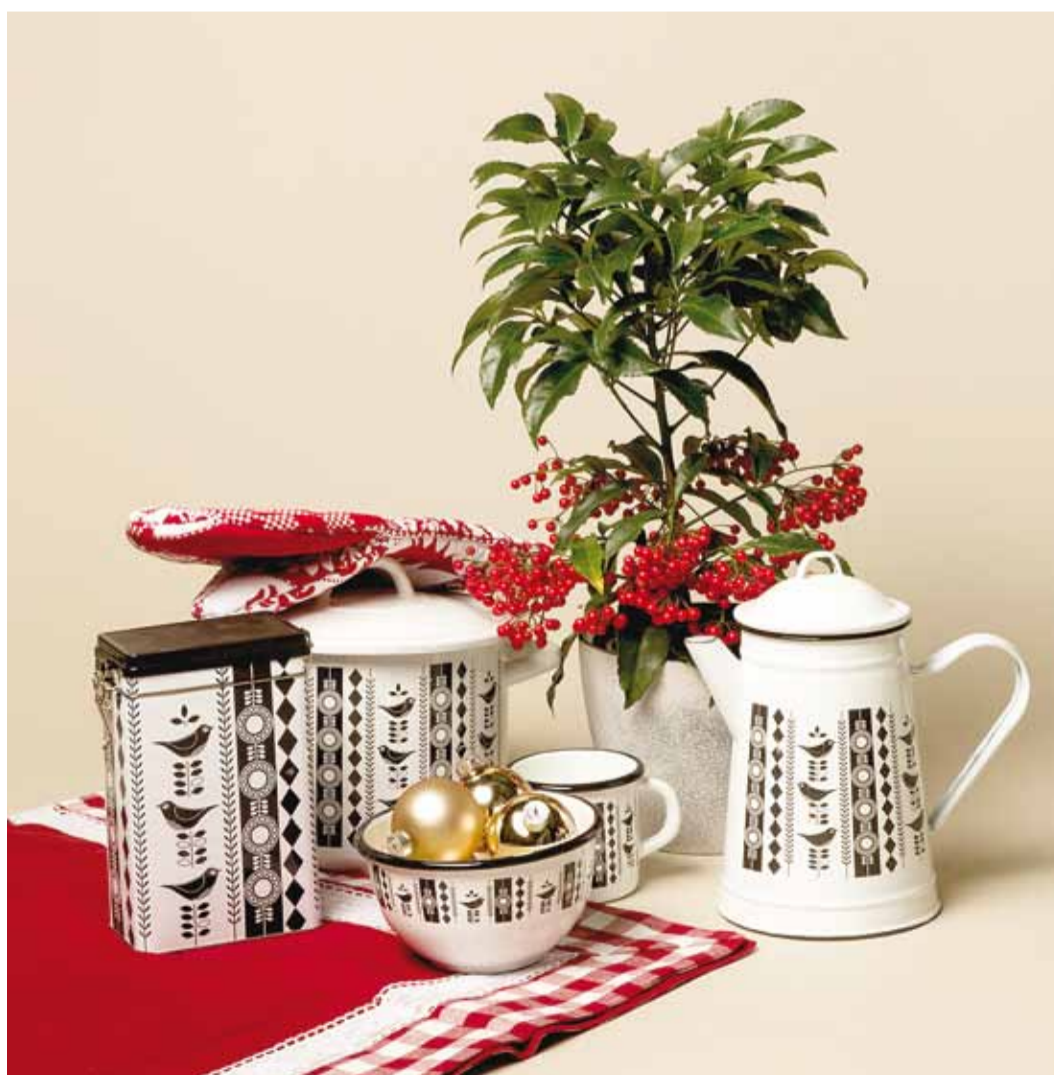
Emale, vanaemale, tädile või miks mitte ka isale, vanaemale? Fotol olevad tooted leiad Viimsi Keskuse Koduekstrast.

Kui tavapäraselt kingitakse käsi- töötarbeid eelkõige vanaema- dele, siis miks mitte kinkida midagi ootamatut sel aastal hoopis isale. Viimsi Keskuse kaupluses Koo ja Loo on saa- daval tikkimiskomplektid, mil- lega peaksid väikese pusimise järel hakkama saama ka alga- jad – lisaks tikkimiskangale ja pildile on kaasas ka kõik muud vajalikud vahendid. Tulemu- seks on kas kaunis padjakate või hoopis raamitud pilt sei- nale.