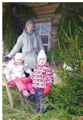
Fotonurk on ka tänavu pildistamiseks avatud.

maiustusi-kingitusi ja hommikul ärgates avastatakse neid süsside-sokkide seest. Eesti päkapikud hakkavad komme tassima advendiajal ja on tihti ametis kogu eriti pimedana ja külmal talvise aja.