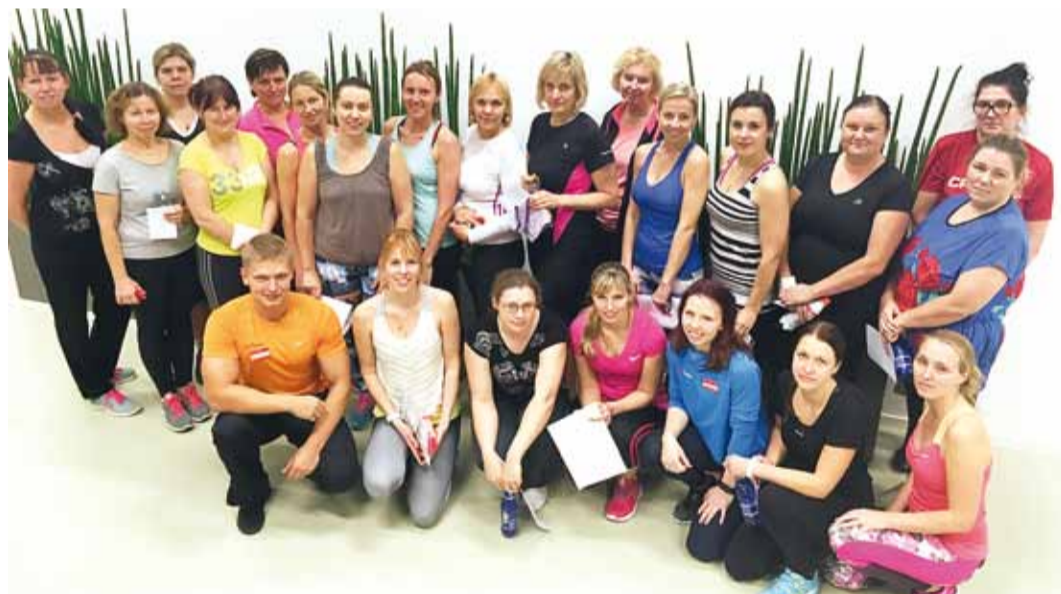
Terves kehas terve vaim.

Viimsi lasteaedade töötajatele toimus 24. novembril MyFitness Viimsi klubis sportlik meeskonnaüritus.