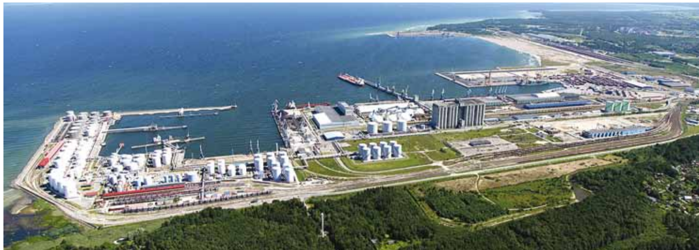
Muuga sadamas lastitakse-lossitakse ja ladustatakse toornaftat ja naftasaadusi, sega- ja puistlasti ning külmutust nõudvaid kaupu, teenindatakse konteiner- ja ro-ro tüüpi laevu. Tänu oma soodsale asukohale ning heale raudtee- ja maanteeühendusele sisemaaga etendab sadam olulist osa Eesti transiitkaubanduses.

"Tallinna Sadam on koostöös operaatorite ja partneritega viimastel aastatel teinud märkimisväärsed jõupingutusi ja investeeringuid, et leida pari-