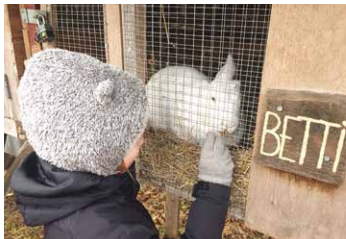
Muuseumi loomapererele – lammastele ja küülikutele – said soovijad pai teha ja päkapikusoove edastada.

näha põlemas küünlaid, mis tänapäeval on enamuses elektrilised. Kuigi adventi küünlajalg on nelja küünlaga, siis kaas-aegsemad on seitsmaga.