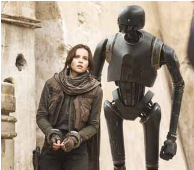
"Rogue One: Tähesõdade lugu" soojendab taas kord üles George Lucase legendaarse "Tähtede sõja" saaga.

Ajaloo huvilistele pakub põnevust "Operatsioon "Antropoid"". Filmi tegevus leiab aset aastal 1942 Prahhas, kus Tšehhi eksilvalitsuse ülesandel asusid kaks kartmatut vastupanuvõitlejat korraldama atentaati Reinhard Heydrichile, kes oli viimane oli Natsi-Saksamaa julgeoleku peaaameti juhataja ja resideerus Prahhas, kuna oli Hitleri poolt määratud juhtima Böömi- ja Määrimaa riigiprotektoraati. Nagu ameti kirjeldusest võib järeldada, polnud tegu mingi tühikargajaga ja pole siis ka mingi ime, et kohalikud "Praha lihunikud" hüüdnime kandvast mehest lahti saada soovisid.