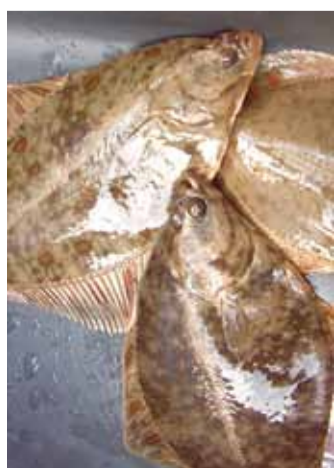
... lestal (pildil) ja räumel.

kaudu. Viimased on organismi bioloogilised muutused, mille kutsuvad esile toksilised ained. Biomarkerite vastused kalade rakkudes ja kudedes annavad infot kalade tervise ja keskkonna stressorite kohta, aga ka inimõhu ulatuse kohta kalade elukeskkonnas. Taoline meetod on teadlaste poolt Lääne-mere maades laialdaselt kasutusel.