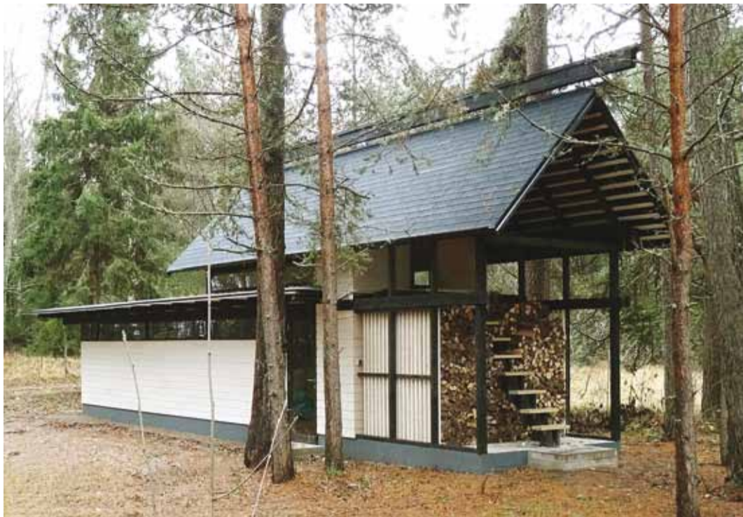
Paadikuur Naissaarel leidis puitehitise konkursil äramärgimist nutika lahenduse ja suurepärase viimistlusega.

Aasta puitehitise konkursi peaaubhinna võitis tänavu Arcwoodi tehasekompleksi Põlvas, mille loomisel on žürii hinnangul materjali- ja oskuslikult kasutatud ettevõtte peamist toodet – liimpuitu. Viimsi valda jõudis eriauhind Naissaare paadikuuri eest.