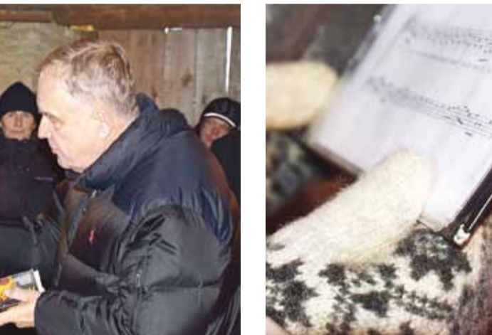
Aitäh kõikidele esinejatele!

Advendikombeid ja ootusaega sümboliseerivad Petlema täht, advendiküünlad ja advendikalender. Lapsed armastavad väga advendikalendrid, kus iga päeva taga aknakeses leidub komm või muu maius. Nii möödub jõuluootus magsalt. Paljude koduakendel võib