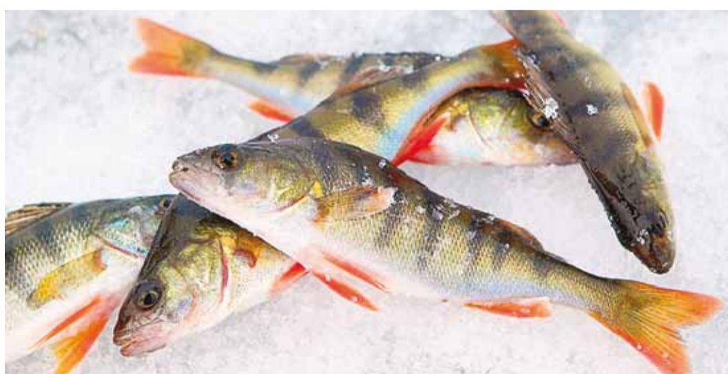
Teadurid on kahe aasta vältel hinnanud Eesti rannikumere toksikoloogilist seisundit ahvenal...

Aastatel 2014–2016 hindasid EMÜ Limnoloogiakeskuse teadurid Soome lahe piirkonda jääva Eesti rannikumere toksikoloogilist seisundit räumel, lestal ja ahvenal mõõdetud vee reostust näitavate biomarkerite