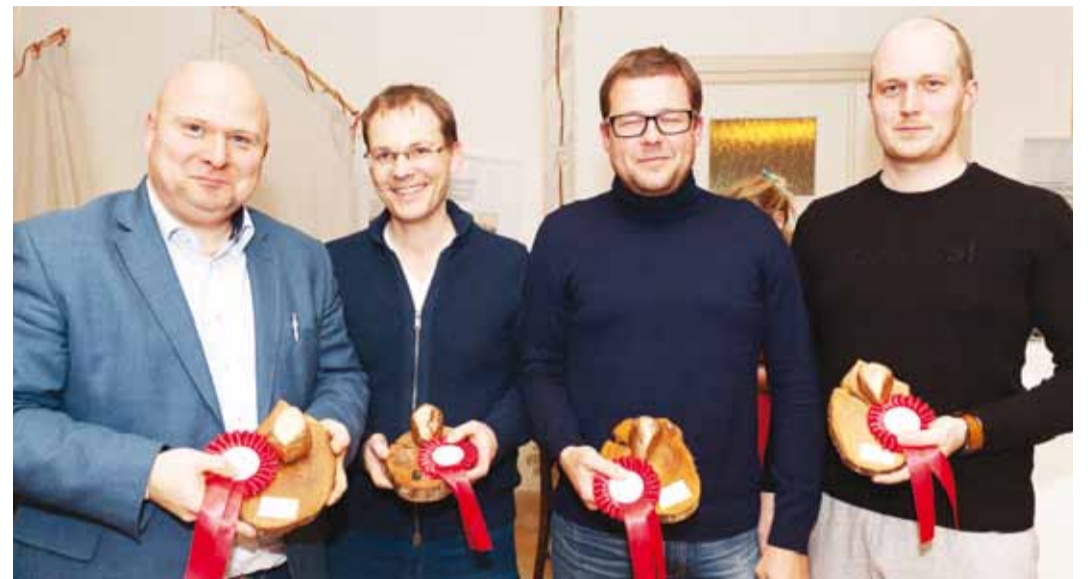
Palju õnne võitjatele! Kohtumiseni järgmisel aastal!

Mälumängusarja kokkuvõttes võitis 25 võistkonna arvestuses esikoha kõige stabiilsemat vormi näidanud Viimsi KEK, kes võitis viiest voorust kaks ning kogus lõpuks 230 punkti.