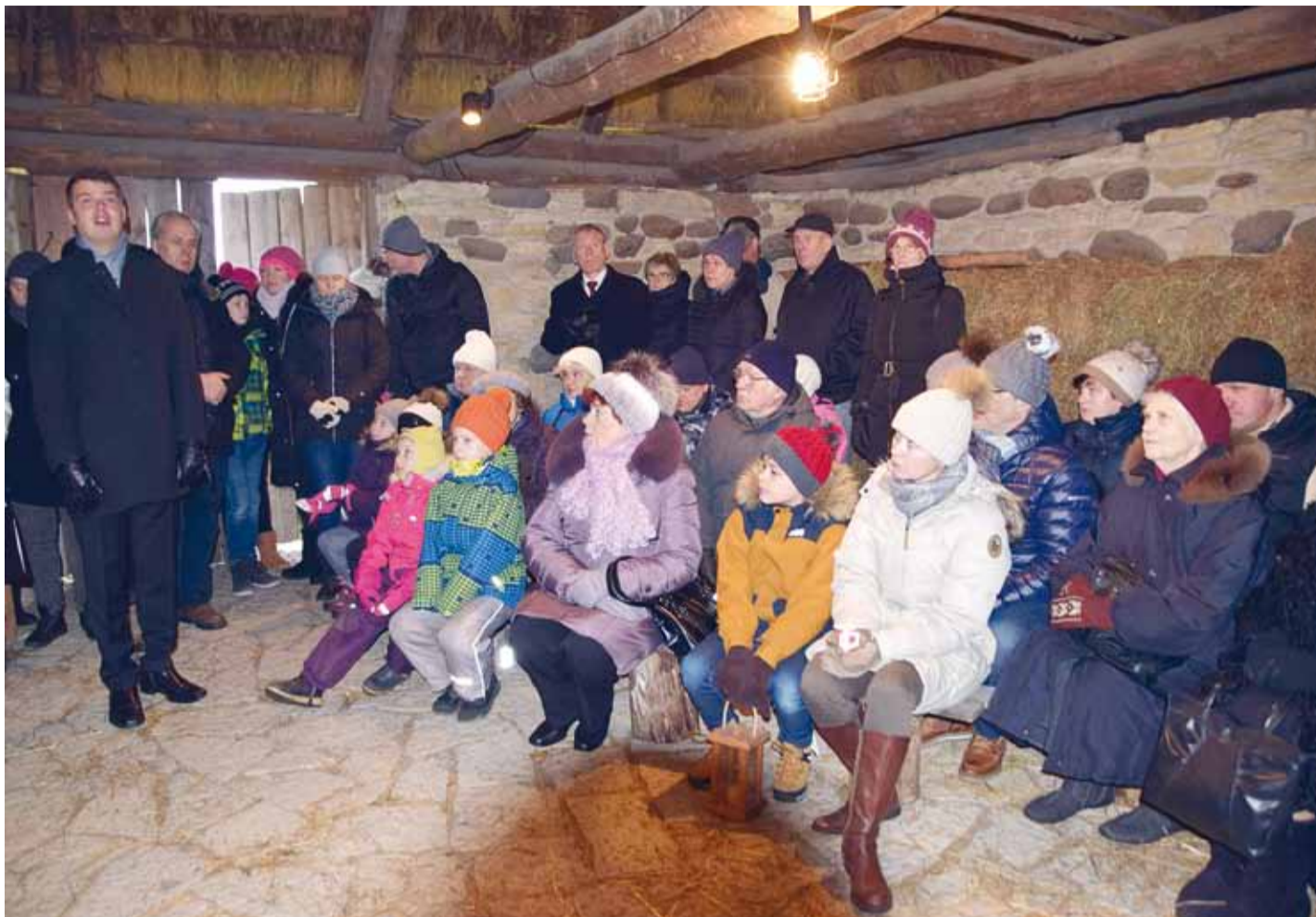
Kingu tallu kogunesid viimsilased nii lähedalt kui ka kaugemalt üle terve poolsaare.