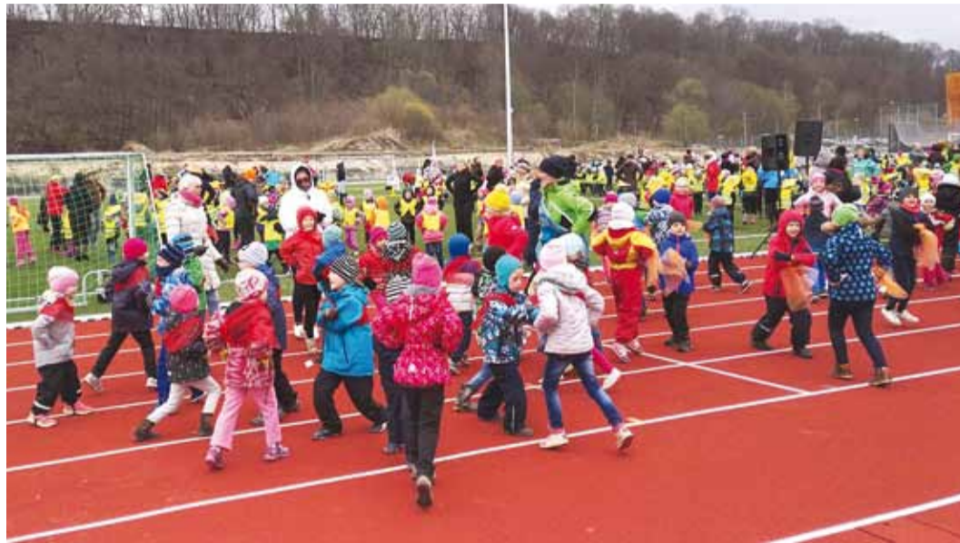
2016. aastal elab Viimsi vallas kooliealisi (7–18-aastaseid) noori 3155, kuid hinnanguliselt on 2020. aastaks noorte arv kasvanud 3600-ni. Fotol hetk MLA tantsupäevast.

See kõik on tinginud vajaduse mõtestada ja analüüsida valla hariduselu kitsaskohti ja probleeme uues valguses. Arengukava ongi selleks strateegiadokumendiks, mis pakub välja valdkonna kitsaskohtadele ka lahendusi ja erinevaid põhisuundi, kuidas võiks lähitulevikus hariduselu korraldada. Ikka selle ülla eesmärgi nimel,