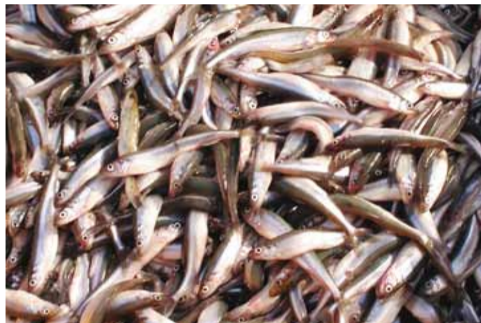
Värske meritint lõhnab nagu kurk, aga rahvasuus hüütakse teda ka haisukotiks ja hobukalaks.