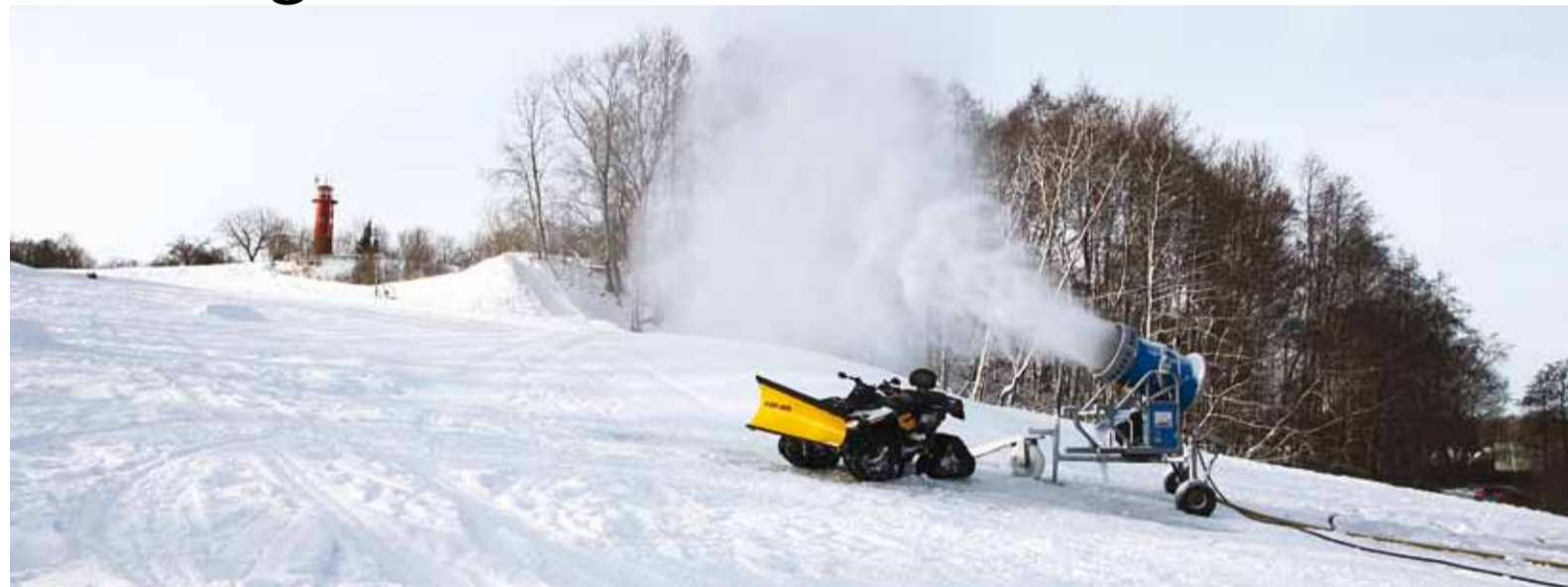
Aitäh kõigile külastajatele ning loodame jätkuvaid miinuskraade!