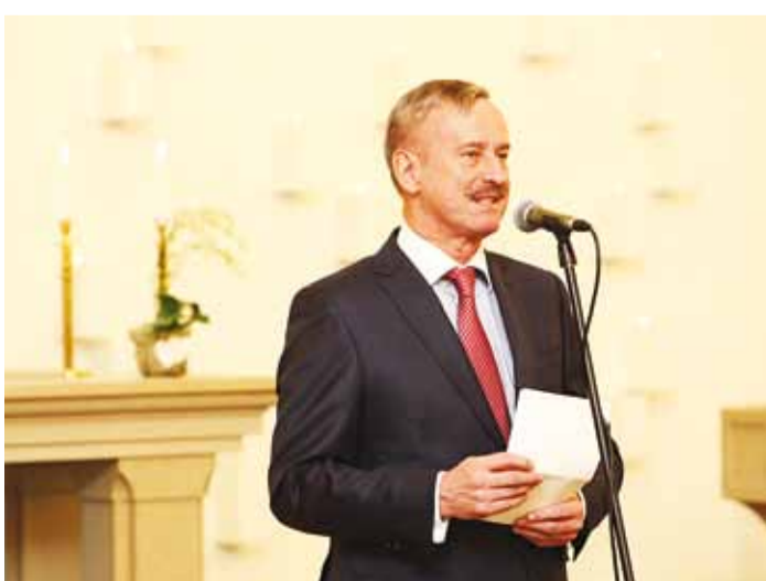
Harjumaa aukodanik Siim Kallas.