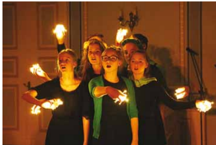
Viimsi Kooli näitetrupp Eksperiment.

vakeskus ja MTÜ-s Viimsi Pensionäride Ühendus;