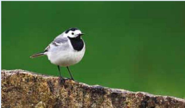
Esimesi linavästrikke võib oodata juba märtsi lõpus.

Loodushuvilised on oodatud liituma Eesti Ornitoloogiaühingu harrastusteaduse projektiga "Suvine aialinnupäevik", mis alustab oma kolmandat hooaega.