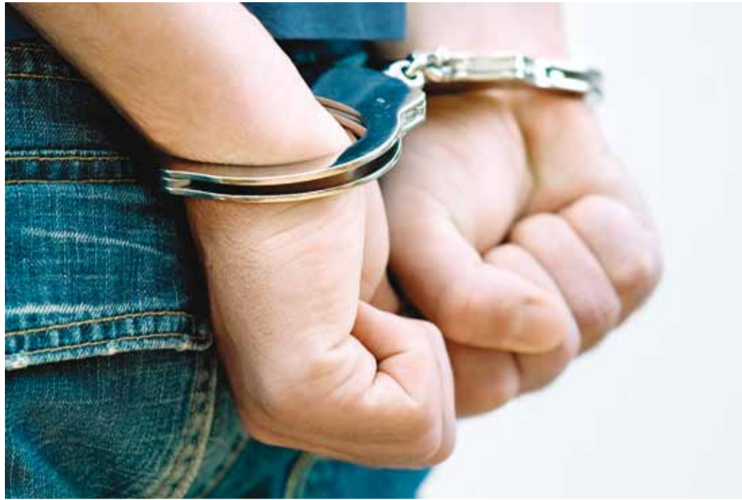
Politsei püüab kurikaelad kinni.

Suurem osa vallas registreeritud kehalistes väärkohtlemistest on seotud lähisuhtevägivallaga. Suurenemist võib selgitada inimeste teadlikkuse tõusuga. Pereringis tekkinud konfliktidest ja tülidest antakse rohkem teada. Iga lähisuhte-