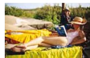
Päikesest pimestatud Tilda Swinton.

Järgmisel nädalal saabub kinodesse aga uudiseid lausa viis. Joonispanda, kes kung fu'd oskab, vast tutvustust ei vaja. Ulmeseikluste austajatele on pakkuda "Lahkulööja" sarja kolmas film "Murdmatu – osa 1" ja kõik, kes kõhuhõõnes õhuvajudinaid soovivad kogeda, on oodatud kaema stiilset ja ajastutruud õudukat "Nõid". Üle pika aja on võimalus nautida suurelt ekraanilt ka loodusdokumentaali. Kaks Jacquesi – Perrin ja Cluzaud –, kelle eelmiseks tööks oli igati lummas "Ookeanid", on valmis saanud filmi "Aastaajad", mis seekord pühendatud Euroopa loodusele. Vapustavatest vaadetest ja valdavalt tuttavatest loomariigi esindajatest koosneva teose kaadritagust teksti loeb Andres Ots.