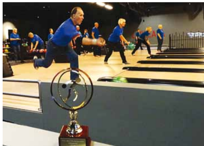
Kes keda? Mäng käib rändauhinnale.

Bowling kui harrastus on Viimsi eakate seas leidnud kindla koha ja ka tase pole laita. Seda näitas Viimsi Kuulsaalis iseseisvuspäeva tähistamiseks peetud bowlinguturniir "Kes keda", kus vastamisi olid Viimsi valla ja Pirita linnaosa eakad.