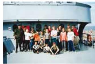
NK Harju Maleva noorkotkad ja KT Harju ringkonna kodutütreid laeval, 1990. aastad.

Rävala malevkonnas on võimalik panustada riigikaitse erinevate suunitlustega üksustes. Sisekaitsealase väljaõppega üksuste eesmärk on tagada kriisolukorras ühiskonnas turvalisus. Lahingüksused arendavad oma oskusi vahetu lahingutegevuse ülesannete täitmiseks. Loomulikult ei saada hakkama ilma formeerimisüksus-