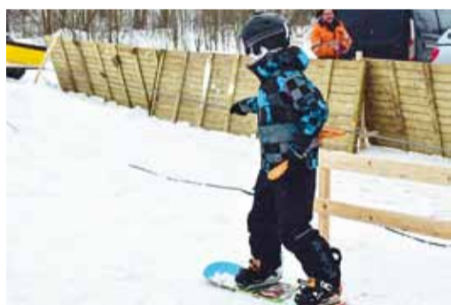
Keskmiselt saab lumelauaga sõitmise selgeks 2 tunniga.