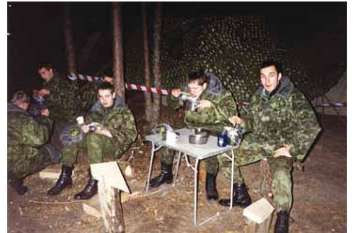
Viimsi Keskkooli sõjalise algõpetuse (riigikaitse) laager Koogil juunis 1998. aastal. Öhtusöök.

se, Kodutütarde ja Noorte Kotkaste üksused.