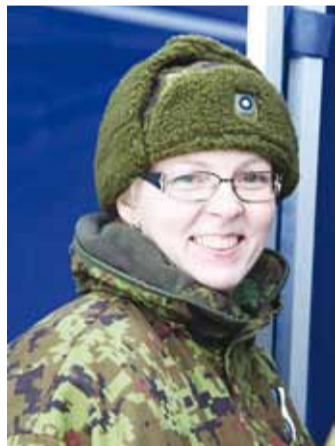
Olenemata vormist on nagu alati naerul!

mistest aru. Ta on mulle korduvalt öelnud, et tunneb uhkust, et emme on aktiivne ning panustab suuremalt kodumaa kaitseks.