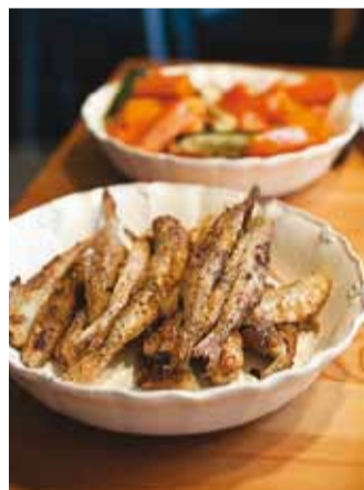
Præitud tint on maitsev.

ja nootadest, võrkudest hiilib aga lihtsalt mööda. Siia liha peetakse delikatessiks, seda eriti soolaltult. Filmis "Siin me oleme" küsib suvitaja peremehelt, mis on kõige parem asi maailmas. Ja vastus kõlab: "Siikala!" Soolasiig on oma lihtsuses tõeline gurmeerog.