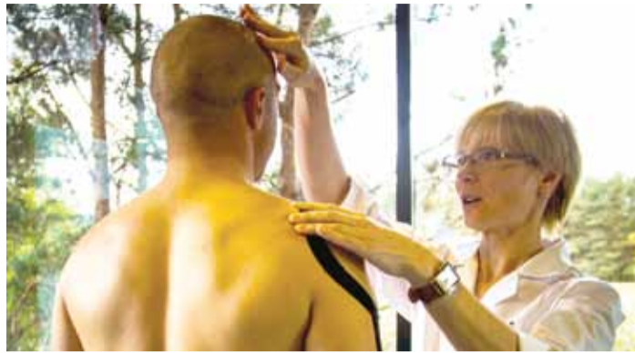
Tallinn Viimsi SPA tervisekeskuses saab seljavalule mitmekülgset abi.

Sageli nimetatakse igasugust alaseljavalu radikuliidiks, aga tõelised seljaradikuliidid