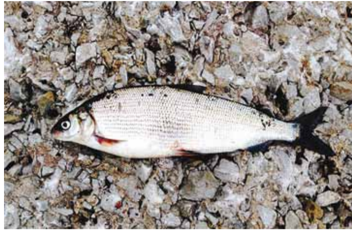
Siig on hinnaline kala, tõeline maiuspala.

Siig on kaval kala, kes oskab hästi püüniseid vältida. Ta on osav põgenema mõrdadest