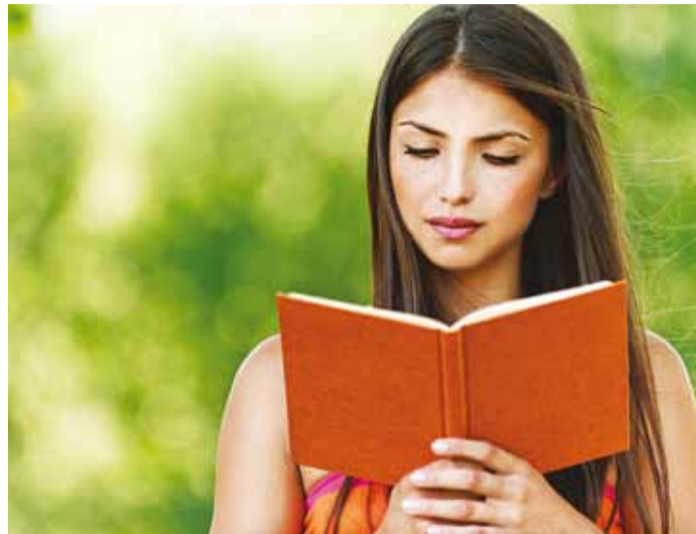
Emakeelt peame hoidma ja kaitsma.

Kroonik kirjutab: "Jõesuus tulid papile vastu saarlased, tungisid talle kallale ja võtnud tema koos poisikesega ja mõningate liivlastega kinni, viisid oma röövilaevadega minema ja, läinud Age jõe kaldale, piinasid teda seal mitmesuguste piinadega. Kui ta nimelt taeva poole pöördunult koos oma