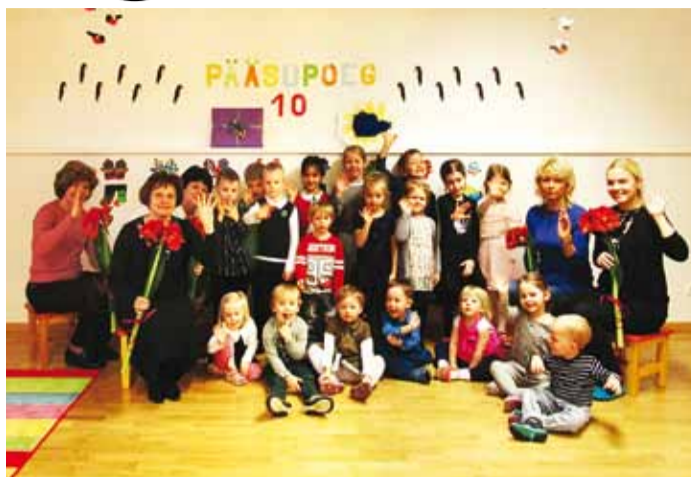
Pääsupoja lapsed sünnipäevapeol.

Igapäevaselt pannakse suurt rõhku liikumistegelustele ja