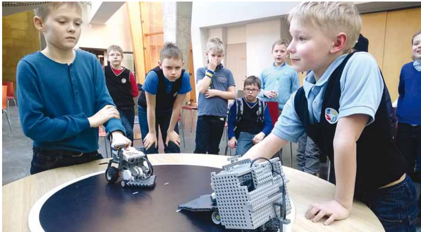
LEGO Sumo robotikavõistlus.

- Loodus-, täppis- ja tehnoloogiateadused ja tehnoloogia (LTT): teadusring Taibu, eksperimentaalne loodusteadus, rebase Ruudi loodusring, matemaatikaring Nupula, robotikaring, elektroonikakursus Digi, programmeerimisring Püüton, multimeedia-