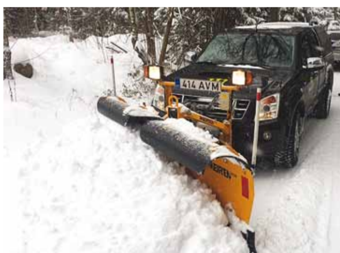
Kogemused näitavad, et tänapäeval on üheks kõige mugavamaks, kiiremaks ja operatiivsemaks lumeajajaks maasturid koos neile paigaldatud sahkadega.

duteedel algas talihooldede valve 1. novembrist, mis tähendab, et ollakse valmis ootamatu lume ja libeduse tõrjeks. Kuna juba eelmisel aastal kostitas talv meid mitme suurema lumeperioodiga, siis parema kvaliteedi ja ohutuse tagamiseks hooldab nüüd Viimsi põhiteid ja riigi maanteed kaks kohapeal baseeruvat raskeveokit, mis on varustatud puisturi, esi- ja külgsahaga.