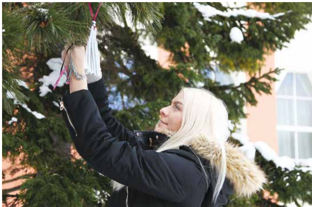
Kui sinul on helkur veel puudu, siis tule Viimsi vallavalitsuse juurde, sest puudele kinnitatud helkurid ootavad omanikku.

Lisaks helkurite kontrollile koordineeris Viimsi huvikeskus helkuripuude projekti, kus löid kaasa kõik Viimsi koolid, noortekeskused ja mitmed siinsed lasteaiaid. Oleme toredate helkurite eest tänulikud Viimsi, Haabneeme, Püüsi ja Randvere koolide õpilastele ja õpetajatele, Päikeseratta, Pargi, Karulaugu, Randvere, Lillelaste, Põnnipesa