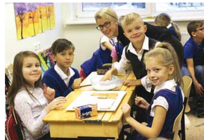
Üks kõigi, kõik ühe eest!