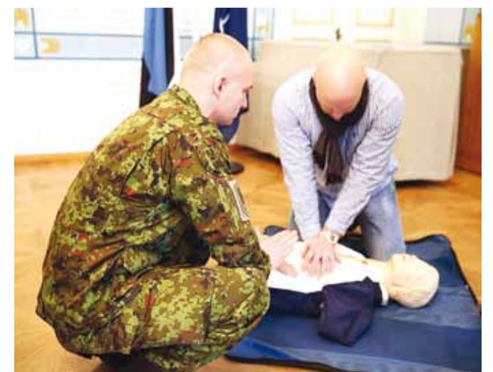
Õpetust said nii lapsed kui ka isad.