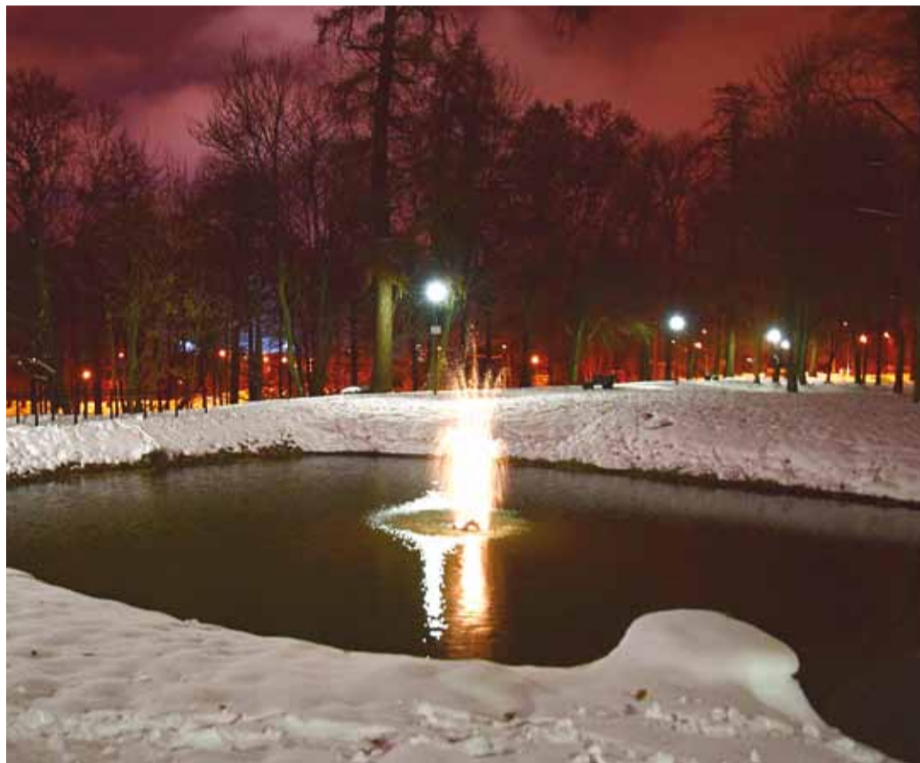
Mõisapargi I etapi mahukad tööd on jõudnud lõpule ning nüüd on pargis võimalik nautida romantilist jalutuskäiku.

Novembris lõppesid Viimsi mõisapargi keskosa korrastustööd, mille käigus uuendati ligi 4 hektari suurusel alal sademeveesüsteemid, puhastati tiigid, rajati kärestik ja valgustusega purskkaev, korrastati haljastust, rekonstrueeriti ajaloolised teed ja valgustus. Paigaldati ka uued pingid, prügikastid ja stendid.