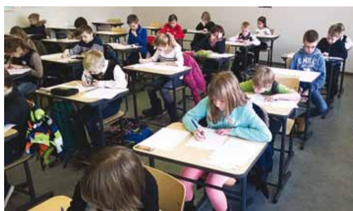
Viimsi valla koolide 3. klasside matemaatikavõistlus "Nuputaja".

Noorte edasiõppimise valikuid mõjutab sageli kuvand LTT valdkonna keerulisusest ja elukaugusest. Selleks, et noortel teki sügavam personaalsem huvi ja positiivne kuvand teadusest ja tehnoloogiast, ei tule oodata keskkooli lõpuni, vaid luua tingimused juba algkooliõpilastele huvi äratamiseks, hoidmiseks ja süsteemseks arendamiseks. Kuna alg- ja põhikooliõpilastele ei ole just palju väljundeid oma annete arendamiseks LTT valdkonnas, siis tekkis süsteemiseks lähene-