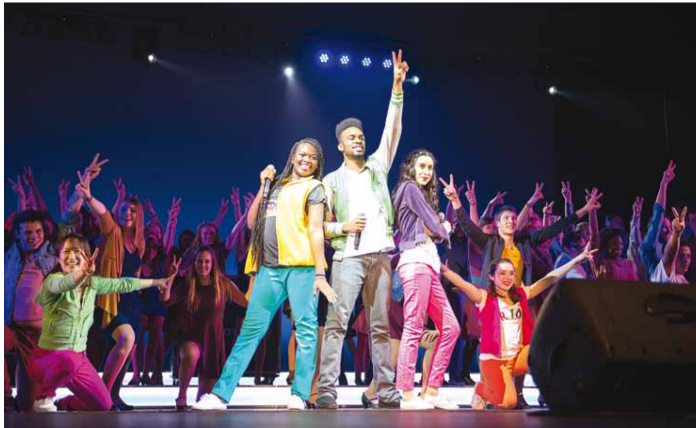
UWP trupi "Cast B 2016" muusikalist produktsiooni "The Journey" saab näha 3. detsembril Tallinnas Nordea Kontserdimajas.

Tallinnas viibides tegelevad UWP noored nädala jooksul heategevustööga ja külastavad viit kooli: Viimsi Kooli, Tallinna Pae Gümnaasiumi, Tallinna Läänemere Gümnaasiumi,