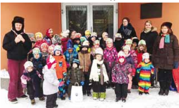
MLA Viimsi Lasteaiad Astri maja lapsed töid õnne ja mõistatusi ka vallamajja!

Suur aitäh õpetajatele ja vanematele, kes lapsi õpetasid!