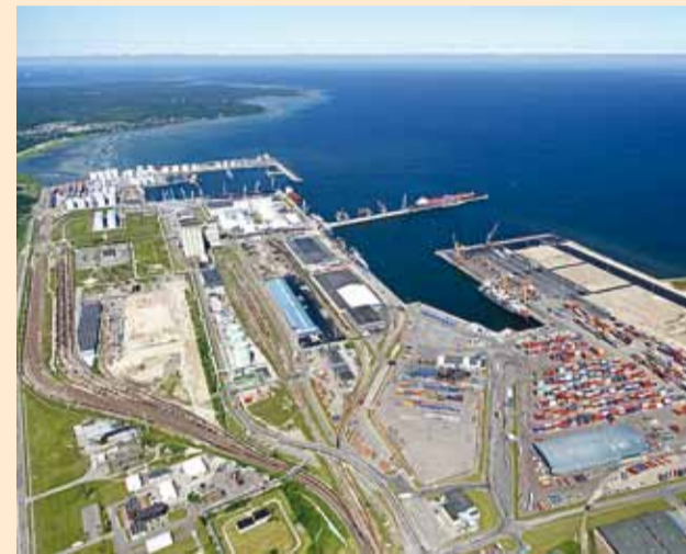
Viimsi vallas asuv Muuga sadam on Eesti suurim ja sügavaim kaubasadam.

10. novembril tutvusid Viimsi, Jõelähtme ning Maardu omavalitsuste esindajad Muugal Eesti suurima ja sügavaima kaubasadama – Muuga sadama – tegemiste ja tulevikuplaneerimisega.