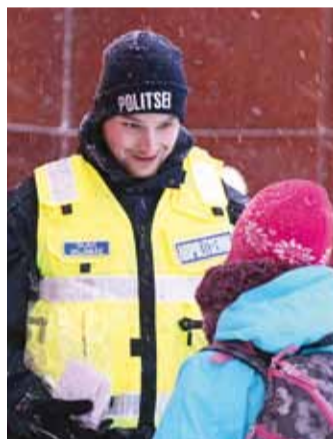
Kanna helkurit, paista silma ja sära!

ja Kelvingi lasteaedade mudilastele ja õpetajatele ning Viimsi ja Randvere noortekeskuste noortele ja töötajatele, Isemoodi isetegijate loovustoa, Püüsi lasteaia ning Prangli laste ja noortele.