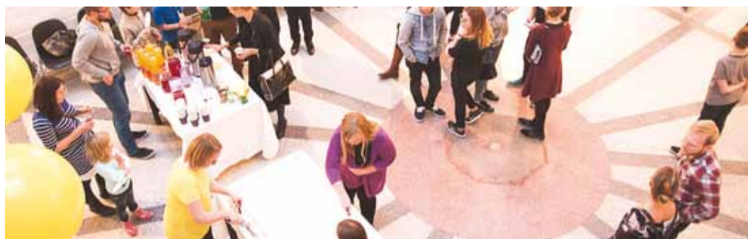
Tort oli suur ja magus.