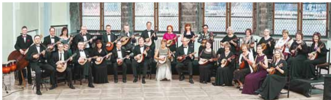
Saku Mandoliinid ootavad kontserdile!

33-liikmeline orkester Saku Mandoliinid tähistas sel sügisel alles neljandat sünnipäeva, kuid on lühikese tegutsemisaja jooksul juba palju jõudnud. Valminud on kümnekond erimeelset kontserdikava, mille repertuaar ulatub itaalia meloodiatest krimifilmide tunnusmeloodiateni ning maailma rahvaste muusikast läbi ja lõhki eestimaiste