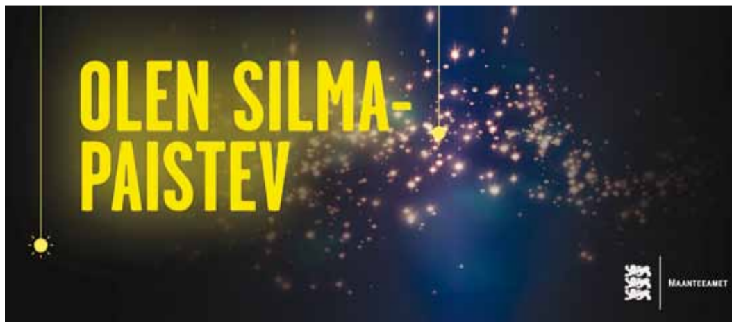
"Olen silmapaistev" kampaaniaga kutsub Maanteeamet end pimedal ajal nähtavaks tegema.

Selleks, et helkurist ka abi oleks, peab see vastama kindlatele nõue-