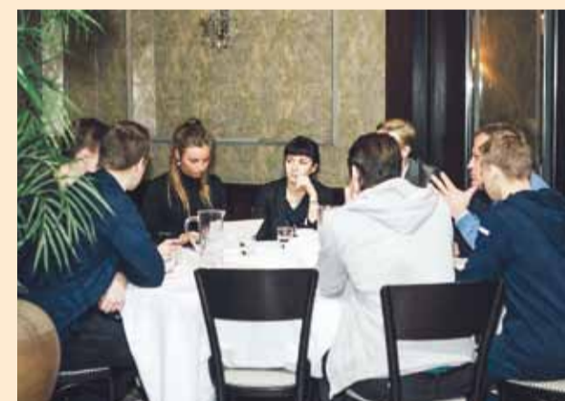
Aitäh kõikidele osalejatele ning kohtumiseni järgmisel aastal!

3. novembril korraldas Viimsi noortevolikogu koostöös Tallinna noortevolikogu ja Harju maavalitsusega restoranis Gloria Tallinna ja Harjumaa osaluskohvikut.