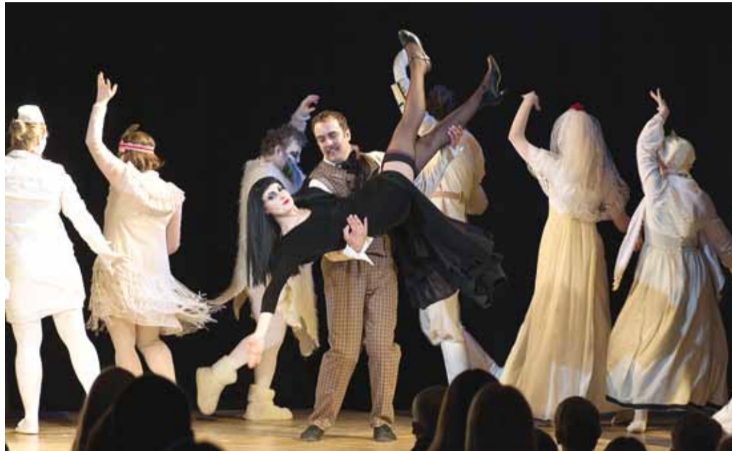
Laureaat Viimsi Muusikaliteater esitab muusikali "Perekond Addams".

Kõige suurem mure oli lavastamisel Kati jaoks see, et ööpäevad olid liiga lühikesed. "Ent kui peas kuu võtnud pildid hakkasid laval elusaks muutuma ja näitlejad mõtlesid kaasa, siis tekkis ka rõõm. Tuli lavastada ka tantsud, tegeleda dekoratsioonide ja rekvisiitidega – tegevus, mida päris teatris teevad vastavad inimesed, aga meil valmib see ühistööna, nt hilis-