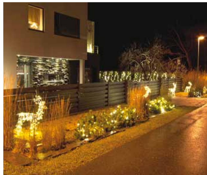
Rohuneeme tee 21/2.

kogu tänav muutnud muinasjutuliseks võlumaaks. Ilus ümbur vähendab stressi!