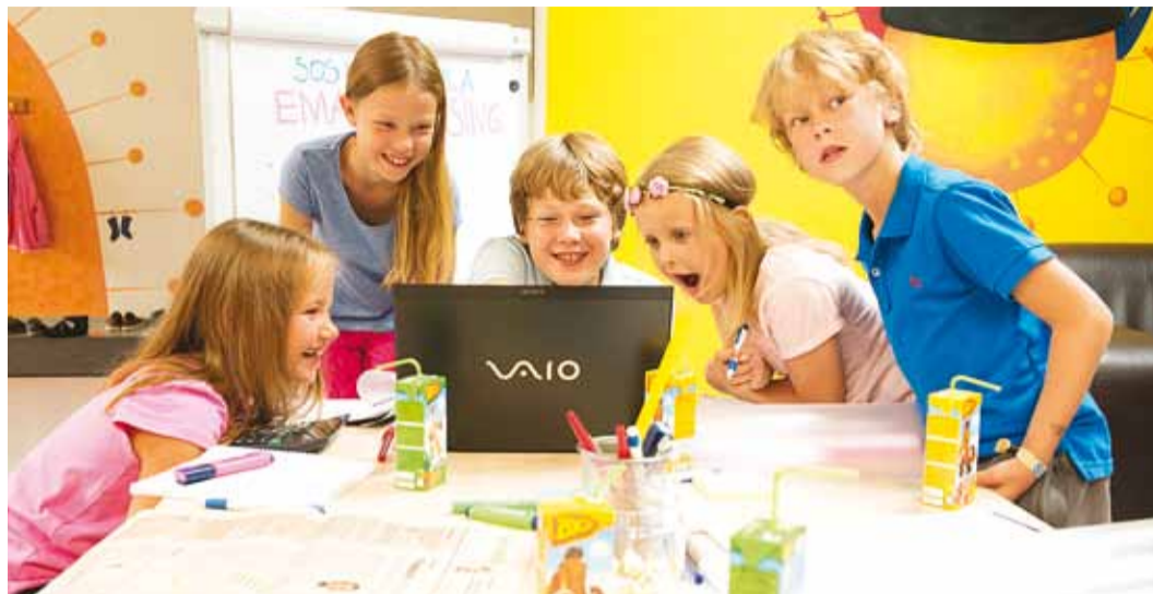
Iga laps väärrib oma kodu.

“Meie soov on leida häid emasid ja isasid neile lastele, kes on kaotanud oma bioloogilised vanemad. Seekord käib emade ja isade otsimine läbi väikeste laste silmades. Kui äriettevõtted palkavad tippjuhtide leidmiseks appi professionaalsed personaliotsingufirmad ja talendiotsijad, siis SOS Lasteküla otsustas teha sama – kaasata perevanemate otsimise protsessi tippasemel eksperdid,” ütles SOS Lasteküla tegevdi-