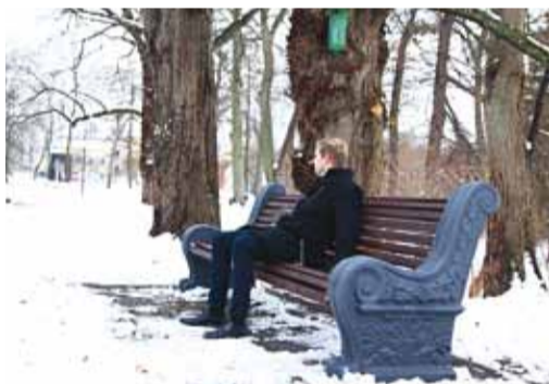
Mõisaparki paigaldati toekad pingid, millel on hea jalga puhata ja mõtiskleda.