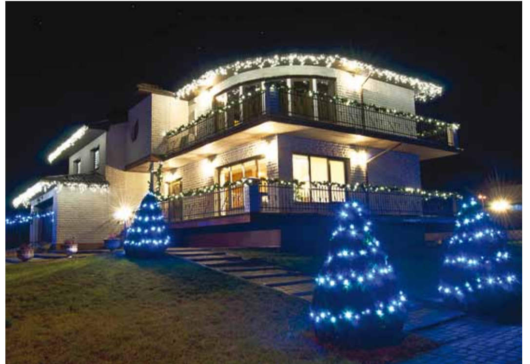
Kesk-Kaare tee 49/2.

Konkurs "Jõulutuled" on juba mitu aastat levitanud talvise aiakaunistamise indu. Mõnel tänaval on tulede spaleer levinud iga aastaga pikemaks – üksikutele kaunistatud majadele on tulnud lisa ja lõpuks on