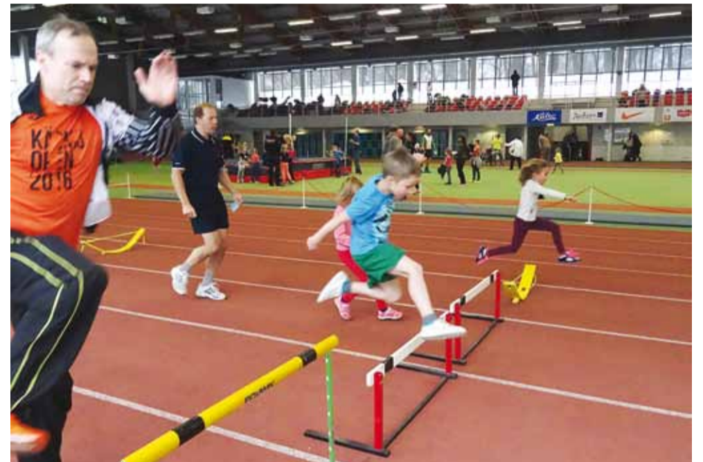
Aitäh kõikidele, kes panustasid ettevalmistusse ning kes kohale tulid!