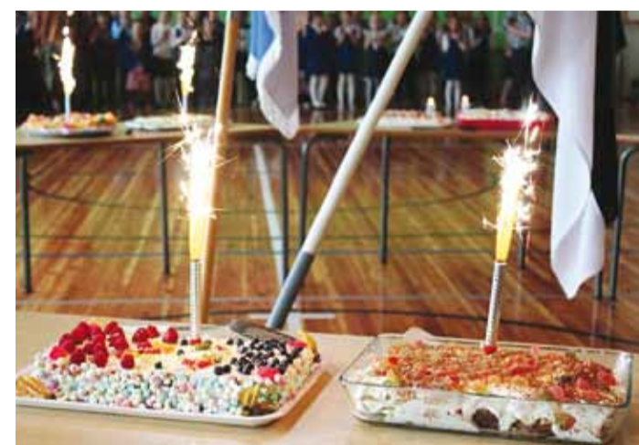
Igale klassile päris oma sünnipäevatort ja mõned rohkem.