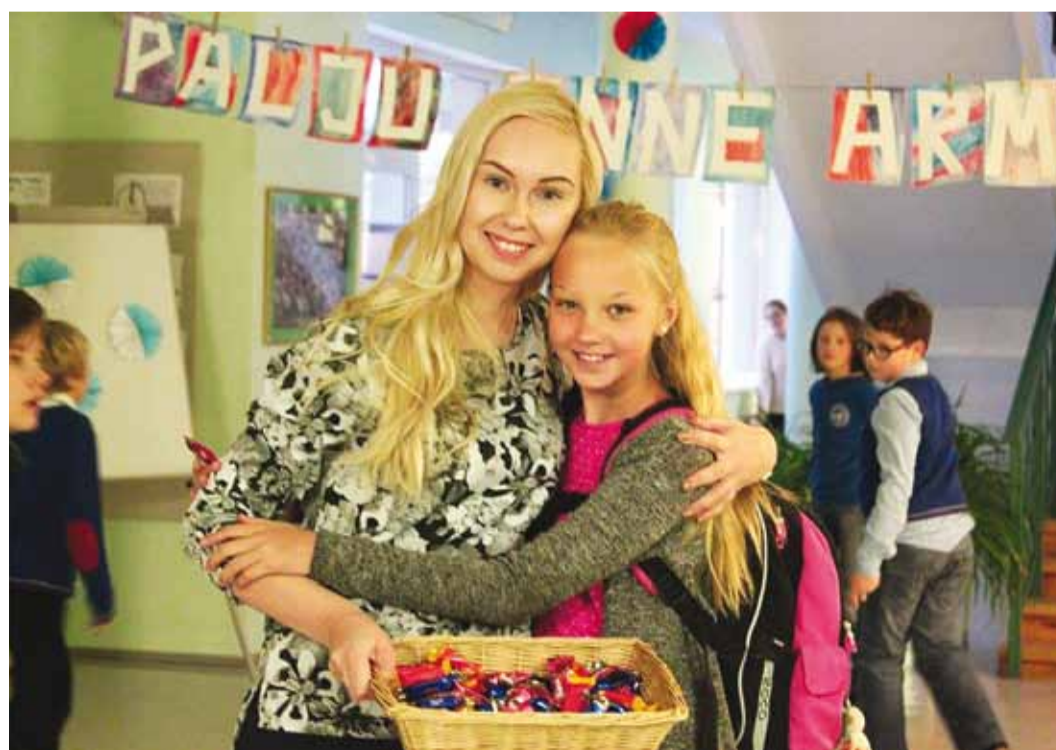
Palju õnne, armas koolipere!

1. tund kulus kõikidel klassidel küpsisetortide valmistamisele. Igal klassil ja lasteaiarühmal olid oma ideed ja püüti valmistada just see kõige maitsvam ja väljapaistvam tortiteos. 5. tunni ajal kogunes kogu koolipere võimlasse, kus kõikide klasside ja lasteaiarühmade tordid olid ka teistele vaatamiseks välja pandud. Lauldi oma kooli hümmi ja tantsiti üheskoos sünnipäevatantsu.