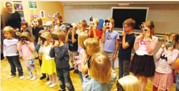
Mardi- ja isadepäev Püüsi lasteaias.

Aastatega on kaduma hakanud meie pärimustraditsioonid, mis kipuvad asenduma võõrsilt tulnud kommertslike kommetega. Laste arengu seisukohalt on aga oluline säilitada ja anda edasi esivanemate kultuuri, tunda oma juuri, olla seotud oma kodupaigaga ning ennast seeläbi määratleda.