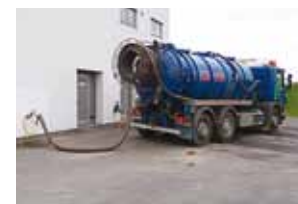
Reovee puhastamine Muuga puhastis.

1. oktoobrist kehtima hakanud uue Viimsi valla reovee kohtkäitluse ja äraveo eeskirjaga seonduvalt juhime tähe- lepanu, et Viimsi valla territooriumil reovee äraveo teenust osutav ettevõtte peab oma vallavalitsuse kommunaal- ameti poolt väljastatud vedaja kaarti ning registreeringut (nõutav 6 kuu möödudes peale määrase jõustumist).