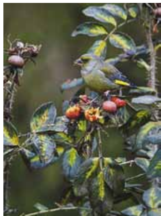
Parimad fotod 2015. aasta fotokonkursist: "Toit" ja "Ootus".

Ylivieska fotoklubi alustas juba 1961. aastal. Algne tegutsenud oli vilgas, kuid 1970-ndate lõpuks vaibus tegevus. Aastal 1984 kutsus tolleaegne Ylivieska kultuurinõunik kokku grupi harrastusfotograafe ja valiti fotoklubile juhatus ning tegevus käivitus uuesti.