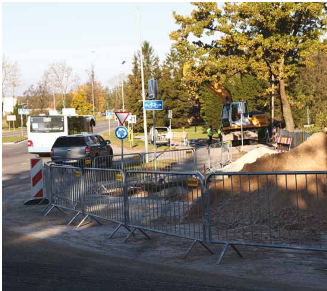
Aiandi teel remonditakse üht suurema liiklustihedusega lõiku.

Kuna ka teaalused kommu- nikatsioonid vajavad mitmel pu- hul uuendamist, siis võimalu- sel planeeritakse töid koostöös partnerettevõtetega nii, et vaja- likud rekonstrueerimistööd sam- mas piirkonnas toimuksid pa- ralleelselt. Elanike jaoks võib