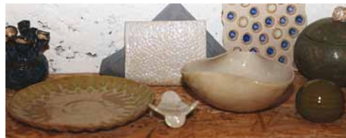
Savi pakub lõputuid võimalusi loominguks.