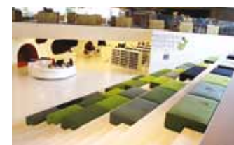
...ja selline raamatukogu asub Viimsi sõprusvallas Porvoos.

Raamatukogu kogud on võrreldes 2005. aastaga kasvanud pea kaks korda ja praegu on lugejaile pakkuda juba üle 60 000 eksemplari erinevat kirjandust, millele lisandub igal aastal vähemalt 4000 uut raamatut. Küllalt sageli on päevi, kui raamatukogu külastab enam kui 300 inimest, kes ei soovi enam piirduda ainult raamatute laenamise ja vahetamisega, vaid tahaksid siin pikemalt viibida, et töötada vaikuses nii arvuti kui ka raamatutega või hoopis valjuhäälselt koos kaaslastega arutada päevaprobleemide üle. Ainult, et raamatukogu pindala on jäänud ikka samaks, mis kümnekond aastat tagasi – 466 m 2 , mistõttu juba mõnda aega ei mahu siia enam ei uusi raamatuid ega lugejaid, rääkimata üritustel osalejatest, kui kohtuma on tulnud mõni tuntud inimene. Kokkuvõttes on raamatukogu jäänud väikeseks nii ruumilt kui ka pakutavate teenuste sisu poolest. Aeg on muutusteks, sest tänapäeva raamatukogu on avatud, elustiili toetav asutus, kus on võimalik tegeleda kõige huvipakkuvaga – tunda end nagu kodus.