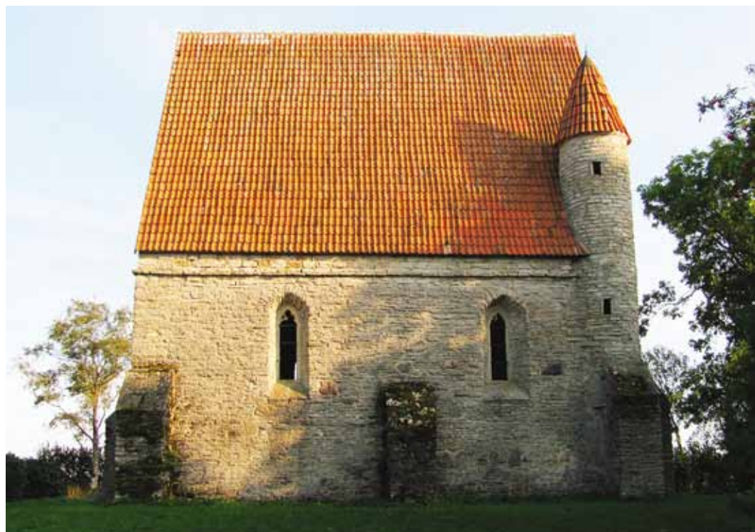
Saha kabel on üks vanim terviklikul kujul säilinud külakabel.

Edasi kulges tee läbi Ül-gase küla, kus juba esimesel Eesti ajal maa-alustes kaevandustes fosforiiti kaevandati ja mis jätkus maapealsest kaevandusmeetoditega kogu nõukogude aja. Nüüd on Ül-gase maa-alused kaevanduskäigud looduskaitse all ja seal talvitub suur nahkhiirte populatsioon.