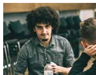
Zibo esindaja mõtlemas mobiilirakendusest, millega saab toitu koju tellida.

motivatsiooni on noortel väga tarvis,” lausus Alt.