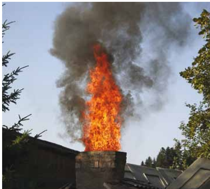
Tahm suitsulõõris võib süttida ja tulekahju ongi käes.

5 Pärast hooldustööd annab korstnapühkija akti, millele mõlemad pooled alla kirjutavad. Aktil on kirjas tehtud tööd ning korstnapühkija kut-