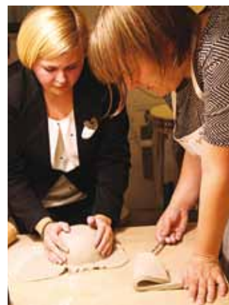
Töö juba sujub ja kauss võtab kuju.