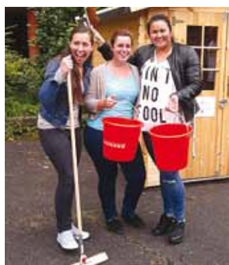
Õpilased korda pidamas ja koristamas.

Suvel käis eripedagoog Inglismaal tutvumas ja ideid saamas, kuidas seal erivajadustega