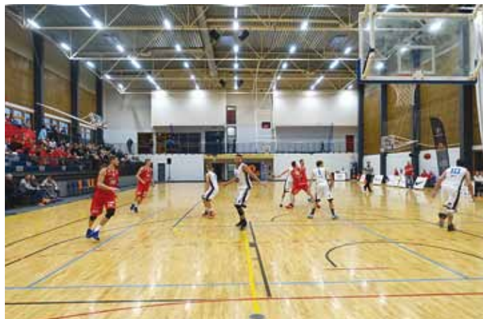
KK Viimsi/Kesklinna KK võitis südika mängu ja Viimsis toimunud korvpallipeoga juurde nii mõnigi poolehoidja.

“Müts maha meie meeskonna ees, kes pakkus poolehoidjatele kaks sisukat mängu ning kuhjaga emotsioone. Tugevam võttis küll oma, aga suutsime vastasetele piisavalt peavalu valmistada. Täna Rapla meeskonda, fänne ja managementi , et ühiselt Viimsis tõelise korvpallipeo püsti panime. Loomulikult tänusõnad ka kõikidele teistele fännidele, toetajatele, sponsoritele ning abilistele, kes mängu kõrgel tasemel toimumisele kaasa aitasid,” rääkis klubi tegevjuht