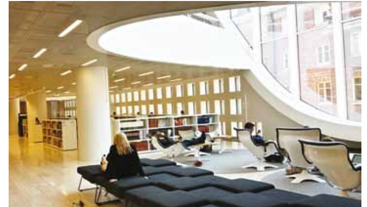
Selline näeb välja ülikooli raamatukogu Kaisa-talo Helsingis...

Viimsi inimesed on luge-mishuvilised, kellele raamatukogu külastamine on tähtis igapäeva tegevus. Täna on Viimsi raamatukogus enam kui 7400 registreeritud lugejat (2005. aastal 1556) ja üle 4000 aktiivse lugeja, kellest kolmandik on lapsed.