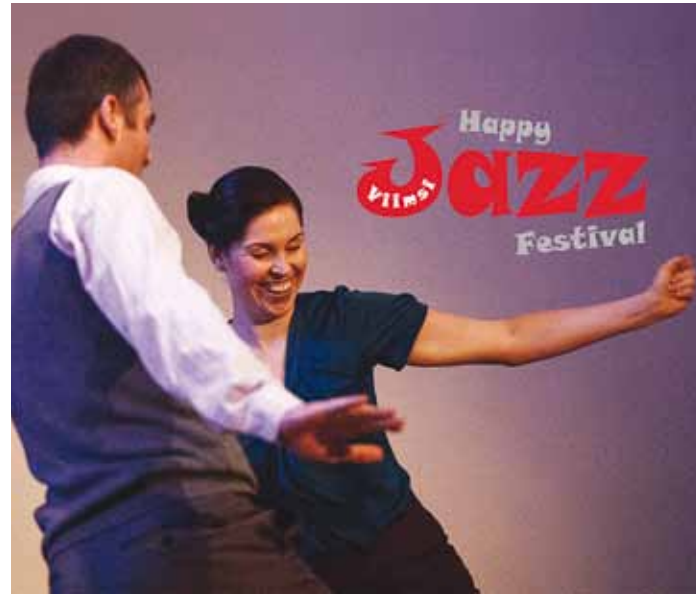
Lindy-hopi tantsiti Ameerika tantsusaalides 1920–1940ndatel svingmuusika saatel ning stiil sai nime üle ookeani lennanud Charles Lindberghi järgi, keda hüüti Lucky Lindy.

1930ndatel toimus palju muudatusi ka muusikamaailmas. Tekkis muusikastiil, mida hakati nimetama svingiks. Põhiliselt hakkasid svingi esitama bigbändid, kuhu koondusid klarinet, saksofon, trompet, tromboon, klaver, kontrabass ja trummid. Svingmuusikas on väga tähtsal kohal rütm ja tänu sellele kasutati seda tihti peale just