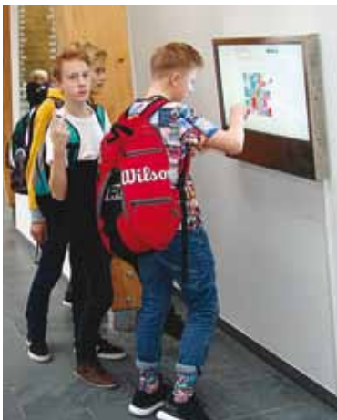
Vald kinkis koolile interaktiivse infotahvli.