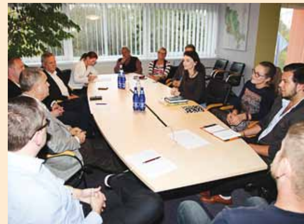
Traditsiooniks saanud kokkusaamised vallavalitsuse ja noortevalitsuse esindajatega jätkuvad ka tulevikus.

13. oktoobril kohtusid vallavalitsuse esindajad Viimsi noortevalitsuse uue koosseisu esindajatega, kes valiti septembris 2016.