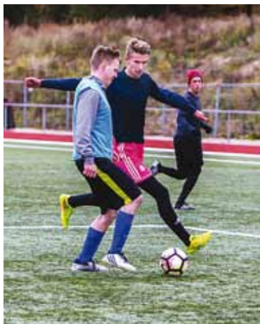
Jalgpallimatš Viimsi staadionil.