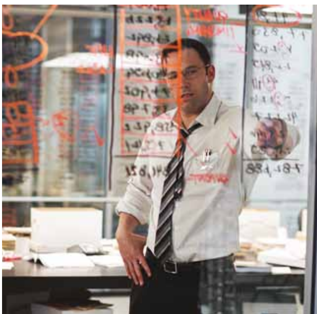
Ben Affleck filmis "Audiitor".

Oktoobrikuu viimasel reedel esilinastuvatest teostest peatume veel kahel. Esimese puhul on aluseks jällegi M. L. Stedmani rahvusvaheline bestseller. Filmis "Valgus ookeanide vahel" on I maailmasõja veteran Tom otsustanud koos oma noore naise Isabeliga võtta vastu majakavahi ameti saarel, mis asub rannikust pea poole päeva mere sõidu kaugusel. Peale mitut nurisunnitust on naine tõeliselt depressioonis päevani, mil randa triivib paat surnud mehe ja elus beebiga. Mees soovib lapse mandrile tagasi viia, naine näeb selles Jumala kingitust ning lõpuks otsustavad nad siiski lapse endale jätta. Kuni selgub, et lapsest tunneb puudust veel üks hing. Osades Michael Fassbender, Alicia Wikander ja Rachel Weisz.