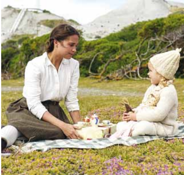
Alicia Wikander mängib filmis "Valgus ookeanide vahel" naist, kes leiab lapse.

21. oktoobril esilinastub Viimsis romantiline suhtedraama pealkirjaga "Maggie plaan". Nimikangelane pole leidnud armastust ning nii otsustabki ta hankida lapse omapead.