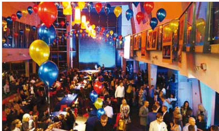
Viimsi Keskkooli sünnipäeva pidustused.

14.–18. oktoobril tähistas Viimsi Keskkool oma 35. aastapäeva. Kuigi ajaloolisi radu pidi tagasi minnes jõuame Viimsi kooli alguspäevadele ehk 1866. aastal avatud Viimsi esimese koolimajani, tähistas Viimsi kool just 35. keskkooli aastapäeva.