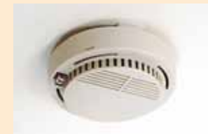
Turvalisema kodu aitavad tagada suitsuandur ja vingugaasiandur.

Kodudes, kus kasutatakse maagaasi ehk n-ö olmegaasi, tasuks paigaldada ka gaasiandur, samuti peaks ahju või kaminaga kodus olema vinguanurid.