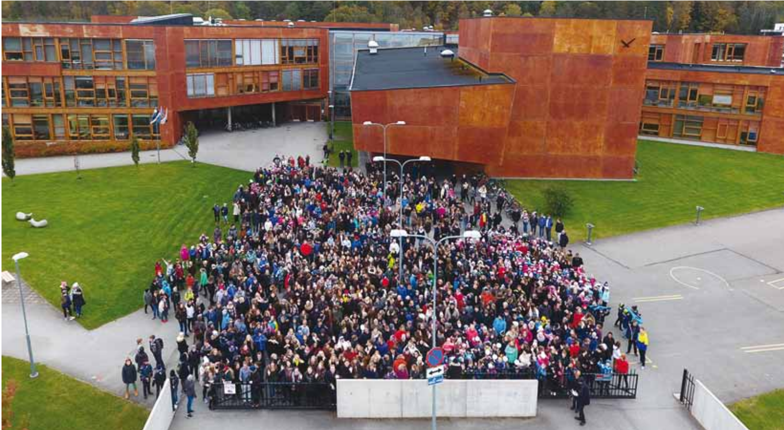
Viimsi kool ja koolipere.