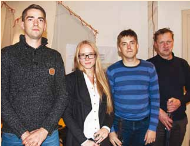
Palju õnne võitjatele!

Rannarahva muuseumis jätkus Viimsi mälumängusari neljanda vooruga ning sellel korral napsas esikoha Muuga küla esindus.