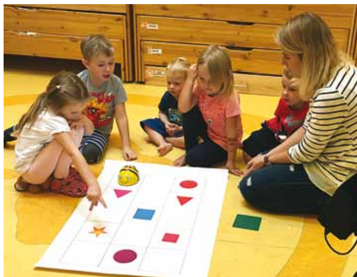
Lõbusad põrandarobotid Bee-Botid on suureks abiks lapse arengul.

Lasteaias oli hästi toimiv robotikaring, saime õpetajatele tutvustada, kuidas robotika legokomplekte kasutada. Lõime internetis ühiskausta leitud õppemängude ja materjalide jagamiseks. Lisaks hankisime juurde harivaid legokomplekte ja lõbusad põrandarobotid Bee-Botid.