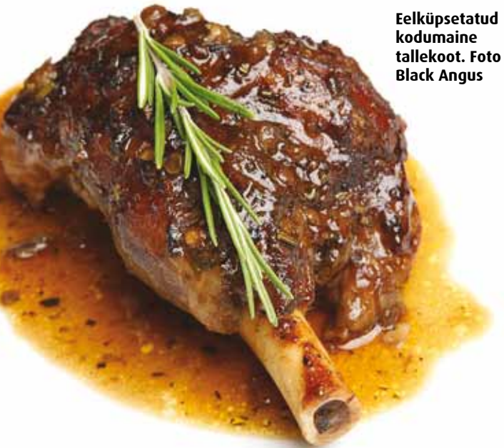
Eelküpsetatud kodumaine tallekoot.

Kaupluse sortimendis on näiteks Uruguai teraviljaveise liha, Paraguai rohumaaveise liha ning Uus-Meremaa talveliha – lihad, mida hinna ja kvaliteedi suhtes on otstarbekas kaugemalt sisse tuua, kuna nende tootmishind Euroopa maaes on ebamõistlikult kõrge. Black Anguse tootevalikus on esindatud kõik enamlevinud lihasordid: sea-, veise-, lamba-, küüliku- ja erinevad linnuliha. Lisaks müüb Black Angus erinevaid lihatooteid, näiteks Saksa tüüpi bratwurste ja vinnutatud sinke. Spetsiaalselt Black Anguse kaupluse jaoks töötas tippkokk Imre Kose välja mitmesugused kastmed ja marinaadid lihadele.