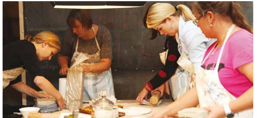
Alguses tuleb valida, mida teha.

Maris ise on tegelikult hoopis õppinud hüdrografia inse-neriks, aga ega loovus diplomit küsi. Keraamikaga on ta tege- lenud juba seitse aastat. "Ahju soetamine oli justkui proovikiviks, kas ma ikka tõesti seda kõike tahan. Nimelt seadsin endale eesmärgiks, et ahju ostmiseks vajalik raha tuleb mul teenida 100% oma käsitööga – tel- limused keraamikale, erinevate käsitöökoolituste korraldamine.