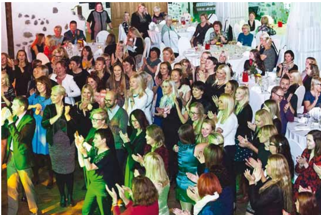
Õpetajad rõõmustavad ja peavad pidu.

Tänavusele õpetajate päevale lisas erilist pidulikkust asjaolu, et hariduse andmise algusest Viimsis möödus 150 aastat. Õpetajate päeva tähistati 7. oktoobril restoranis Viktoria ning õhtut juhtis Jan Teevet.