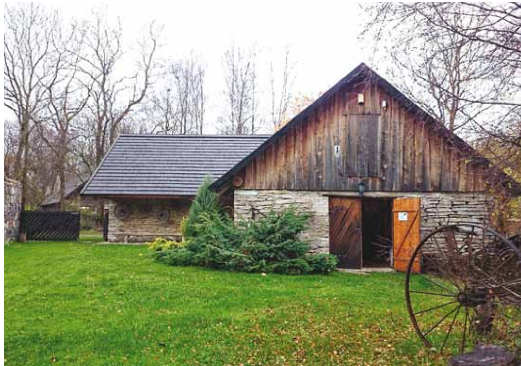
Rootsi-Kallavere külamuuseum on rajatud elanike eestvõttel.

Käsitööharrastust jätkatakse muuseumis tänapäevalgi. Saime näha Jõelähtme rahvarõivaste erinevaid variante, käiste mustreid ja seelikuid ning nende erinevat värvigammat. Neid rahvarõivaid peetakse ajalooliste sidemete tõttu ka Viimsi omadeks. Kangastelgedel kootakse värvilisteks vaipadeks iga riideriba, aga nii on see otstarbekas olnud ajast aega. Tänapäeval pakub see tegevus aga ennekõike loomisrõõmu.