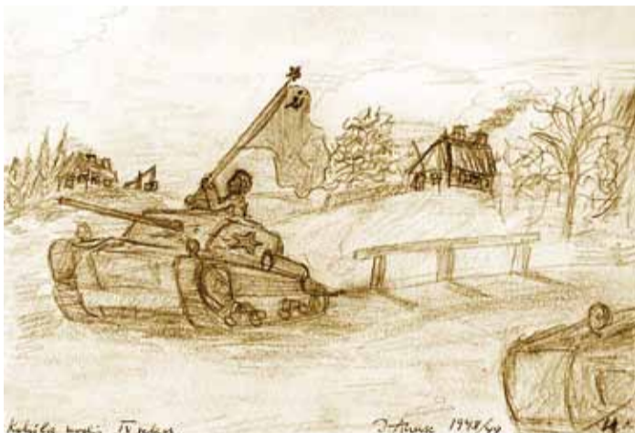
Museumile kingitud sõjateemaline pilt Kohila kooli IV klassi ajast.

maasjata. Aga midagi kaudset ikka kuskilt meelde jääb. Nii et kui kutsutakse, ma tulen hea meelega!"