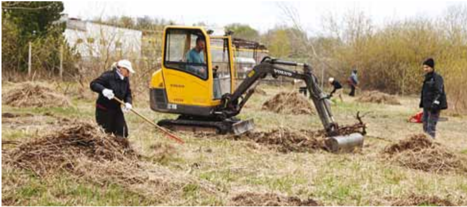
Viimsi vallavalitsuse talgud toimusid möödunud aastal Haabneeme rannas.