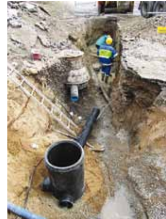
Vee- ja kanalisatsioonitorustike ehitus.

25.04–13.05 toimub rannaala kaeveala korrastamine, haljastamine, ronimisredelite normi- kohane kinnitamine. 21.–22.04 paiku on kavas Männi tee piirkonna killustikaluse ettevalmistamine, servade lõikamine, tihendamine ja profileerimine. 25.04–05.05 toimub Vahtra tee killustikaluse ettevalmistamine, servade lõikamine, tihendamine ja profileerimine, kivisillu- tise paigaldamine kaevetööde käigus eemaldatud kinnistute sissesõitudel. 21.–25.04 toimub Kolhoosi tee soojatrassi äärsel ala ja Mereranna tee 3/Kolhoosi tee 5 kinnistult üleliigse piinase väljavedu ning 25.–29.04 Kolhoosi tee ettevalmistamine freesipuru tee ehitamiseks, tihendamine ja profileerimine, tee- ehitustööd, haljastustööd. 27.–