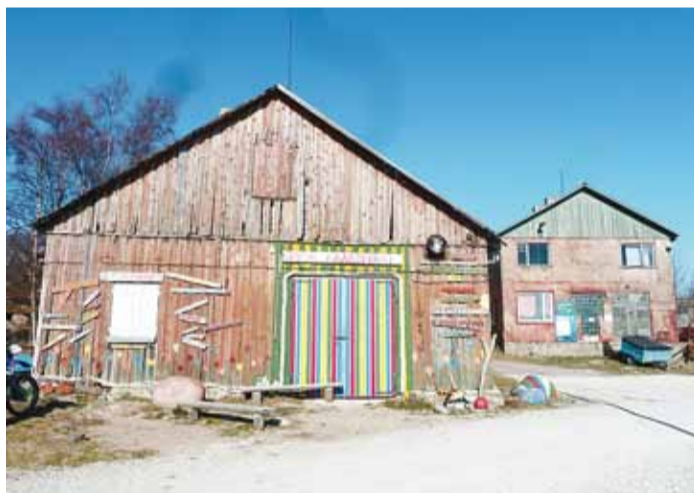
Kelnase sadamas tervitab tulijaid Noor Kaardivägi, kus hooajal töötab turismiinfo ja saab jalgrattaid laenutada.