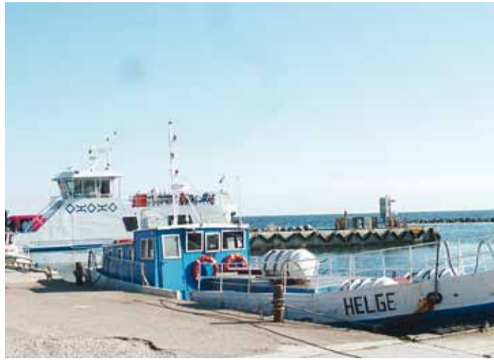
Parvlaev Wrangö ja vana postipaak Helge on varakevadel sadamas üsna üksikud.