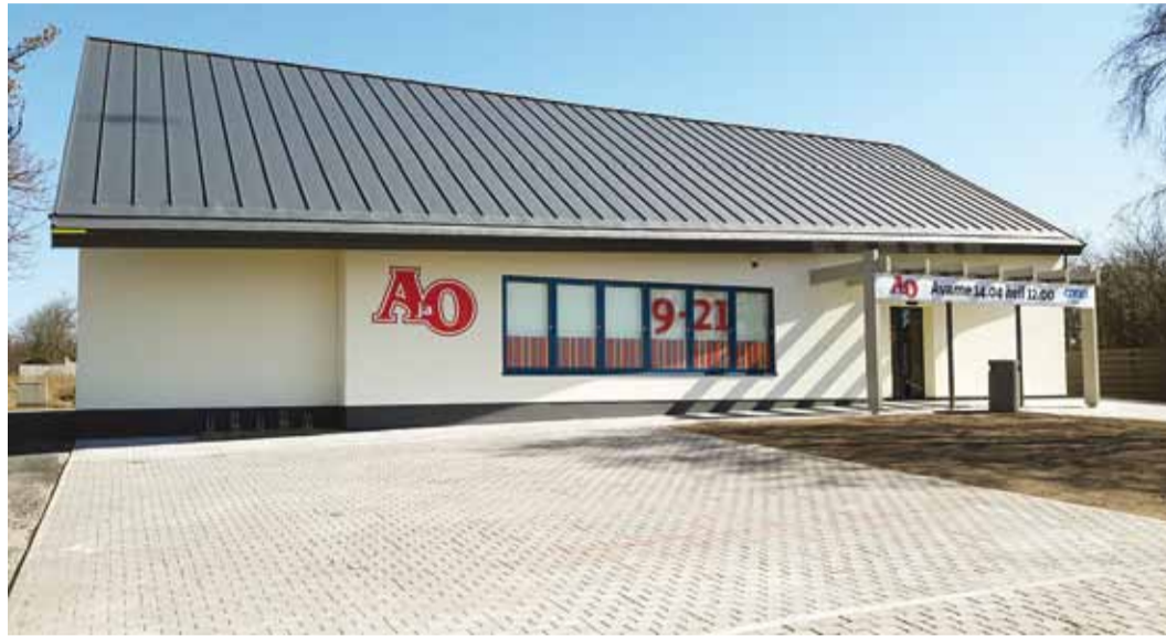
Tere tulemast, Rohuneeme AjaO ootab!

AjaO on Harju Tarbijate Ühistu pood. Ühistule kuulub 20 Konsumi, AjaO ja E-Ehituskeskuse ketimärke kandvat poodi Tallinnas ja Harjumaal.