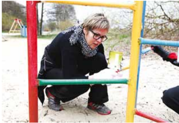
Talgute korras puhastati ja värviti ranna mänguväljakud.

Teeme Ära talgupäev toimub traditsiooniliselt maikuu esimesel laupäeval, tänavu 7. mail. Talgupäeva eesmärk on edendada ettevõtlikkust ja aktiivset eluhoiakut, parandada meie ühist elukeskkonda ning tugevdada kogukondi.