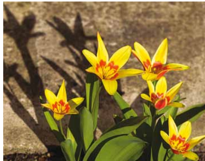
Kevadlilled näitusmüügil leiab ka Kaufmanni tulbi Tulipa Corona.

Laura, missuguse valiku-ga on üritusel kohal Viimsi Aiand?