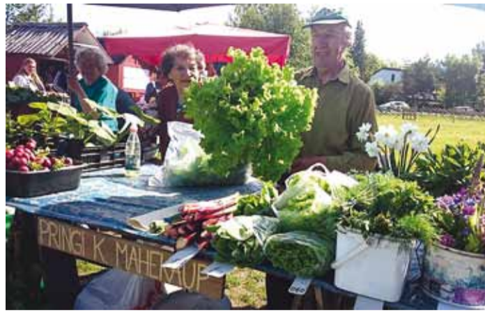
Möödunud aastal oli rohevahetus viimsilaste seas väga populaarne.

Harvad ei ole juhused, mil muuseumi perenaine lambad tu-