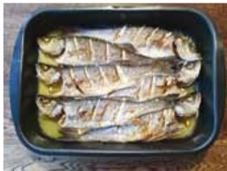
Huntahvenaroggu kuuele.

Veendu, et kala on kenasti puhas. Kui sulle meeldib ka krõbedat nahka süüa, siis pead soomused maha kraapima. Kala on õrn ehk siis pisut tege-