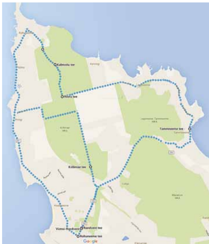
Jooksuteekond Viimsi valla kaardil.

Märkejooks kujutab endast kolme ringi sprinti mäest üles. Distantsi pikkus on 30–40 meetrit ja märke joostakse ükshaaval. Treener võtab aega ja iga ring tuleb läbida eelmisest kiiremini. Mägi pole väga järsk, kuid iga korraga tundub