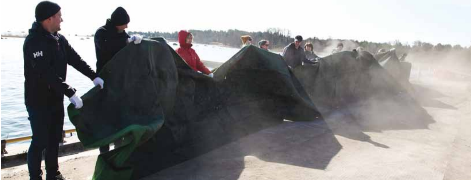
Prangli saare talgute suurimaks ühiseks talgutööks oli eelmisel aastal kultuurikuuri vaiba kloppimine.