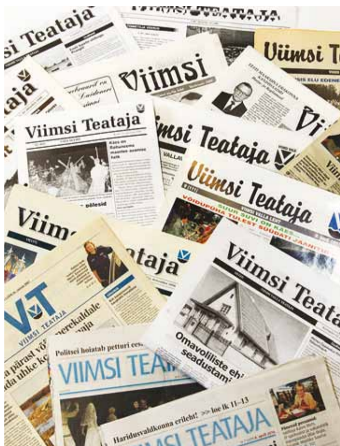
Viimsi Teataja päis on ajaga mitu korda muutunud.

20. detsembril 1990 taas-sündis Viimsi vald. Juba 1990. aasta juulist alates hakati ka valla teavet rahvale edastama