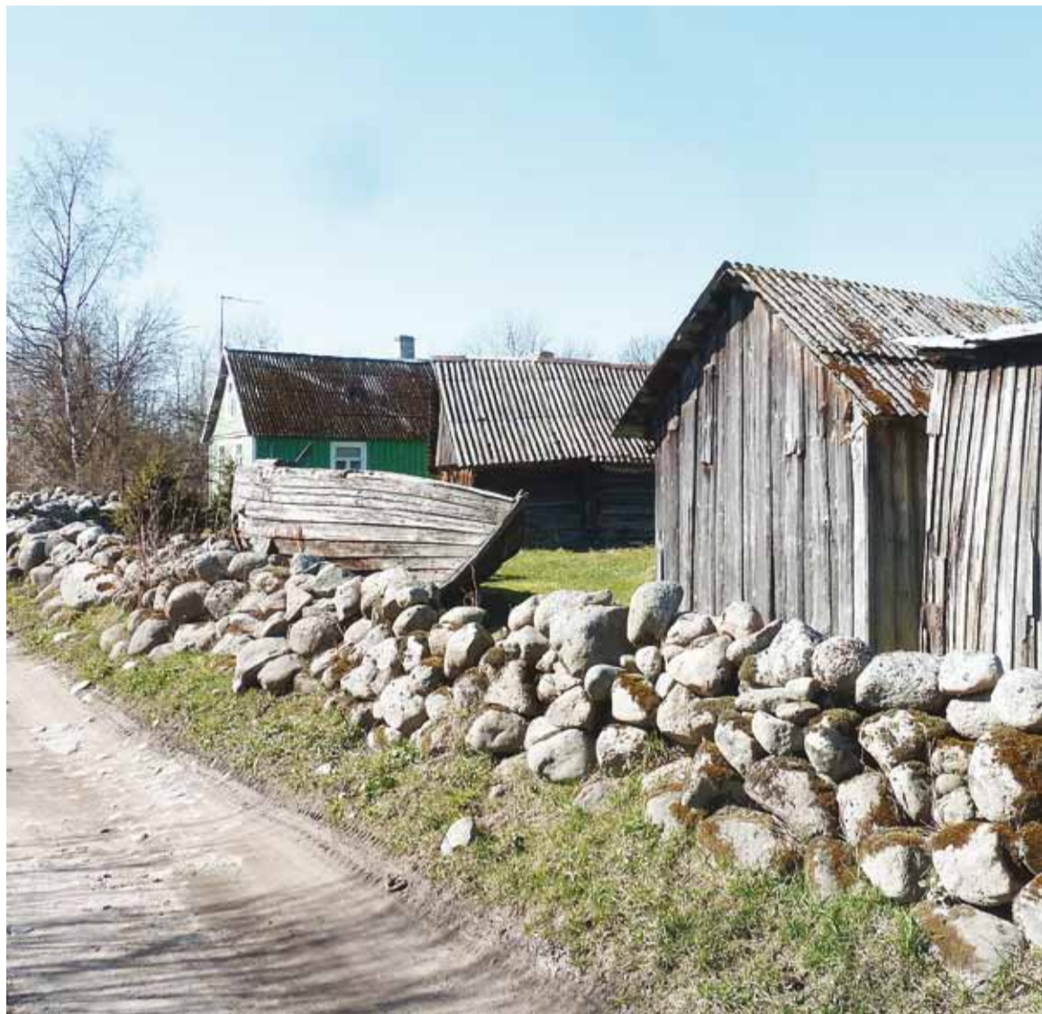
Prangli külavahetee viib Kelnaselt Lääneotsa ja Idaotsa. Kõrvuti seisavad uus ja vana.