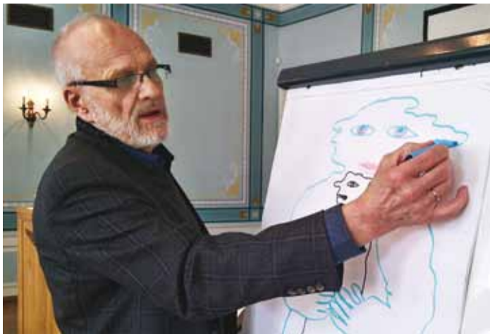
Kunstnik näitab, kuidas valmib figuur.

Õpetaja tegi lastele ülesandeks joonistada Jüri Arraku stiilis pilt. Kui lapsed on joonistama hakanud, siis tunnistab kunstnik, et lastele ei ole lihtne rääkida: "Ma ei tea nii täpselt ja ei mäleta enam nende huviseid. Tean omast käest, et kui inimene räägib ja minust läheb see jutt mööda, siis on il-