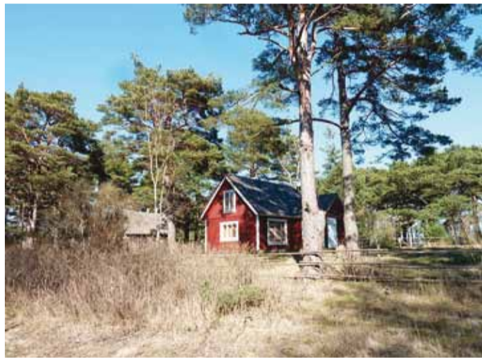
Meri ja männid, saare võlu.