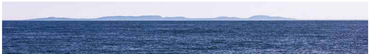
Suursaare vaade merelt 2014.

*Rohevahetus on aia- ja taimehuviliste kokkusaamine, mille käigus vahetatakse või antakse ära oma aia või kodu ilu- ja tarbetaimi, pistikuid, seemneid, sibulaid või juurikaid. Taimekasvatuse tarkusetarad kuuluvad loomulikult sinna juurde! Rohevahetus on TASUTA – kaasavõetud taimi võib vahetada või ära anda, müümine ei ole kombeks!