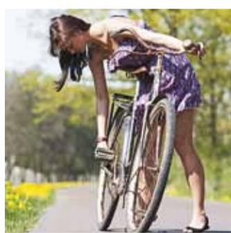
Enne jalgrattasõidu alustamist veenduge, et ratas on korras ja töötavad nii pidurid kui signaalkell.

Et kõik liiklejad tervelt koju jõuaksid, on nii sõidukijuhude kui ka ratturite poolt oluline eelkõige teineteist õigel ajal märgata ja üksteisega liikluses arvestada. Lastele tasub kodus põhilised liiklusreeglid üle korrata. Samuti tuleks lapsevanemate abiga talvel kasutamata