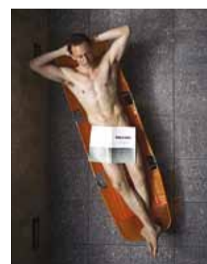
Mis juhtub neuroloogiga ultramoodsas kõrghoones?

Kevin Costner, keda üle mitme aasta sai just äsja kohalikel kinolinadel näha filmis “Batman vs Superman”, on seekord tsipa suurema rolli endale hankinud ja seda filmis “Kriminaal”. Mängib ta seal filmi nimetegelas, sellist üdini paha mõrtsukat, kelle pähe istutatakse tapetud FBI agendi mälu. Miks ei võiks doonoriks olla mõni kombekam kodanik? Eks põhjus ole ikka vast selles, et kingsepa või raamatupidaja puhul peotäie kontsapplekkide või arvelauaga terroristide plaane ei nurja. FBI agendi mälu ja kalgistunud mõrtsuka relvakäsitsemise kombinatsioon tundub olevat selleks märksa parem kooslus. Teistes osades Gary Oldman, Tommy Lee Jones, Ryan Reynolds ja imenaine Gal Gadot.