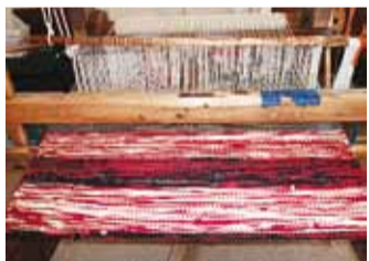
Talvel koovad naised rahvamajas vaipu.

Annika initsiatiivil korda tehtud 2 aastat tagasi.