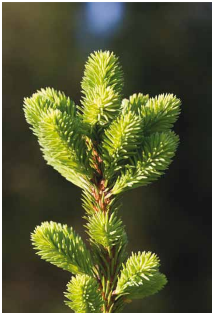
Kuusk on kaunis ja kasulik puu, mille vaiku kasutatakse isegi kosmeetikatoodetes.