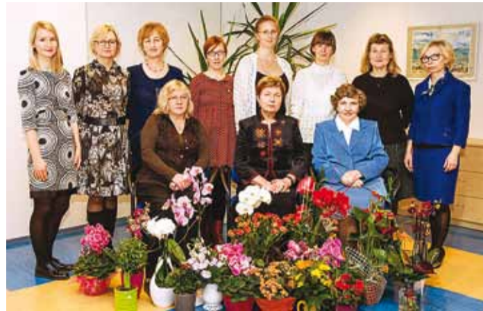
Viimsi raamatukogu töötajad eelmisel aastal raamatukogu 95. sünnipäeval.