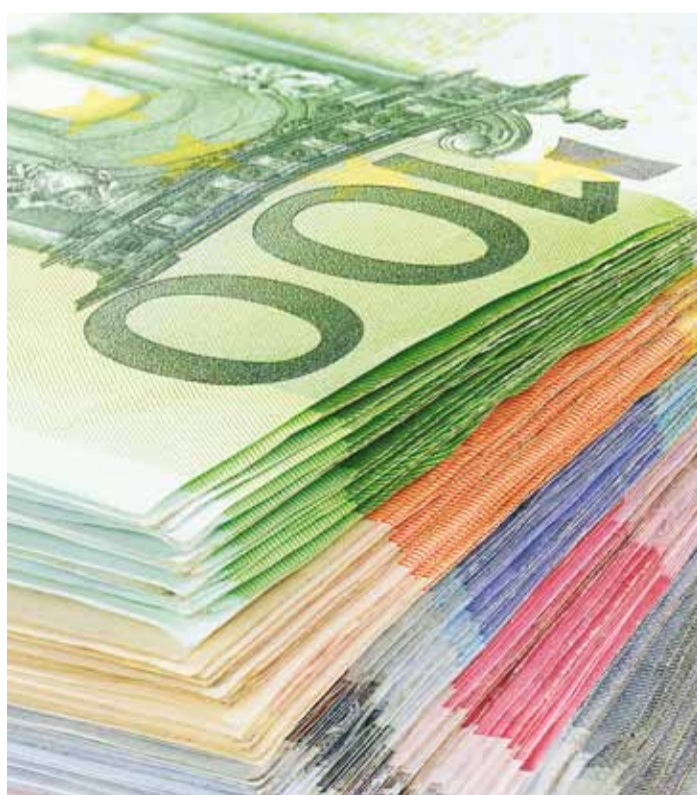
Viimsi valla 2016. aasta planeeritav eelarve on enam kui 30 miljonit eurot.

Põhilise tulu ehk umbes 2/3 kõigist tuludest (ligi 19 miljonit eurot) loodab vald saada füüsilise isiku tulumaksu laekumisest. Tulumaksu laekumise prognoos ületab 2015. aasta tegeliku laekumise (18 300 eurot) ca 4%. 2014. aasta tulemusega võrreldes kasvas tulumaksu laekumine möödunud aastal 7% ehk prognoos 2016. aastaks on Viimsi valla jaoks realistlik. Valla eelarvesse, suurusjärgus 1,2 miljonit eurot, laekuvad mitmed tulud ka valla enda majandustegevusest (teenuse osutamine, huviharidustasud, lasteaia kohatasud, tasud teistelt omavalitsustelt valla koolides käivate laste eest, üürid, rendid, trahvid, vee-erikasutustasud jne). Maamaksu laekumist on prognoositud 2,5 miljonit eurot, reklaami- jm väiksemaid makse on tuluna