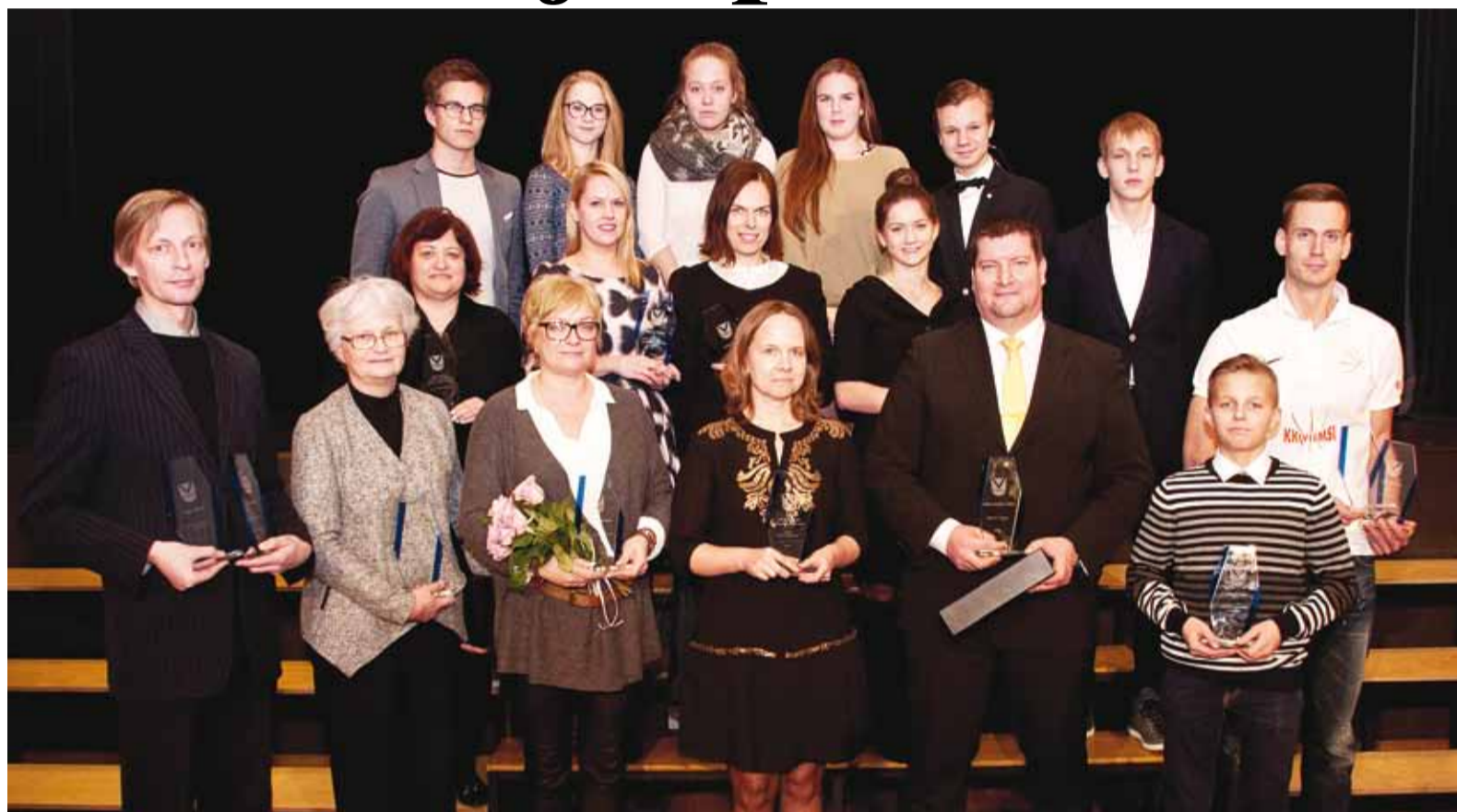
Valla aastapreemiate saajad spordi ja kultuuri valdkonnas 2015. aastal.

21. jaanuaril toimus Viimsi Koolis kokkuvõttev tänu-sündmus tunnustamaks möödunud aasta parimaid sportlasi ja valla ajaloos esmakordselt ka kultuuri-tegelasi.