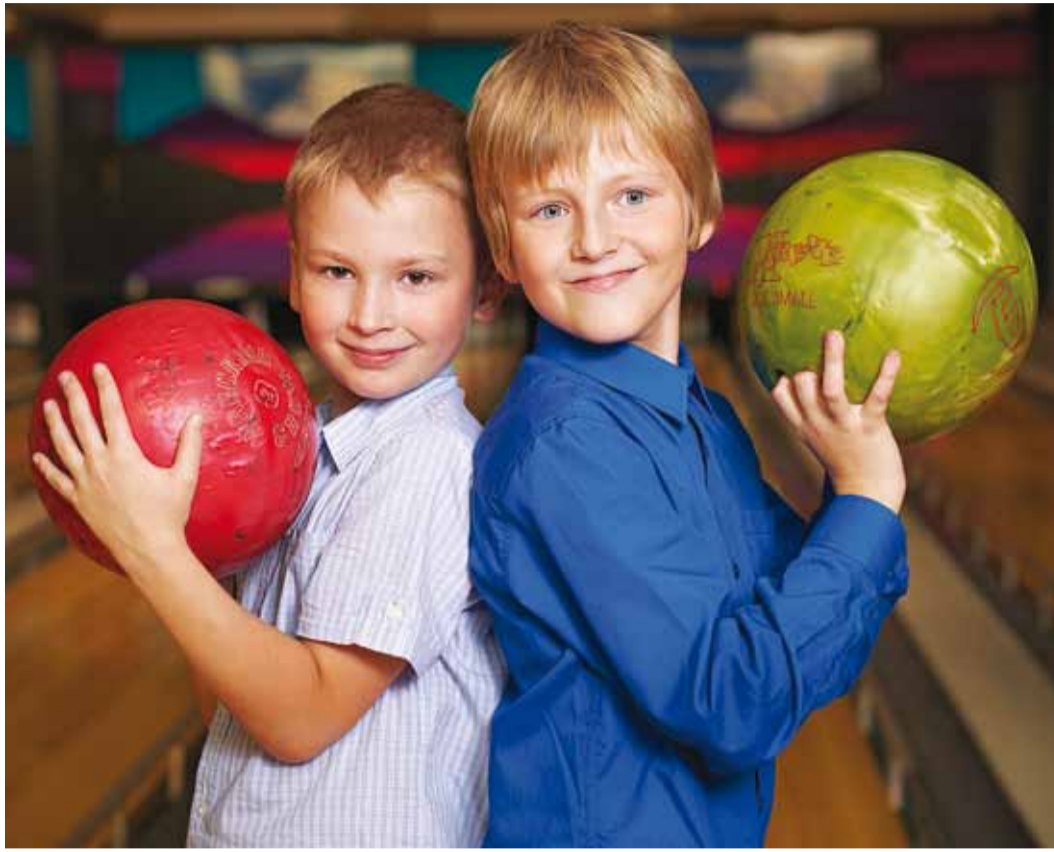
Bowling köidab ka pere noorimaid liikmeid.

Bowlingu puhul on tegemist veeremänguga, kus tuleb sobiva raskusega palliga (8–15 lbs) peale 4-sammulist hoovõttu püüda võimalikult hästi tabada kolmnurkselt asetsevaid kurikaid. Mida enam 10 kurikast ümber läheb, seda rohkem punkte mängija teenib. Ühes bowlingumängus on kokku 10 seeriat ja üht kurikakomplekti on võimalik pikali veeretada kahel korral. Alustamiseks ei peagi väga palju rohkem teadma – iga viskega tuleb juurde kogemusi ja oskusi, mis tehnikat lihvida aitavad. Bowling on sobiv nii perega lõbusalt aja veetmiseks kui ka tõeliselt pingeliste võistluste pidamiseks –