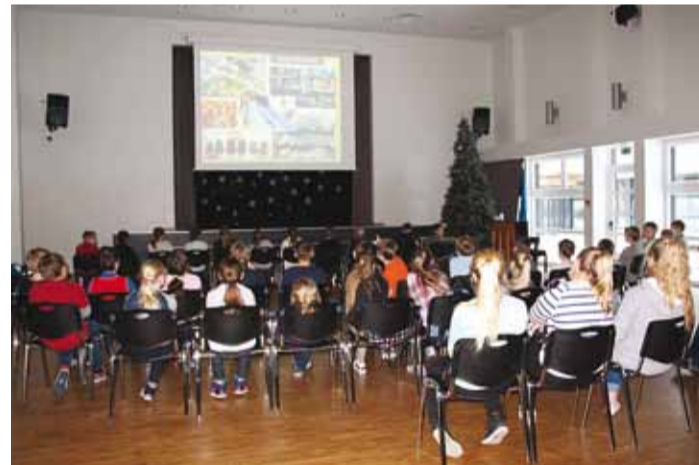
Igaüks saab mõelda, mida keskkonna säästmiseks teha.

Prügi VaheTund on välja kasvanud kodanikualgatusel Tee-me ära ning seda finantseerivad juba neljandat õppeaastat Keskkonnainvesteeringute Keskus ning Tootjavastutusorganisatsioon OÜ.