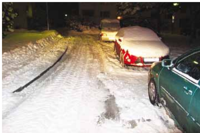
Näide Haabneemest: sõidukid on pargitud selliselt, et takistavad hooldussõidukil möödasõitu – kõrge äärekivi ja küljepeegli vahelt sahk läbi ei mahu. Lisaks asuvad sõidukid keelualas. Sahk ei saa teid hooldada, sahujuht on lähenenud loominguks ning lükanud puhtaks osaliselt haljasala. Fotod Teede REV-2

Liiklusseaduse § 21 lõige 2 punkt 5 sätestab, et sõidukit ei tohi peatada kohas, kus peatatav sõiduk teeb võimatuks teisete sõidukite liikumise; § 21 lõige 4 punkt 1 sätestab parkimiskeelule kohale, kus ei tohi sõidukit peatada. Teed hooldav mehhanism on samuti sõiduk ja kui takistatakse hooldussõidukit, siis rikutakse liiklusseaduse § 21 nõudeid. Karistus sellise teo eest on kuni 50 trahviühikut.