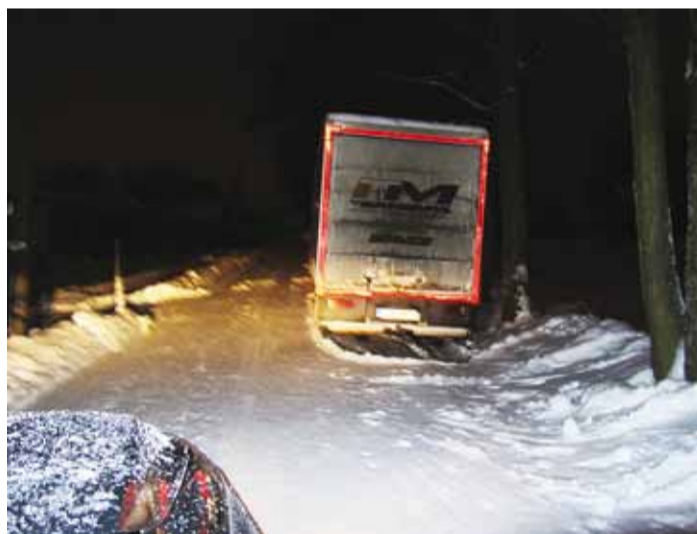
Veokid ja kastid tuleks parkida kohtadesse, kus on parklad või tee laiendused. Siin ei saanud laia sahaga veokist mööda, tuli kitsa sahaga minna. Kogu logistika ja helistamine nõuab aga lisaega.

te sõidukite liikumise; § 21 lõige 4 punkt 1 sätestab parkimiskeelule kohale, kus ei tohi sõidukit peatada. Teed hooldav mehhanism on samuti sõiduk