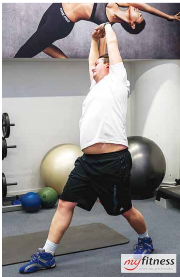
Pärast trenni tuleb kindlasti ennast venitada.

Pärast sellise intensiivsusega trenni on tark end venitada. Kaspar õpetas mulle neli venitusharjutust (vt ka blogi). Kuuldavasti käib mehi rühmatreenides vähe, aga ei ole see midagi "plikade võimlemine"