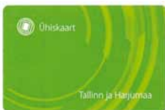
Ühiskaart tuleb sõidukis registreerida.

tatakse Ühiskaarti ning muid e-pileti süsteemiga ühilduvaid kontaktivabu andmekandjaid. Viimsi vallas saab Ühiskaardiga sõita siseliinidel V1-V7, maakonnaliinil 114 ja Tallinna linnaliinidel 1A ja 38. Maakonnaliin 114 ja siseliinid kuuluvad