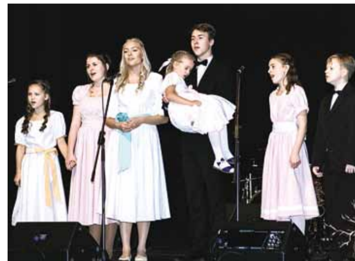
Viimsi Kooliteatri ja Viimsi Muusikakooli muusikal "Helisev Muusika".