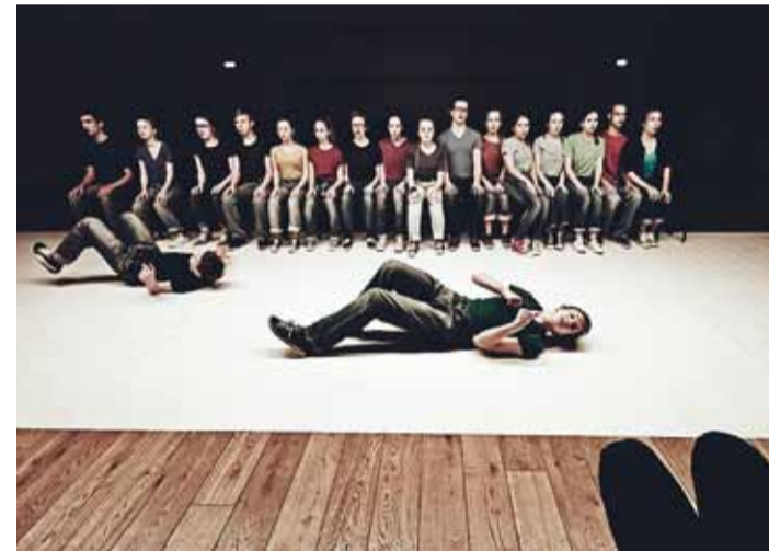
Viimsi Kooli õpilasteater Eksperiment.