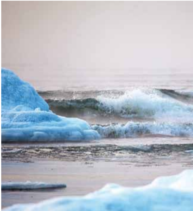
Kõiges vigu otsides jääb tähelepanuta, et ühe väikse vea kõrval on palju head ja õiget.

See on küsimus, mida inimene ju aeg-ajalt ikka esitab, kui ta ei mõista teise käitumist või kui miski on valus ja vastukarva. Aga samas, kui küsida seda enda käest, siis paneb see hoopis mõtlema sellele, millises olukorras mina hetkel olen, missuguses maailmas ma elan, mida ma tunnen ja kogen, millisena mina elu näen. Ja sageli võib sellele küsimusele tegelikult vastata, et viga pole midagi, kuigi tahaks nii kangesti kurta!