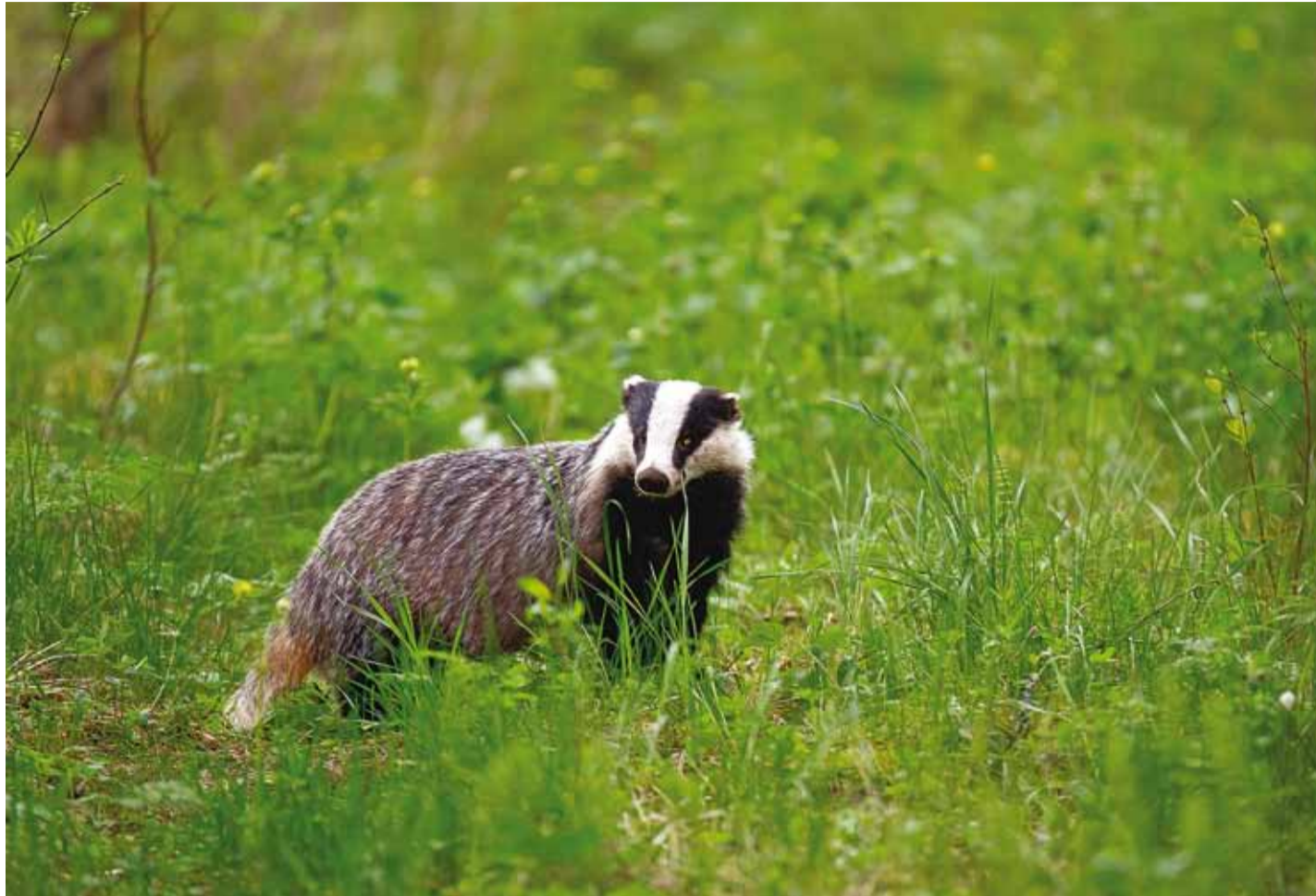
Mägrast pole just palju teada, sellepärast uuritakse teda tänava rohkem kui tavaliselt.

Muide, ka lätlaste aasta loom on mäger ja koos plaanitakse ühist fotokonkurssi lõunanaab-