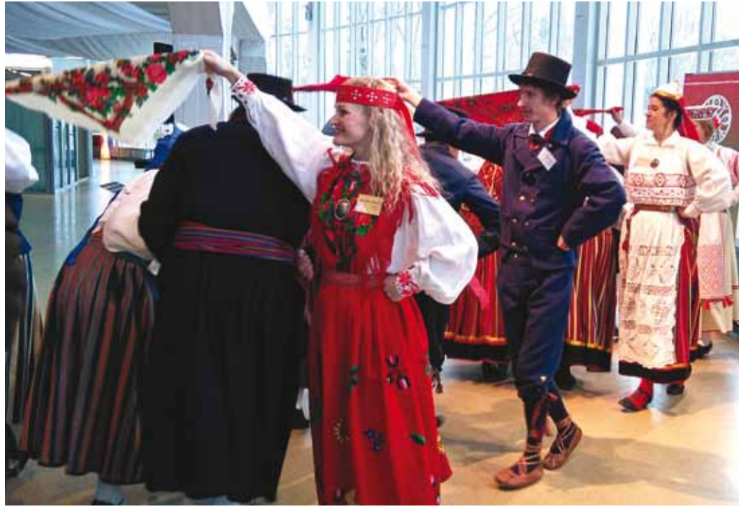
Tantsivad tantsupeo liigijuhid.

Laste-koori repertuaar on sündinud nelja dirigendi pakatavast sünergiast ning mulle tun-