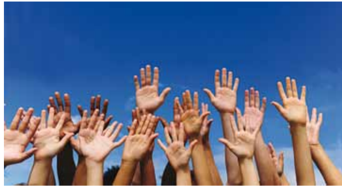
Kelle poolt hääletavad noored?