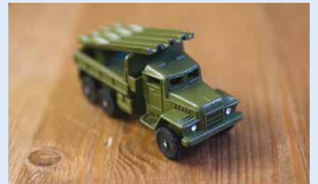
N Liidu aegne militaarmänguasi.

Sõjamuuseum vajab külma sõja uue ekspositsiooni jaoks Nõukogude Liidus toodetud sõjateemalisi mänguasju, et kajastada tolleaegse argielu militariseeritust.