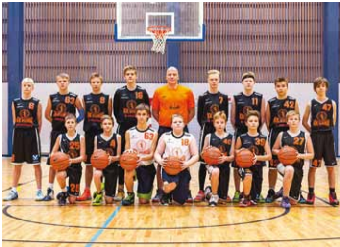
MTÜ Korvpalliklubi Viimsi U16 võistkond.