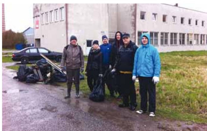
MTÜ Roheline Poolsaar lõi kaasa Teeme ära talgutel koduümbrust koristades Püüsi-Pringi tootmisalal.

Loomulikult häirivad vallalannike iseeneslikult tekkinud