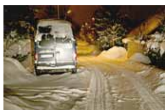
Et kaubikust mööda põigata, tuli puhastada osaliselt haljasala. Hea, et kinnistuomanik polnud sinna kive paigaldanud, muidu oleks sahk puruks läinud nagu seda juba ette on tulnud.