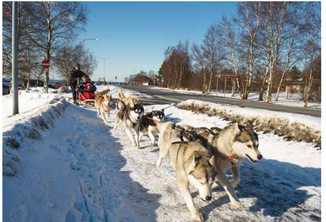
Koerarakendiga sõidust saab kordumatu elamuse.

Tänapäevaseks tõuks sai siberi husky aga hoopis Ameerika Ühendriikides, täpsemalt Alaskal, kuhu need toredad koerad eelmise sajandi alguses kullapalavikku haigestunud kaup-