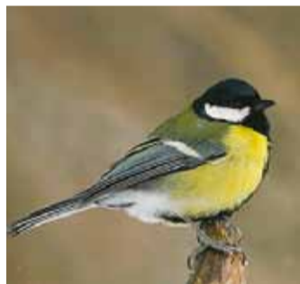
Rasvatihane ehk rasvajaak on sel aastal tegija.

ritega. Säärane suur tähelepanu mägrale võimaldab väheuuritud looma tegemisi ühises infoväljas naabritega jagada.