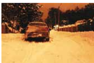
See sõiduk on lihtsalt teele pargitud, sahujuht pidi ka siin puhastama muru ja haljasala (teadmata, kas seal on kive või põõsaid), et edasi minna oma marsruuti pidi. Selliselt pargitud sõiduk takistab hooldussõidukil teel liiklemist.