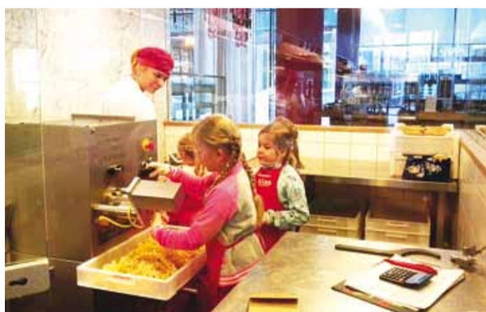
Lapsed teevad tutvustust pastamasinaga.

Pastased pakutakse selles söögikohas erinevaid, soovi korral ka täisterajahust valmistatud. Masin, mis pastat vormib, on suur, kuid töötab vaikselt – inimene peab vaid pisut kaasa aitama ja juba võib pastaport-sud kotikestesse ootele panna. Lasteaialapsed olid usinad pastatükeldajad ja nii mõnigi laps pistis tükkese suhu ning maigutas maialt, kuigi pastataigen koosneb vaid jahust ja veest. Naljatlades kutsuti lapsi tööle pastavalmistajaks: “Kell kuus hommikul tuleb alustada, kes