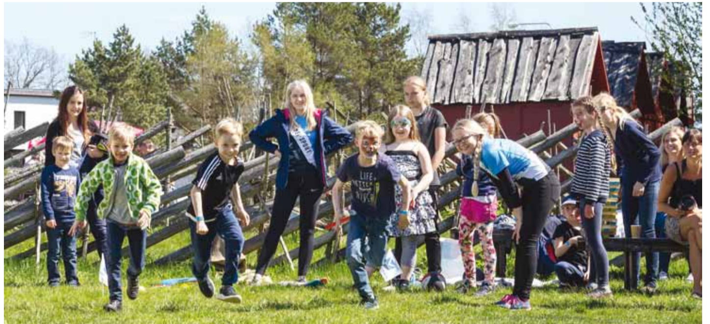
Võistluse start on antud!