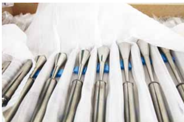
Vilesid on uues oreli 849.