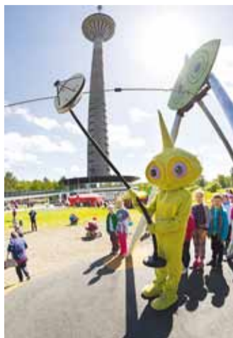
Tallinna teletorn kutsub.

va muuseum ja vabaõhumuuseum. Suve oodatuid sündmusi Viimsis on juba traditsiooniks kujunev Rannarahva festival 29.–30. juulil, mille osaks on ka kohvikutepäev. Siis sünnivad igal pool vahvad kodukohvikud, kuhu sisse astuda, heademat maitsta ning mõnusalt aega veeta. Eelmisel aastal ava-