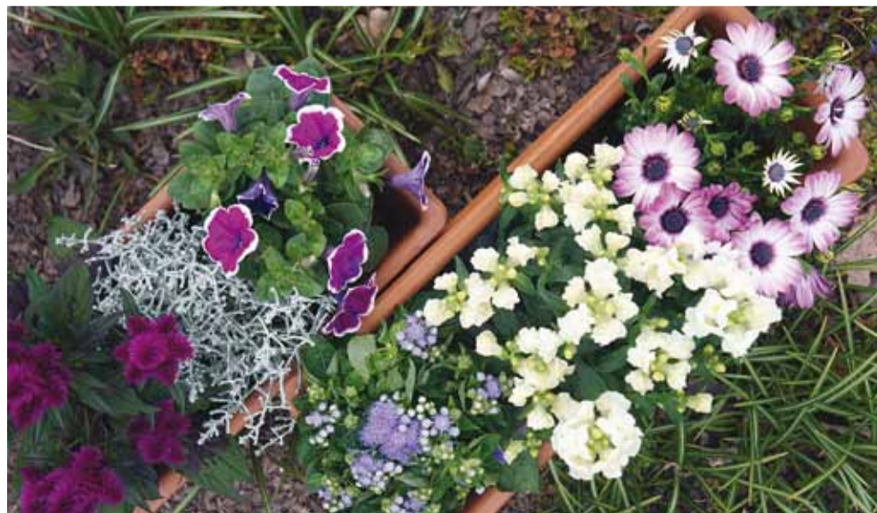
Suvelilled pakuvad silmailu nii aias peenral kui kastides terrassil või rõdul.