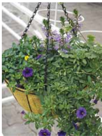
Ampelit tuleb hästi kasta.

nende lilledel puhul ei pea ka õitsenud õisi ära noppima. Istutamisel tasub samuti kasutada lillemulda lisaks turbamulda vihmaussisõnnikuga. Õiterohkuse tagamiseks tuleks regulaarselt väetada.