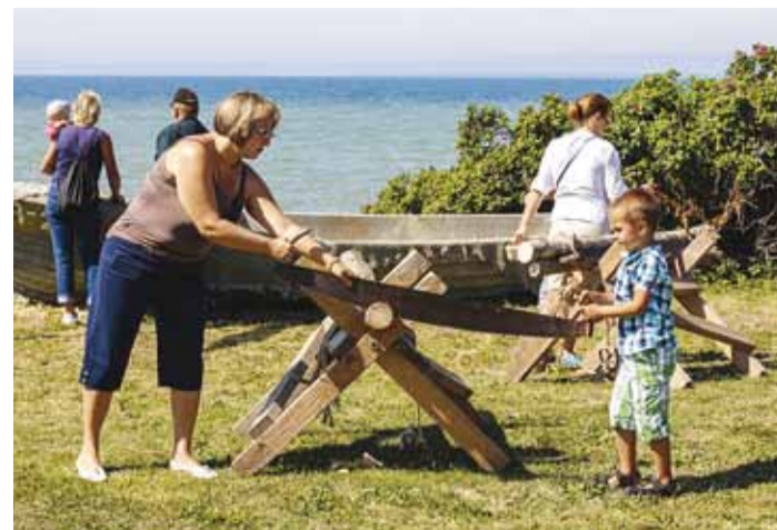
Rannarahva festival – tööd tehakse ka.

laat leiab aset 16. juulil. Tallinna teletorn ja botaanikaaed ootavad samuti suvi läbi külastajaid. Teletorni hoovis toimuvad kontserdid.