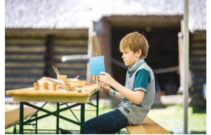
Viimsile kohaselt sai meisterdada ka laevasid.