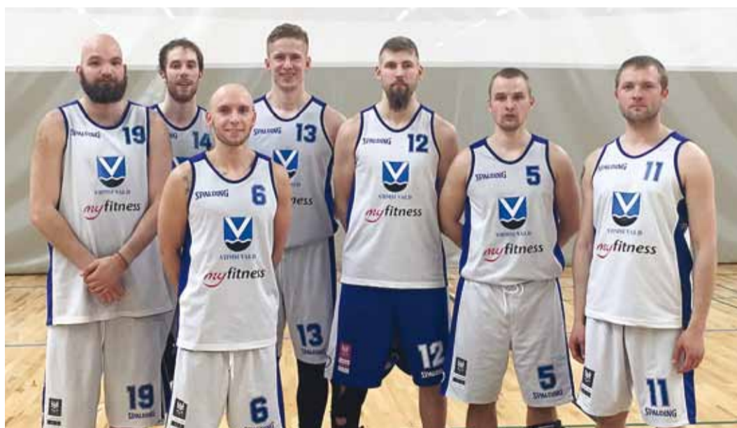
Viimsi vallavalitsuse meeskond saavutas korvpalliturniiril “Vana Tallinna kilud” II koha. Palju õnne!

Eelmisel turniiril vedasid vägikaigast Tartu linnavalitsuse ja Tallinna Linnateatri meeskond. Nüüd kohtusid sisuliselt samad võistkonnad uuesti ning seekord võitis magusa revanši linnateatri meeskonnal põhinev Tallinna Teatrite koondis, kes pidasid Tartuga maha lausa kaks väga tasavägist mängu. Esmalt võitis Tallinna Teatrite koon-