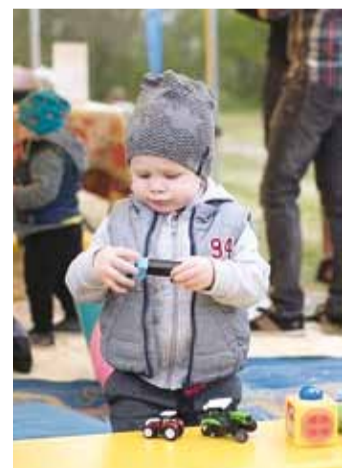
Pere pisematel oli võimalus mängida mängunurgas.

namäe küla ja Lubja küla ühisettevõtmistest ning on järg ühise jaanipeo traditsioonile ja hea algatus viimsilaste koostöö tugevdamiseks. Möödunud aastal laienes sõpruskond Iru küla rahva kaasamisega. Korraldajad usuvad, et koostöö ja kaasamine on võtmesõnad tu-