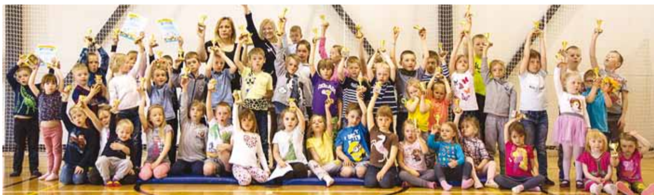
Täname kõiki kolmiksarja üritustel osalenud lapsi!