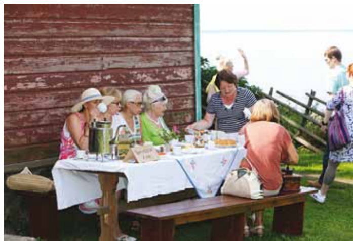
Kohvikutepäev.

Viimsi saab kõrvale panna Nargenfestivali Naissaarel, kus juulis toimuvad "Aadama õunad" etendused Omari küünis. Prangli saare sadamakuuris toimub suveteater – seekord Jaan Tätte "Latern". Prangli saar tähistab tänavu 620 aasta möö-