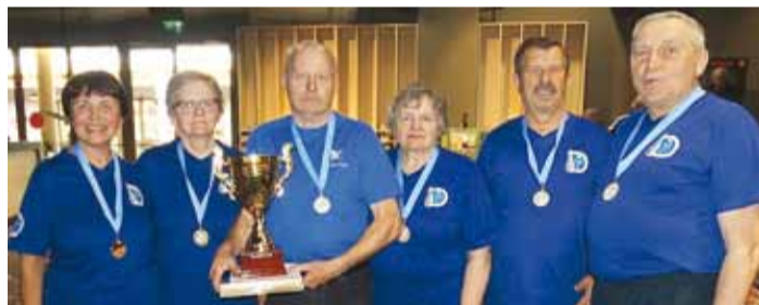
Viimsi bowlingklubi võistlusel "Pirita Kevad 2017".

Selle aasta ilmataadi pakutud kevad sündis Viimsi Pensionäride Ühenduse bowlingklubi liikmed hooaja lõpulõu-naks Jussi õlletuppa, kus oli valida kas õue terrass või soe siseruum.