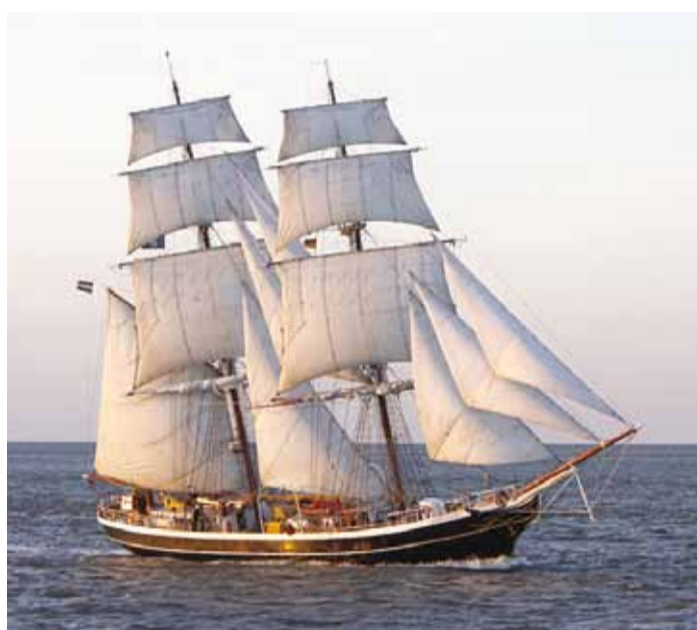
The Tall Ships Races toob Tallinna ka 1919. aastal ehitatud Hollandi purjelaev Morgenster.