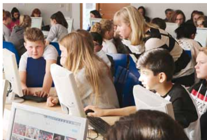
Äppide valmistamise töötuba Viimsi Koolis.

Kohtumise eeltööna olid iga riigi õpilased otsinud äppe, mida nad soovisid eakaaslastele teistes riikides tutvustada, valmistanud ette äpi tutvustuse ning ka õppeülesande. Äppide tutvustamine toimus paralleelselt kahes klassiruumis ning mõlemas ruumis valisid osalejad ka kõige parema tutvustuse. Võidu väärilisteks hääletati Portugalist õpilaste Mysimpleshow ja Türgi õpilaste Mindmeister äppide tutvustused. Eesti õpi-