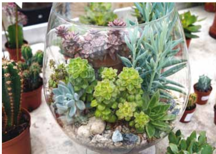
Kaktused ja sukulendid anumast – tubane ilu.

Ampliche kasutatud taimed: tiiviklill, puispetuunia, sanvitaalia, maajalg. Kui ampel asub päikeselises kohas, tuleks kindlasti iga päev korralikult kasta, varjulises kohas harvem. Selles valikus on väga vastupidavad taimed, õitsevad terve suve ning