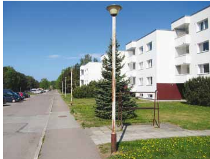
Haabneemes Mereranna teel asuvad 1970ndatel rajatud tänavavalgustusmastid on oma elu ära elanud, 2018. aastal peaks siin teel avanema uus pilt, samuti paraneb pimedas nähtavus.

II etapp on projekteerimine, ehitusliku põhiprojekti koostamine koos geaalusega. Antud etapi raames mõeldistatakse üles terve Haabneeme alevik, mis tähendab, et käesoleval aastal on oodata mõõdistajaid Haabneeme alevikus igale