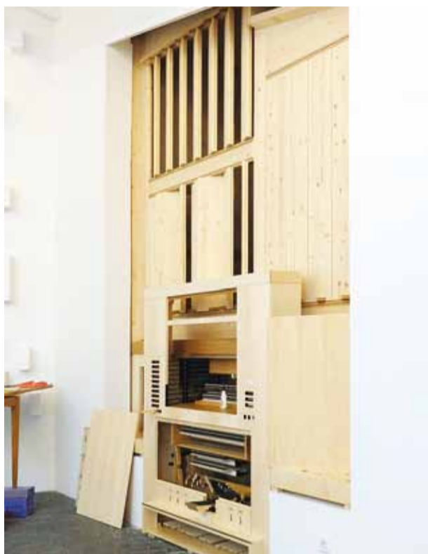
Iga päevaga muutub orel täiuslikumaks. Hetk 26. mai õhtust.

23. mai varahommik oli eriline nii Viimsi kui ka kogu Eesti orelimuusika austajatele, sest EELK Viimsi Püha Jaakobi kirikusse jõudis uus orel. 15 registri, kahe manuaali ja pedaaliga orel ehitati valmis Mühleiseni firmas, mis asub Leonbergis Saksamaal.