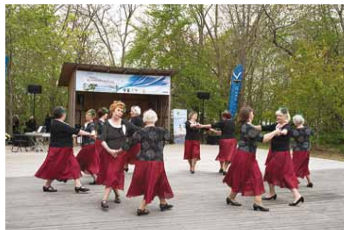
Seeniortantsurühm Pihlakobar Jõelähtme vallast.