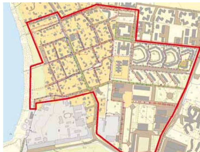
Tähistatud alal on kavas tänavavalgustuse renoveerimine ning LED-valgustite paigaldamine. Kaart Xgis ja Alar Mik

kinnistule ja igasse hoovi. Peale geaalust asutakse lahendust projekteerima. Projekteerimine on kavas lõpetada novembris 2017.