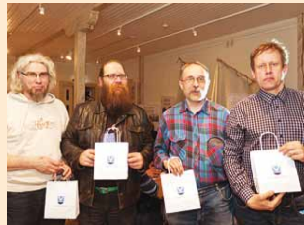
Palju õnne võitjatele!

17. mail toimus Rannarahva muuseumis Viimsi mälumängusarja kolmas voor.