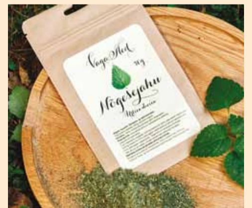
Vaga Aed toodab nõgesepulbrit.

Vaga Aed nõgesepulber on juba kasutusel Muhu Pagar OÜ-s, kellega kahasse on turule toodud nõgeseleib. Mitmed pealinna söögikohad kasutavad nõgesepulbrit oma roogades. Müügilepingud on sõlmitud Stockmanniga, Selveriga, Kaubamaja Toiduosakonnaga, NOP-iga Kadriorus ja Koloniaalkauplusega Kalamajas, Pärnu ja Tartu taluturuga ning Paide Farmshop OÜ-ga. Esimesed väliskliendid on ka juba tulnud läbi internetimüügi.