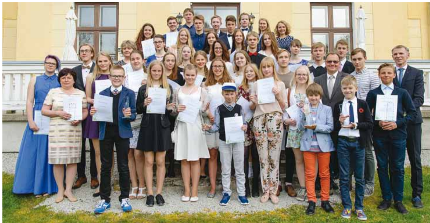
Palju õnne kõikidele tunnustuse saanutele!

Neljapäeval, 25. mail toimus Viimsi mõisas Viimsi Kooli direktori pidulik vastuvõtt aasta tegija 2017 laureatidele, aasta juhendajatele, aasta tegu ja aasta sõber 2017 auhinnetuse saajatele.