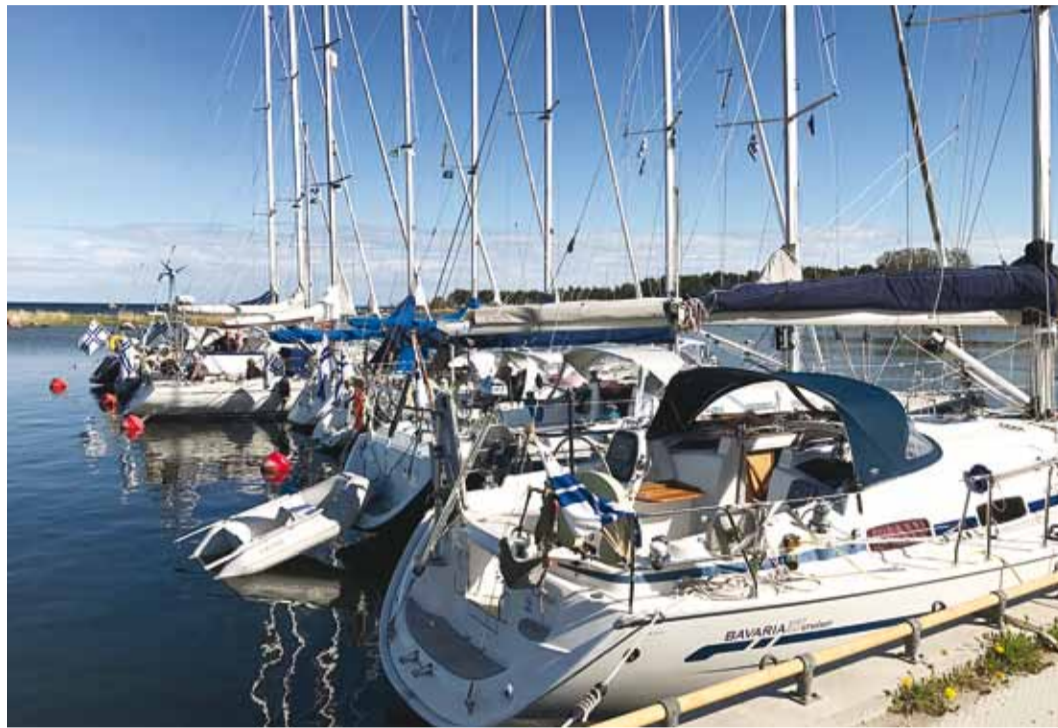
Kelnase sadamat külastanud eskaader koosnes 10 alusest.

Projekti arenduste tulemusena tõuseb 12 väikesadama tee-