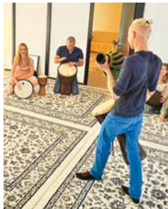
Elujõusaalis toimuvad ka trummiringid.

Elujõusaalis on võimalik tegeleda Kundalini jooga ja tulevikuks ka teiste joogastiilidega, õppida maailma tantse ja pille, kogeda võimsaid helimeditatsioonide gongide, kristallkausside, hääle ja kõikvõimalike väekate pillide toel, osaleda meeste ja/või naiste väe- ja vestlusringides, vabastava ja ekstaatilise tantsu õhtutel, mantraõhtutel, kontsertidel ja kõikvõimalikel muudel üritustel, mis hinge, keha ja südant rõõmustavad! Suvel valmib ka teraapiatuba, kus on võimalik üks ühele seansse läbi viia ja kogeda. See saal ongi koht, kuhu on kõik oodatud ka ise looma just selliseid üritusi ja koosolemisi, mis parajasti kutsuvad.