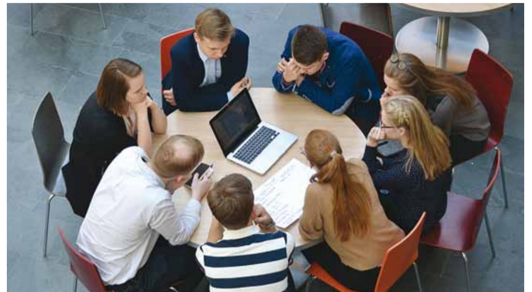
Innukate ideede otsijad laua ääres.

"Tesla Gigafactory Viimsisse" andis osalejatele sobiva platvormi unistada, missuguse näeksid nemad ideaalset Viimsit. Suurt tööstust meie koduvalda ei soovita ning pigem jäi kõlama arvamus, et on oluline hoida loodust ja Viimsi iseloomu. Tööstuse asemel nägid osalejad Viimsis pigem tarkade töökohtade loomist ja praeguste võimaluste laiendamist. Soovitakse rohkem võimalusi kultuurilisteks tegevusteks ning