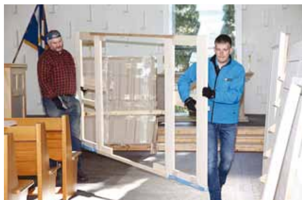
Koguduse vabatahtlikud tulid appi tassima.