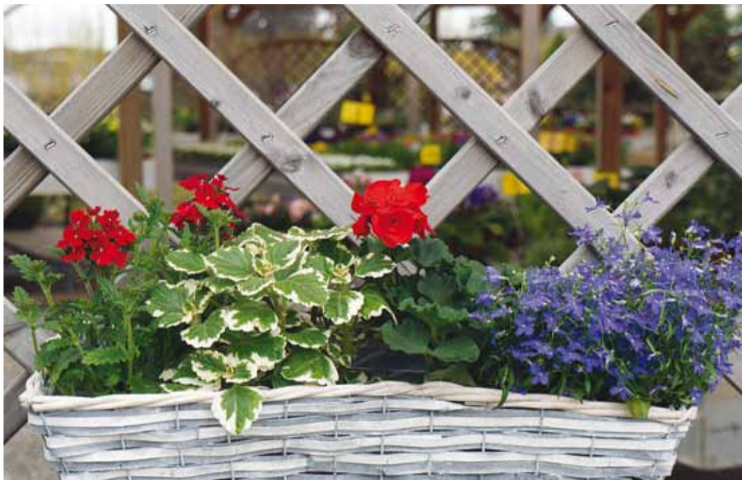
Raudürt, ilunõges, pelargoon ja lobeelia moodustavad rõdukasti kauni terviku.