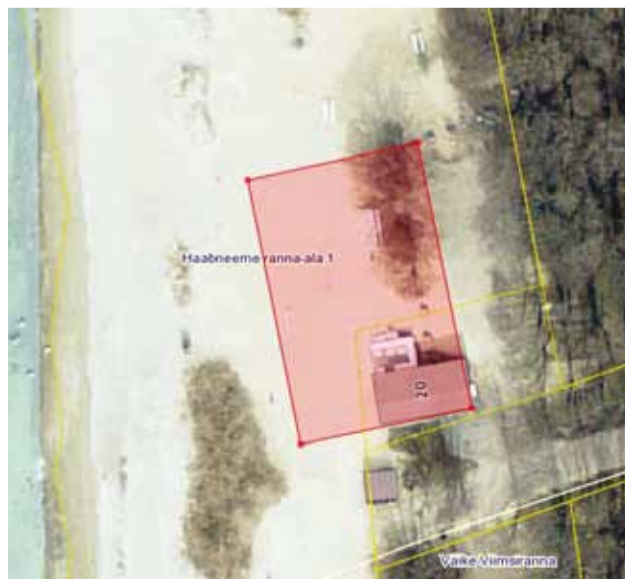
Rannakohviku asukohajoonis.