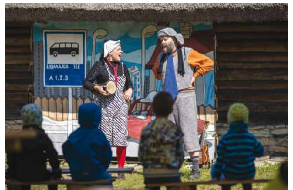
Lasteteater Trumm kaasas ka publikut etenduse protsessi.