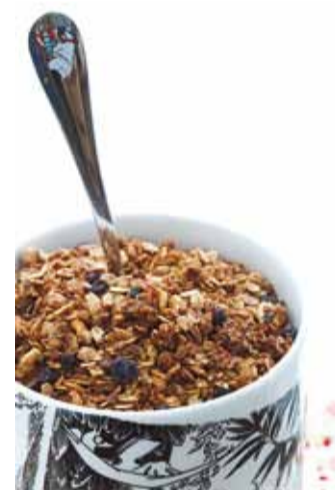
Tervisliku müsli saad teha ka ise.

Pühade ajal saab kõhu täis ka mahetoidu austaja ning seda maitsva ning tervisliku kodumaise toidukraamiga! Tervisegurmaani jõululaul lõhnavad SirLoini veri- ja tanguvorstid ja suu teevad magusaks Pagar