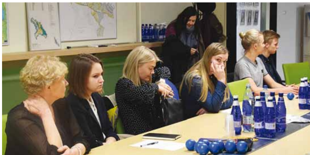
Noored kogunevad vallavalitsusse ümarlauale.

Noorsootööl on viimasel ajal riiklikult palju tähelepanu pööratud. Eesti Noorsootöö Keskuse (ENTK) ja Eesti Noorsootöötajate Kogu (ENK) eestvedamisel toimusid omavalitsustes kindla mudeli järgi noorsootöö kvaliteedi hindamised. Viimsi osales esimest korda noorsootöö kvaliteedi hindamises 2011. aastal ning uuesti sel aastal. Muutused noorsootöös on olnud suured, aktiivselt on tegevust alustanud Viimsi noortevalikogu, oluliselt on juurde tulnud noorte vaba aja tegevuste võimalusi huvihariduses ja huvitegevuses, olemas on toetusüsteem noorte projektide toetamiseks ja noorte tunnustamiseks, aktiivselt tegutsuvad õpilasfirmad, noorsootööga tegelevad oma ala professionaalid hea meeskonnana ning ka rahvusvahelisel koostööl on suur tähtsus. Eriti saab välja tuua, et Viimsis toimus esimene kesk-kooli noorte korraldatud hac-