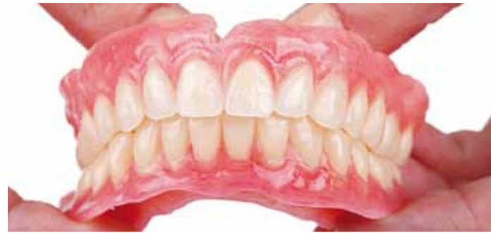
Alates 1. jaauarist 2018 saab proteeside hüvitist taotleda vaid haigekassa lepingulise partneri juures.

Alates 1. jaauarist saab hammaste proteeside hüvitist kasutada ainult nende proteesitegijate juures, kes on sõlminud haigekassaga vastava lepingu. Seoses muudatusega saab käesoleva aasta proteesiarveid haigekassale esitada kuni 31. jaauarini. Pärast seda esitatud arved enam tasumisele ei kuulu.