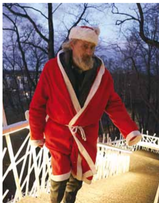
Ka jõuluvana hoiab vormi.