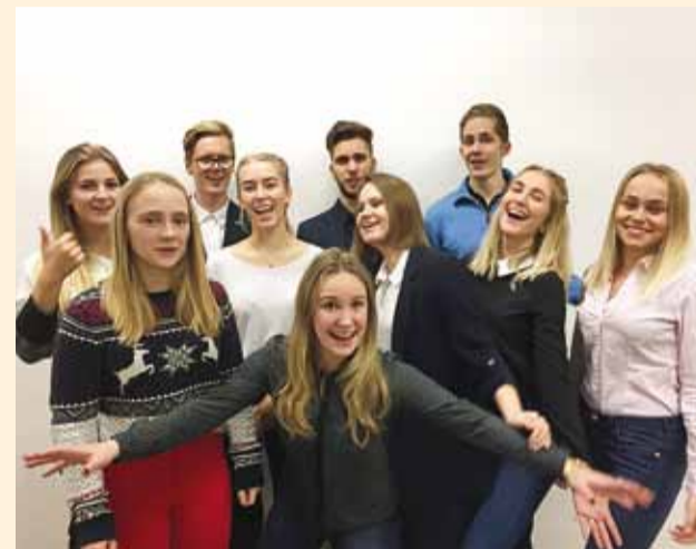
Uus noortevalikogu loodab kaasata rohkem noori, et nende hääl kuuldavamaks teha.

Viimsi noortevalikogu uus koosseis alustab tööd 11 liikmega. Töö on uhkusega üle antud eelmiselt koosseisult peaaegu täiesti uuele, kus vanast koosseisust alles vaid kaks liiget.