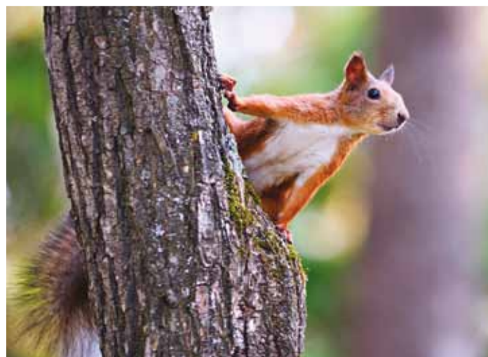
Täna istutatud taimed on tulevikus koduks erinevatele karvastele ja sulelistele.