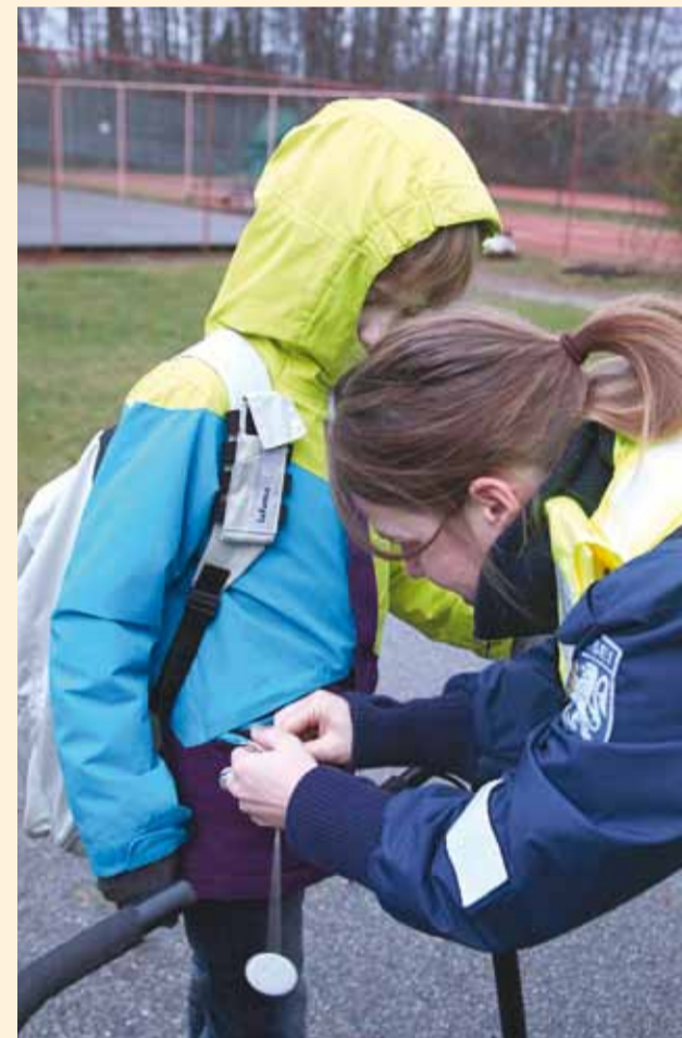
Kontrollige juba täna, kas teie lähedastel on helkur nõuetekohaselt kinnitatud!

Helkurkampaaniaga rõhutame helkuri kandmise vajadust ja olulisust olla Eestimaa pimedal sügistelvisel hooajal kaaskliiklejaile nähtav.