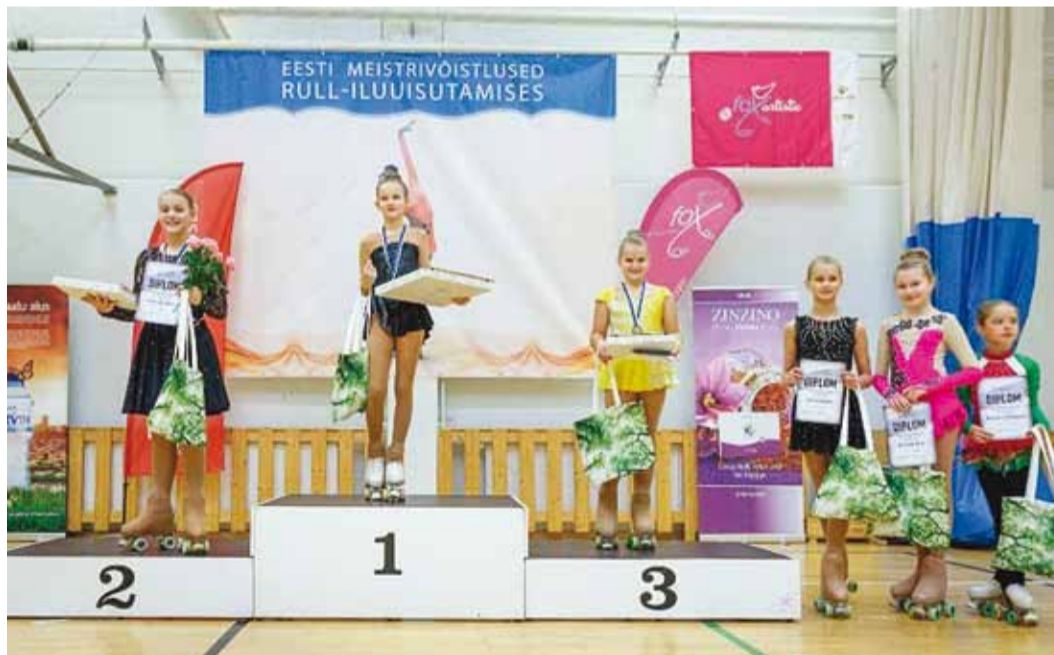
Palju õnne kõikidele võitjatele!

2013. aastal pea kümneaas- tase pausi järel korraldatud Eesti meistrivõistluste taaselustamise eesmärk on rulliluisutamise sportliku arengu ja järjepide- vuse hoidmine. See on parima- te üksiksõitjate aasta kõige täht- sam võistlus Eestis, mille ni- mel iganädalasel treenitakse.