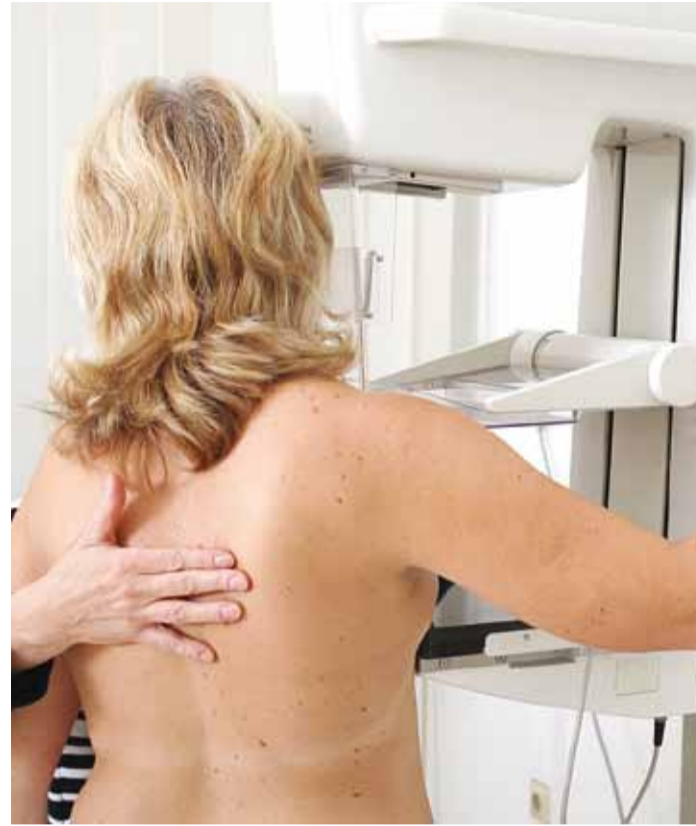
Uuringul osalemiseks ei pea kutset ootama jääma, tuleb lihtsalt helistada ja aeg kinni panna.

Rinnavähi varajase avasta- mise uuringul osalemine on va- batahtlik, kuid eelkõige naise enda tervise huvides. Sõelu-