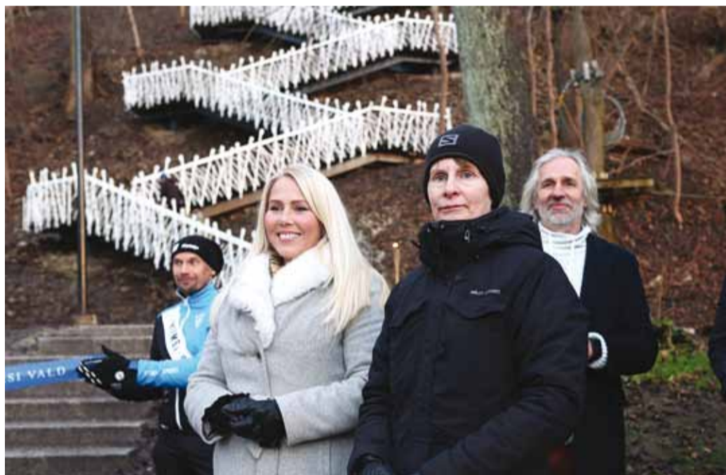
Vallavalitsuse esindajad tegijaid tänamas.