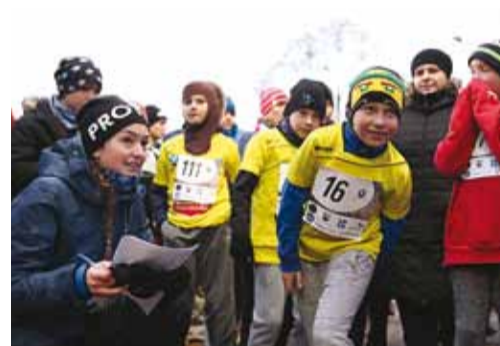
Noored sportlased stardijoonel.

Viimsis on peaaegu võimatu leida elanikku, kes poleks kursis siia rajatud Eesti kõrgeima kõrguste vahega Põhjakonna trepiga.