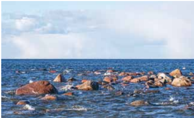
Lubame rohkem voolul end kanda rahulikesse vetesse, sest vaid siis võime end kindlalt ja hästi tunda. Foto Mikk Leedjärv

Eks meil igal ühel on oma arvamus selles osas, kes me inimestena oleme. Kuid sõltumata meie arvamusel ju tegelikult meie olemus ei muutu, isegi siis, kui me seda väga tahaksime.