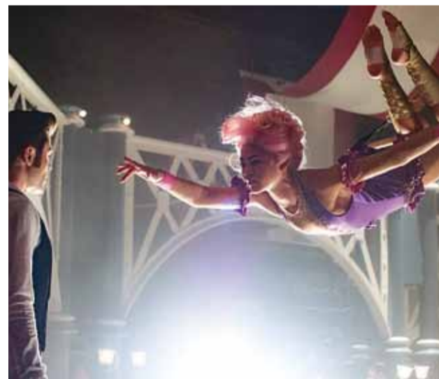
Kaader filmist "Maailma suurim šoumees".

Neile, kes jõulude aegu midagi südamlikku soovivad nautida, sobib "Väike ime". August on sündinud moonutatud näoga ning seetõttu olnud eemal ka lasteaiast ja algkoolist. Et muidu igati tavaline laps oma välimuse tõttu erakuks ei jääks, otsustavad vanemad, et 5. klass algab poisile mitte enam kodus, vaid tavakoolis. Nagu arvata võib, ei ole algus kerge, kuid ajapikku saavad ka kõige kiuslikumad aru, kui vapper ja kaunis sisu poisi harjumatu kesta all peidus on. Osades Jacob Tremblay, Julia Roberts ja Owen Wilson.