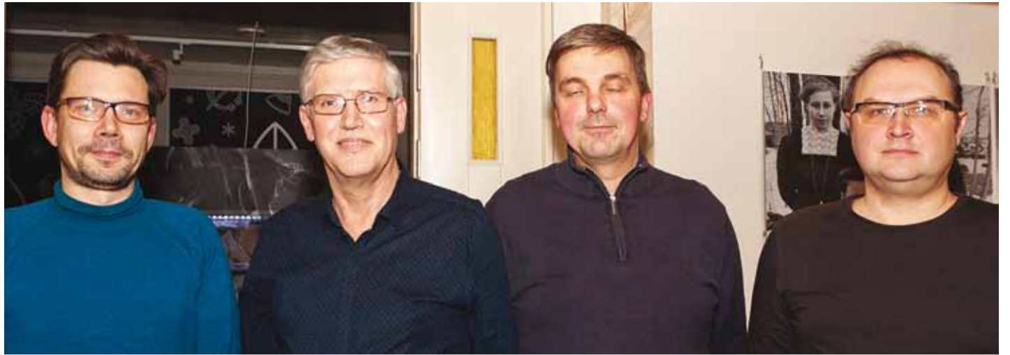
Mälumängu I voo võitis meeskond Meri.

EELK Viimsi Püha Jaakobi koguduse vaimulik