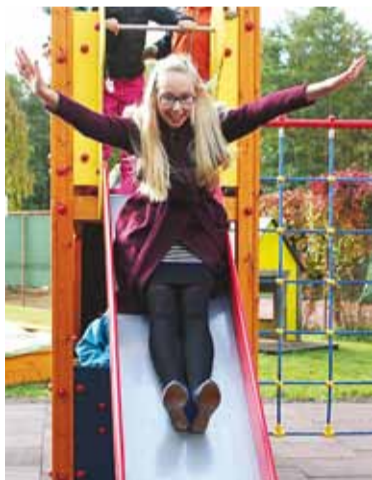
Kui noored said teada, mis tunne on olla õpetaja, siis õpetajad said end taas õpilastena tunda.

“Meie koolis on traditsiooniks saanud, et õpetajate päeva hommikul tervitavad direktor, õppeala-