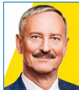
nr 253 Siim Kallas