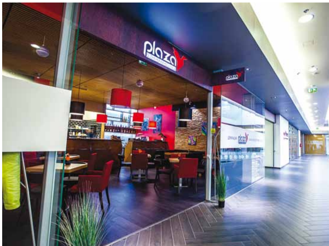
Sushi Plaza asub Viimsi Keskuses ning on avatud E-P kell 11-22.

Nigiri: peotäiesuurune vormitud riis, mille peale on ase-