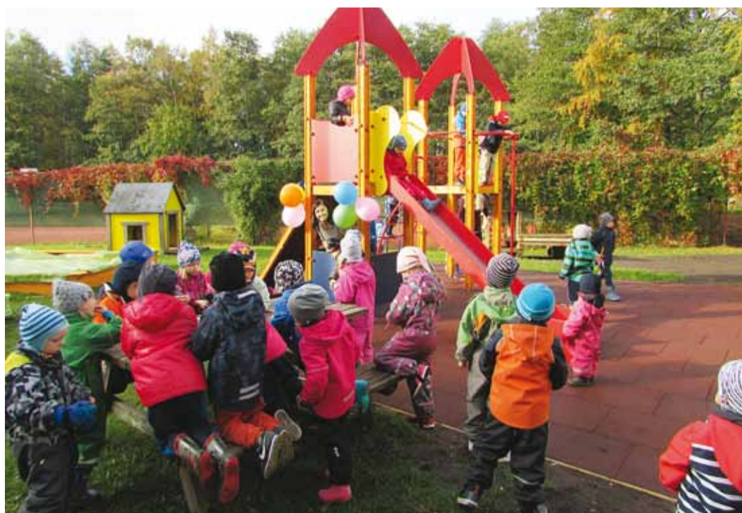
Õues mängimine on hea laste tervisele ning seejärel on nad taas rahulikud ja keskendumis- võimelisemad.

Õuesõpet saab korraldada kooli/lasteiaia õues, pargis või aias, metsas või linnakeskkon- nas, looduskaitsealal või talus jm. Lisaks metsale ja mererannale on Püüsi lasteiaiale nüüd- sest suureks abiks meie uus män- guväljak, mida oleme aastaid oodanud. Samuti on sellel män- guväljakul olemas ka kauaiga- setud katusealune. Nii on või-