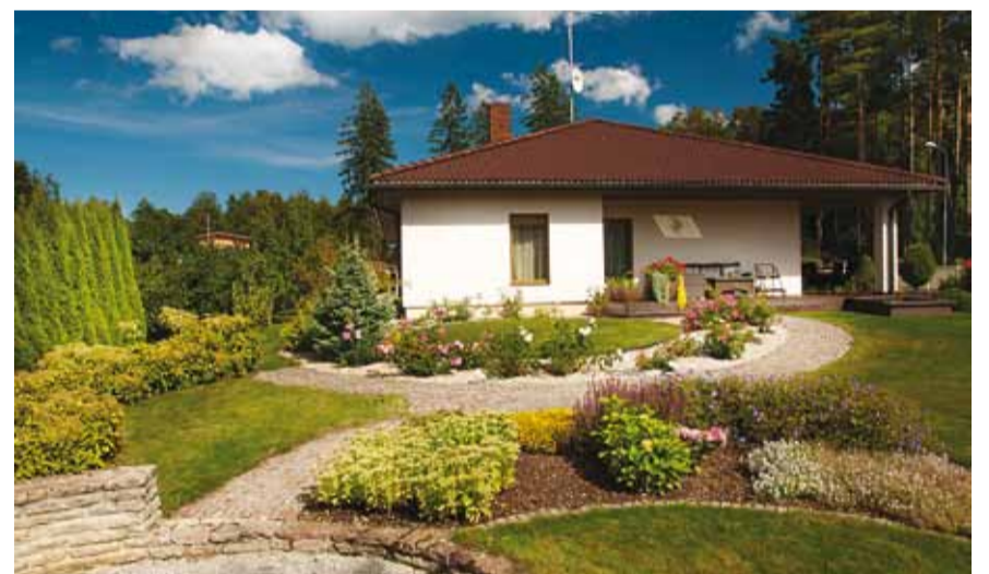
Haabneeme, Nurmela tee 3, Marju Tank.