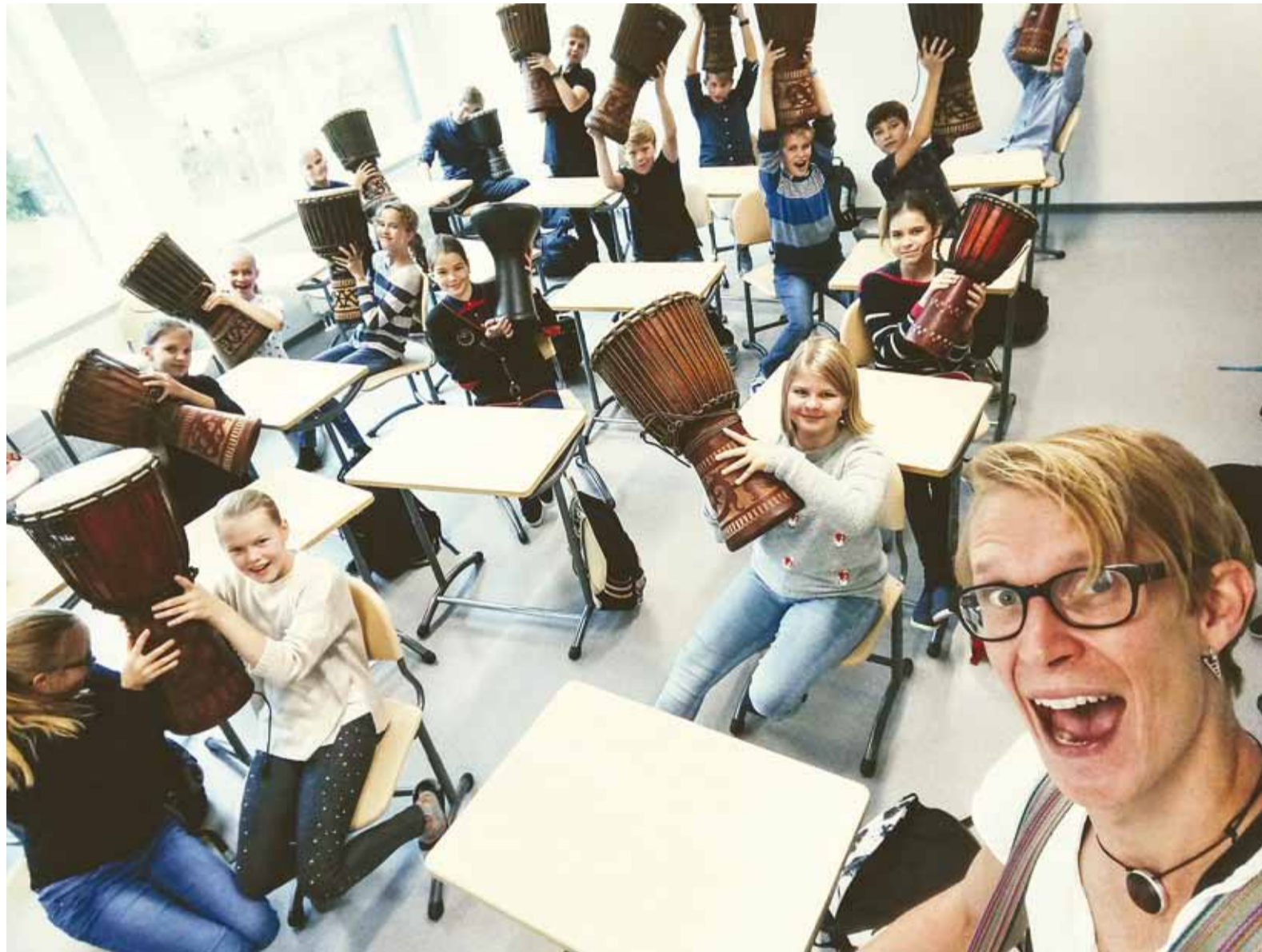
Haabneeme Koolis sai õpetajate päeval trummimängu õppida.