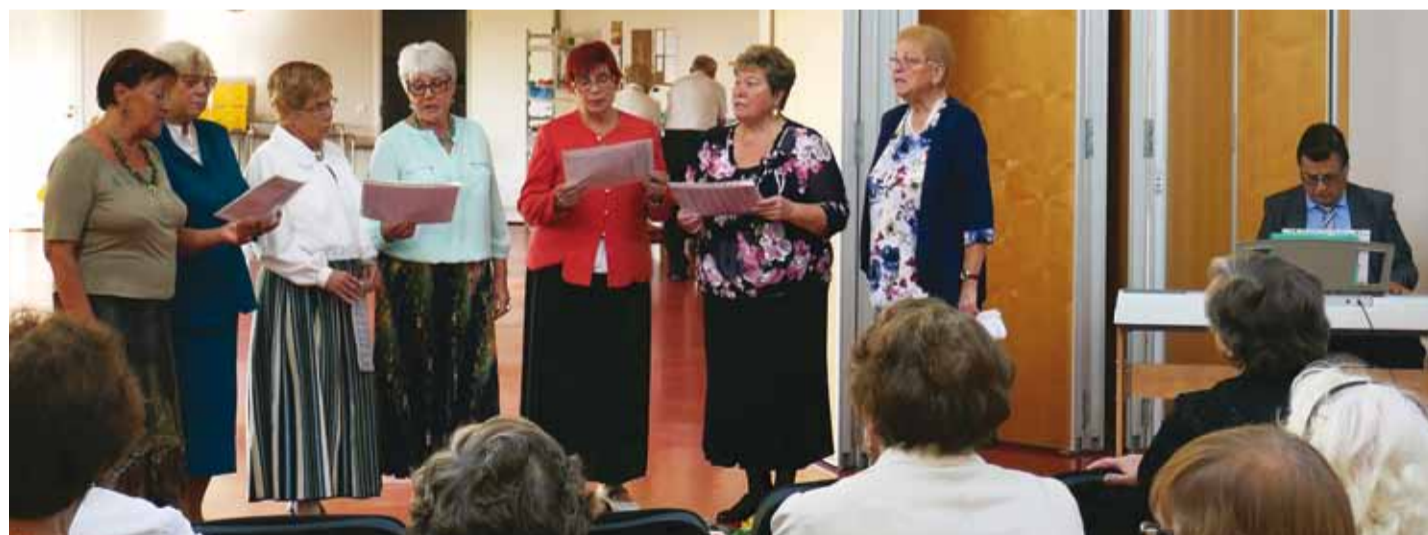
Randvere päevakeskuse lauluansambel Kibuvitsalill.