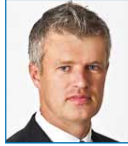
nr 247 Ergo Daum