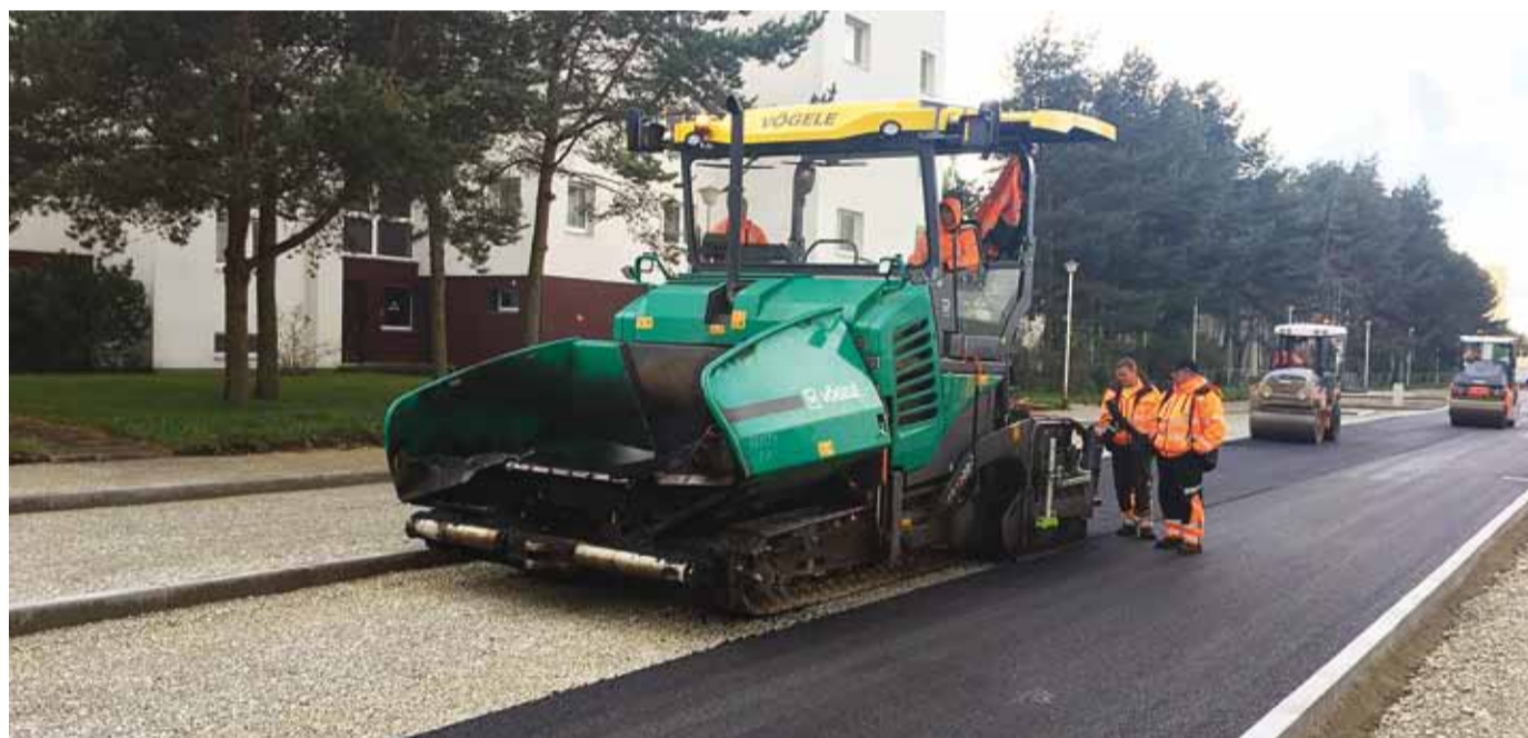
Heki tee esimese kihi asfalteerimine.