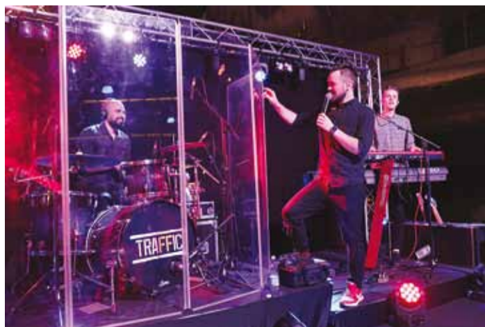
Õpetajatele esines ansambel Traffic.

eest oma klassi õpilaste juhendamisel ja toetamisel ning maakondlike ja ülekooliliste ürituste korraldamisel;