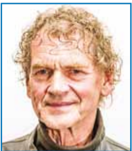
nr 248 Lembit Tammsaar