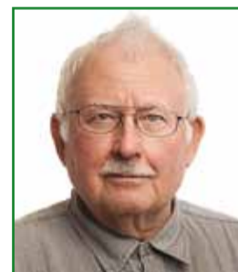
nr 114 Arvo Kundla