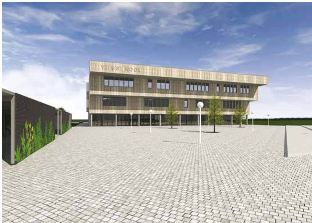
Viimsi riigigümnaasiumi hoone arhitektuurilähenduseks valiti möödunud aastal Novarc Group AS-i ning KAMP Arhitektid OÜ ühine ideelahendus. 3D-eskiisid KAMP Arhitektid OÜ

Tänases Viimsi Keskkoolis hakatakse peagi tegema ümberkorraldusi, et järgmise aasta sügiseks oleks koolist saanud tugev 9-klassiline põhikool.