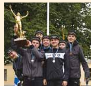
Palju õnne, Tallinna Reaalkooli meeskond!

28. septembril toimus Viimsi mõisapargis kindral Johan Laidoneri XVIII olümpiateatejooks.