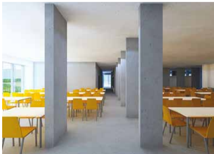
Vaade kooli söögisali.

Viimsi vallavalitsus loodab, et hoone valmimisel tekib hea koostöö riigi, valla ja kohalike