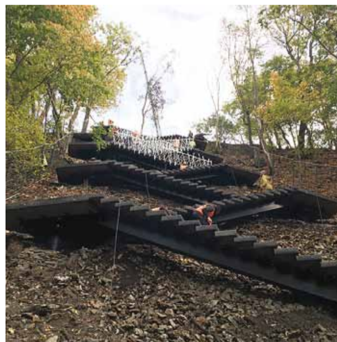
Põhjakonna trepi projekteeris Alver Arhitektid OÜ.