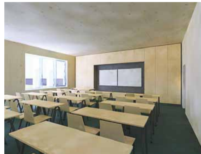
Koolimaja kandekonstruktsiooniks tulevad valdavas osas ristkihtpuud.