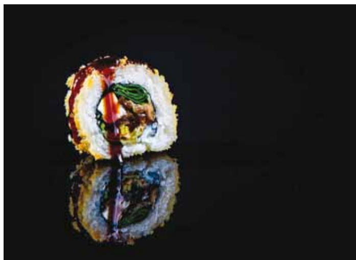
Sushit saad tellida ka koju ja kontorisse! Ette tellimine veebis sushiplaza.ee või telefoni 5884 8889.

tatud suutäiesuurune kala, mereand või muna.