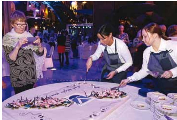
Viimsi valla hallatavates haridusasutustes on kokku 508 ametikohta ning meil on hea meel, et tänavusel vastuvõtul osales enam kuni 400.