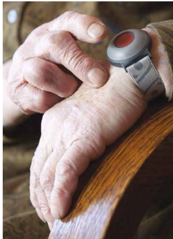
Häirenupu abil saab abi kutsuda.

Medi häirenupu kasutamine on väga lihtne. Hoolealune vajutab hädaohu korral randmel olevale ainsale nupule. Edasi tegeleb ja aitab teda abikeskuse operaator. Abivajaja ei pea meeles pidama telefoninumb-