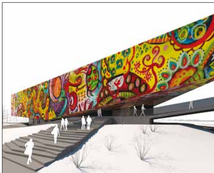
Tuleviku Koolis saavad õppida nii kohalikud kui ka rahvusvahelised kogukonnad. Joonis Tuleviku Arhitektid

Tuleviku Kooli projekt on võimalus luua täiesti uutmoodi kool, mille õpikäsitus loob tingimused läbilõigiks rahvusvahelisel tasandil. Tugev inglise keele oskus ja koolis loodud rahvusvahelised kontaktid annavad noortele rohkem valikuid tulevikuks.