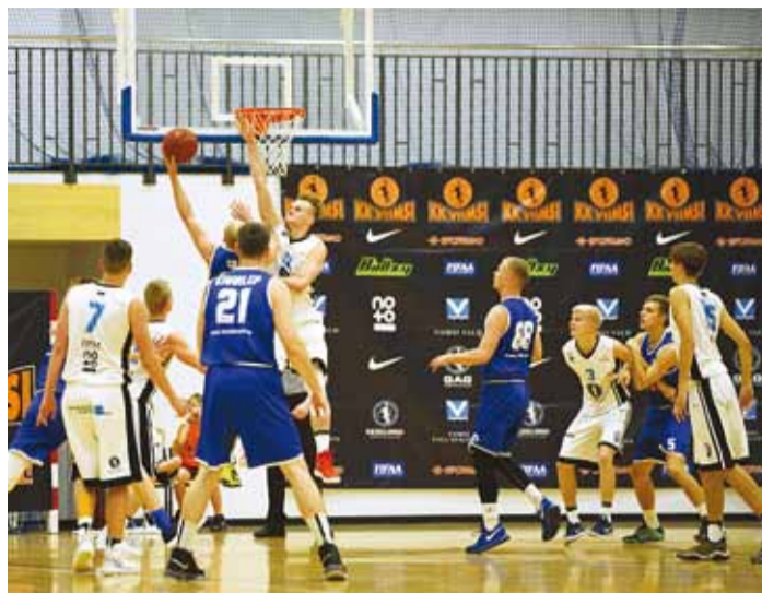
Alates sellest hooajast mängib KK Viimsi/NoTo esiliigas ning esimene võit on juba koju toodud.

Esindusmeeskonna mõte on olla püramiidi kroonijuveel, seda nii sportlikus kui ka platsivälises mõttes. Ehk iga laps ja noor peab saama neile poistele alt ülesse vaadata ning saada sellest innustust, et iga päev veelgi usinamalt harjutada, et kunagi ka ise esindusmeeskonna vormi kanda. Esimene eesmärk on pakkuda kogukonnale elamust ehk algaval hooajal tuua saali 200 kuni 300 inimest. Tulevikuplaan on aga meeskond ja noortetöö kolida valmivasse Karulaugu spordihoone korvpallisaali, kuhu mahub kuni tuhat huvilist. Siis saame tõsiselt