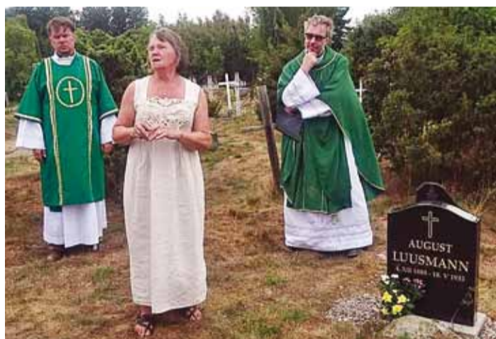
Luusmanni hauasamba avamine.

Saare kabeliga seondub terve peatükk kohalikku kultuurilugu. Legendi kohaselt olid ehitajateks merehädast pääsenud hülgelkütid. See 500 aasta tagune kabel kuulus Läänemere kalakabelite hulka, kus hoiti