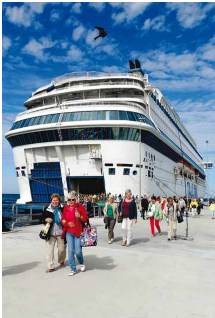
Gotland – me oleme kohal!

Järgmine reis viis meid läbi Baltimaade üle piiri nostalgilisse Valgevenesse. Esimene päev kulus sõiduks. Sõit koos Leedu-Valgevene piiri ületamisega kestis ca 15 tundi. Teisel päeval tutvusime kaasaegse Valgevene pealinna Minskiga. Kohaliku giidi saatel jalutasime raekoja platsil, külastasime Pühavaimu kirikut, kõndisime Vabaduse väljakul, kus asub suur kaubanduskeskus, millel asub kolm korrust maa all. Käisime kuulsal Pisarate saarel, mida ümbritseb Svislači jõgi ning millel kurb nimi ja saarel asuv ka-