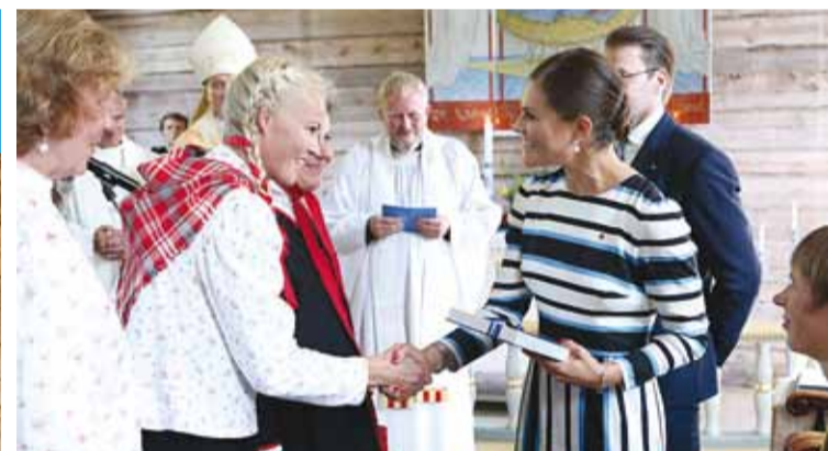
Estirootslased kroonprintsessi tervitamas.