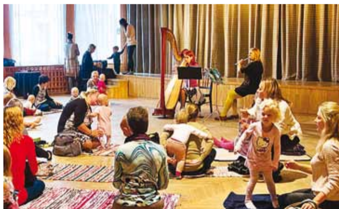
Pisimusa Viimsi huvikeskuses.

Seal võib väike kuulaja tunnetada ja kuulata muusikat just nii nagu talle sobib – kas tantsides, joonistades, keerutades või emme süles magades. Need kontserdid on piisavalt pikad, et äratada muusikahuvi ja ergu-