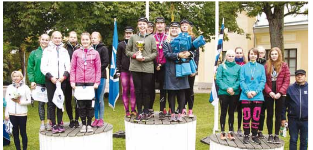
Pildil tublimad naiskonnad.

Olümpiamängud kannavad endas rahuaadet, Eesti väejuht kehastab tungi vabadusele. Ra-