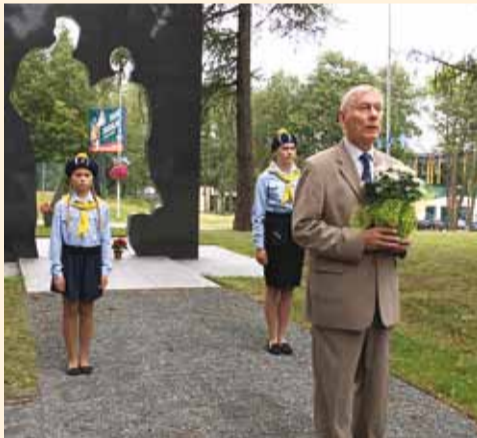
Trivimi Velliste kõnet pidamas.