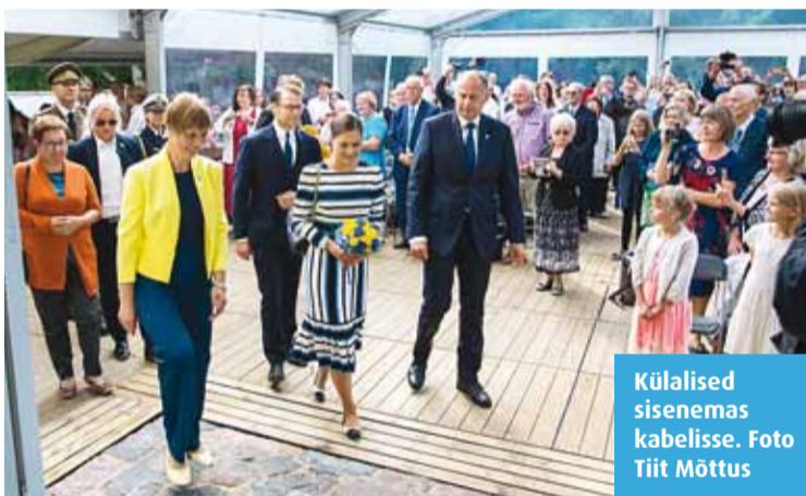
Külalised sisenemas kabelisse.