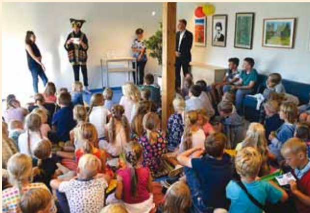
Suvelugejad said palju kiita.

Alates 2012. aastast on Viimsi raamatukogu laste suve mitmekesistamiseks ja lugemise populariseerimiseks läbi viinud 1.–9. klasside õpilaste suvelugemise üritust. Kui 2012. aastal oli osalejaid 23, siis tänava oli osalejaid juba 180, kellest vähemalt 5 raamatut luges läbi 126 last ja noort.