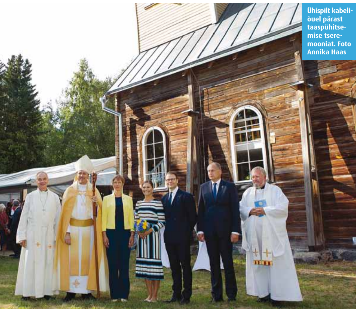
Ühispiilt kabeli-õuel pärast taaspühitsemise tsere-mooniat.