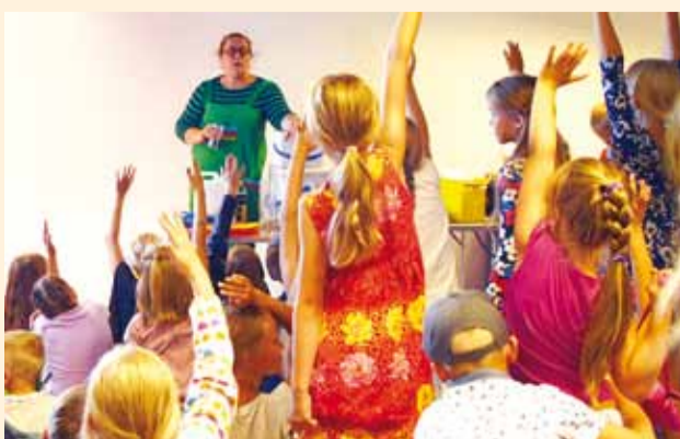
Noored lugejad olid lõpupeol väga aktiivsed ühistegevustes kaasa lööma.