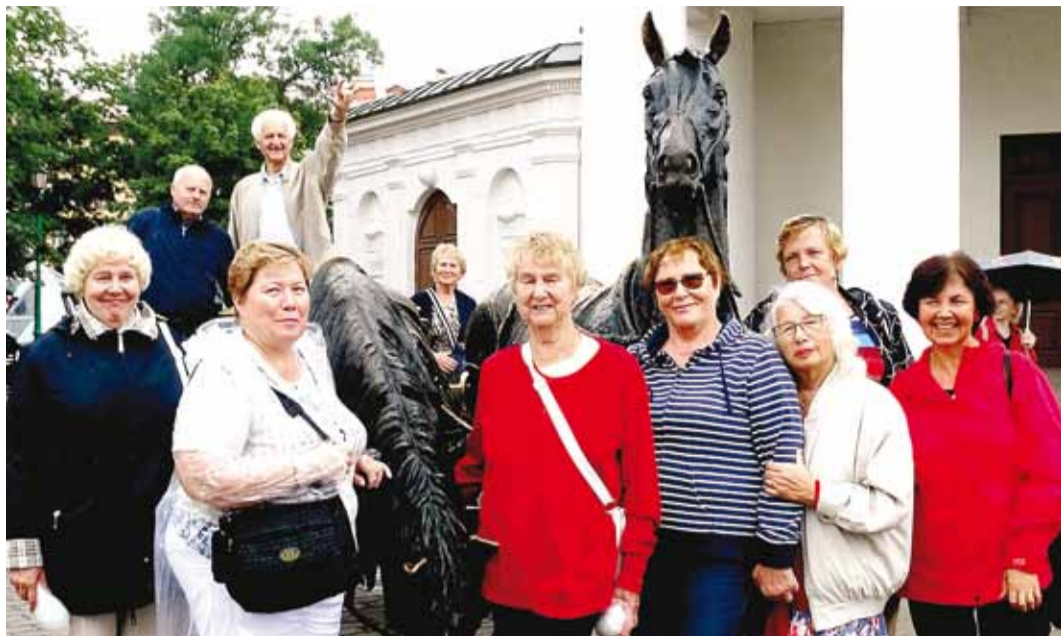
Reisieltskond Minski tänavatel.