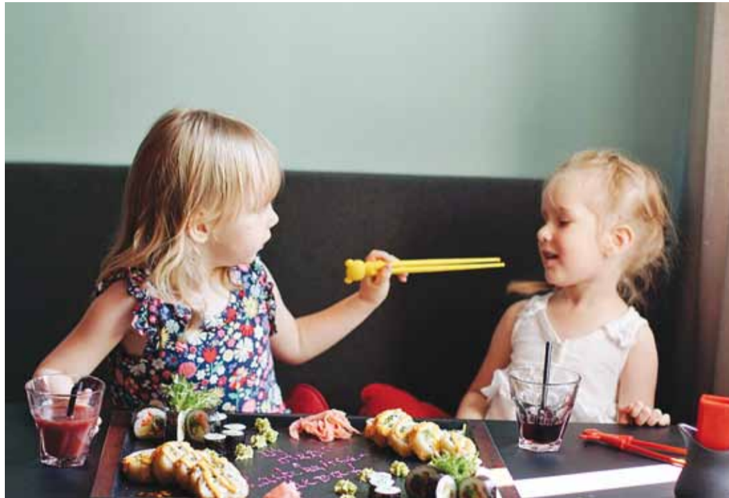
Maitse sina ka!

Erakordselt ilusate ilmadega suvi on päikesekiiri kokku pakkimas ning suundub peagi väljateenitud puhkusele. Lastel algab kohe-kohe uus kooliaasta ning vanemate jaoks tähendab see argirutiini naasmist. Et pidulikku päevi eriliseks ja argipäevi lihtsamaks muuta, on mõnus aegajalt koduse kokkamise asemel hoopis mõne söögikoha maitseid nautida. Viimsi Keskuse restoranides saavad kõhu täis nii suured kui ka väikesed. Uurisime, mida head ja paremat just perede pesamunadele pakutakse.