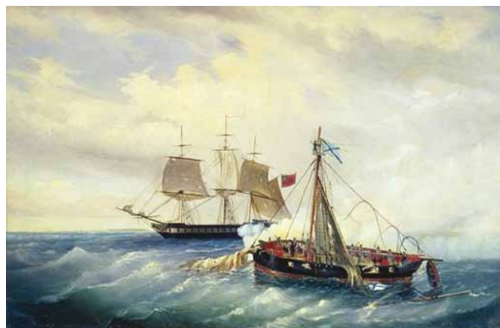
Duell fregatt Salsette'i ja kuuter Opõti lahing. Repro: Leonid Blinovi 1889. aastal valminud maalist.