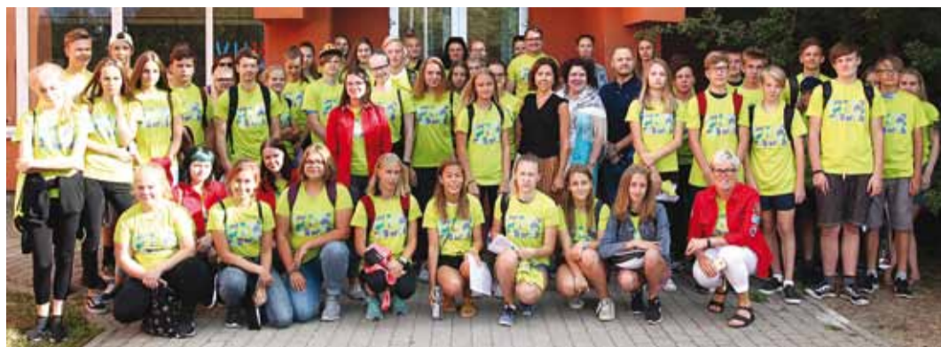
Maleva teise vahetuse avamine.

Malevlaste töötasu maksis Viimsi vallavalitsus. Innovaati-