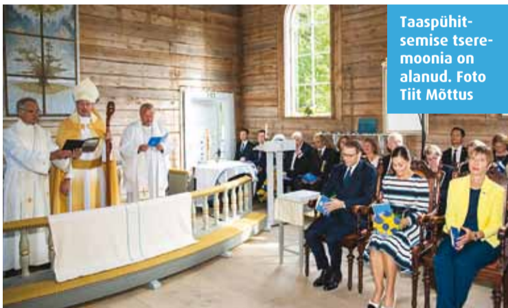
Taaspühitsemise tsereemonia on alanud.