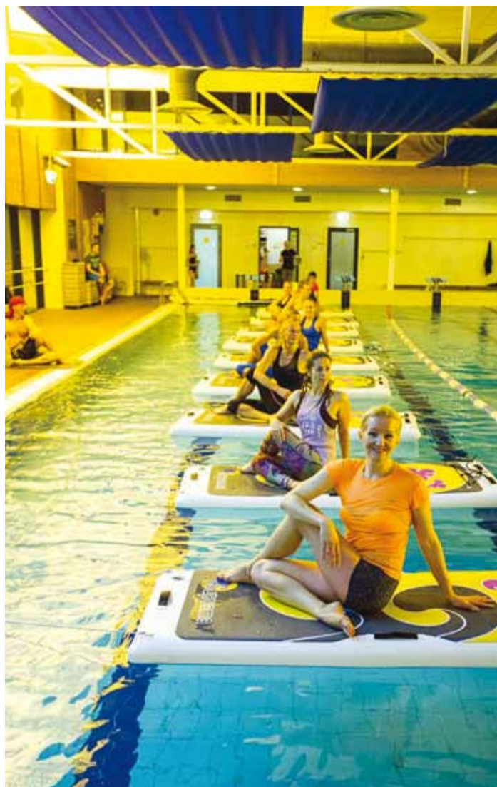
Suppama Yogafunc Aqua treening.

Tallinn Viimsi SPA spordiklubi on tippasemel jõusaal, kus leidub treeningvahendeid nii trennivõhikule kui ka nõudlikule sportlasele. Kardiopargis saab hige jooksmas jooksulindil, rattal, spinneril, sõudeergomeetril, ellipsil või suusatamismasinal. Jooksulindid, ellipsid ja rattad on varustatud multimeedia- ja meelelahutuskeskustega, et lemmikarjad vaatamata ja sotsiaalmeedia sirvimata ei jääks. Plokkmasinate pargis on olemas kõik masinad, mida mitmekülgseks treeninguks vaja. Suurem osa neist on dubleeritud, et väärtuslik trenniaeg teiste järgi ootamisele ei kuluks. Vabade raskuste alas on sobiva raskusega hantlid nii nuudlikätele kui ka jõuk-sijõmmudele. Hantlite valik küündib 50 kilogrammini ning