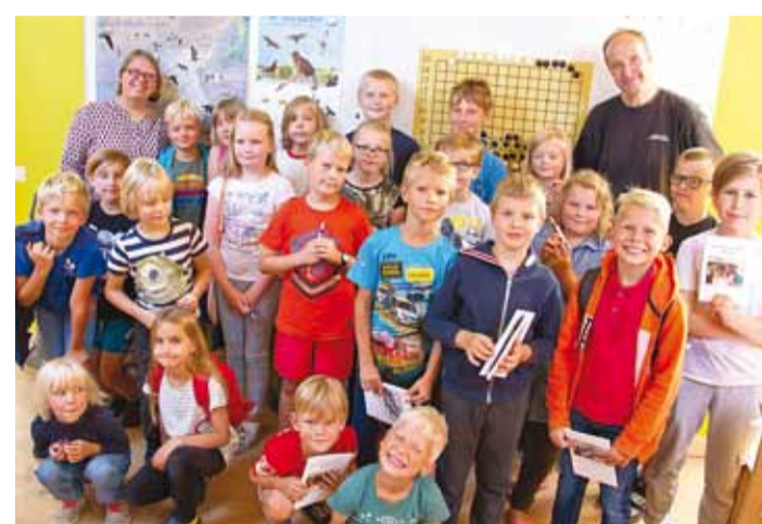
Gomoku lauamängu huviliste grupipilt.