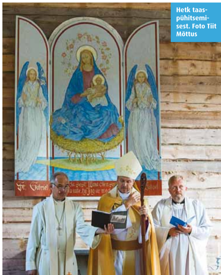
Hetk taaspühitsemisest.