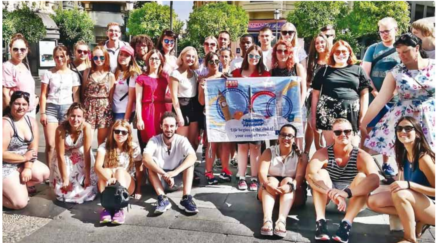
Grupipilt Cordobas.