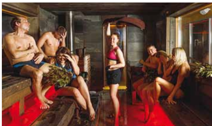
Peale trenni lõdvesta lihaseid kuumal vihtlemisrituaalil.

kaalu on võimalik suurendada hantlivartega. Tehtud saavad nii täiskükk, jõutõmme kui ka lamades surumine. Jõusaalis asub ka TRX tsoon, mis paneb proovile kogu keha vastupidavuse. Lisaks leidub ala, kus trennida kummilindi, stepiingi, bosu ja palliga.