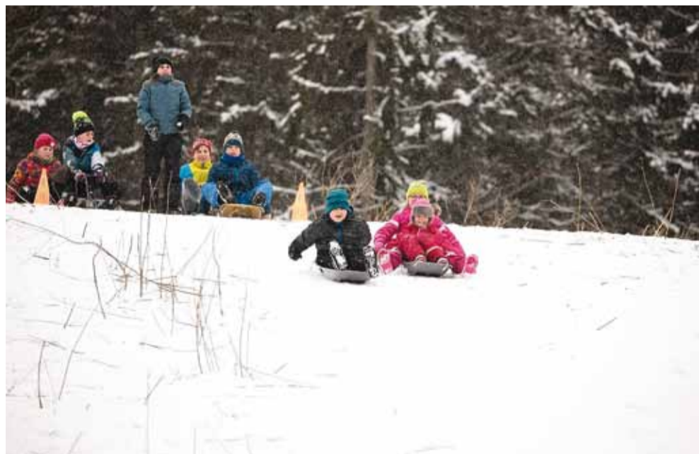
Vastlasõit Rohuneeme kõrgeimalt künkalt.

market – HC Tallinn 1. Viimsi Kooli spordikeskuses ■ 9. märts kell 19 Reedesed üksikmängud tennis. Osavõtutasu 30 €. Registreerumine kuni 08.03: reimo@viimsitenis.ee. Viimsi tennis-keskuses