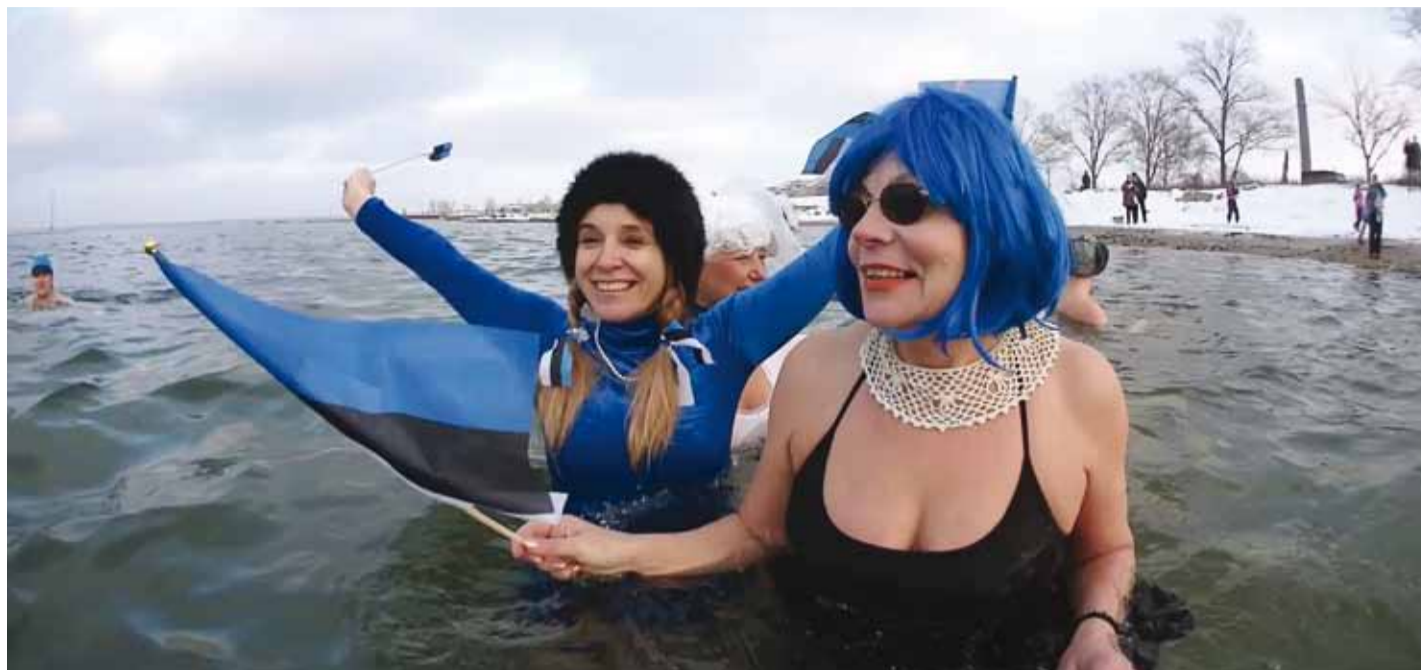
Treening 24. veebruariks Kalarannas.

Jääringis toimub ka palju muud põnevat. Näiteks regulaarsed