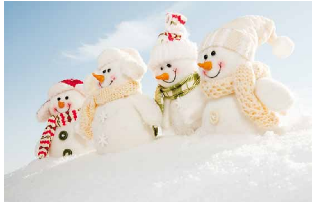
Heategu teeb rõõmu nii andjale kui ka saajale.

Abivajaja tihti häbeneb oma olukorda, aga tänulikkus on vaik-