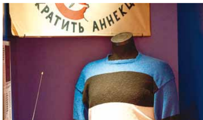
Näitus "Minu vaba riik" Maarjamäe lossis.

Olulisemad sündmused ja tehtud valikud avanevad nii mä-