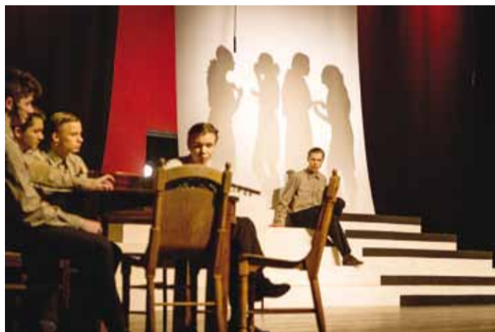
"Valge tee kutse" on kullaprooviga lavastus ja jääb kauaks meelde.