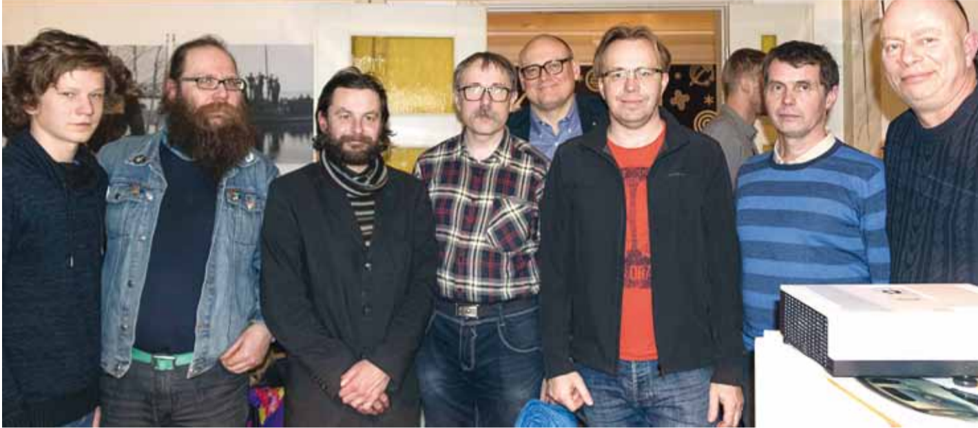
Seekord jagasid esikohta Tammneeme ja Tempo võistkonnad.