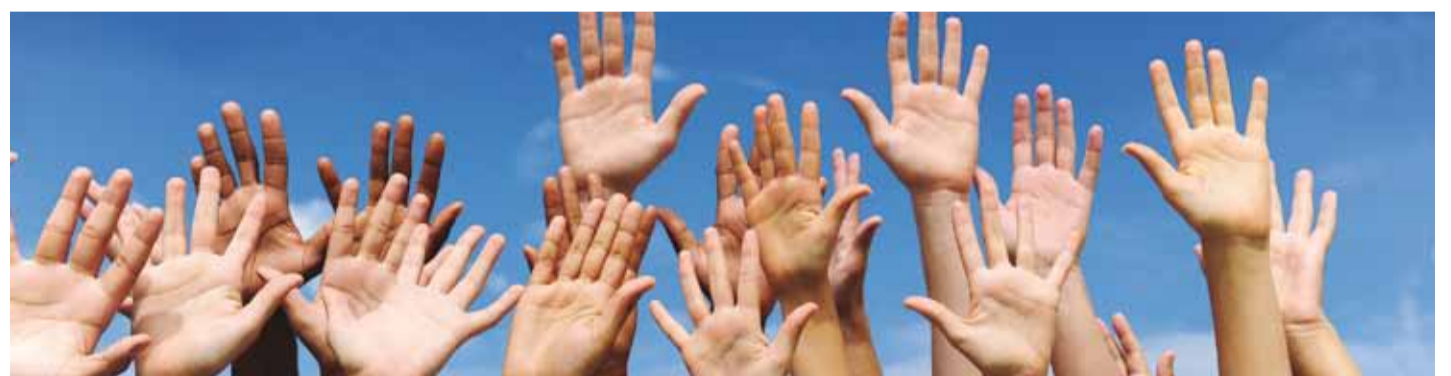
Teismelisele on sõbrad olulised, aga vanem peaks lapsele alati olemas olema.