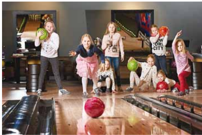
Bowling sobib nii noortele kui ka vanadele.

mulikke esemeid on leitud väljakaevamistel Egiptuses ja nende vanuseks on arvatud rohkem kui 5000 aastat. Esimesed bowling kuulid olid tehtud kivist,