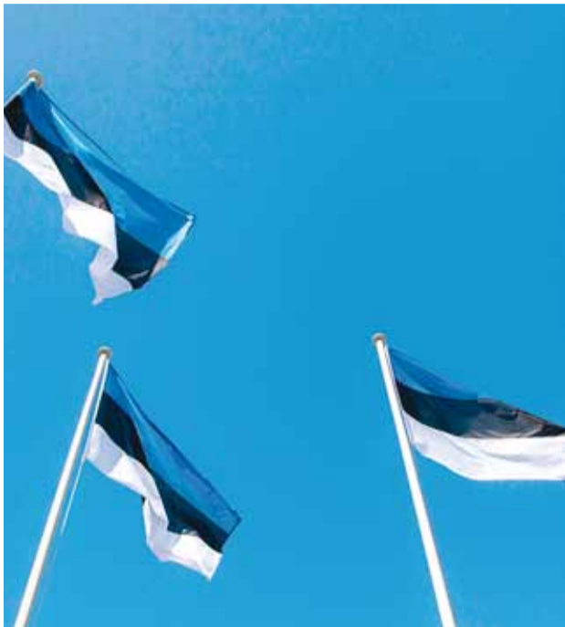
Eesti on meie maa!

Laululugusid Eestimaast on mitmesuguseid, kuid omal moel kõnelevad need laulud ikka ja alati armastusest, mis on tekkinud ühel rahval maa vastu, kus elatakse. Aeg-ajalt on aga tõesti selle kõige juures oluline küsida, mis on see armastus – mis maa see on, mida meie armastame?