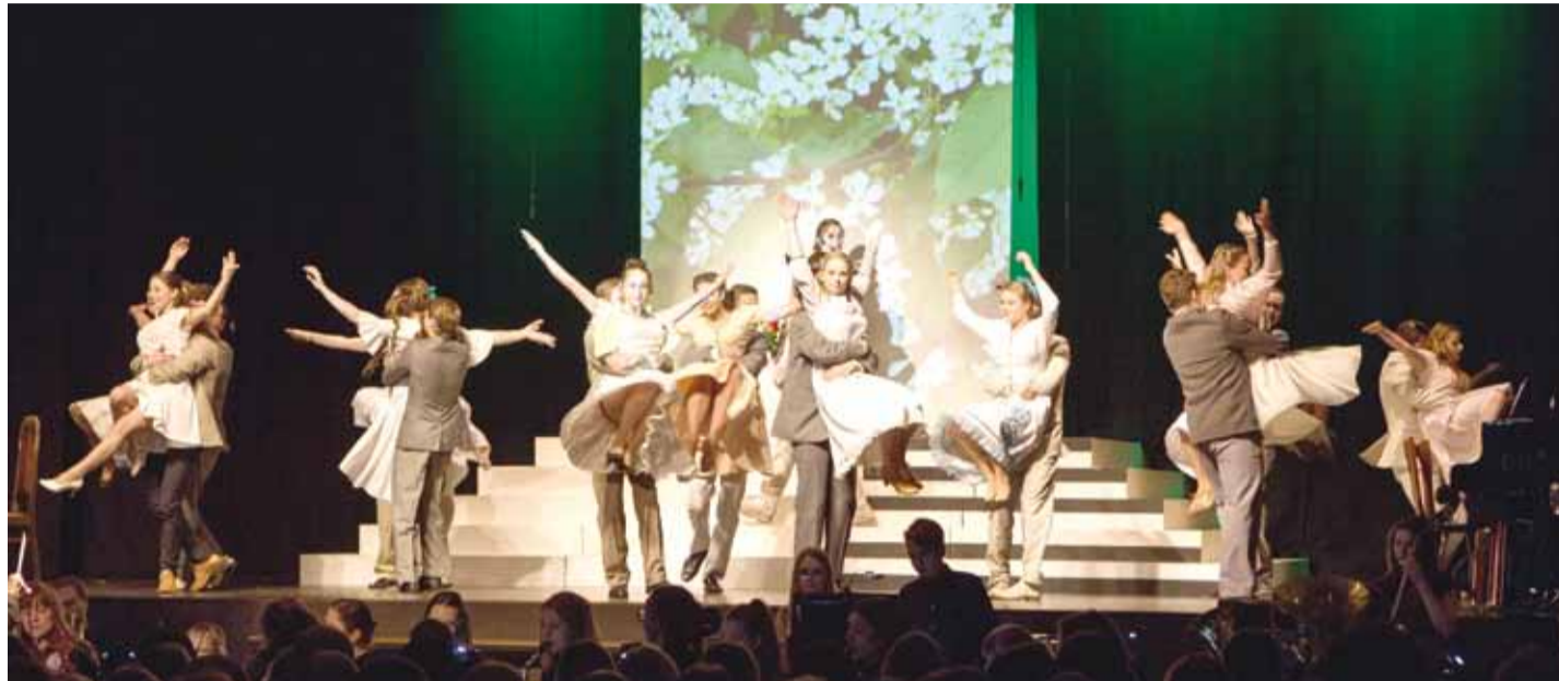
Lavastuse muljetavaldavamad hetked olid laulu- ja tantsunumbrid.

Suurepäraselt sekundeerib tagasihoidlikule ja pigem aeglasevõitu Raimondile elurõõ-