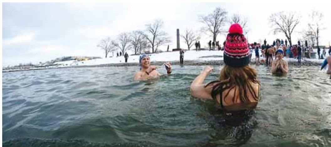
Mis kena rannailm!