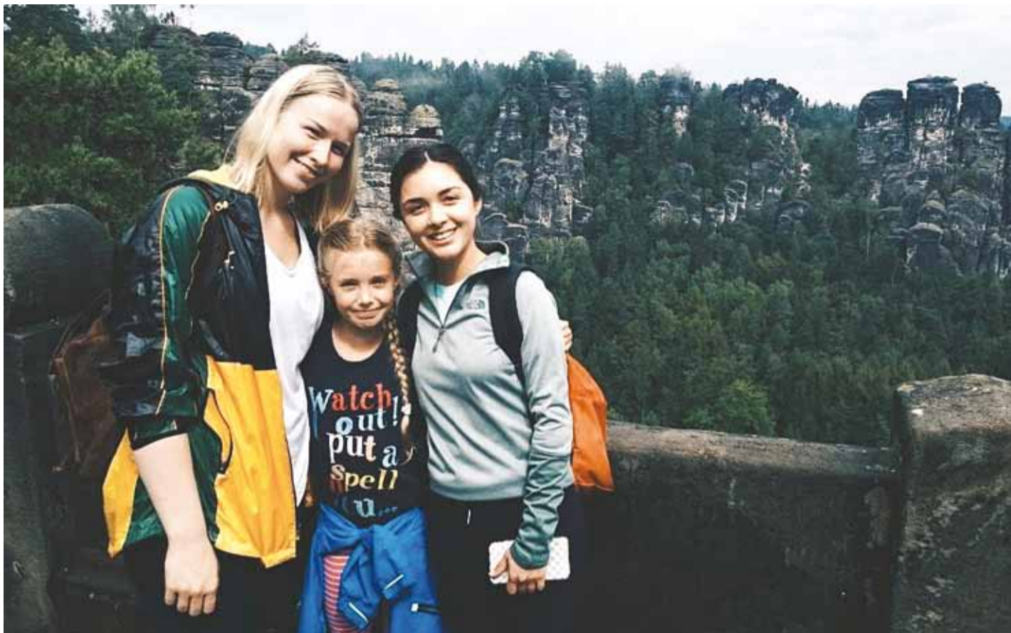
Sächsische Schweiz rahvusparkis.