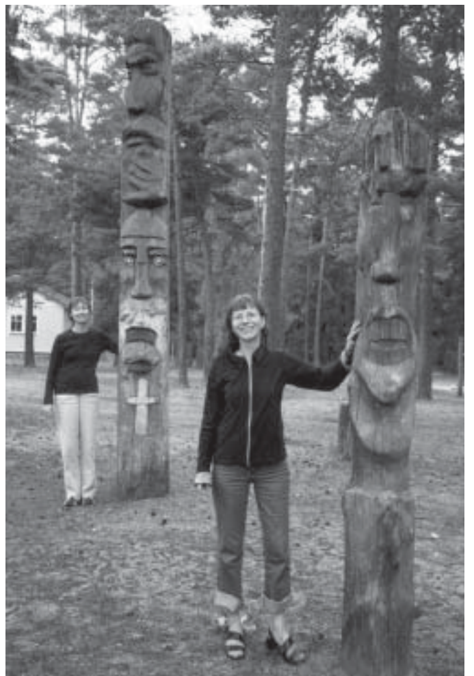
Puud ja inimesed suhtlemas