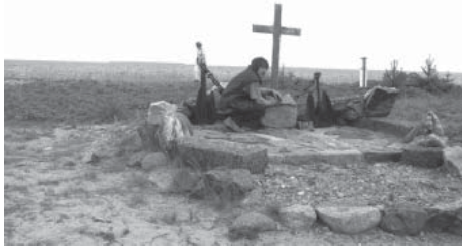
Prantsuse sõdurite haa mälestusmärk.