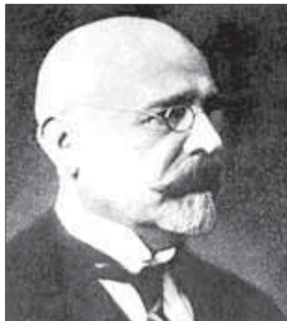
Eesti delegatsiooni juht Tartu rahuläbirääkimistel Venemaaga, juuraharidusega Jaan Poska sai välisministriks 24. veebruaril 1918.