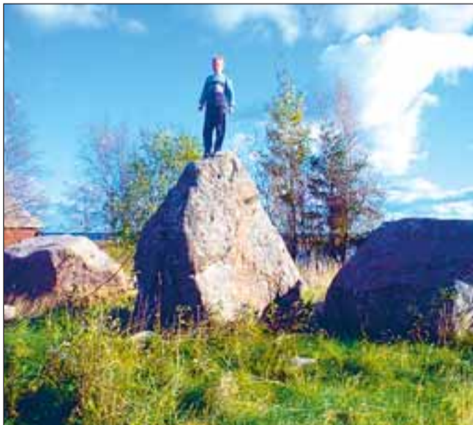
Kolme venna kivi