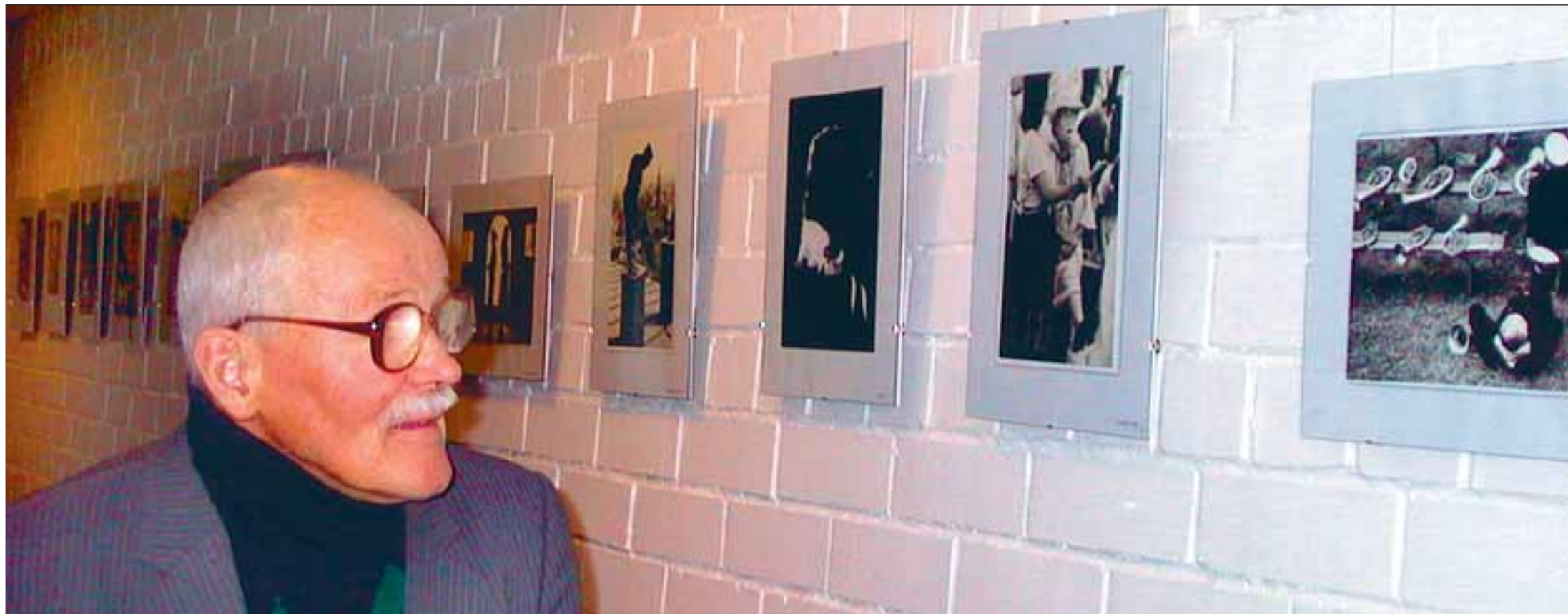
Paljusid eri aastakümneil sündinud fotosid on huvitav taasavastada autoril endalgi.