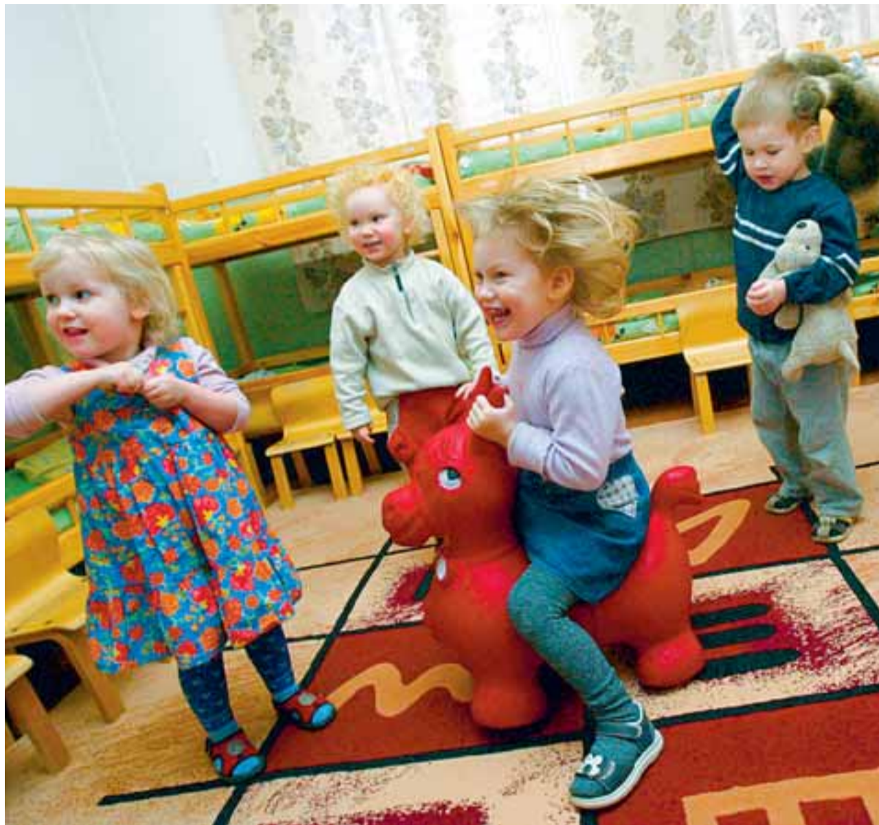
Praegu käib Eestis lasteaias umbes iga teine kuni nelja-aastane laps.

Taotlusedokumentide vorme saab PRIA büroodest ja veebilehelt www.pria.ee. Toetuse määramine selgub 1. augustiks ja see makstakse välja hiljemalt 10. oktoobriks. (PRIA)