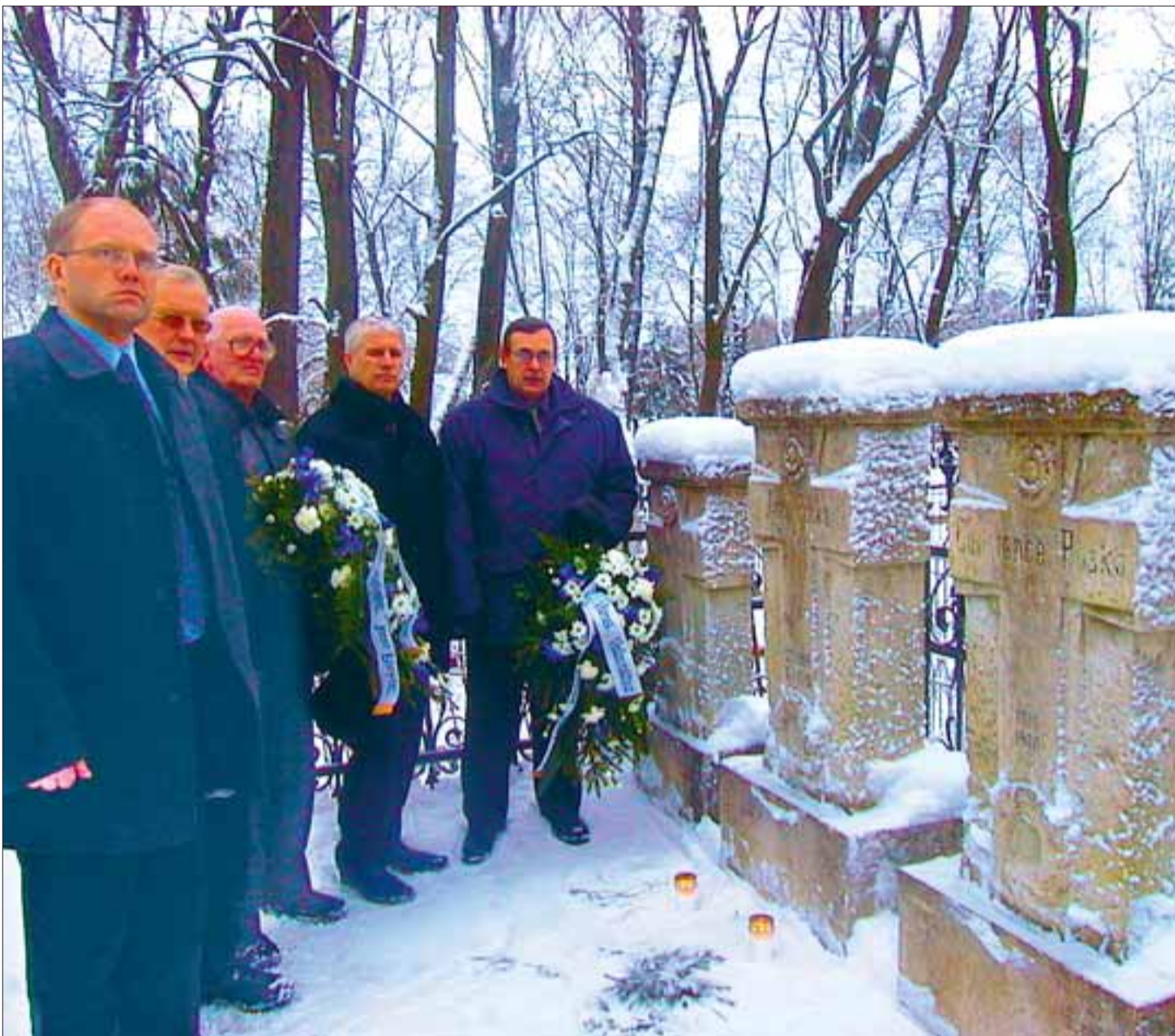
Tartu rahu aastapäeval 2. veebruaril viisid Viimsi valla ja Pirita linnaosa juhid pärjad Jaan Poska ja Konstantin Pätsi hauale.

Meeleoluka etteastega esines Pirita vabaajakeskuse naisansambel. Kaetud oli rikkalik pidulaud. Viimsist oli kohal 11 veterani, kellel oli taas võimalus rindekaaslastega meeldivas õhkkonnas juttu vesta ja möödunud aegu meenutada.