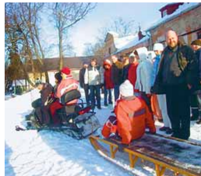
Liugu saab lasta mitut moodi.