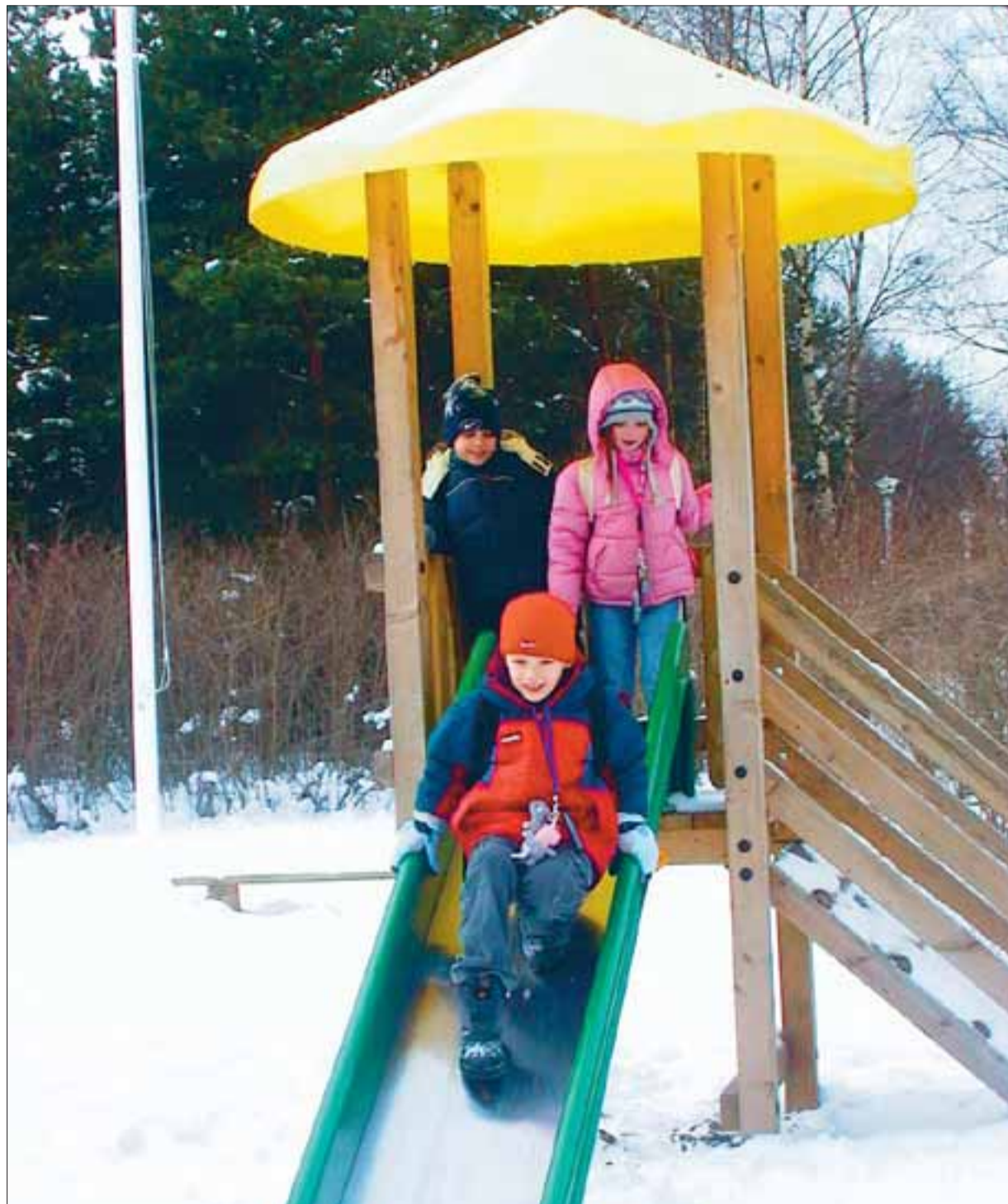
Haabneeme uuel mänguväljakul jätkub tegemist nii suvel kui ka talvel.

Sporditoetuste kord rakendus vallas esimest korda eelmisel aastal. (VT)