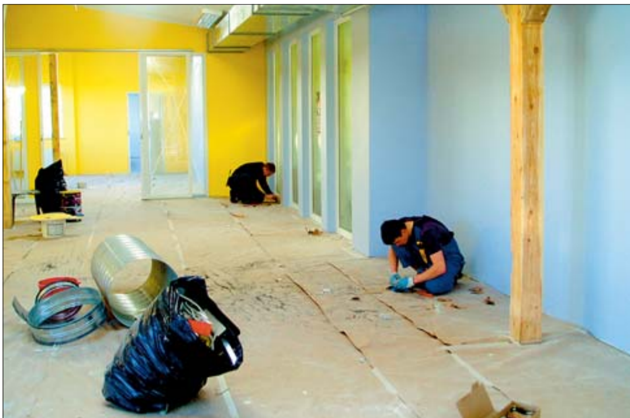
Pansionaadi teise korruse juurdeehituse tulevad mugavad raamatukoguruumid.