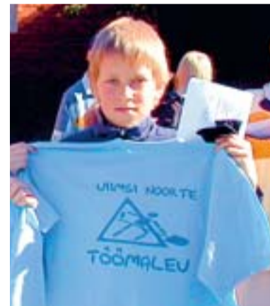
Mullu suvel töötas Viimsi õpilasmalevas üle saja lapse.

Osalistel tänavad koolituse rahastajaid Viimsi keskkooli, SA Viimsi Keskkooli Fond, Viimsi vallavalitsust ja Püüsi põhikooli. Üritust aitas korraldada valla haridus- ja noorsooamet. (VT)