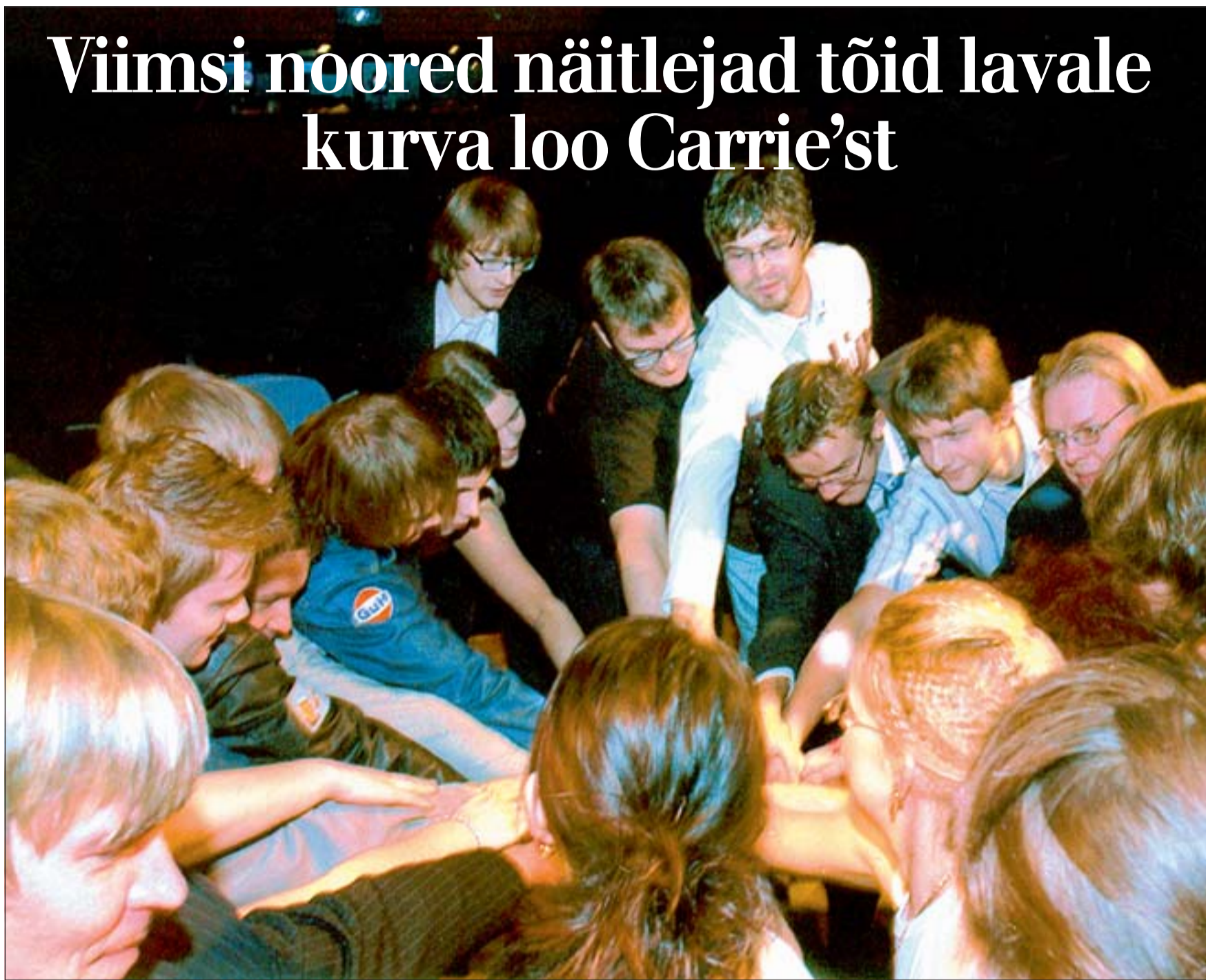
Traditsiooniline energiavahetus näitetrupi liikmete vahel. Etenduse alguseni on jäänud 15 minutit.