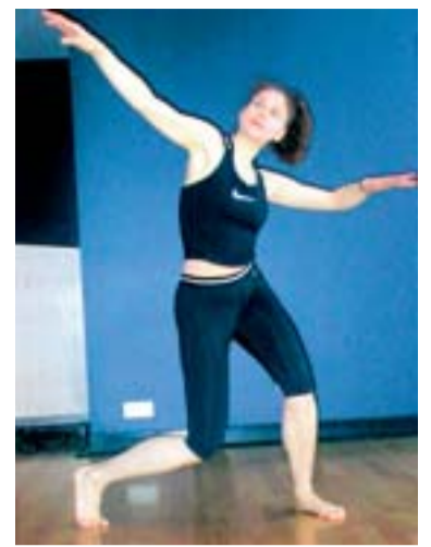
Kadri: teie käed on kui hõljuvad siidsallid tuules...