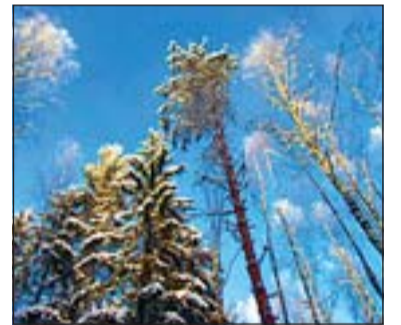
Viimsi poolsaarel on metsi rohkem kui tuhat hektarit.

Vastuväited ja ettepanekud tuleb esitada vallavalitsusele kirjalikult hiljemalt 15. aprilliks. Loodusobjekti kohaliku kaitse alla võtmise avalik arutelu toimub vallamajas 20. aprillil kell 15.