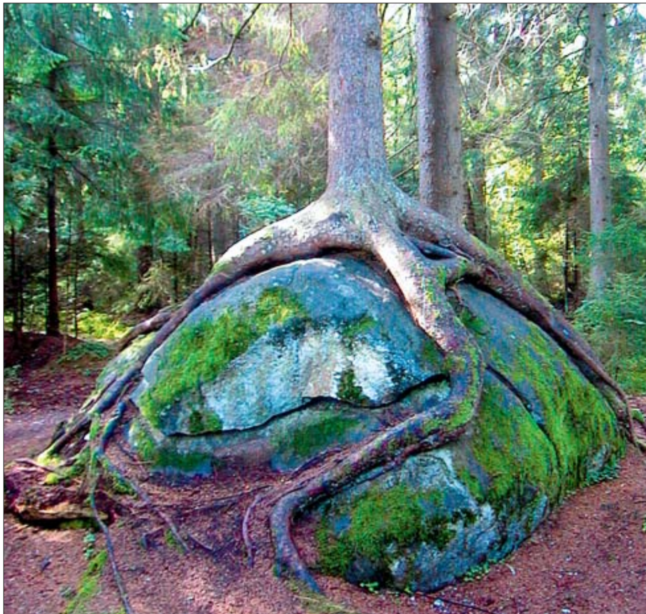
Tulevasel looduskaitsealal kasvab ka kuulus Tādu kuusk.

Selliste arengute vältimise heaks näiteks on Viimsis algatatud Mäealuse maastikukaitseala moodustamine. Tulevase kaitseala pindala on ligikaudu 650 ha. Selle peaväärtused on klindiasang, pangaalused taimekooslused, pärandkultuurimaastik, Lubja ja Randvere vahelised metsad ning Soosepa raba sooja metsakooslused.