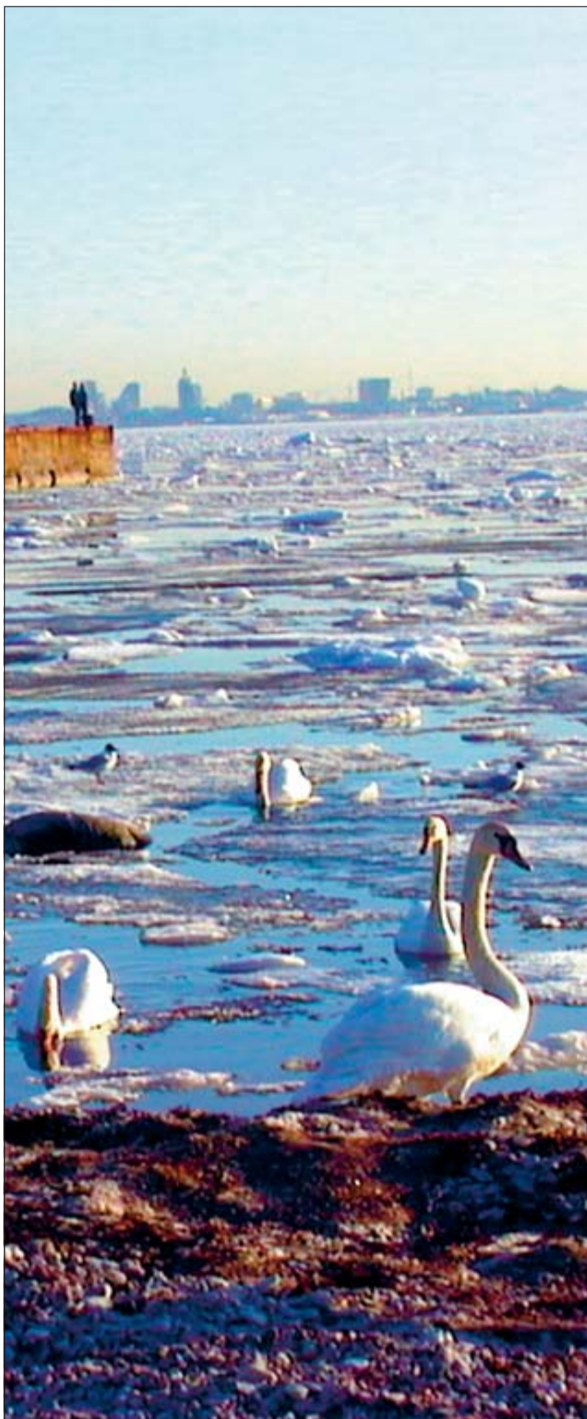
Kevadel on üks kindel stressimaandaja jalutuskäik mere äärde. Kai Maran

Risk suureneb pikaajalise stressi all kannatava ja alkoholiga liialdava