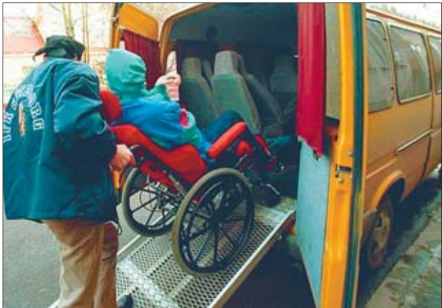
1. aprillist delegeris riik hooldajatoetuste maksmise kohalikele omavalitsusele.

Omavalitsusliidud taotle- vad aastateks 2006–2009 omavalitsuste tulubaasi kasvu, et viia see vastavusse omavalitsustele riigi poolt üle antud kohustuste- ga. Omavalitsusliitude koostöökogu ja valitsuse delegatsioon loodavad lõpp-protokolli alla kirjutada mai keskel.