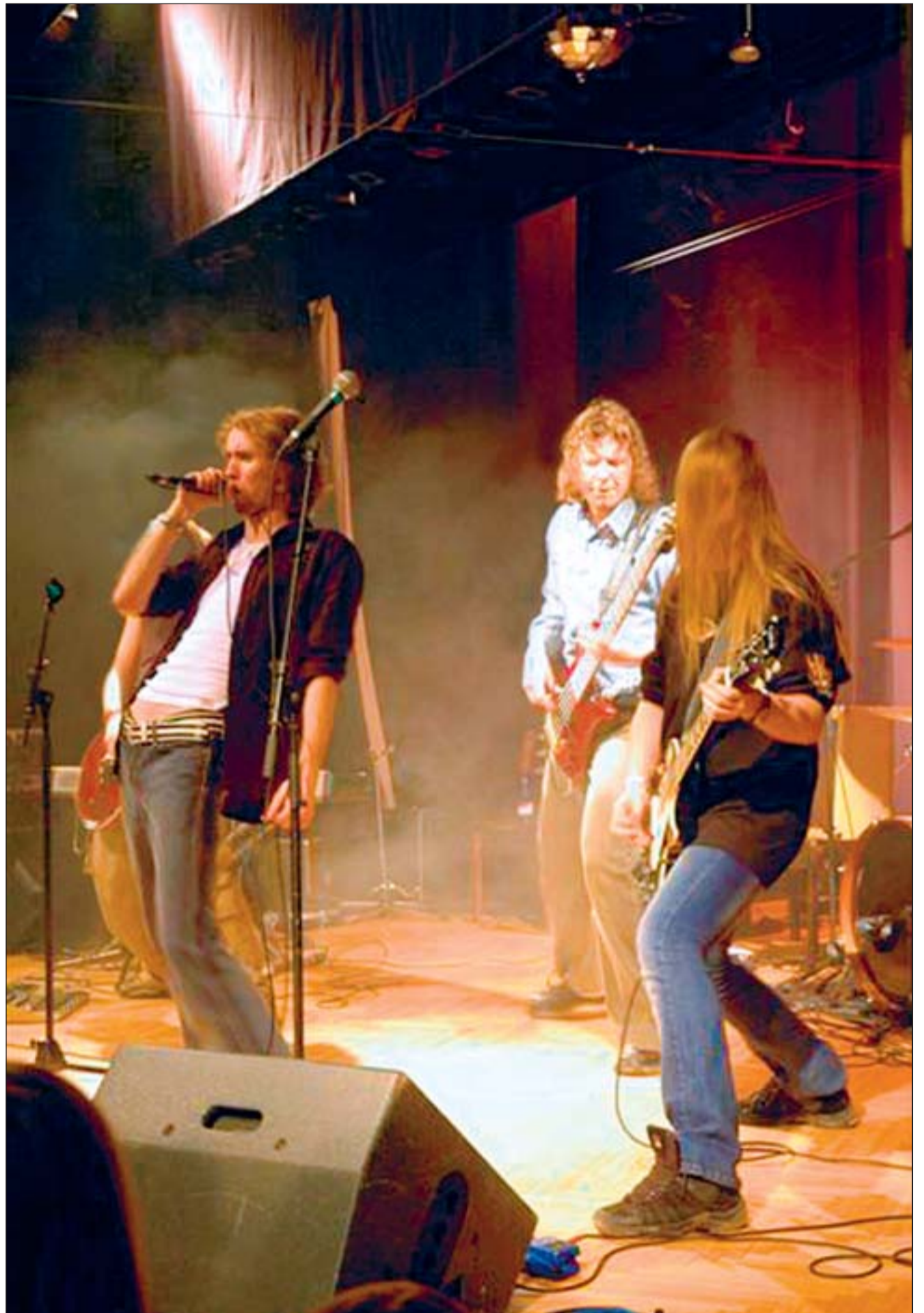
Viimsi oma bänd Brides in Bloom kogub jõudsalt populaarsust üle Eesti.

Festivalil tegi oma debüüdi ansambel @ad. Leidlikkus ja huumorilaval saavad alati sooja vastuvõtu osaliseks, eriti kui need on hästi serveeritud. Naerda