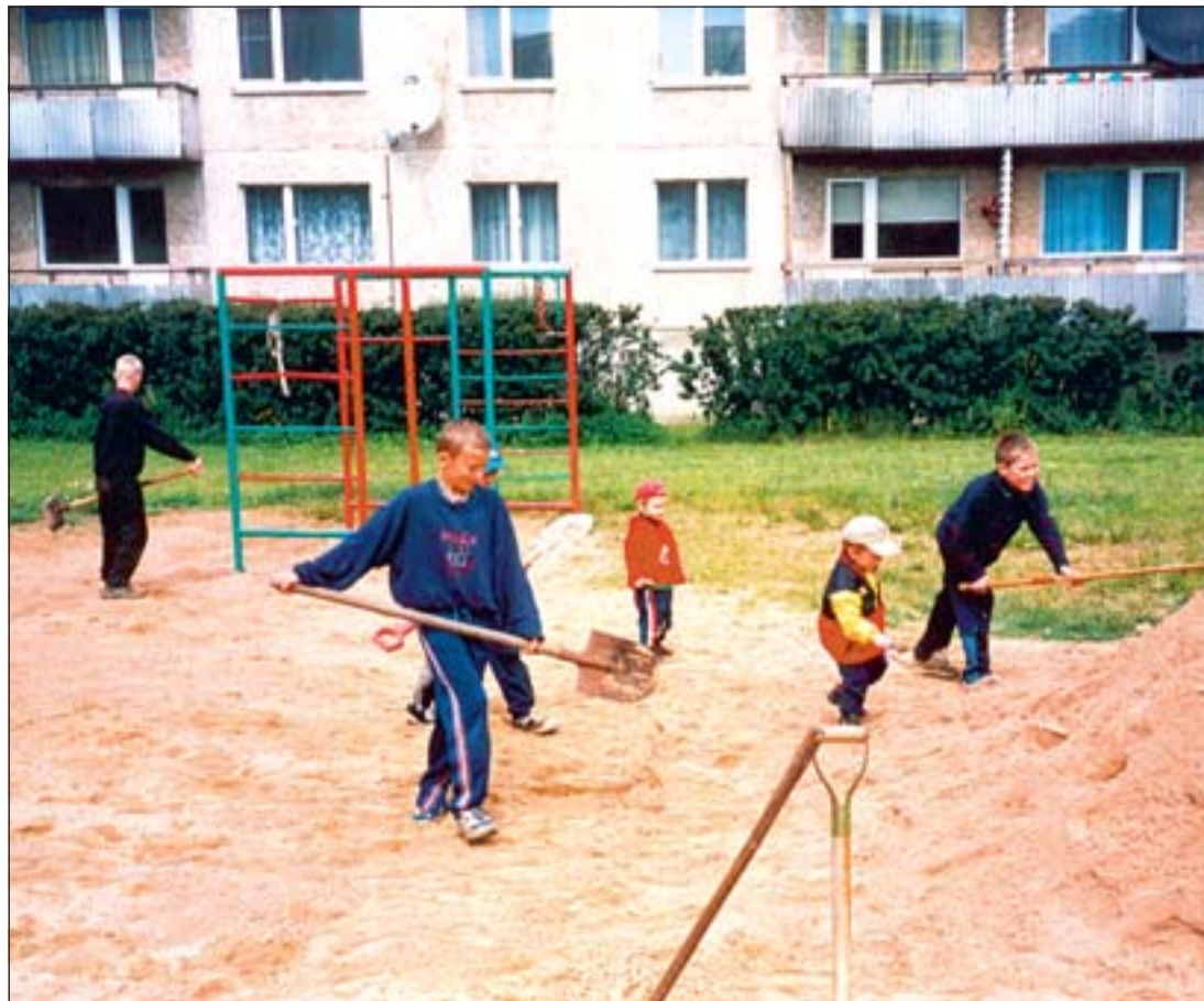
Põhitöö tegijad olid koolilapsed, kuid leidsid ka paariaastaseid, kes oma väikese kühvliga suureks abiks olid.