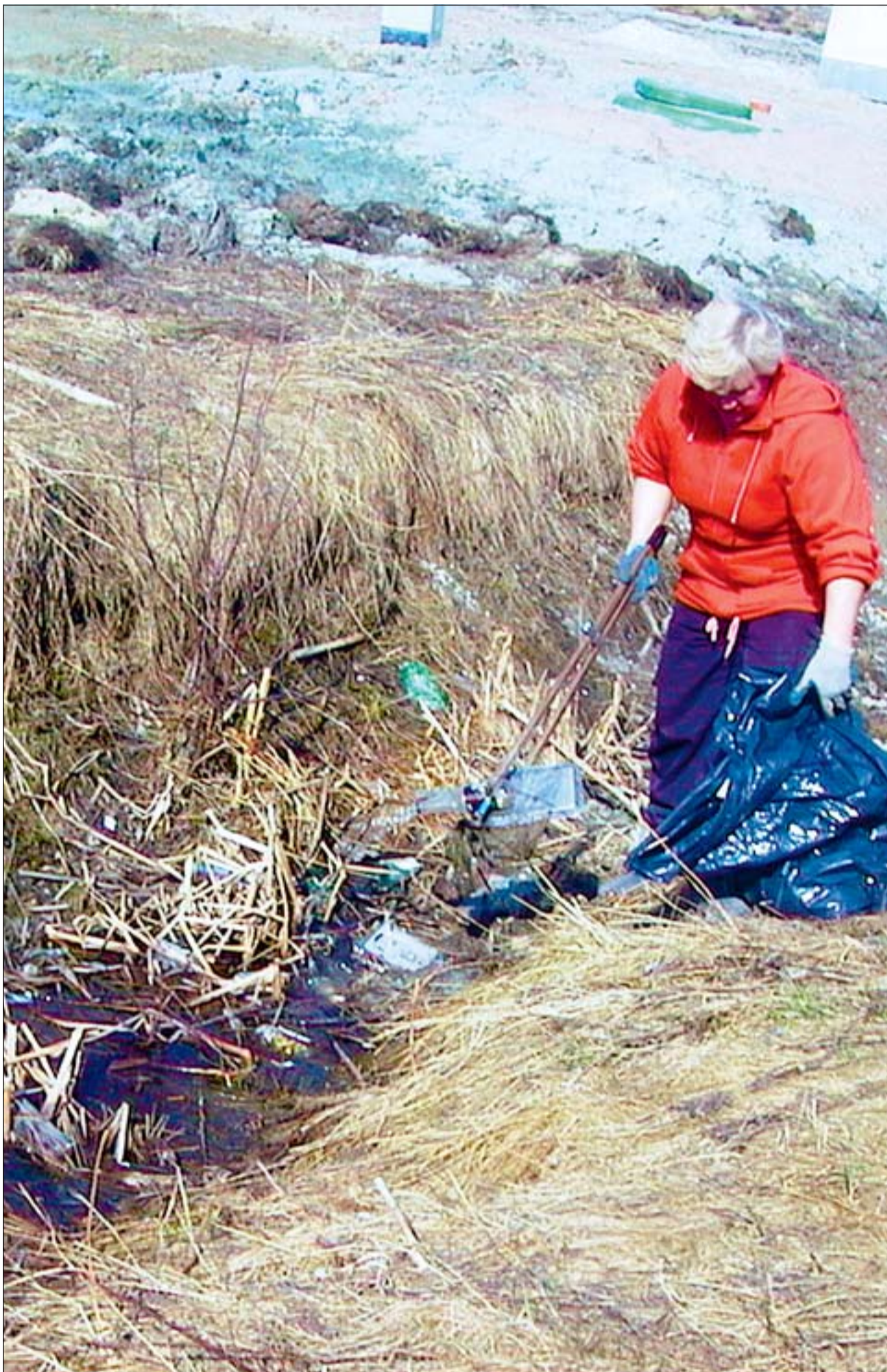
Mullu korjasid heakorratöölised valla teeäärtest kokku kümme tonni prügi.