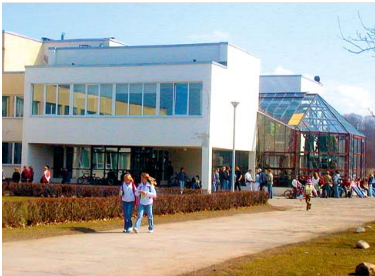
Viimsi keskkoolis õpib praegu 905 last.

Viimsi keskkooli nüüdne moto – kin- del algus sinu elule – tähendab võrdse- te võimaluste pakkumist igale lapsele vähemalt põhikooli lõpuni. Kõigil publi-