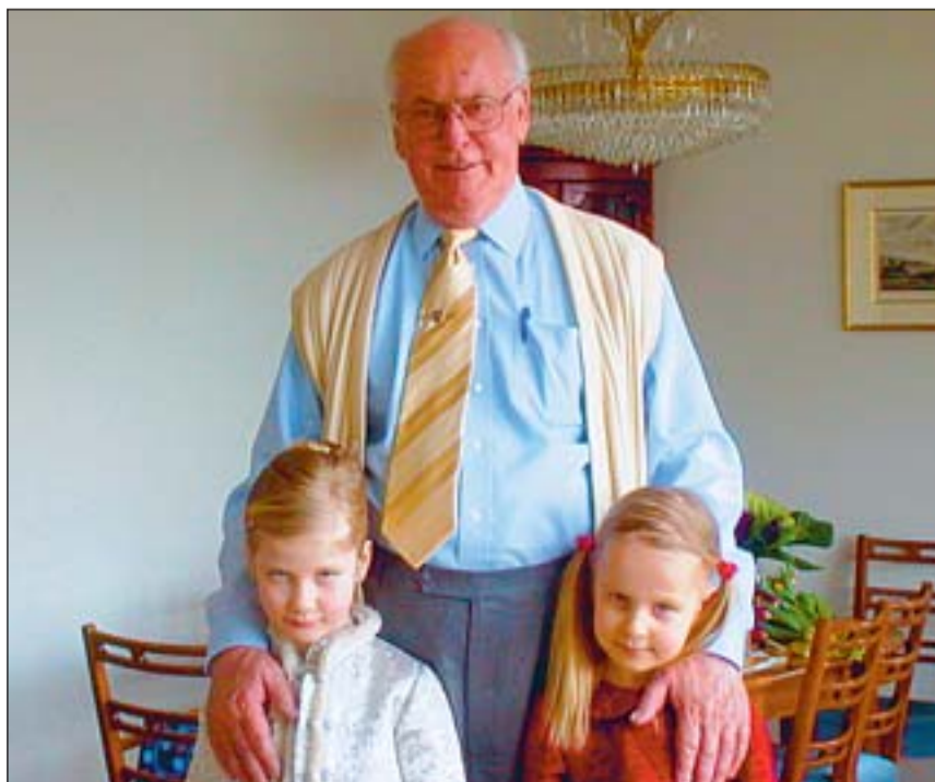
Viimane laulusalm lõpetati üheskoos.