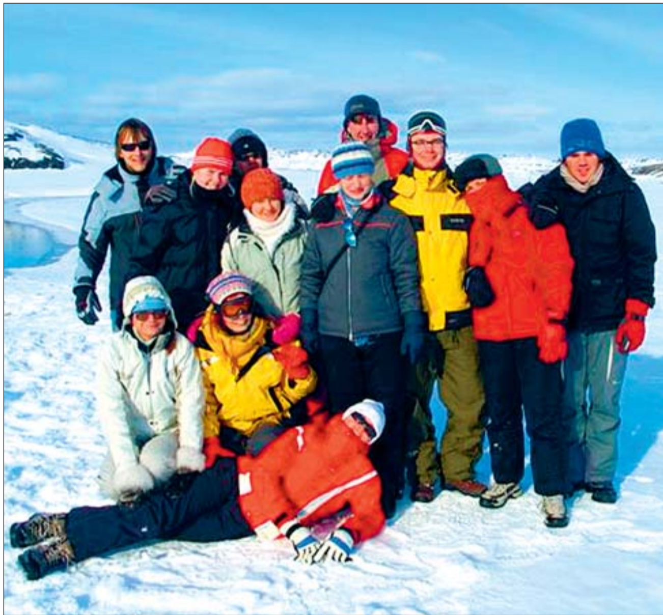
Reis Gröönimaale pakkus Viimsi noortele tohutu elamuse.

Linn, kus elasime, oli väike ja väga armas. Inimesed naeratasid, kui neist möödusime, isegi autouhjud lehvitasid meile. Tuli selline soe tunne, nagu ole- sime seal juba aastaid elanud. Kõikjal võis leida autosid, millel oli mootor käi- ma jäetud. Meile tundus see muidugi kummalisena, kuid varastatud autoga