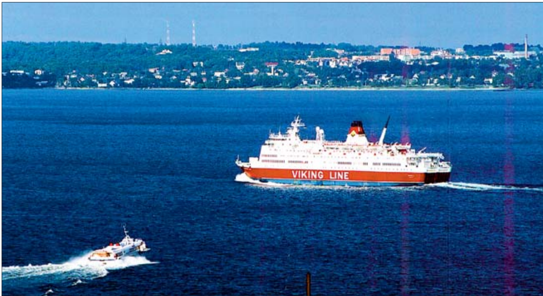
Eesti ja Soome vahet sõitev laev Viimsi poolsaare taustal.