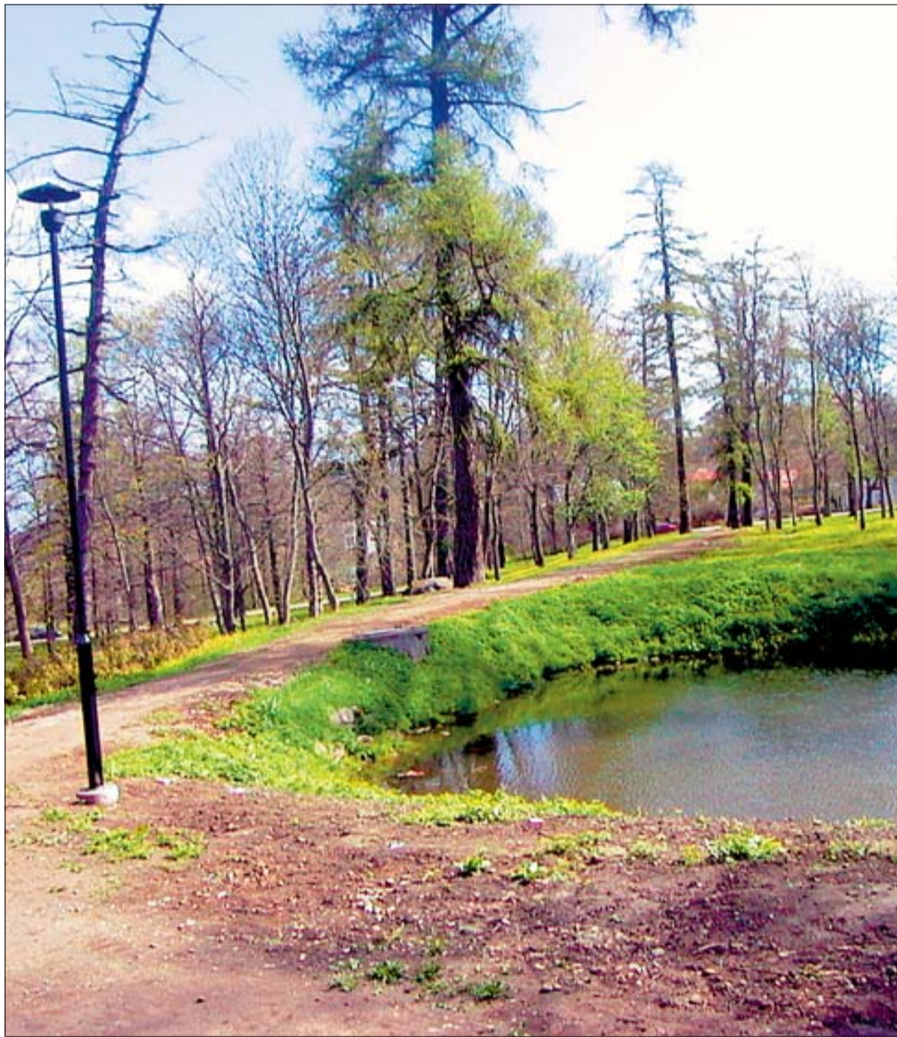
Iga aastaga üha korrastatumat ilmet omandav Laidoneri park kutsub jalutama.

ASi Koger & Partnerid rekonstrueeritud lõik tee 3,9 ja 7,3 km vahel saab mais ka korraliku haljastuse. Samuti haljastatakse valla tellimisel ehitatud jalgratta- ja jalgteega piirnev ala teelõigul, mis jääb 3,9 ja 5,4 km vahele. (VT)