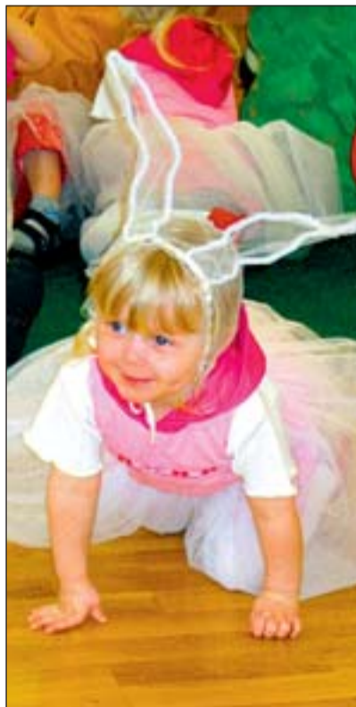
Peopäev tõi rõõmu kõigile.

Hiljem pidasid isad õpetajatega maha kavala sõjanõu, kuidas emadepäeva pidu pidada. Teadagi, et isadel on palju kohustusi, tähtsaid ülesandeid