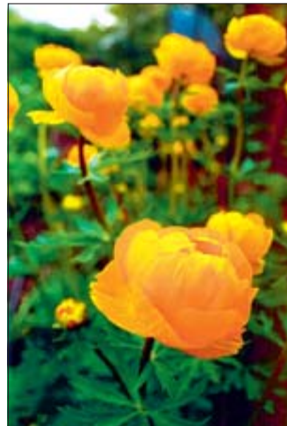
Kullerkupud.