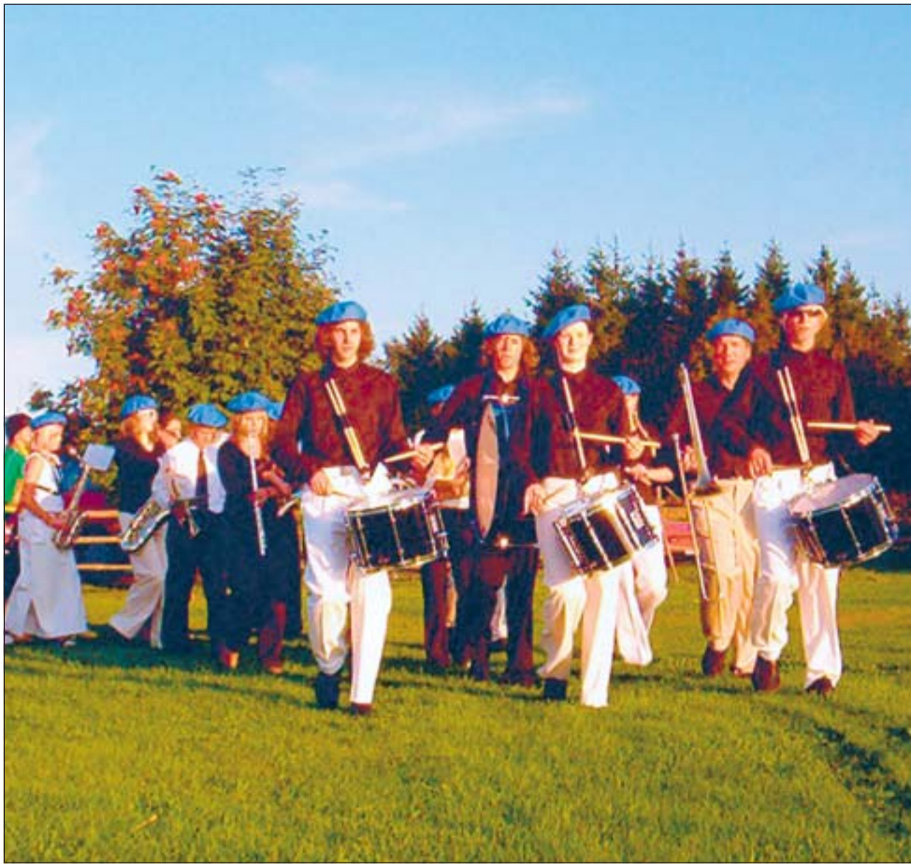
Kooliaasta avas muusikakooli paraadtrummide rühm.