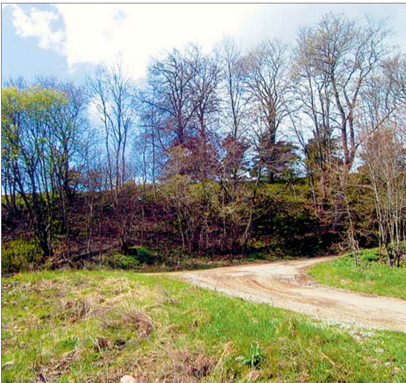
Tulevase Mäealuse kaitseala väärtuseks on mitmekesine maastik.

Söötis põllust liigirikka niidu saamiseks kulub ka regulaarse niitmise ja/või karjatamisega aastaid, kuid tulemus peaks vaeva väärt olema. Ehkki kaitse-