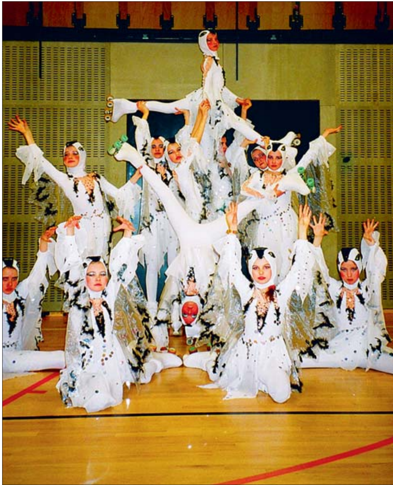
Viimsi laste kava «Kajakad» saavutas 14 võistkonna hulgas 9. koha.