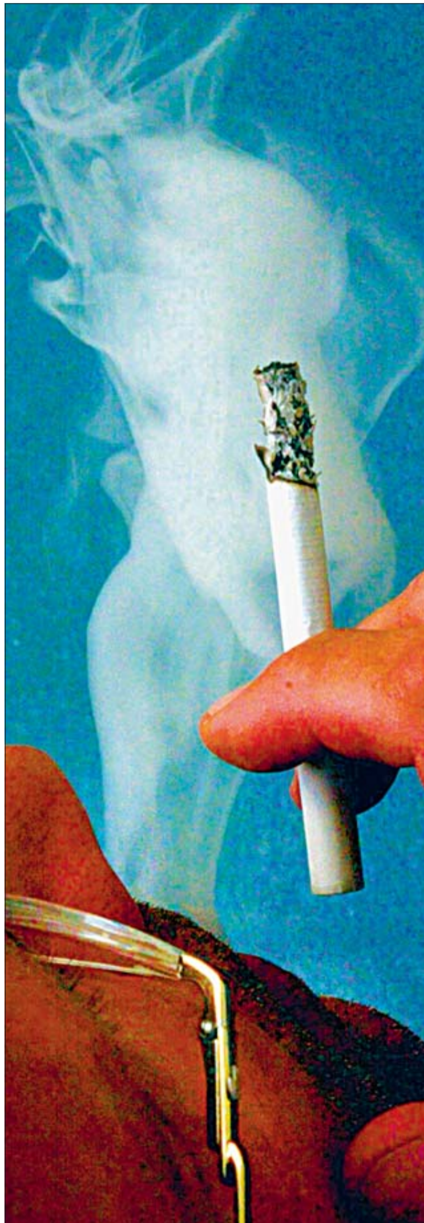
Tubakasuitsetamine võib viia ka ohtlikumate sõltuvusteni.

Täiskasvanute (kodus vanemate, koolis õpetajate, väljaspool kooli ringijuhitide, treenerite, noorsootöötajate) kohus on näha tubakaga seotud ohte ja neid lastele selgitada. Rahumeelsed, arutlevad ja mittesüüdistavad vestlused