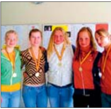
Võitjannaikond Kiired ja Vihased.