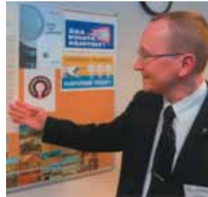
Are Veski Fortum Elekter AS juhatuse esimees:

«L eiame ka ise, et vanal heal makseraamatul olid oma eelised. Paraku nõuab praegune seadus arvete esitamist ning makseraamatu kasutamine on sellega vastuolus. Koduste elektritööde teenus oli meil mõni aasta tagasi olemas, kuid nõudlus selle järgi oli liialt väike. Küll aga saame me nõu anda selles suhtes, millistest elektritööde ettevõtetest vastavat teenust saab.»