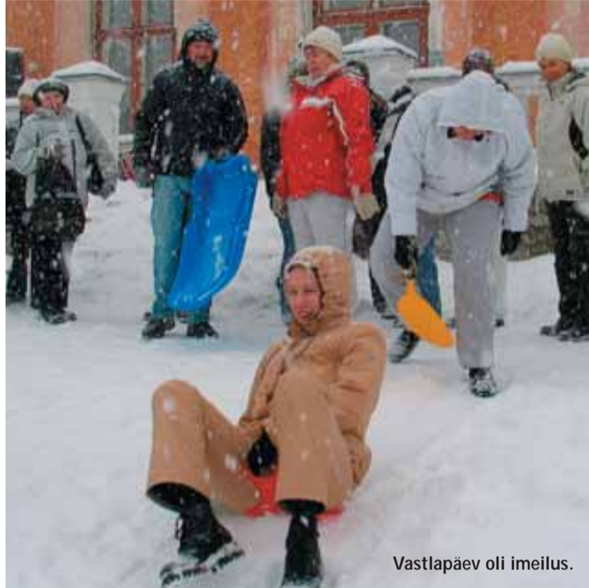
Vastlapäev oli imeilus.

otsas, ehkki lumeüritused veel mõnel pool jätkuvad. Sel aastal said vallaelanikud üle mitme aasta korraliku liuvälja Haabneeme, suusarajad Rohuneeme puhkealale ning Randvere tee äärde, sest jätkus nii pakast kui lund. Päike on aga juba vääramatu jõuga ametis ja peagi ei jää tehtust enam midagi järele. See-