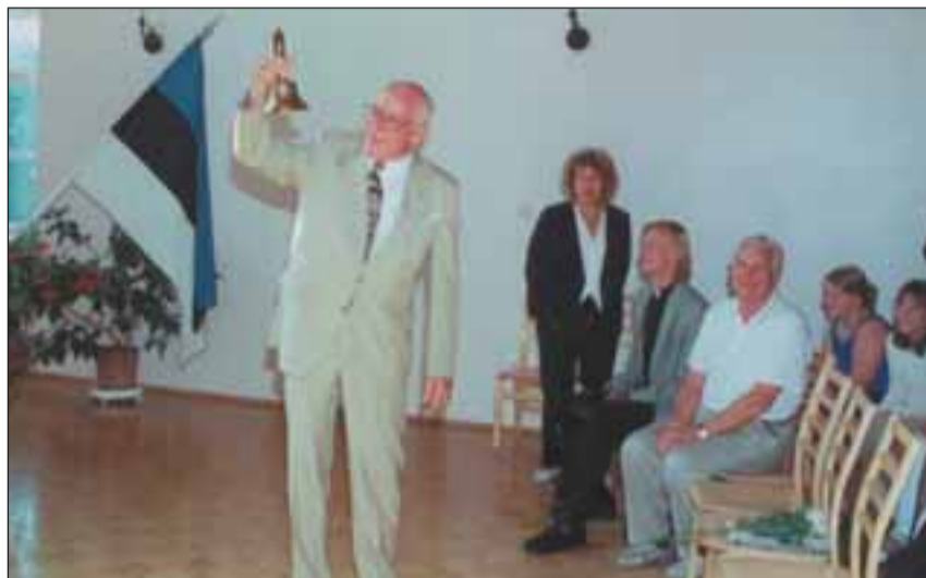
President Meri 1. septembril 2000 Püünsis.