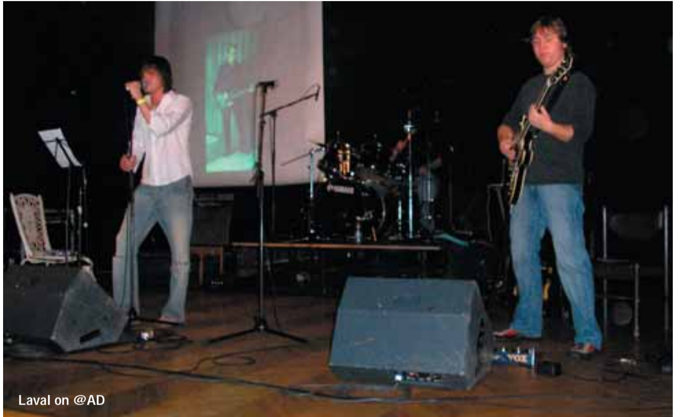
Laval on @AD