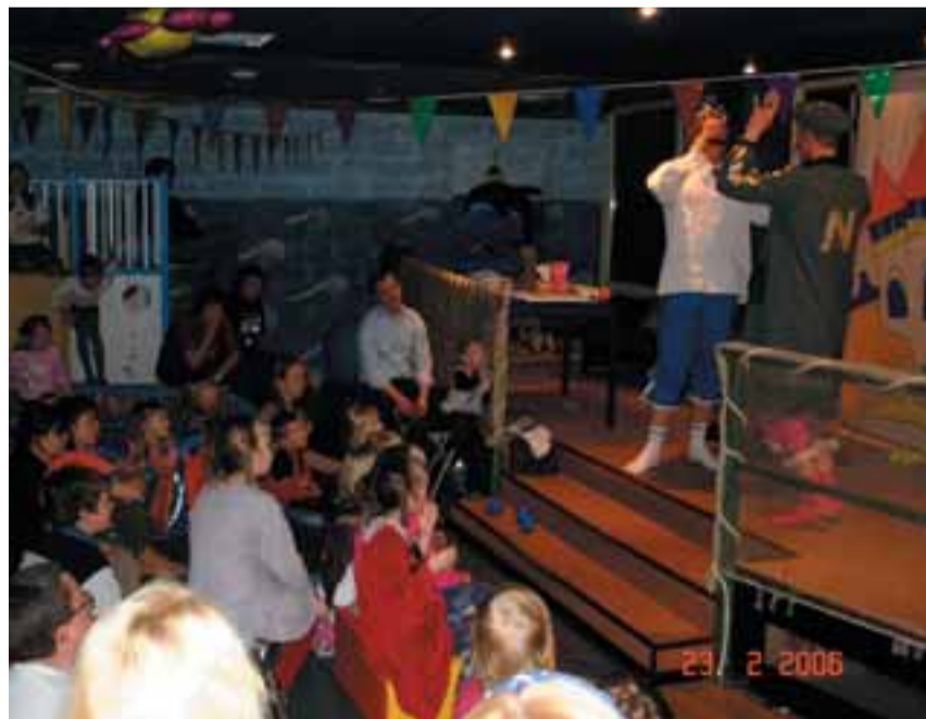
Mängutoas on ruumi ka teatritele.

Kaluri mängutoas juba kitsas ei hakka: see koosneb ühest suurest trallimise ruumist ja väikesest, vaiksemateks mängudeks mõeldud toakesest, kus toimuv on ka suurde ruumi näha. Laste tegemisi jälgima tulnud lapsevanemad saavad