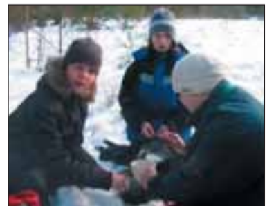
Toit valmis lõkkel katelokis.

AS Vichiunai Nordic käive oli mullu kolm miljonit krooni, ettevõttes töötas 48 inimest. Ettevõtte kuulub toiduainetööstuskontserni Vichiunai Grupp, kelle kuus tehast asuvad Eestis, Leedus ja Venemaal. Vichiunai Grupi kõikide ettevõtete tootajate arv on 4500, Eestis töötab grupi ettevõtetes eri paigus kokku 435 inimest. (VT)