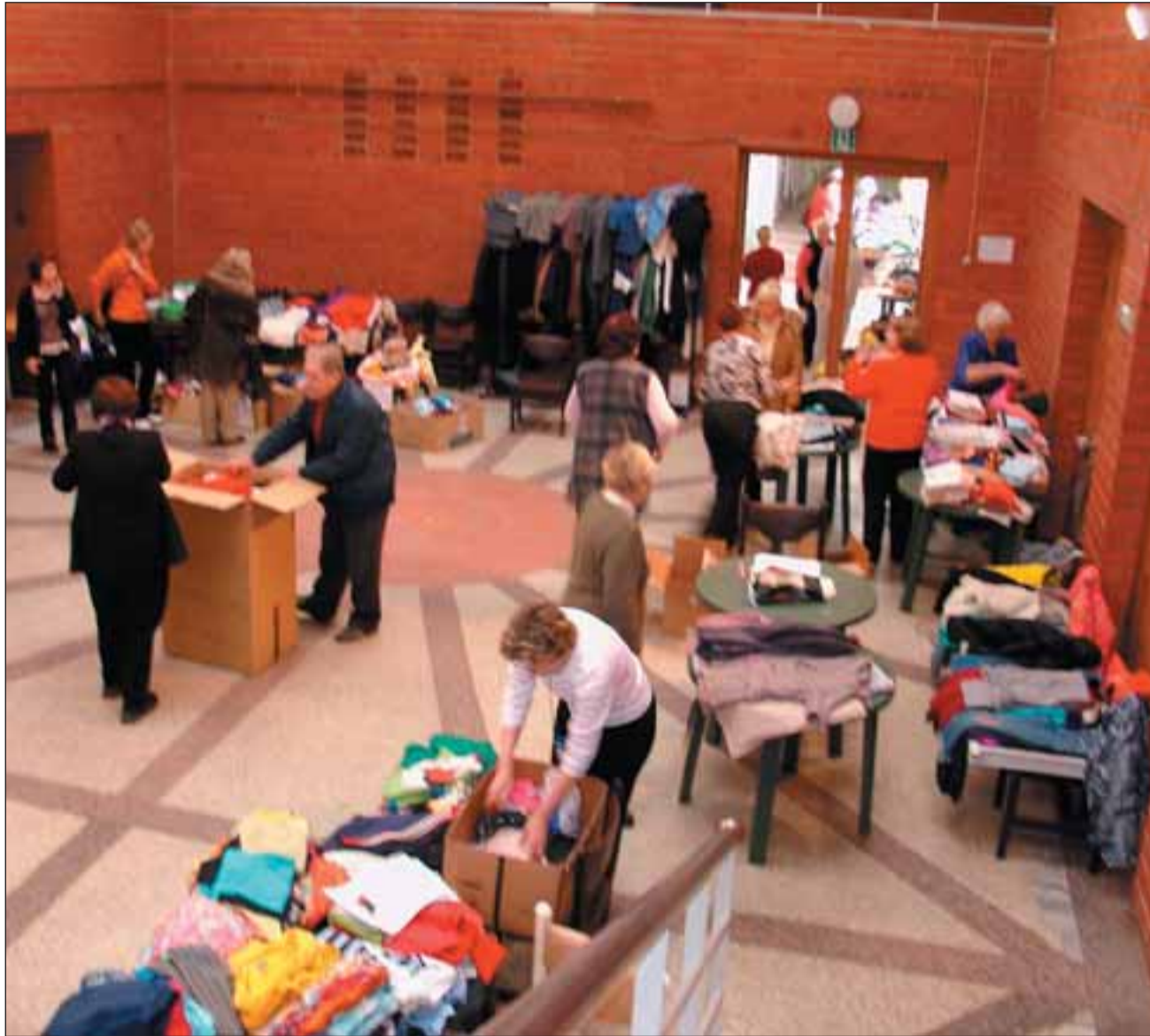
Kirbuturul käis vilgas askeldamine.

Kui rääkida teatud puudustest, siis võinuks soovida paremat tasakaalustatust pakkujate ja ostjate vahel. Eriti laste osas jää ostjate arv loodetust väheks. Kas oli põhjuseks ebapiisav reklaam (kuigi annetajateni see jõudis), uudne idee, mis vajab aega harjumiseks, väljakujunenud traditsiooni puudumine või koguni tõsiasi, et turule lisaks ei pakutud huvikeskuses seekord meelelahutust? Kõike seda jõuame veel arutada.