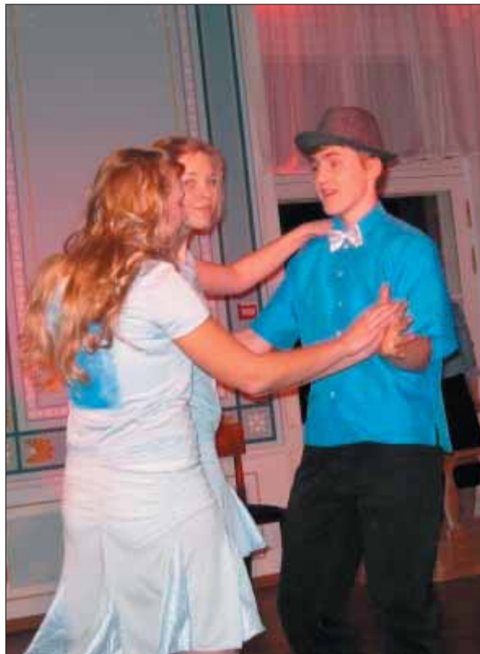
Näitlejad olid tasemel nii sõnas, laulus kui liikumises. Tavapäraselt toetasid kooliteatri etendust pillimänguga ka Viimsi muusikakooli noored viuldajad.

Kaluri tee 3, Haabneeme, Viimsi vald lauatelefon 601 6017 mobiilid 516 7543, 501 6705 e-post kaluri@kaluri.ee koduleht www.kaluri.ee