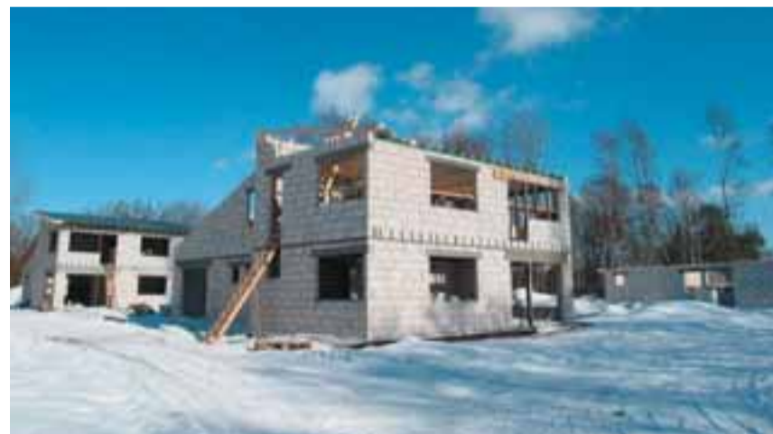
Ehitusloata krundile on kerkimas koguni kolm hoonet.

Väidetavalt on sama isikuga olnud sarnaseid probleeme ka varem. Varasemaid aegu mäletavate isikute sõnust võib selline nahhaalne käitumine olla tingitud kogemusest, kus eelmised võimuesindajad kaitsesid ühtede või teiste arendajate huve; teatakse isegi konkreetseid juhtumeid, kus võimulolijad