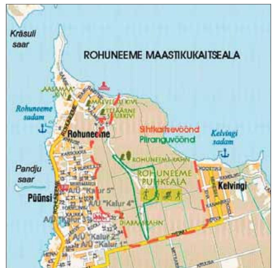
Tulevane maastikukaitseala säilitab Rohuneeme metsade liigirikkuse.