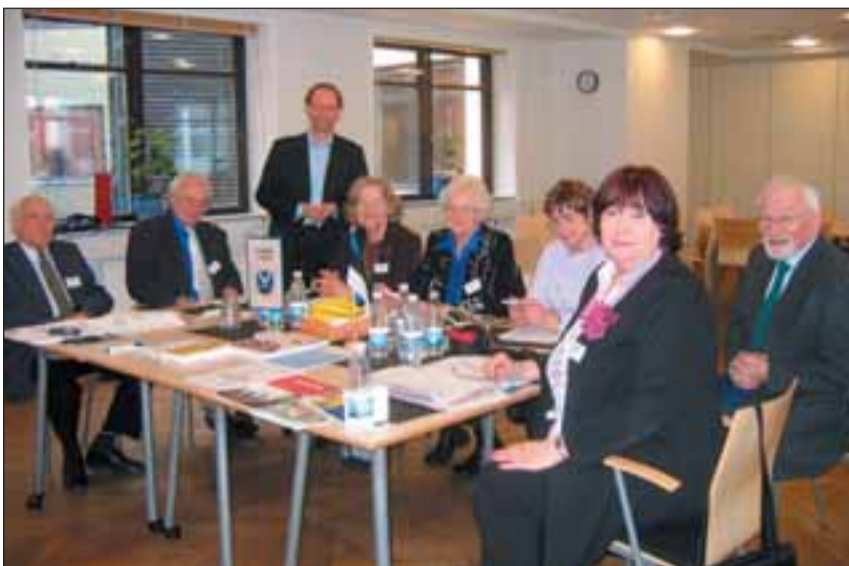
Viimsi Pensionäride Ühenduse juhatuse õppepäeval Kopenhaageni pensionäride organisatsioonis AeldreSagen.

taga üle 100 000. Praegune liikmete arv selles ühenduses on üle 472 000. Erinevus meie Eesti pensionäride organisatsioonist Eesti Pensionäride Ühenduse seisneb selles, et nende AeldreSagenisse võivad astuda toetajaliikmetena ka noored alates 18. eluaastast, kel on soovi eakaid abistada. Kõik liikmed võtavad endale ülesanded vabatahtlikult, neid ei jagata ülaltpoolt. Et organisatsioonil oleks autoriteeti, värvatakse sellesse Taanis tuntud inimesi nagu kuninganna Margarethe, populaarseid näitlejaid, lauljaid jt.