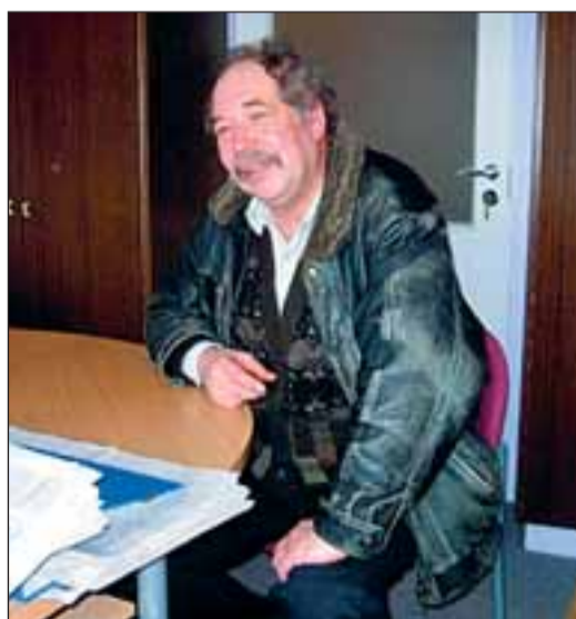
Avo Meister: Mett peaks sööma iga päev.

Meister soovib võtta supilusikatäis, lastel teelusikatäis mett kaks korda