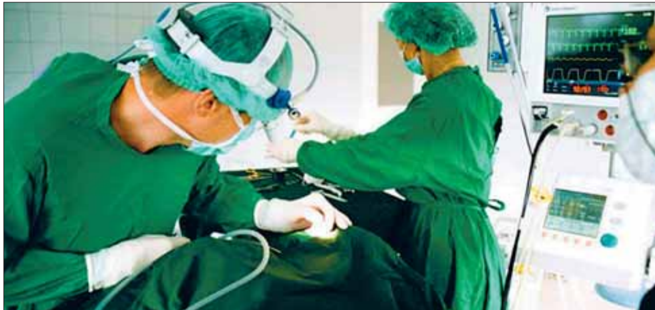
Tänapäeval täiustuvad operatsioonimeetodid pidevalt.

Veresoonte lupjumise tekke oht on suur kõrge vererõhu, kõrge kolesterooli, diabeedi ehk suhkurtõve, ülekaalulisuse ja kõrge kolesterooliga isikutel. Eraldi tuleb nimetada suitsetamist, kuna suitsetajatel on tunduvalt suurem veresoonte lupjumise – seega ka infarkti risk, olles nelja- kuni kuuekordne võrreldes mittesuitsetajatega. Üheks