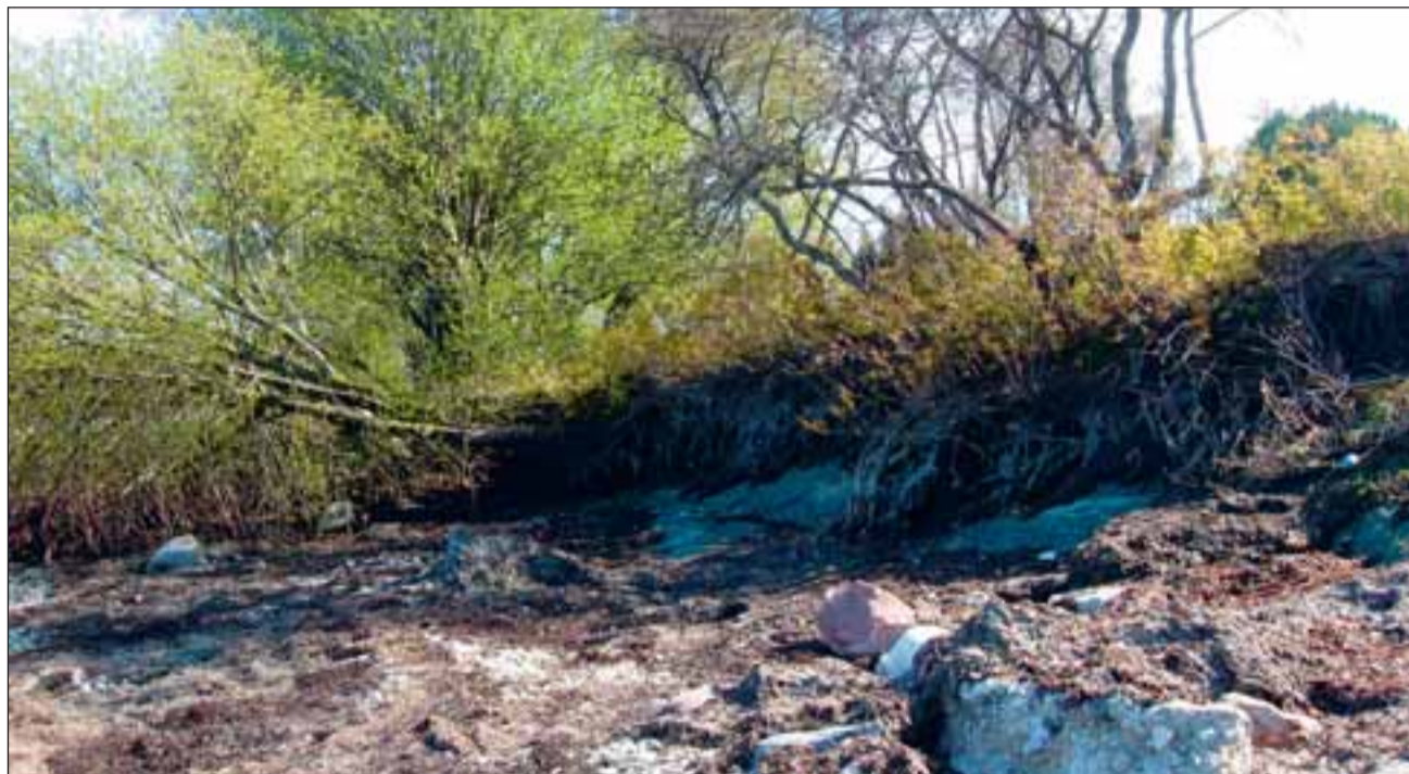
Ohud: kohati lahutab sõiduteed kaldavareringust vaid pool meetrit.