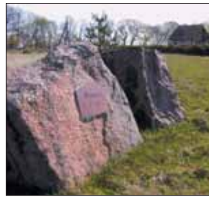
1991. aastal tähistati arvatav küla-ase mälestuskiviga.

Raua kasutuselevõtt muinasajal oli nii kolossaalne uuendus, et sai aluseks ajastu periodiseerimisele. Eesti esimene raudese – naaskel – on muide leitud siit-samast Viimsi lähedalt, Iru pronksiaja asulast. Rauda õpiti meil tootma naabermaade eeskujul. Kohalik rauasulatamine algas ligikaudu 2000 aasta eest ja soikus alles pärast Jüriöö ülestõusu. Rauda saadi kohalikust soomaagist ja jälgi rauasulatamisest on leida kõikjal üle Eesti. Vallutuseelseks ajaks oli rauatootmine tipus ja Eestist oli saanud metalli ekspordiv maa (arvatakse, et umbes pool toodangust veeti välja).