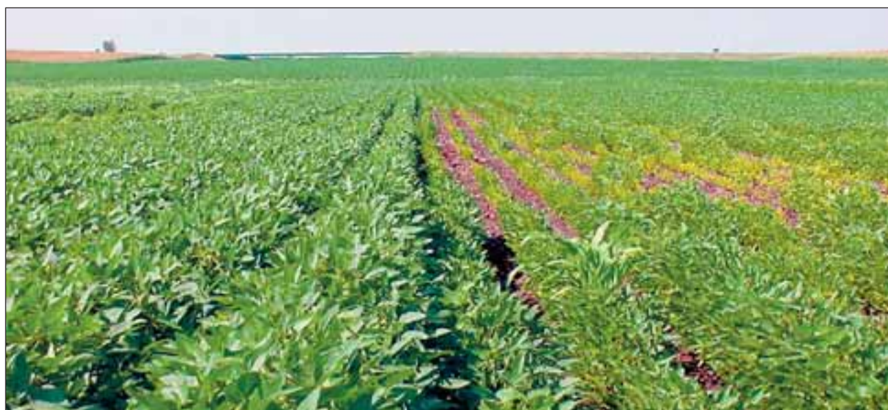
Plaanitava tehase tooraineks on sojaoad.