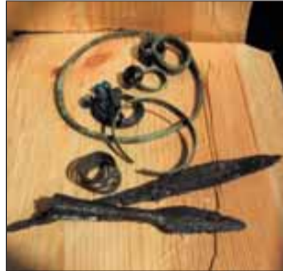
Siin nad on: eesti oma seppade tööd, mida rooste pole tuhande aastaga hävitada jõudnud.