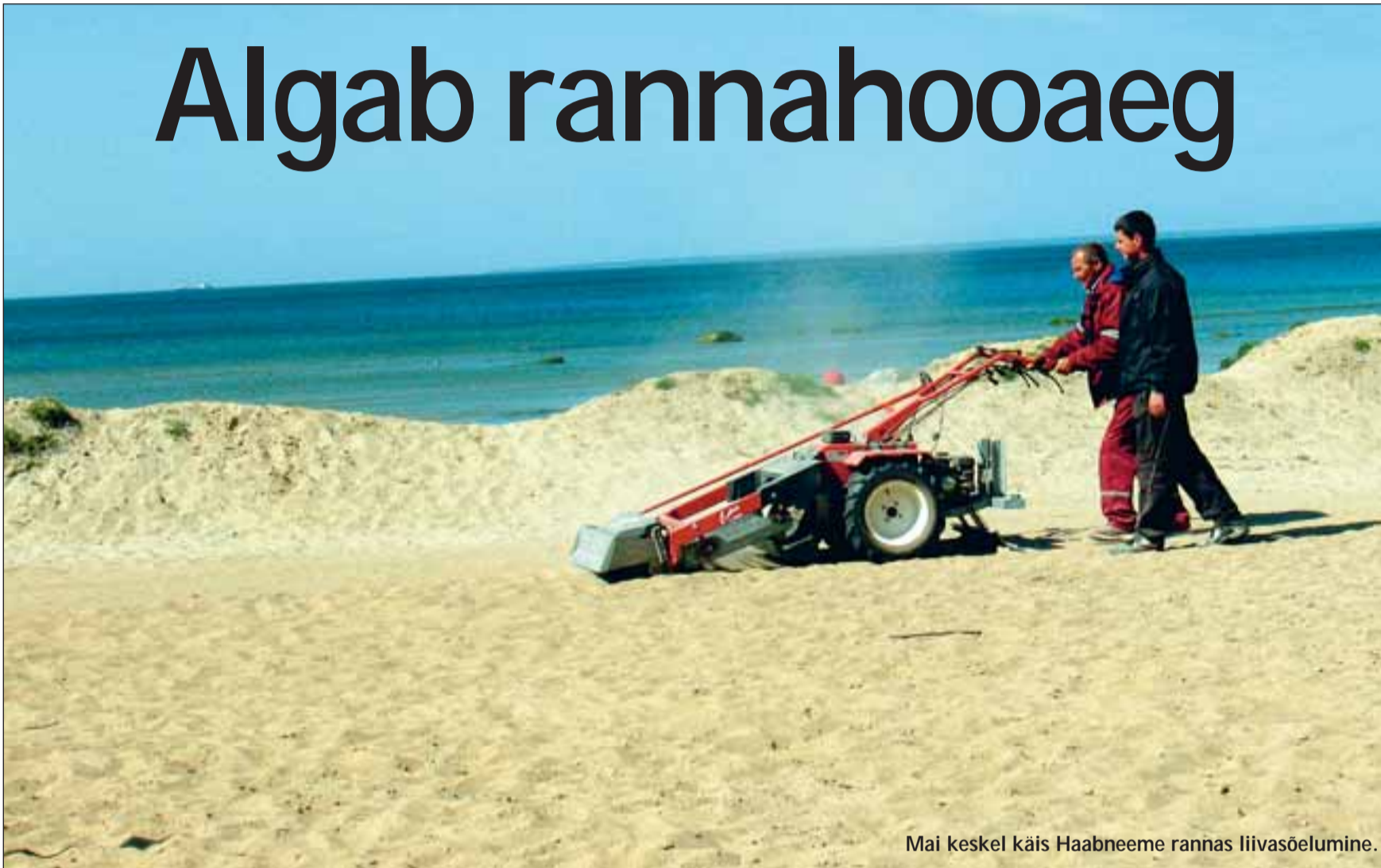
Mai keskel käis Haabneeme rannas liivasöelumine.