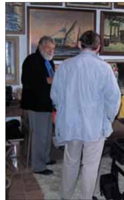
Enna Sirkel Jututuhinas Eriku ateljees.

Meie huvitajast kunstniku ja tema abikaasaga oli meeldiv ja sõbralik. Lah-kusime teadmise-ga, et varsti näeme tema maale Viimsi Muuseumides. Selleks tuleb aga veel pingutada, välja ehitada koduloomuuseumi pööning, kuhu kavat-seme tema maalinäituse välja panna.