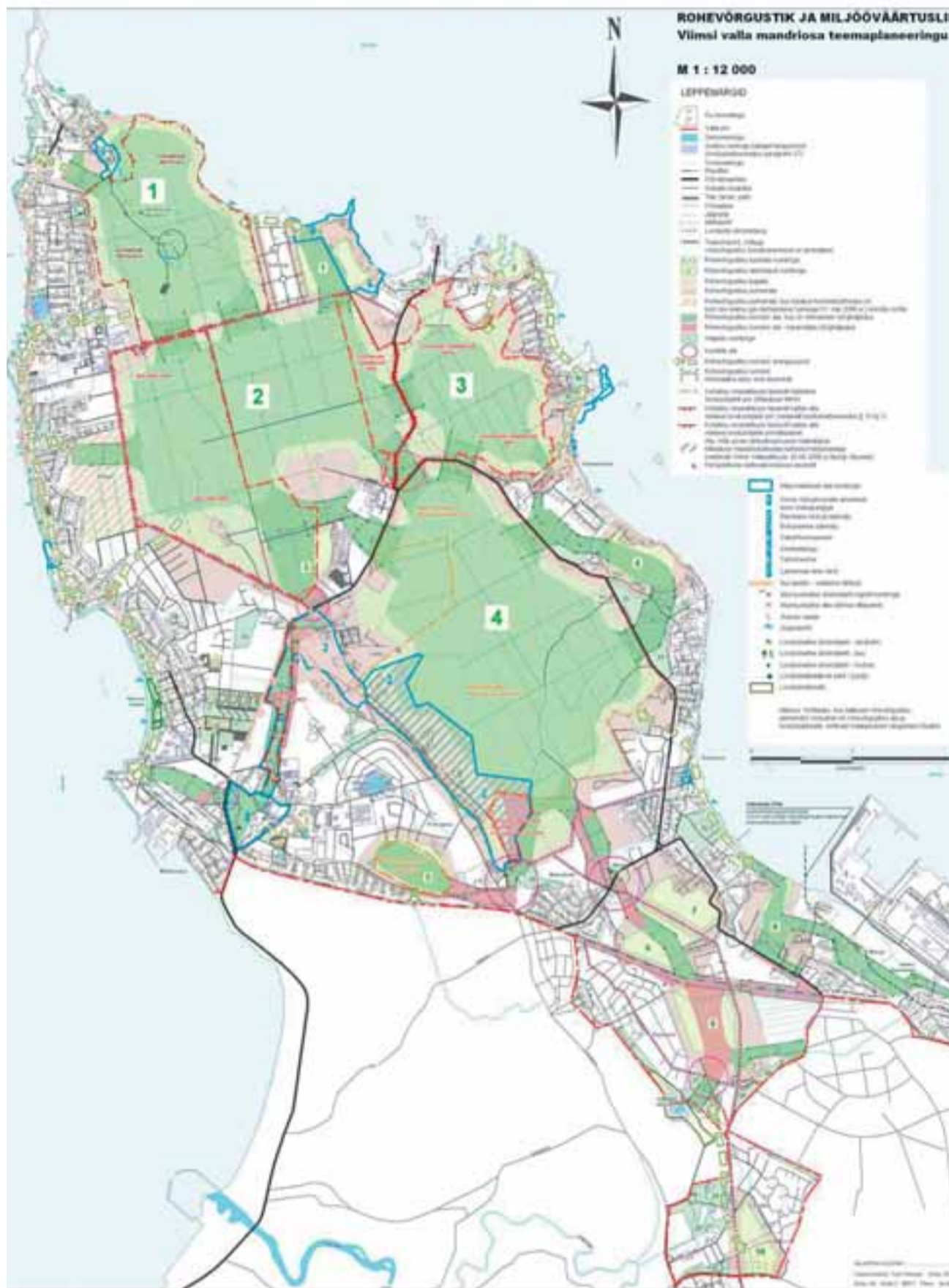
Teemaplaneeringu ettepanek – kaart seisuga 13.06.2006.

Välja selgitatud haljastute asukoha ja omaduste põhjal on edaspidi võimalik detailsemate planeeringute ja projektide tasemel taastada katkenud haljastu-