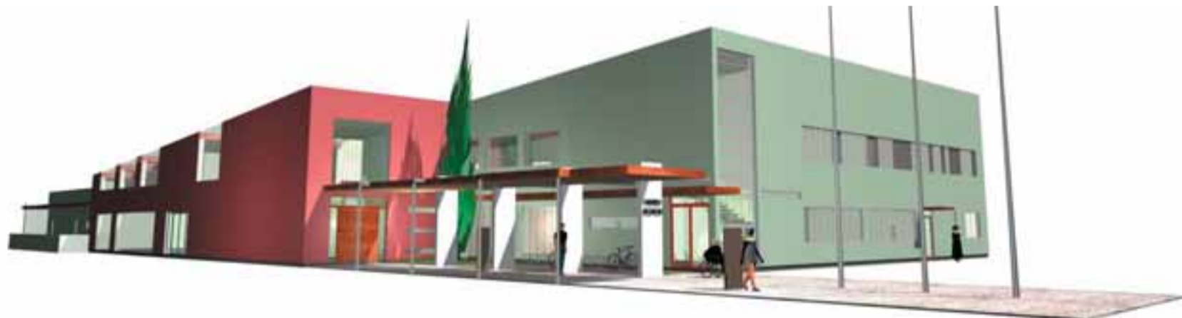
Randvere ja Kibuvitsa tee äärsele krundile kerkiva keskusehoone on projekteerinud arhitektuurbüroo Pluss OÜ.