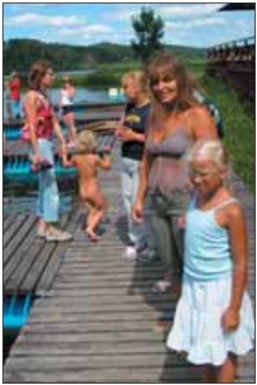
Järve ääres: saaks juba vette...