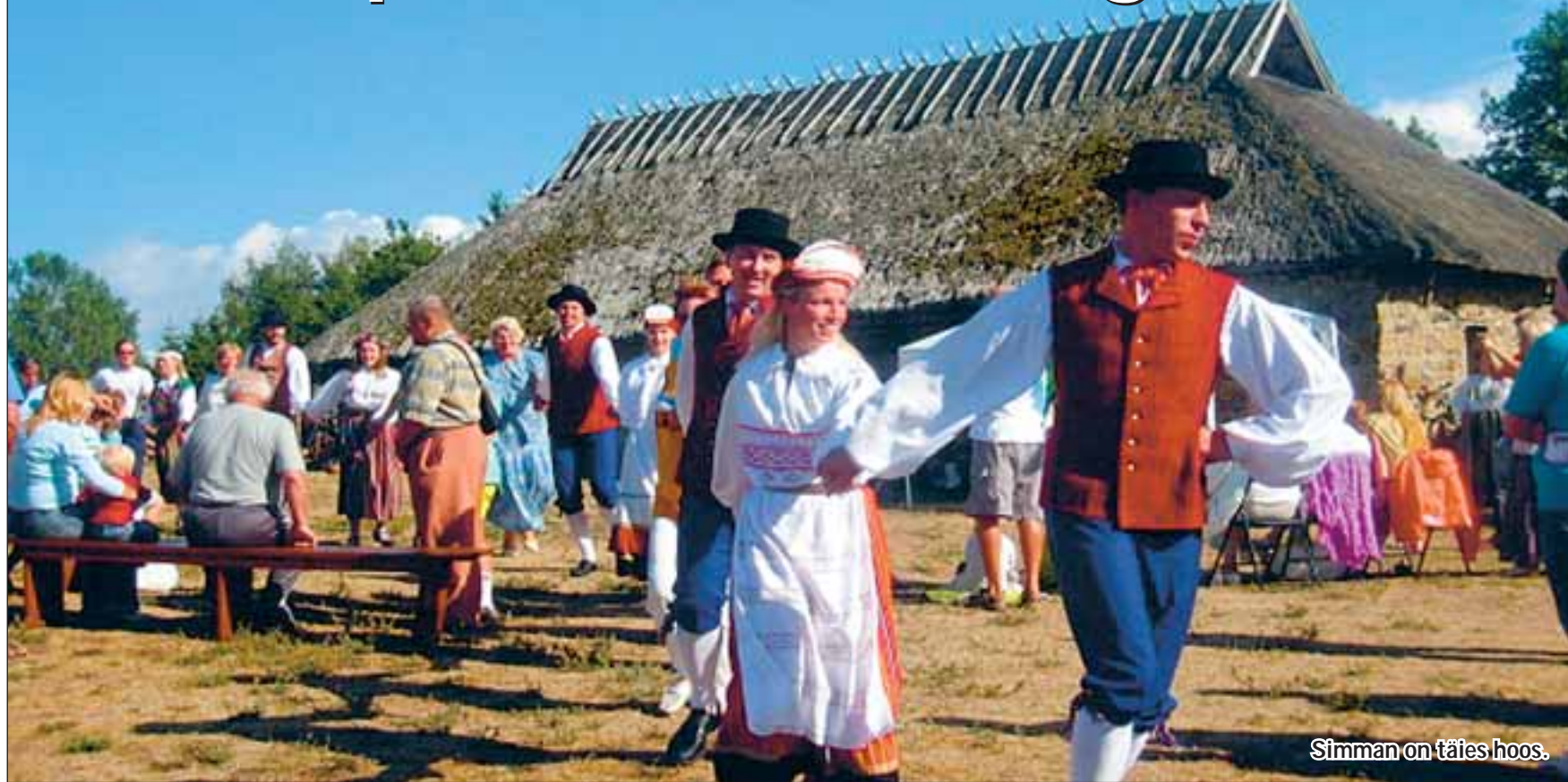
Simman on täies hoos.