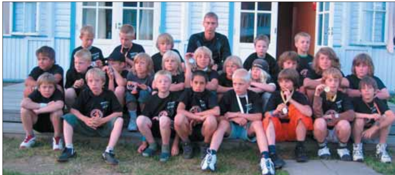
Korvpalliklubi Viimsi poisid Käsmu korvpallilaagris.

Suve alguses toimusid Eesti meistrivõistlused kõige noorematele korvpallipoistele ja -tüdrukutele. 1995. a sündinud poisid võtsid üksteiselt mõõtu Haapsalus makrorokorpalli ning 1996. a sündinud poisid Tallinnas mikrorokorpalli festivalil.