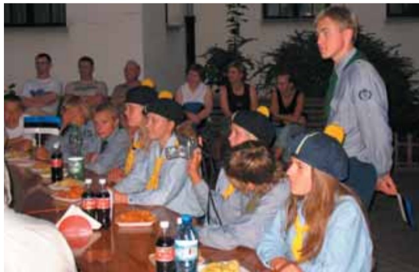
Noorkotkaste ja kodutütarde reisi toetasid vastuvõtjad ja vallavalitsus.