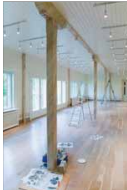
Saali sambad jätvavad mulje, nagu oleksid need marmorist.