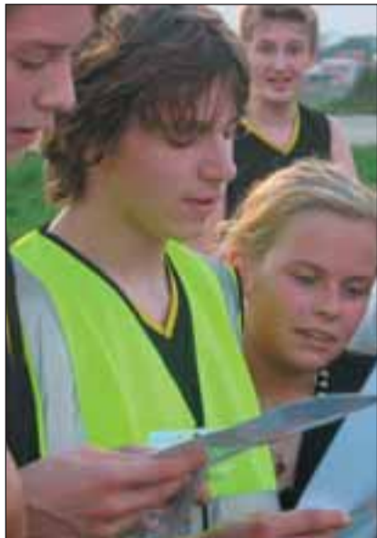
Viimsi mälestuskivi juures tuli laulda esimene salm laulust «Viimsi valss».