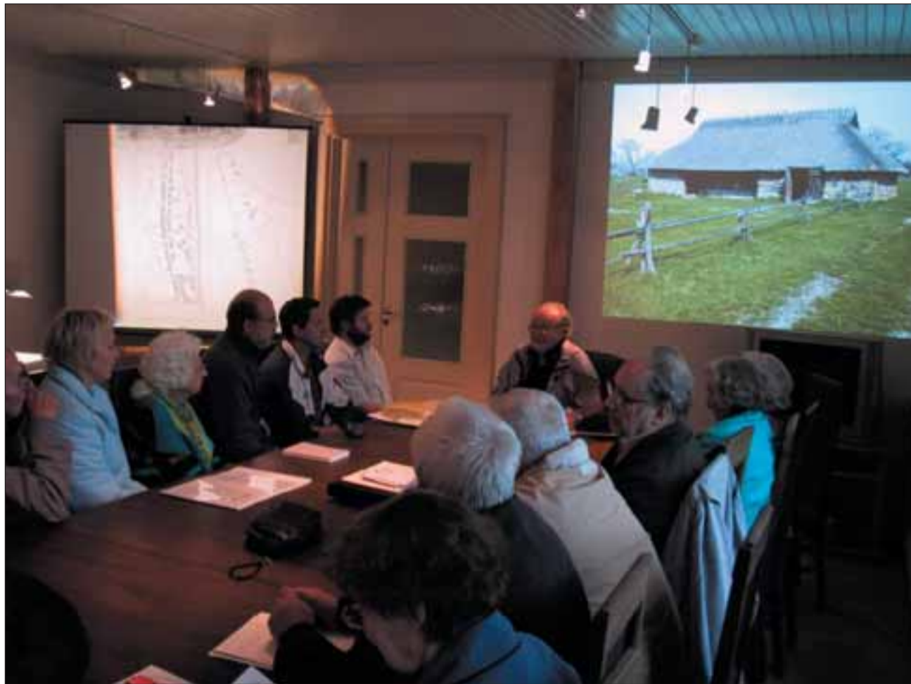
Viimsi koduloohuvilised on aktiivsed – ka novembris ja detsembris on oodata mitmeid huvitavaid üritusi.

16. sajandi esimesel veerandil hakkas senine rannikuala ja saarte Rootsi asustus segunema sisemaa poolt tulnud eestlastega. Kõige viimased rannarootslaste asustusala olid saared. Nii näiteks tegutses rootsikeelne kool Naissaarel veel enne II maailmasõda ning seda kooli toetas rahaliselt ka Rootsi riik. 1934. aasta rahvaloenduse andmetel elas Eestis umbes 7600 rootslast, nende hulgas Naissaarel 155 rootslast. Aastatel 1943-1944 siirdus enamik eestirootslasi elama Rootsi. Kunagiste siserändajate Eestis elavatest järeltulijatest peab end täna-