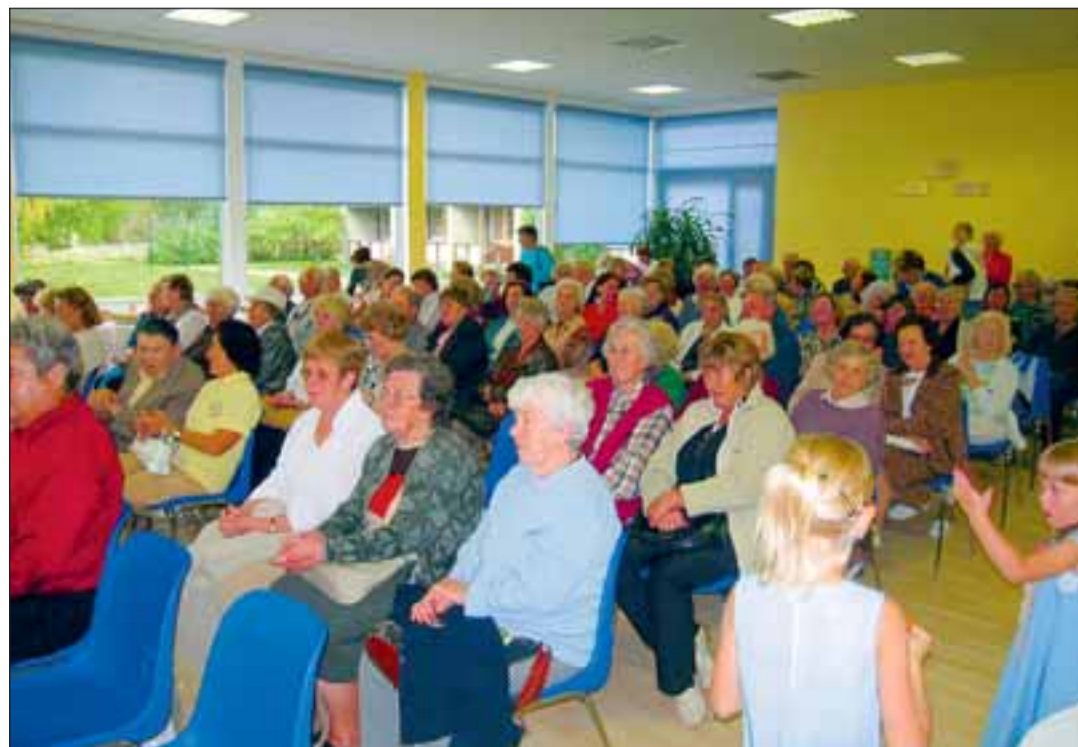
Maikus asutati MTÜ Viimsi Päevakeskus. Pildil hetk päevakeskuse avamiselt. Keskusest on eakatele saamas menukas kooskäimise ja koostegutsemise koht.