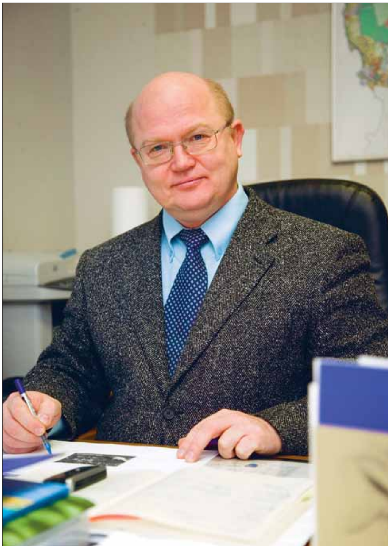
Vallavanem peab selle aasta olulisemateks sündmusteks Viimsi kooli avamist ning Randvere lasteaia ja Viimsi Püha Jaakobi kiriku ehitamist.

häiritud uute elanike juurdetulekust, sest senine külaidüll hakkab kaduma. Sellest tulenevalt jagunevad kogukonnad külade kaupa üldiselt kaheks – endised ja uued. Külanemad ja külaseltsid on üks instrument, et ühisürituste ja -tegemiste kaudu külarahvast lähendada ja ühist kogukonnatunnet tekitada.