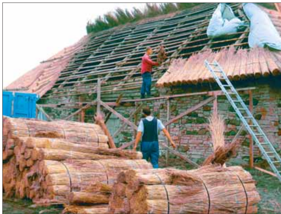
Vabaõhumuuseumi rehielamu sai augustis uue rookatus.