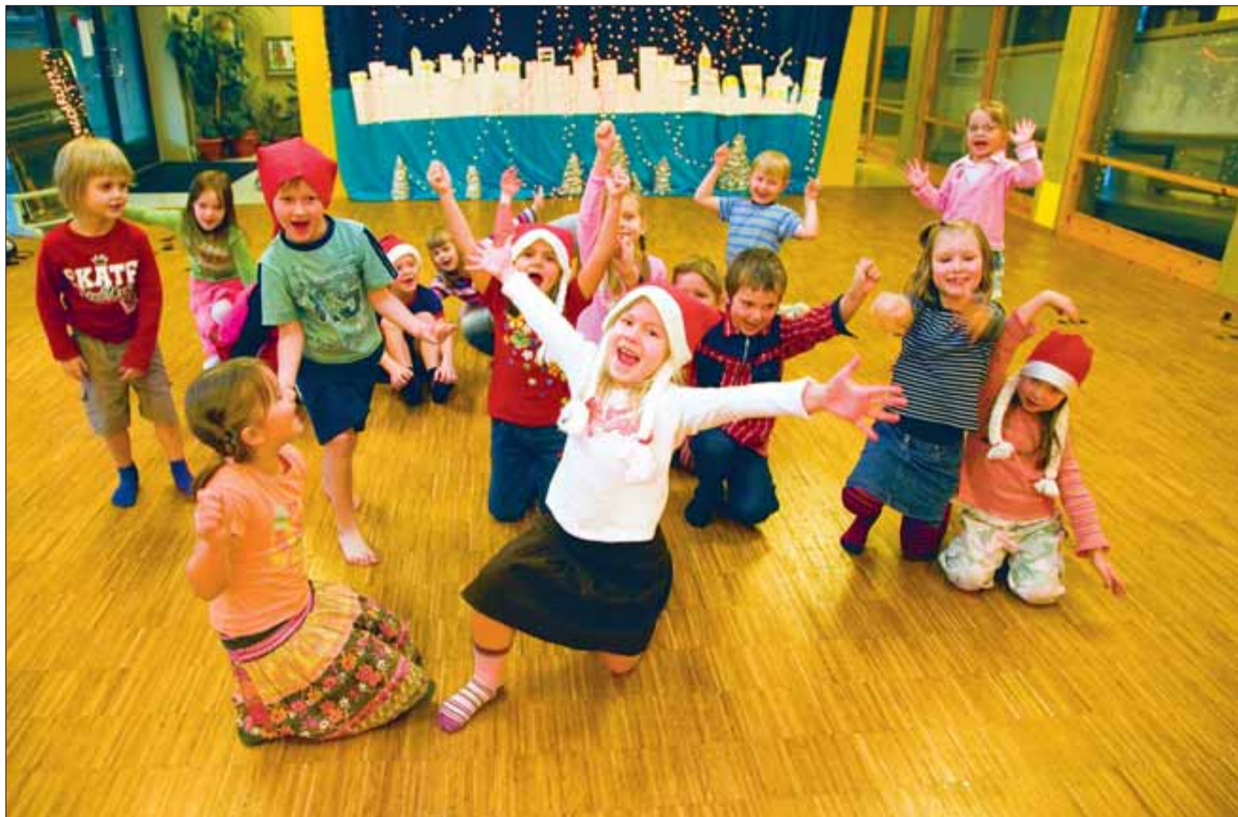
Pargi lasteaia lapsed naudivad siirast jõulurõõmu, teadmata midagi ostuhullusest ja ajanappusest.