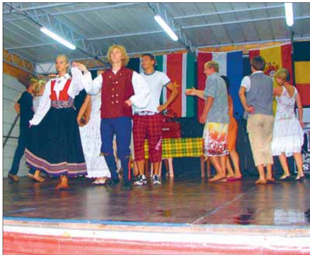
Martinique'il toimunud noorsoovahetuse tähtsündmuseks oli tantsufestival, kus iga riik esitas omi tantse või laule. Viimsilaste kaera-jaan pakkus rahvale kõige rohkem nalja.