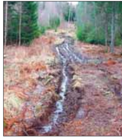
Tädu kõrgpinge sihil on ringi liikunud maasturid ja ATV-d, sellest jääb märk metsa aastateks.

Paar aastat tagasi loendasin kodulähedasel raiesmikul korraga 13 maasturit, hulga sekka oli eksinud ka mikrobus. Kui aga keset pimedat suunatakse mürina saatel metsa poolt koduaiale mitu paari valgusvihke, siis ehmatada ära küll. Nii on juhtunud vähe-