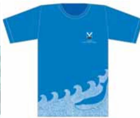
Valla sümbolikat võib kasutada ka nii – merekividest mosaiigina laotud vaalakujutis T-särkil.