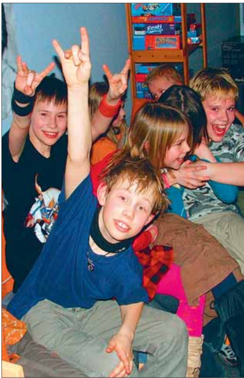
Üle poole noortekeskuse külalastajatest on poisid ja noormehed.

Eelmisel aastal alustasime lisaks talvise ja kevadise koolivaheaja üritustele ka suvise metsalaagri. Osalejaid polnud küll nii palju kui ootasime, aga esimese korra kohta siiski piisavalt – 24 last. Sel suvel proovime uuesti ja kind-