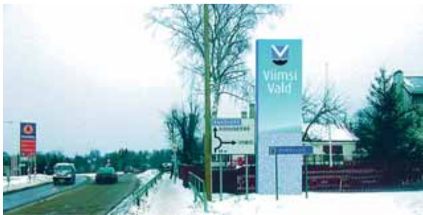
Selline võiks olla Viimsi valla piiritähis tulevikus. Kas see ka teoks saab, näitab aeg.

Uue stiiliraamatu autor, reklaamibüroo Dreamers, pakkus lisaks ametlikule tunnusgraafikale välja vähemametliku. Selle põhielemendiks on merekivid, millest võib mosaiigina laduda eri kujundeid. Üheks võimalikuks kujundiks on näiteks vaal. Dreamersi väljapakutud kavandis võiks seda kujundit kasutada näiteks T-särkidel.