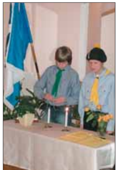
Sel aastal tähistasid kodutütred oma 75. aastapäeva.