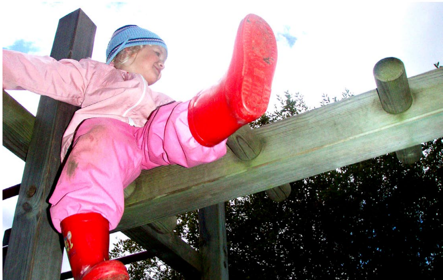
Pargi lasteaiatöötaja laste tehtud pilt.