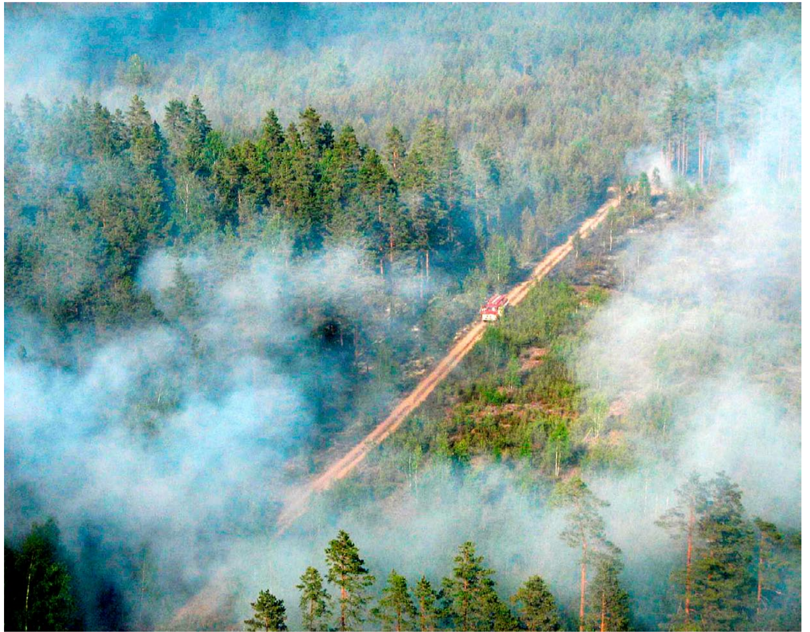
Teisel kohal riskimaatriksis on suurtulekahjud valla asumites, metsatulekahjud Viimsi poolsaarel ja Naissaarel.

Spetsiifiliste riskide põhilised allikad on epideemiad, terrorism, kiirgusõnnetused ning