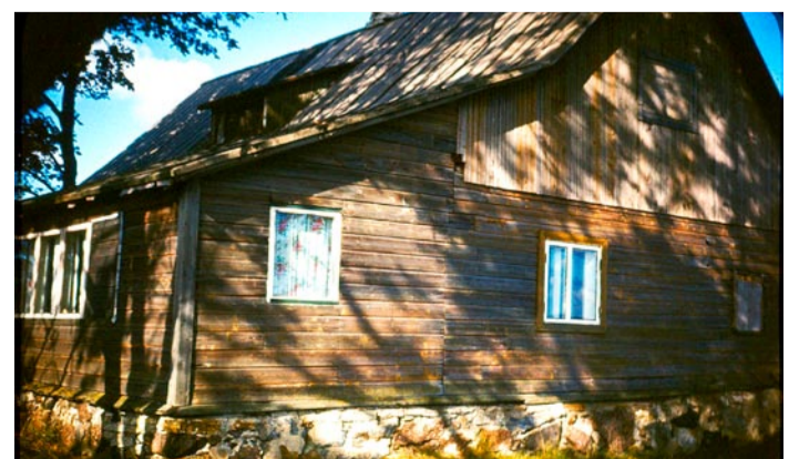
Vaade Kingu talule enne restaureerimist

Endiselt ootab SA Viimsi Muuseumid oma kogudesse fotosid, dokumente, paikkonnaga seotud brošüüre, plakateid, kohalike käsitöid ja etnograafilisi esemeid, kalapüügivahendeid, Kirovi kolhoosi ja Pirita sovhoosi temaatikat ja endisaegseid tekstiiliesemeid. Lisaks teeme üleskutse panna kirja mälestusi koolipõlvest, kolhoosiajast, kallakäigust, sovhoositööst, vaba aja veetmisest jm.