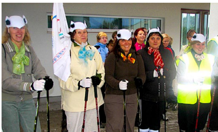
Piilupesa lasteaia võistkond sai parima kostüümi auhinna.