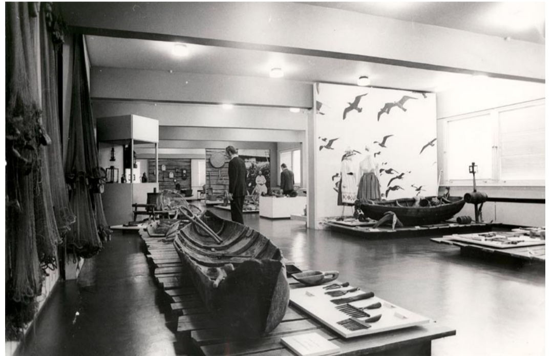
Kirovi muuseumi näituse „Rannarahvas enne ja nüüd” vaade

Kui 1990. aastal Kirovi muuseum kinni pandi, siis ladustati kogud kolhoosi peahoone koridoridesse ning kõrvalruumidesse. Viimsi vald sekkus alles 1992. aastal, kui hakati taotlema munitsipaalomandit ja 1993. aastal võeti muuseum üle. Vaatamata sellele ei läinud kõik suurte sekeldusteta. Kirovi muuseumi reorganiseerimise