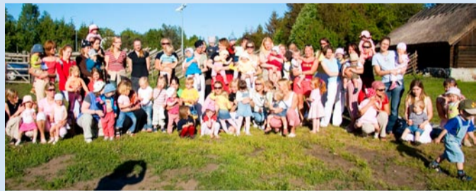
Muusikastudiolased perepiknikul sel kevadel