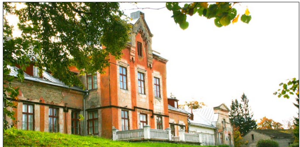
Nüüd: Viimsi mõisa peahoone tagakülg 2007. aastal.