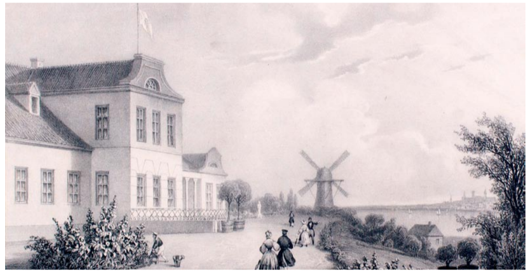
Enne: Viimsi mõisa vaade, Th. Gehlhaar, litograafia, 1830. aastad. Eesti kunstimuuseum.

Pildilt paistab ka suur Hollandi tüüpi mõisatülik, mis 1777. aastast alates Viimsi maastikku ilmestas ja kogu poolsaarerahva jaoks vilja jahvatas. Eesti vabariigi algusaastatel küttis Viimsis kirgi „tants tuuleveski ümber”, kus võitleti veski poolt ja vastu. Viimsi masinatarvitajate ühisuse kirjas öeldakse: „Kuni 1923. aastani, kus Viimsi mõis ühe tervikuna tegutses, oli mõisal oma tuuleveski, kus mitte ükski Viimsi mõisa, vaid kõik samanimelise valla vili ära jahvatatud sai.” Järgnevat karm kriitika veskit rentinud isiku aadressil. Pika vaidlemise ajal tegi aga ajahammas oma töö ja tekkis ka mitu uut jahvatuskohta. Vallavolikogu otsustaski lõpuks laguneva