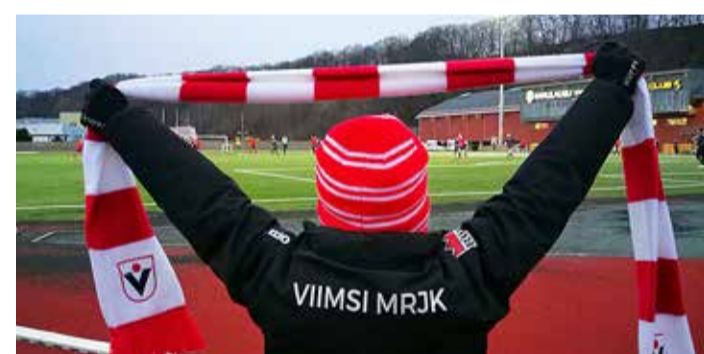
Teeme tribüünid punaseks!

Sel aastal on mängudele sisepääs tasuta ning esimestele kohalejõudnutele anname kasutada istumisaluse ja pleedi, et oleks mõnusalt soe. Samuti kositame teid sooja teega. Lisaks huvitavale mängule pakume kõigile võimalust osta Viimsi JK