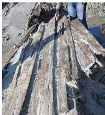
Sumpapaadi vrakk leiukohas.

jelaudade sisse olid uuristatud umbes 3 sentimeetri laiused ja 15–20 sentimeetri pikkused avad. Need ei olnud lõhutud, vaid tehtud korralikult. Kummalsiks teeb selle asjaolu, et selline paat ei püsi vee peal. Miks siis ikkagi need pilud? Siiani ei ole õnnestunud mingisugust analoogi ega teavet teistelt uurijatelt leida, ning ma pakun välja oma versiooni.