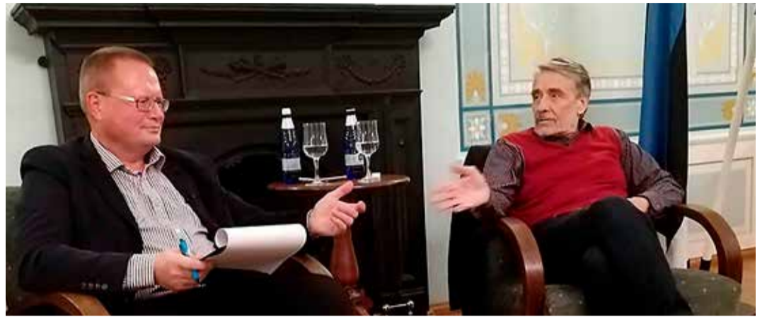
1. novembril 2018 oli Kogukonna Klubi vestlusõhtu külaliseks luuletaja Paul-Eerik Rummo.

Möödunud aastal said Kogukonna Klubi vestlusõhtud KÜSK-i toetusel videosalvestatud ja on järelvaadatavad veebis ( https://www.ev100.ee/et/vestlusohutute-sari-estluse-palgejoonest-viimasel-sajandil ). Kuna tänava KÜSK-il analoogset toetusmee-