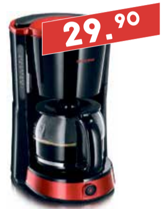
Kohvimasin Severin KA 4492