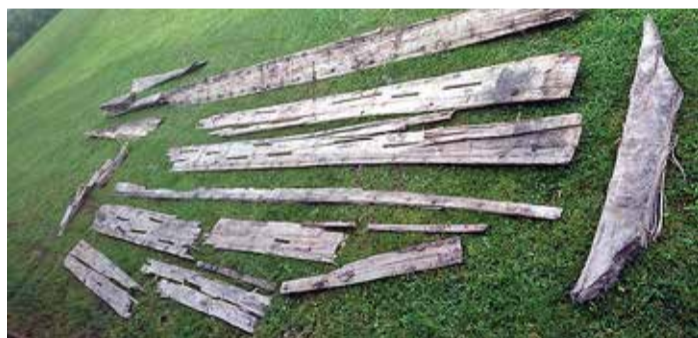
Väljakaevatud sumpapaadi tükid lahti võetuna.

Kõige põnevamaks teeb selle lei u hoopiski asjaolu, et kül-