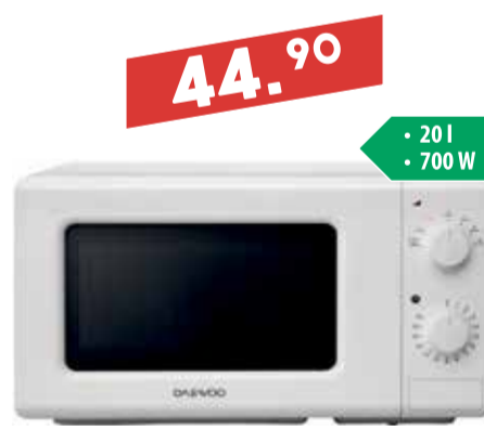
Mikrolaineahi Daewoo KOR-6617W