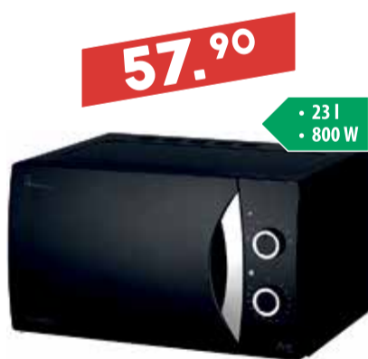
Mikrolaineahi Daewoo KOR-81F7B