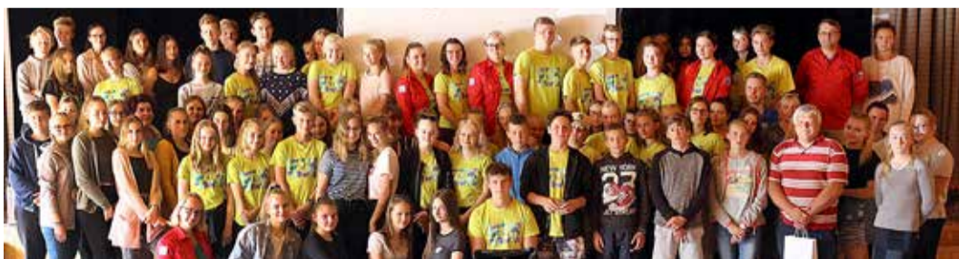
2018. aasta õpilasmalevlaste teise vahetuse grupipilt.

Sellel aastal võtab Viimsi õpilasmalev tööle rohkem noori kui varem. Oodatud on kuni 140 Viimsi valla noort vanuses 13–25 aastat. See võimalus tekkis tänu asjaolule, et lisaks heakorraldajatele pakuvad noortele tööd ka meie hallatavad asutused ja ettevõtted. Loodame jätkata koostööd ettevõtetega, kes on varem juba noortele tööd pakunud, aga samuti püüame leida Viimsi ettevõtete seast uusi koostööpartnereid.