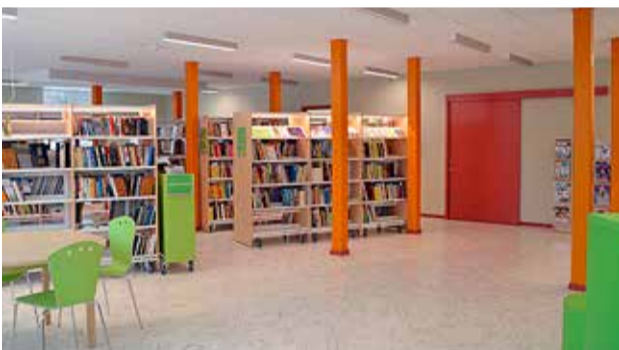
Püüsi vastavatud raamatukogu.