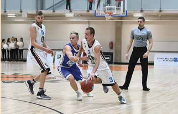
KK Viimsi/Noto mängija rünnakul.

Saku I liiga 18. voorus tuli KK Viimsi/Notole külla Tartu Kalev/Estiko, kellelt meeskondade esimeses, tartlaste koduväljakul peetud mängust, oli kaasa toodud 63:75 kaotus.