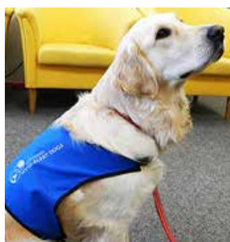
See foto hüpoakoerast jäi silma heategijatele.

eurot annetada hoopis Viimsi Ranna Lions klubi heategevuskontole, millega toetakse projekti Viimsi diabeedihaigetele lapsele hüpoakoera ehk diabeedi abikoera koolitamiseks.