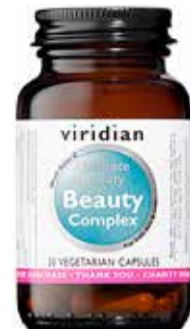
Ökoapteek Eliksiir soovivat.