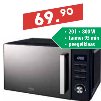
Mikrolaineahi Beko MOF 20110B