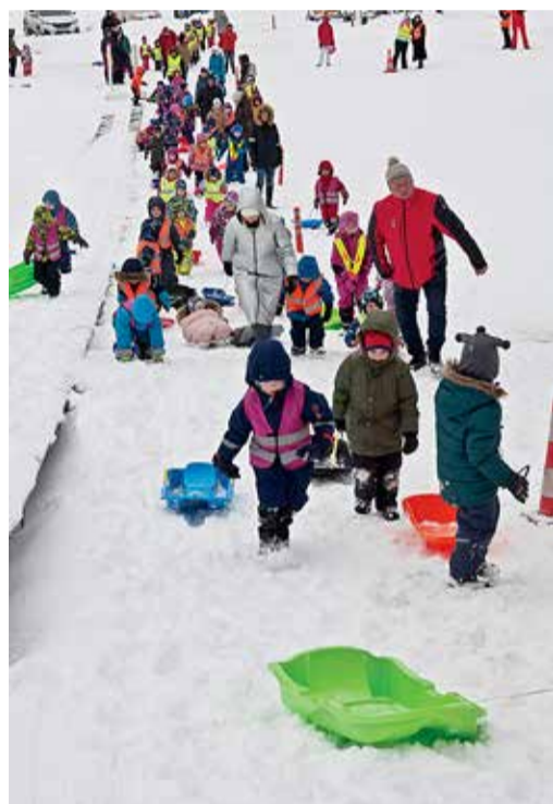
Lõbusal sammul mäest üles.