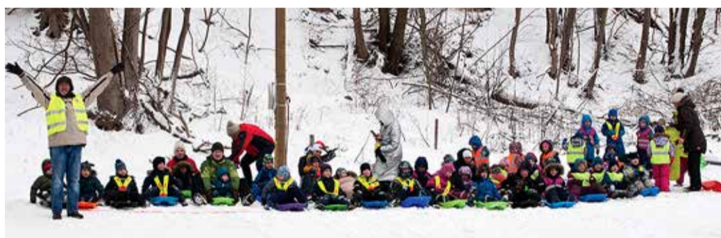
Tähelepanu! Valmis olla! Läks!