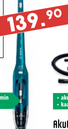
Akutolmuimeja turboharjaga Bosch BCH6Z000