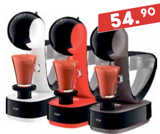
Kapselkohvimasin DeLonghi Dolce Gusto Infinissima EDG 260.W/260.R/260G