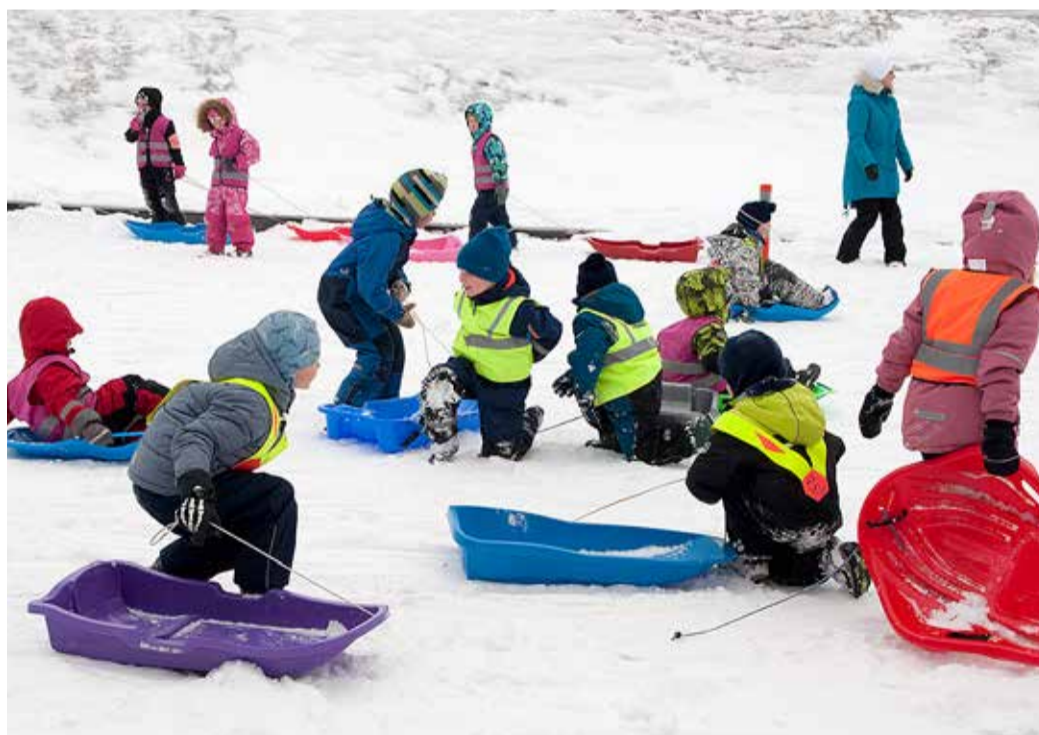
Vastlatrall täies hoos.

Teisipäeva öösel maha sadanud paks lumevaip oli kui kingitus vastlatralliks Vimkal. Viimsi huvikeskuse ja vallavalitsuse korraldatud liulaskmisele olid kokku tulnud Viimsi lasteaedade lapsed, koolilapsed, pered ja sõpruskonnad. Rõõmu ja lusti jagus kõigile.