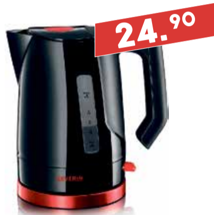
Veekeetja Severin WK 3392