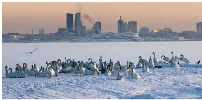
Seltskond kevadet ootamas.

Märtsi lõpuni saab Viimsi kooli raamatukogus vaadata Tiina Alveri loodusfotode näitust. Kunstniku elu ja loomingut tutvustab Lehte Jõemaa.