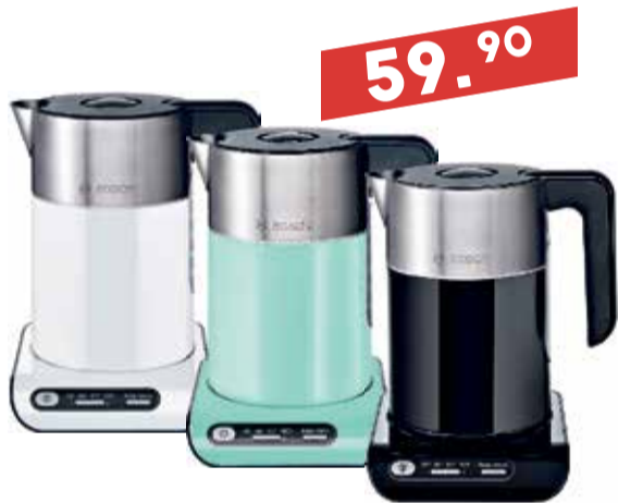
Veekeetja Bosch TWK 8611P/8612P/8613P