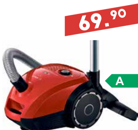
Tolmuimeja Bosch BGN 2A230