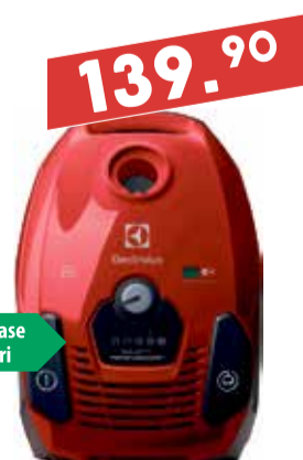
Tolmuimeja Electrolux ESP7ANIMAL