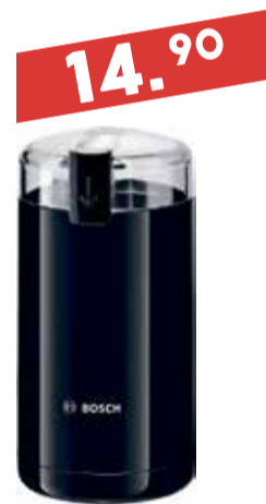
Kohviveski Bosch MKM 6003