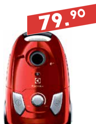
Tolmuimeja Electrolux EEG43WR