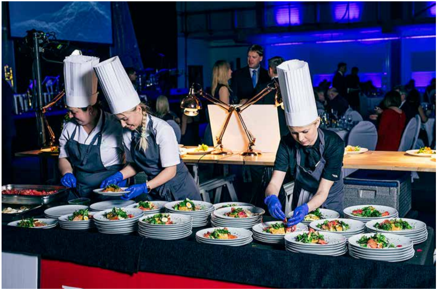
Resto KOBARa lahtine kalapirikukas oli peoõhtul tõsiselt konkurendiks teistele võistlejatele.

Restoran KOBAR asub Paadi tee 3, Viimsi Äritares. Oleme avatud E–L k 12–21, P k 12–19.