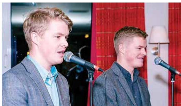
Vennad Piusid esinemas.

Mõeldud-tehtud! Kogutud 40 euro eest otsustati osta üks komplekt õppevahendeid Ida-Ukraina koolile. Lisaks koguti veel 20 eurot, et osta kaks komplekti õpikuid ja koolitarbeid MTÜ Mondo* kaudu. Aga ikka veel jäi raha üle ja nii otsustati 125