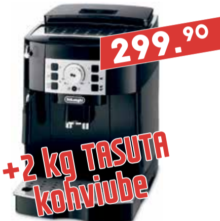
Täisautom. espressomasin DeLonghi ECAM 22.110B

ERIHINNAD VIIMSI KAUPLUSES* Miiduranna Konsumi hoones, Ranna tee 46a