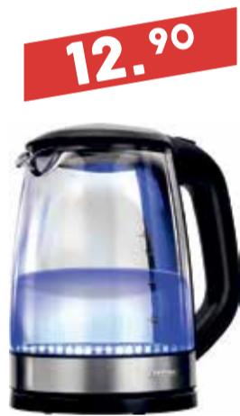
Veekeetja MPM MCZ-75M