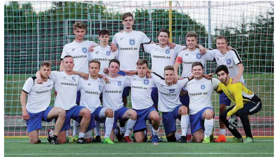
Jalgpalliklubi Viimsi Lõvid.

Kolmandal hooajal suutsid Viimsi Lõvid taas olla alagrupifaasis võitmatud ning lõpuks kaotati alles poolfinaalis hilisemale võitjale. Pärast kolman-