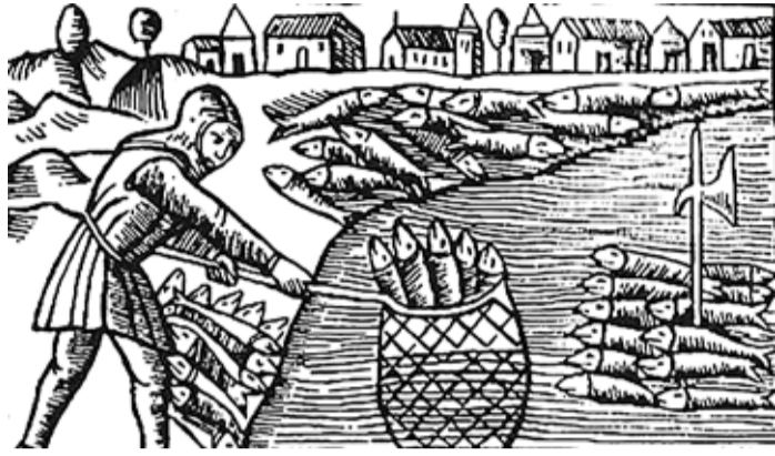
Pildil on kujutatud heeringapüüki.

Enne ristiuse saabumist püüti Viimsi poolsaare ümbruses kindlasti mingil määral kala, aga selle iseloom ei saanud olla kaubanduslik. Kala turustamine on keeruline eelkõige tema vähese säilivuse tõttu. Hajutatud tarbimise korral on ainus võimalik abivahend rohke sool. Sool oli aga kallid meretagune kaup ja nii ei olnud kalapüük elatusvahendina tulus. Hoopis kasulik oli kulutada energiat põl-