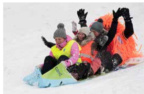
Pikima liu sai PVC-ga.