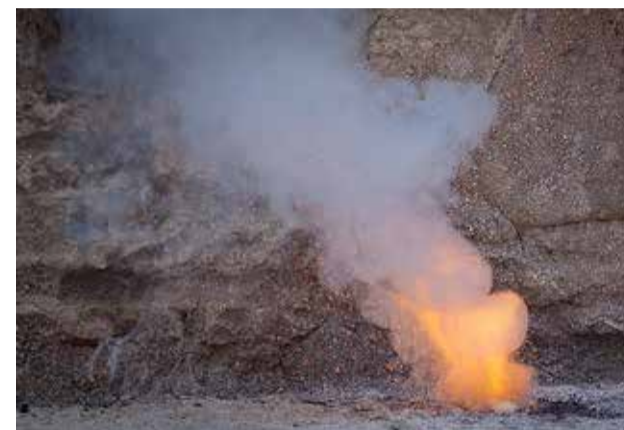
Halastuse vägi on kui tuld süütav säde.

Valel on lühikesed jalad – nii tõdeb meile kõigile tuntud vanasõna, mida ikka ju armastame kasutada, kui on avalikuks tulnud mõni väiksem või suurem vale. Aga millegipärast siis, kui neid valesid sepietakse, loodavad kõik, et varjatab ei tule kunagi avalikuks.