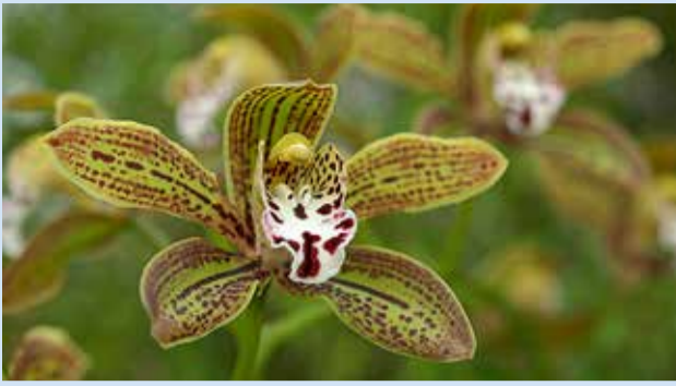
Orhidee Cymbidium .