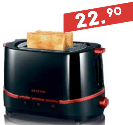
Röster Severin AT 2292