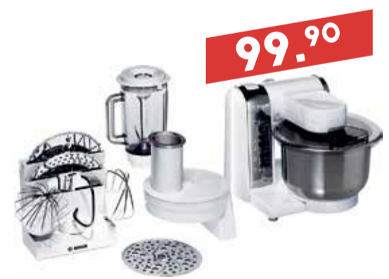
Köögikombain blenderiga Bosch MUM48CR1